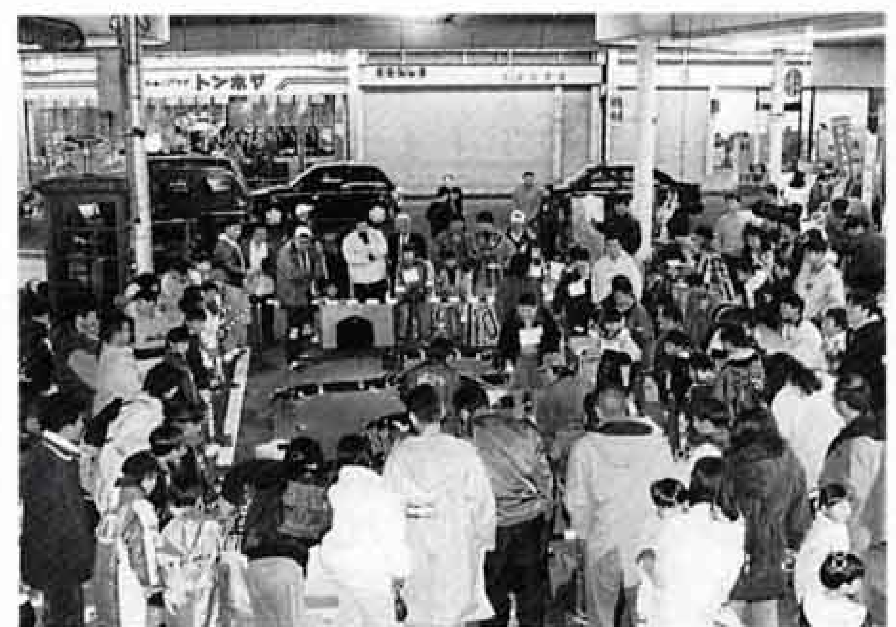
▲吉原どんどん（ナイトバザール）

●「吉原どんどん（ナイトバザール）」への支援、商店街の街路灯整備への助成、公設地方卸売市場の経営診断など