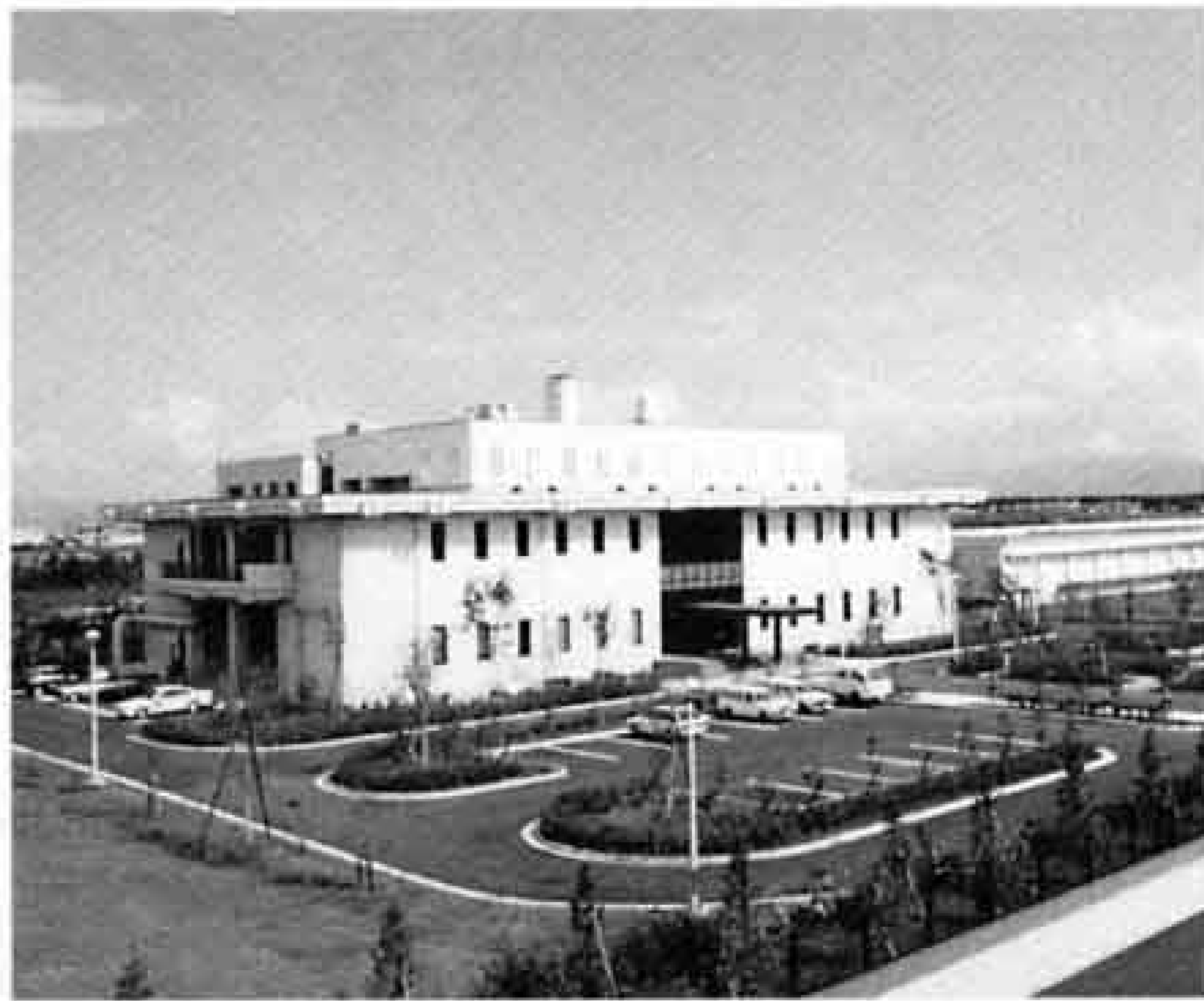
▲東部浄化センター

街路整備 第二東名自動車道のアクセス道路整備や、交通渋滞解消のための拡幅工事などを実施します。