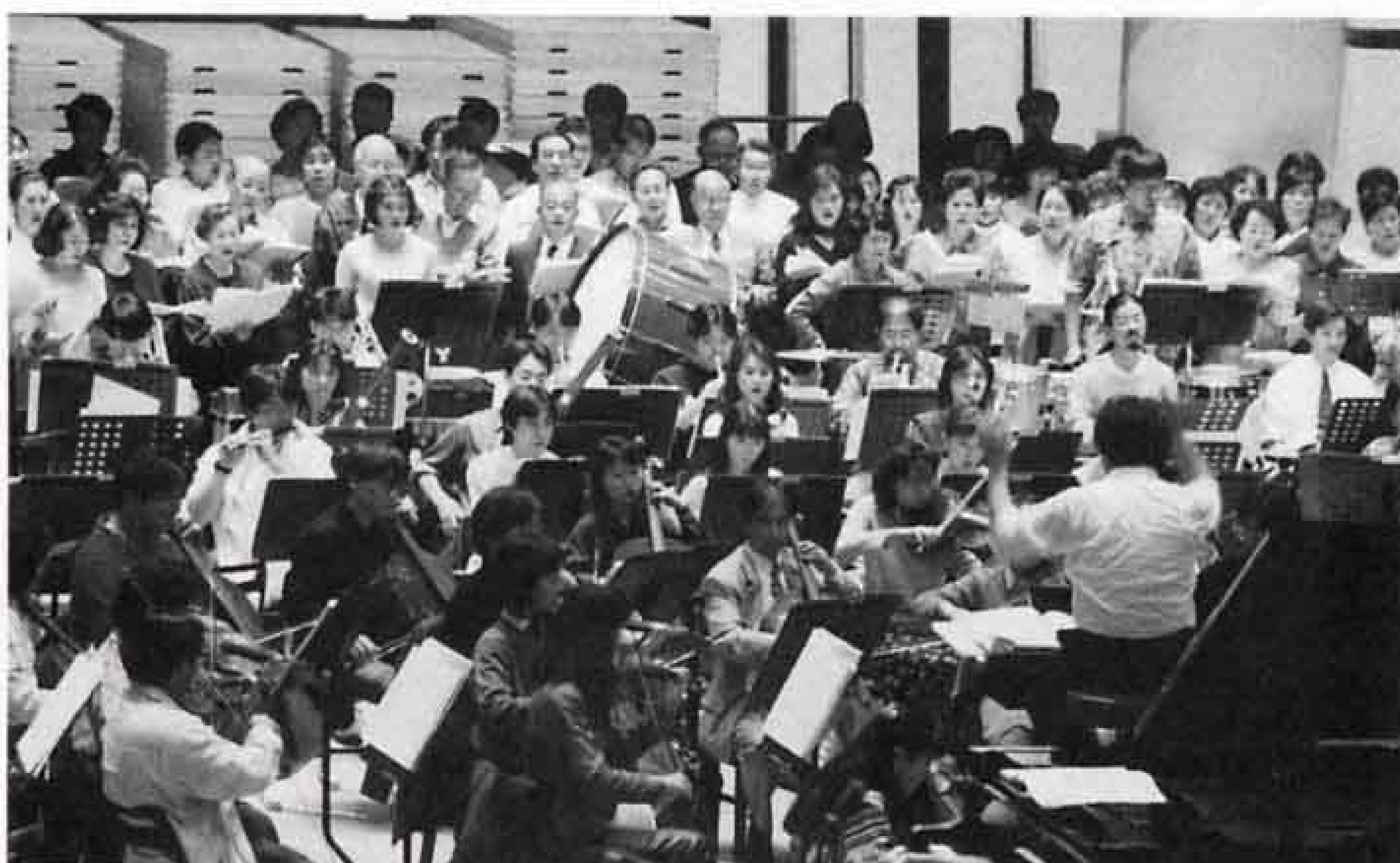
▲いよいよ練習も大詰め、オーケストラとの音合わせ（本番前日）