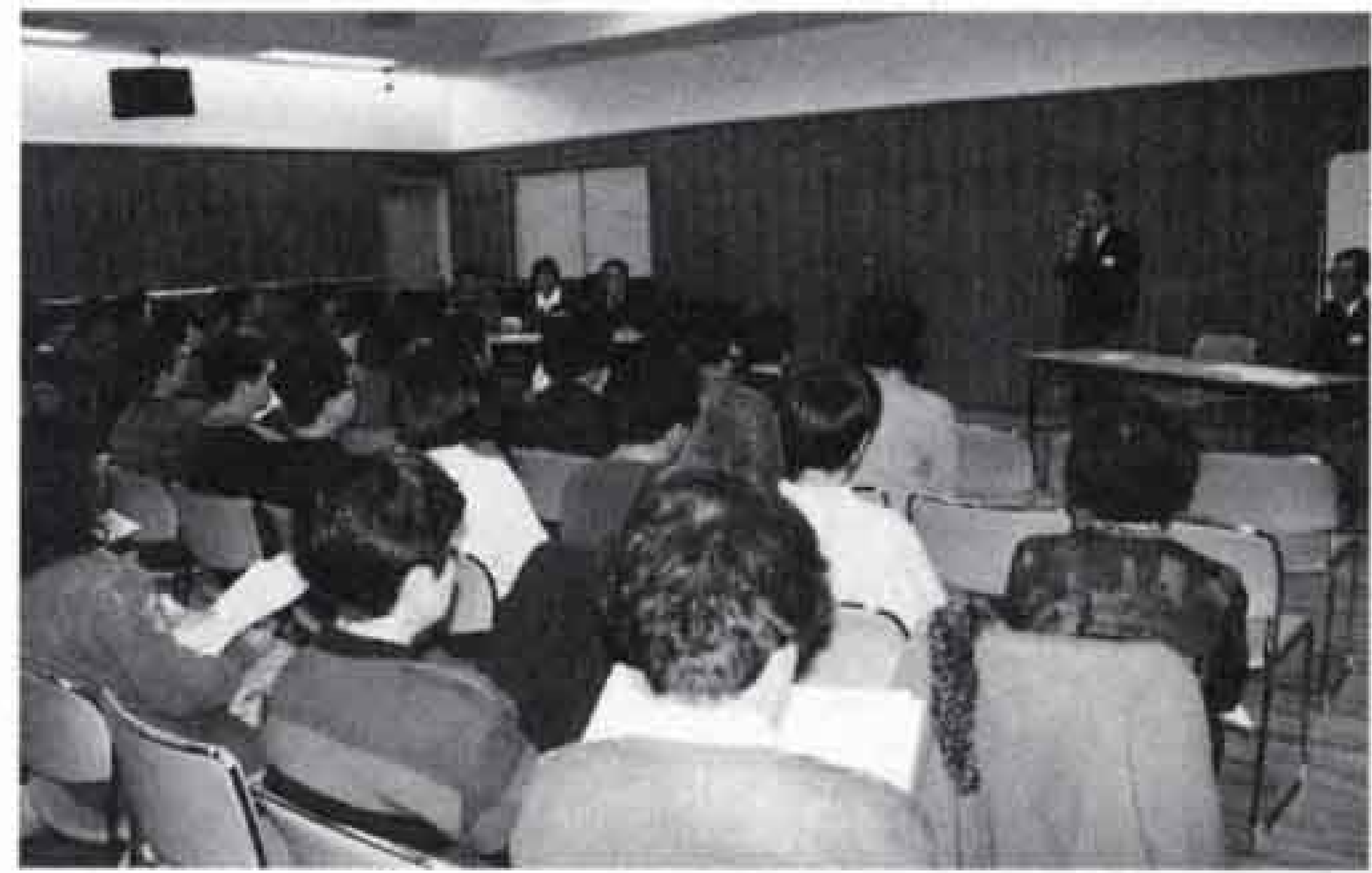
▲団員と指導者の初顔合わせ（1月）