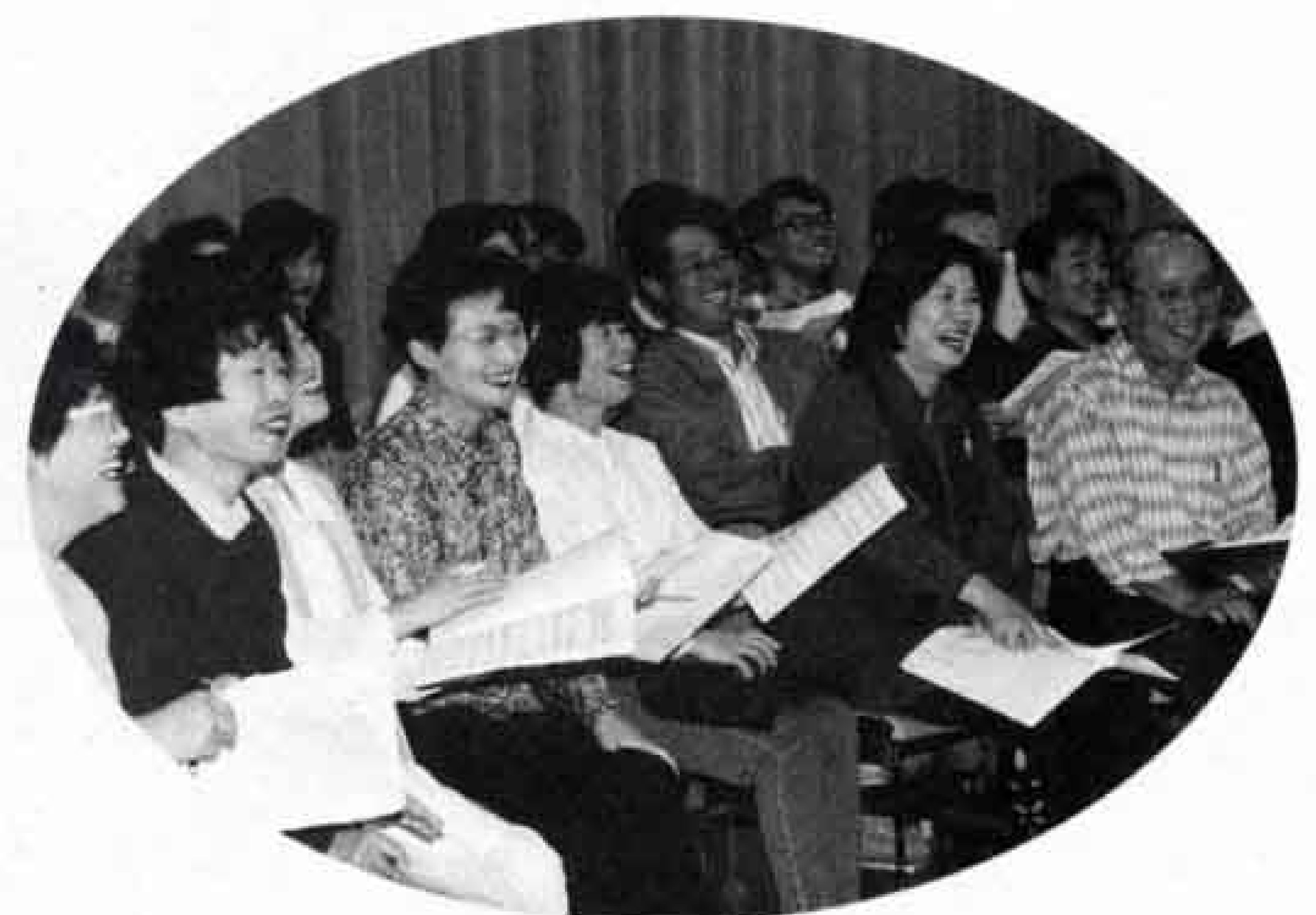
▲厳しい練習の中にも、時には笑い声が…