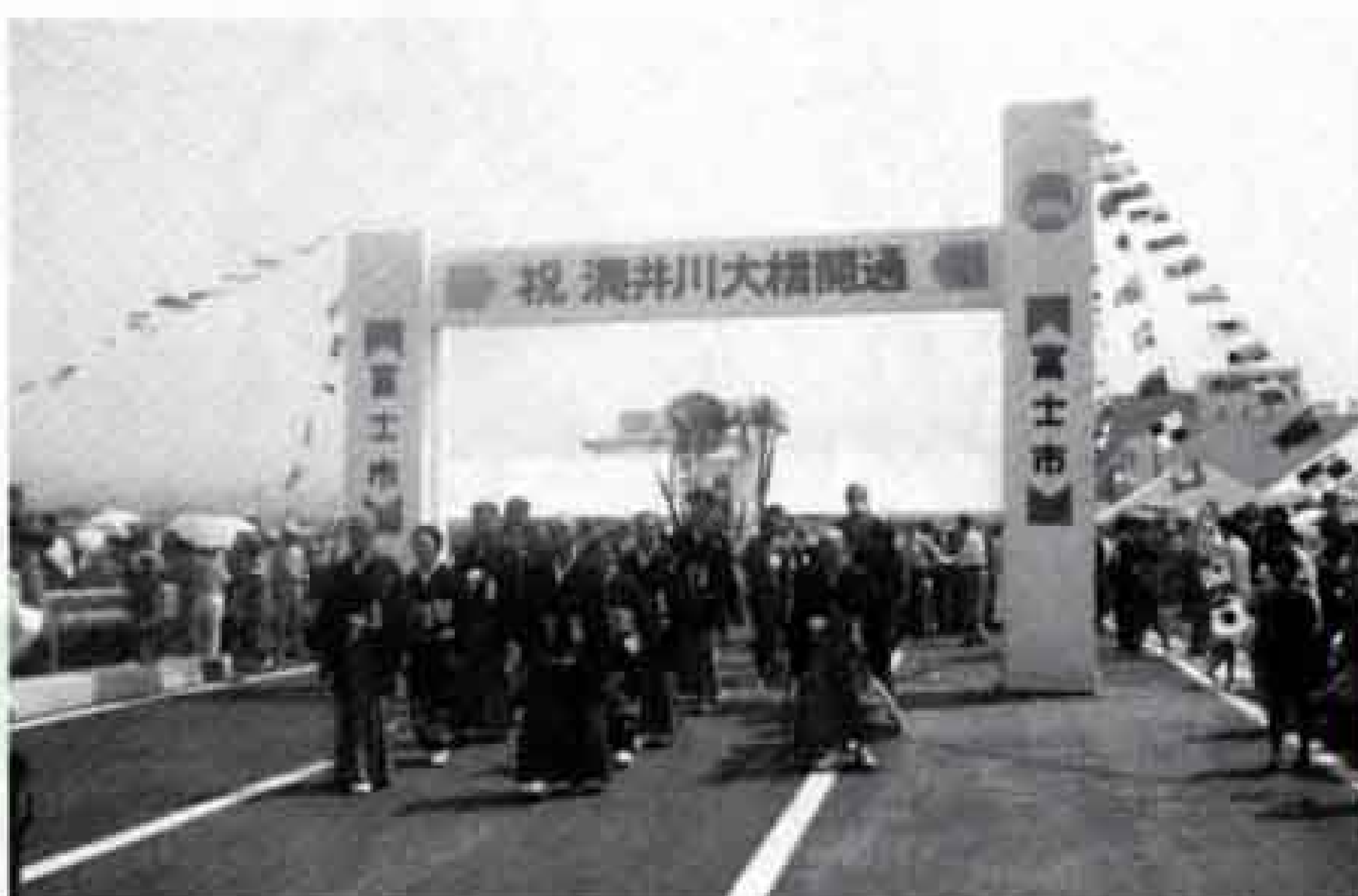
潤井川大橋が完成 (昭和59年)