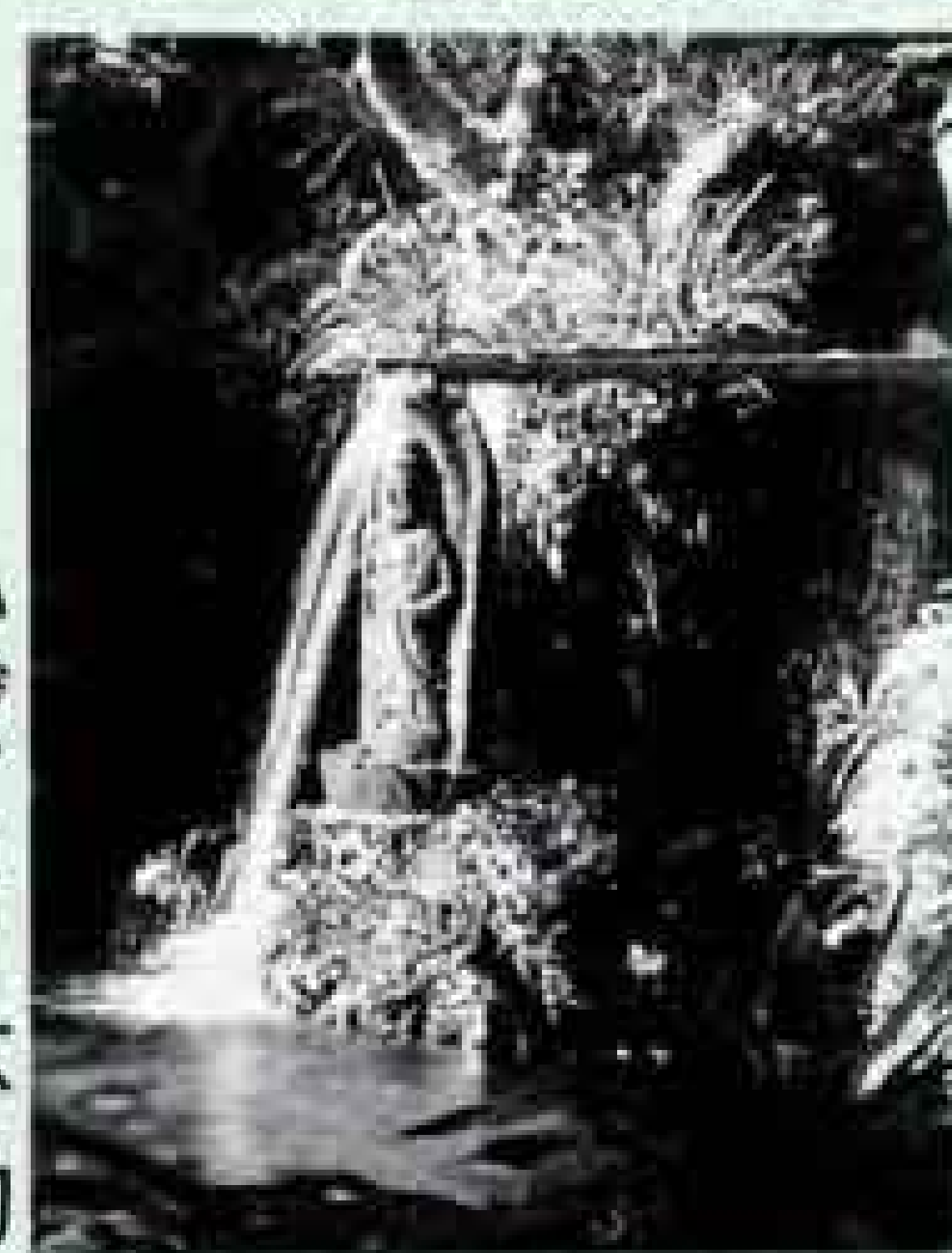
田宿川たらい流し川祭り