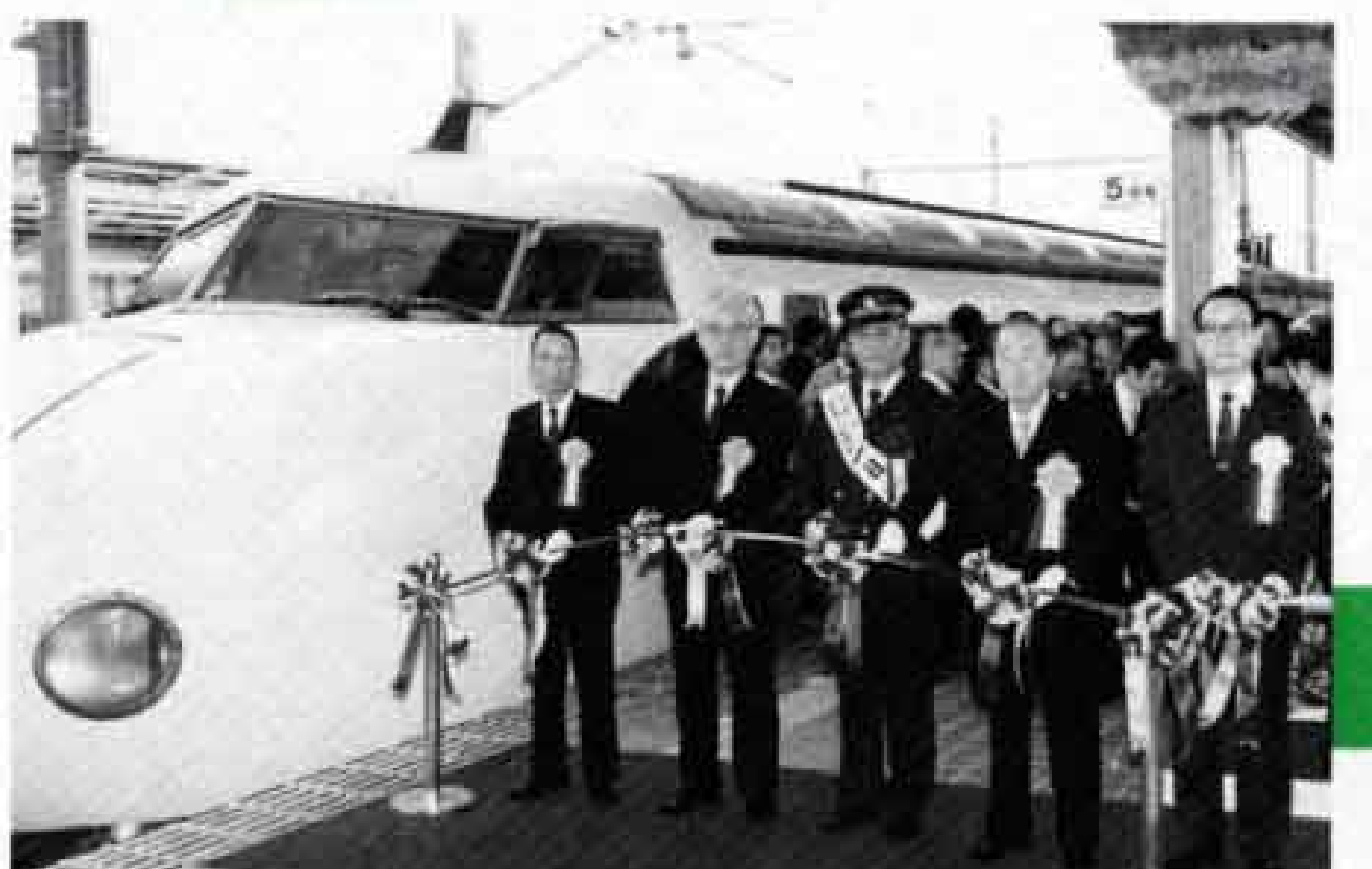
新幹線新富士駅開業（昭和63年）