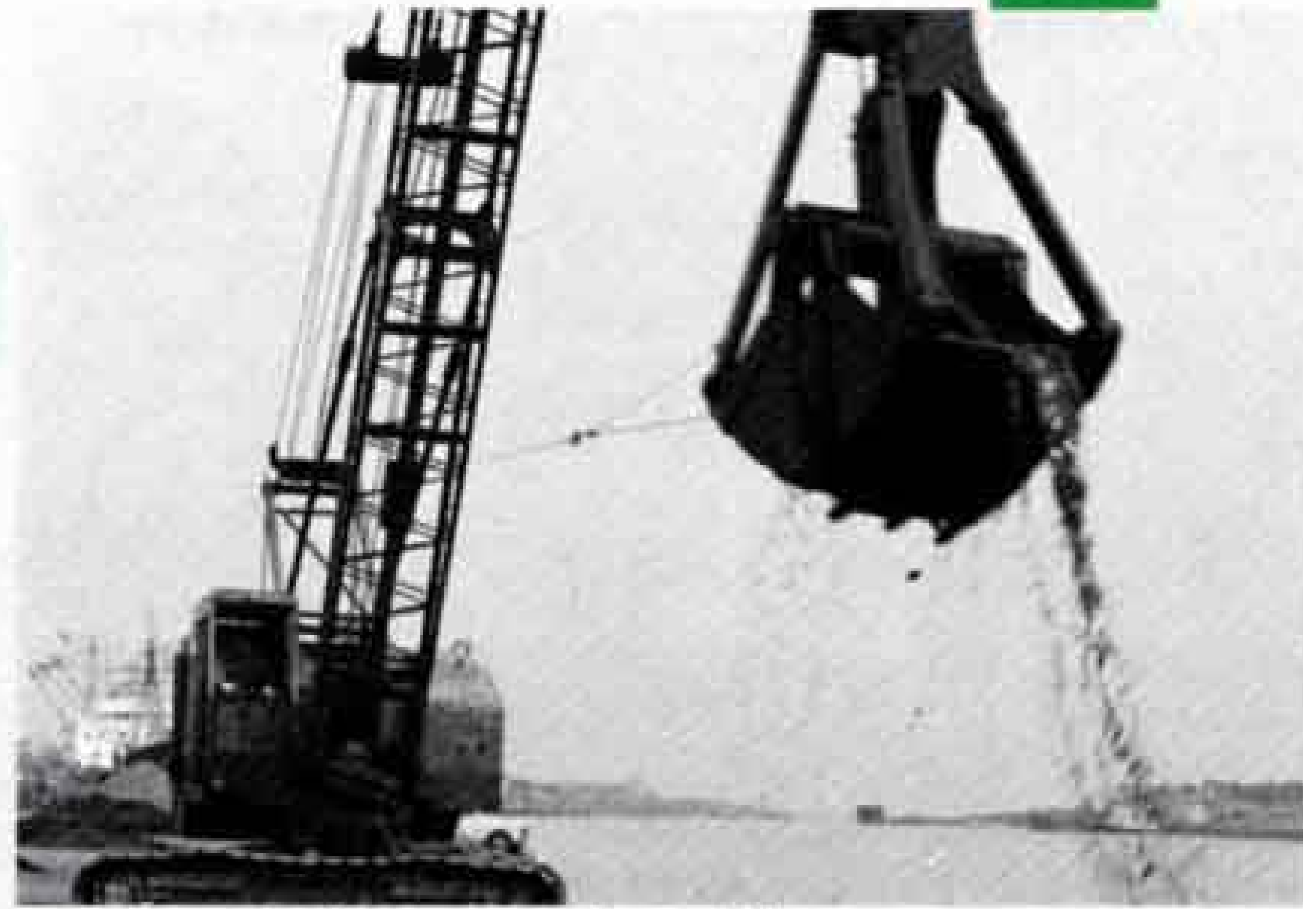
田子の浦港ヘド口処理始まる(昭和46年)