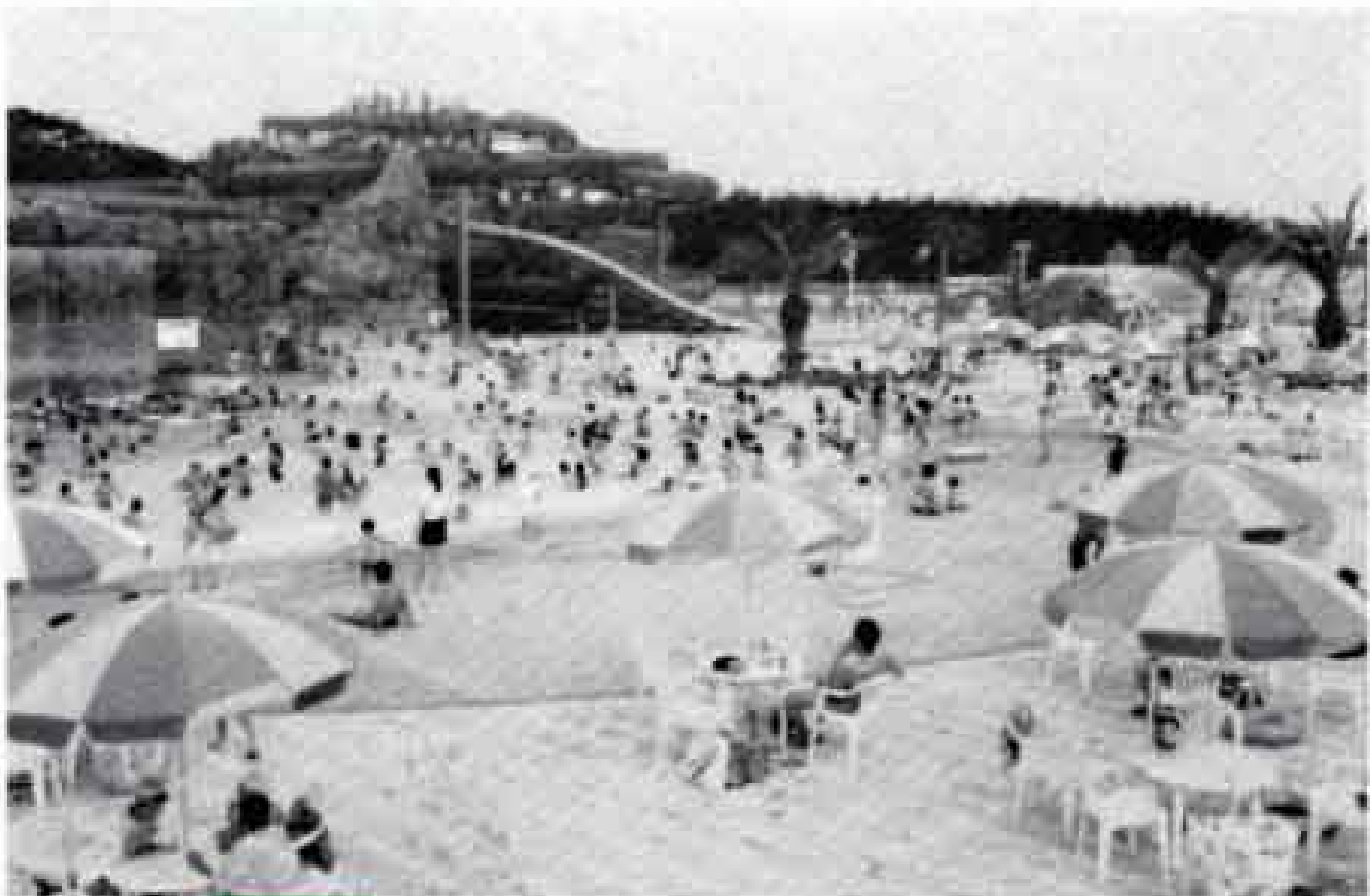
富士マリンスプールがオープン（平成8年）