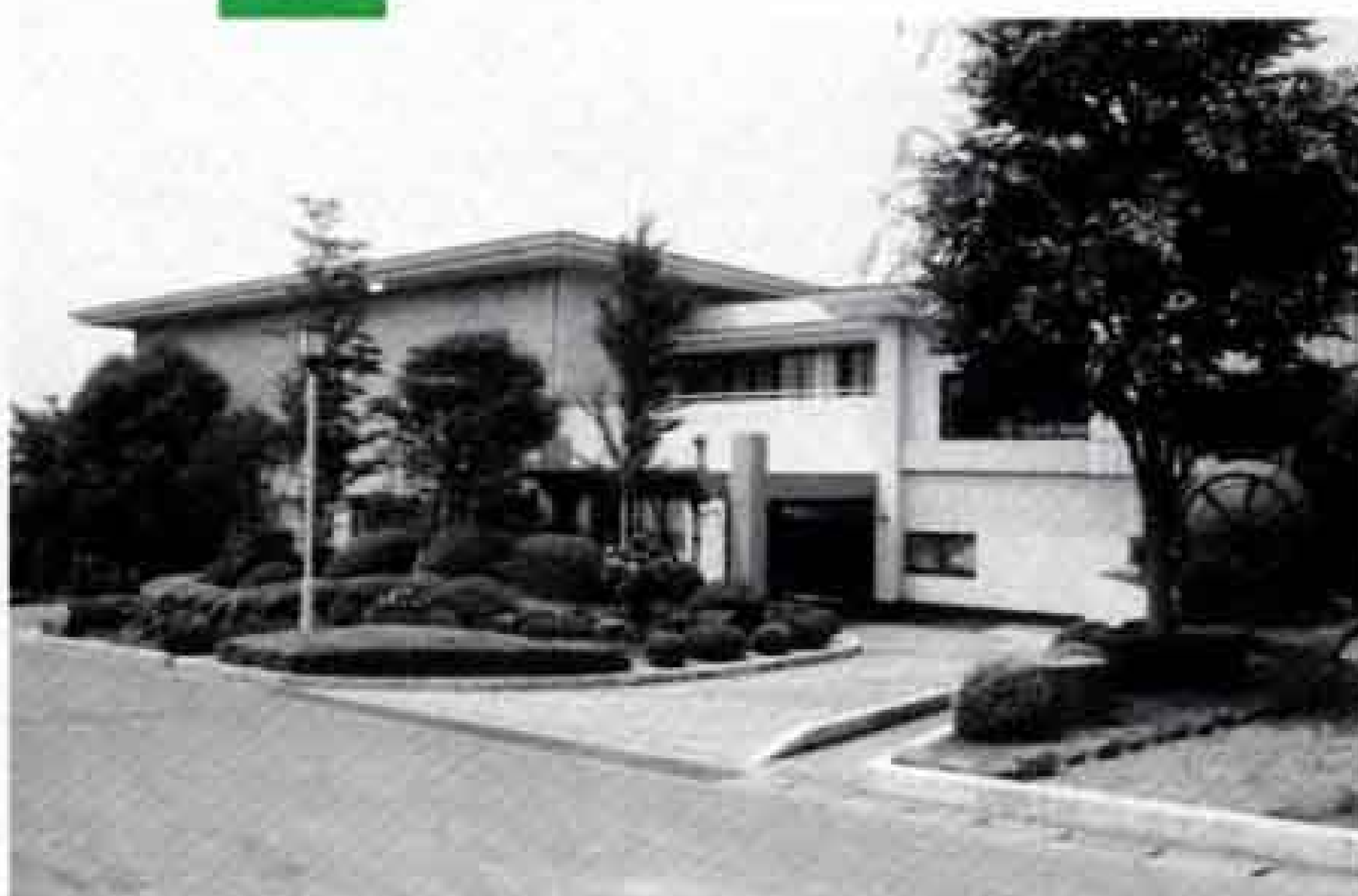
市立博物館がオープン (昭和56年)