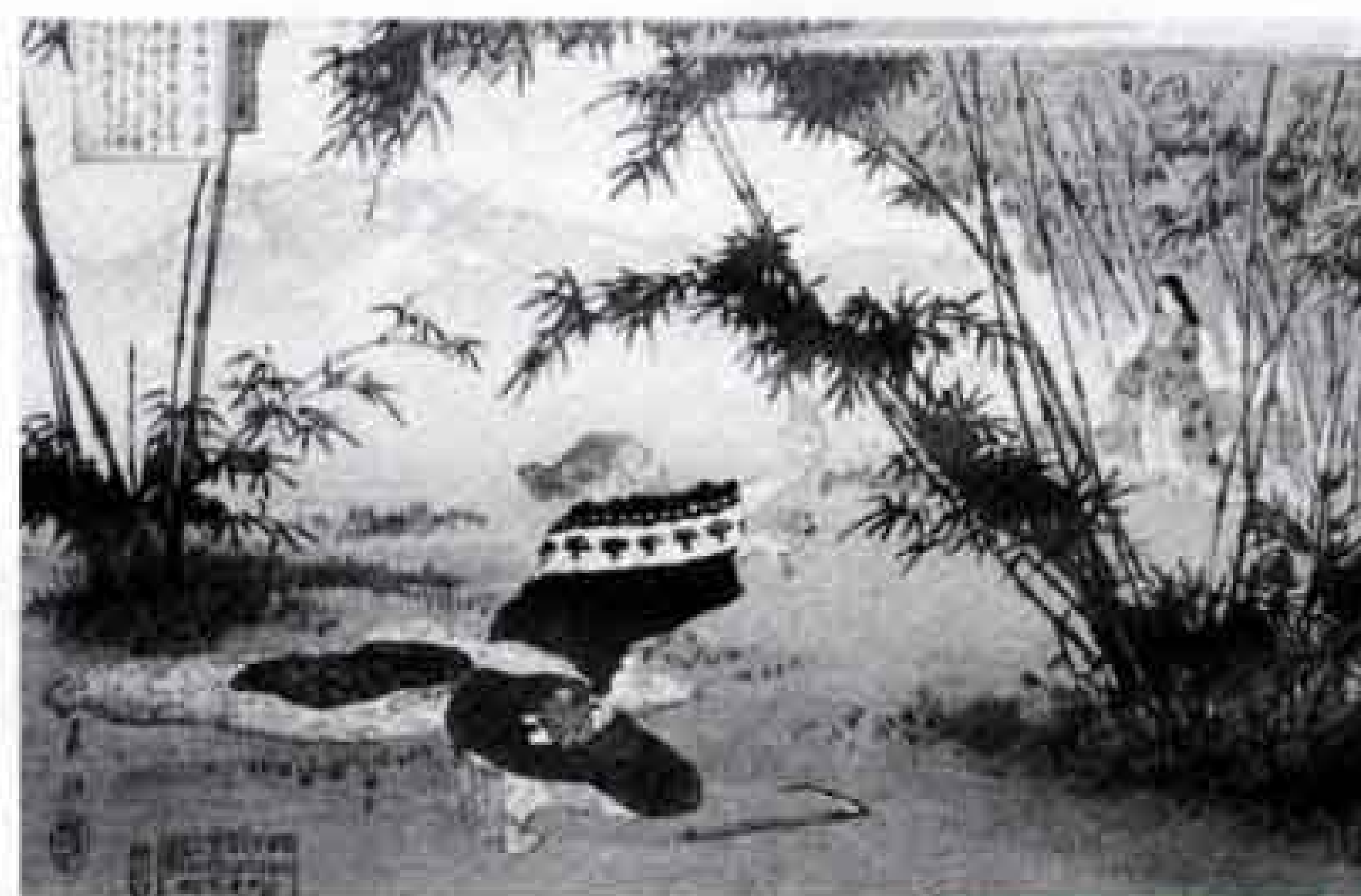
浮世十二ヶ月「竹取物語六月」