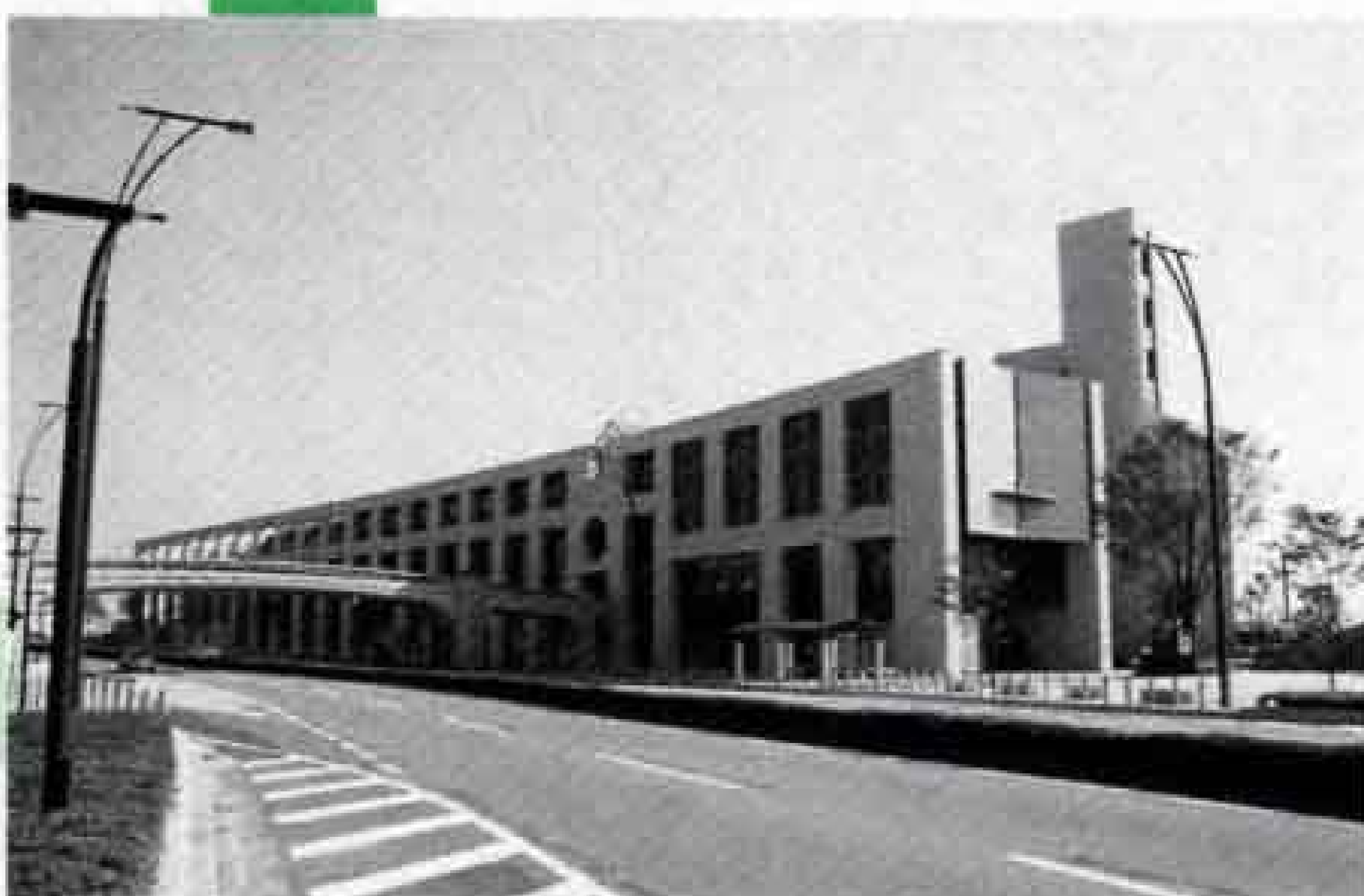
ロゼシアターがオープン（平成5年）