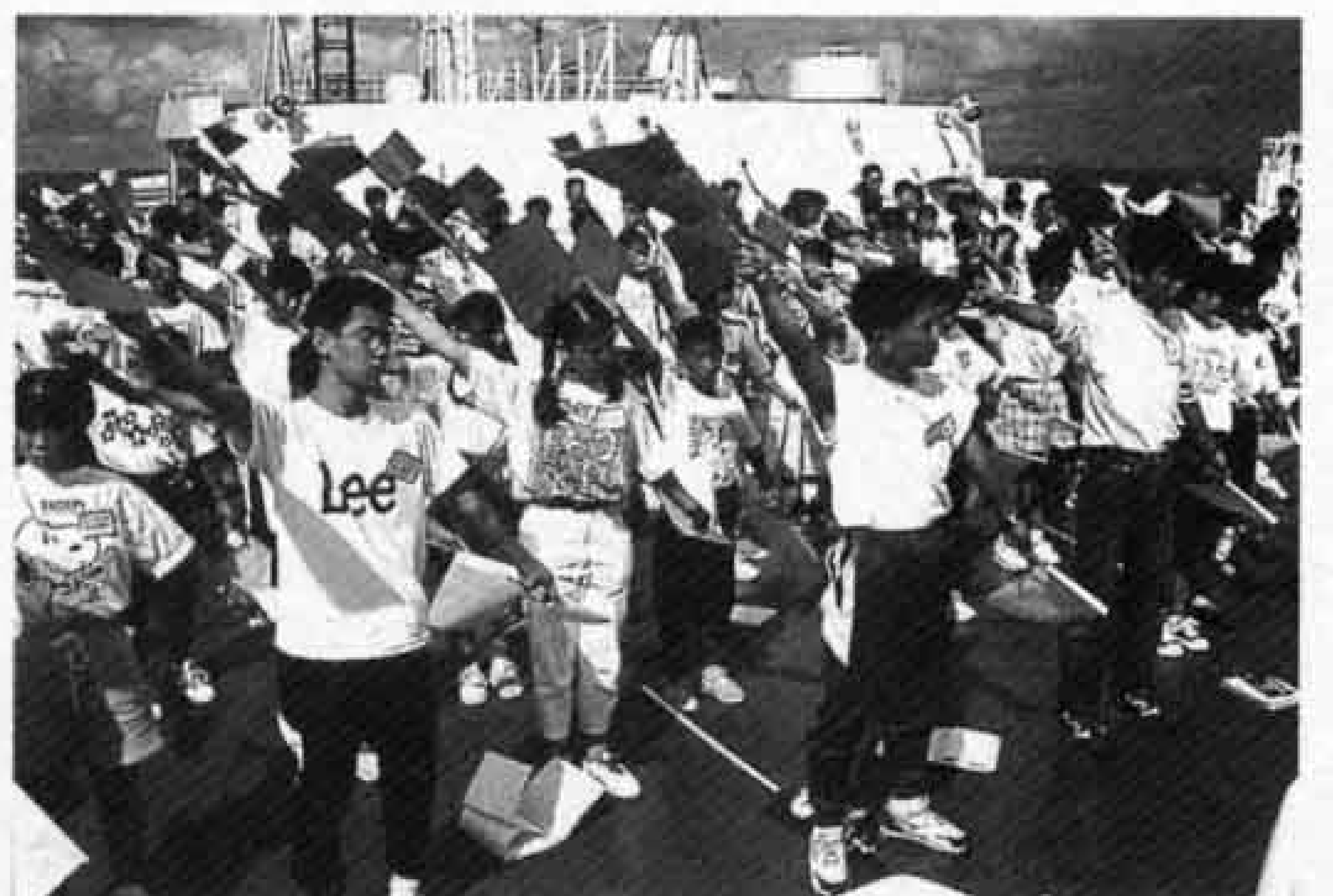
未来を担う青少年の健全育成（青少年の船）

私は、基本理念として「未来へつなぐ人間都市「富士」」を掲げています。これは、二十一世紀を間近に控え、富士市の未来を担う子供たちに、すばらしいまちを引き継ぐことが、我々の使命であるという意味が込められています。