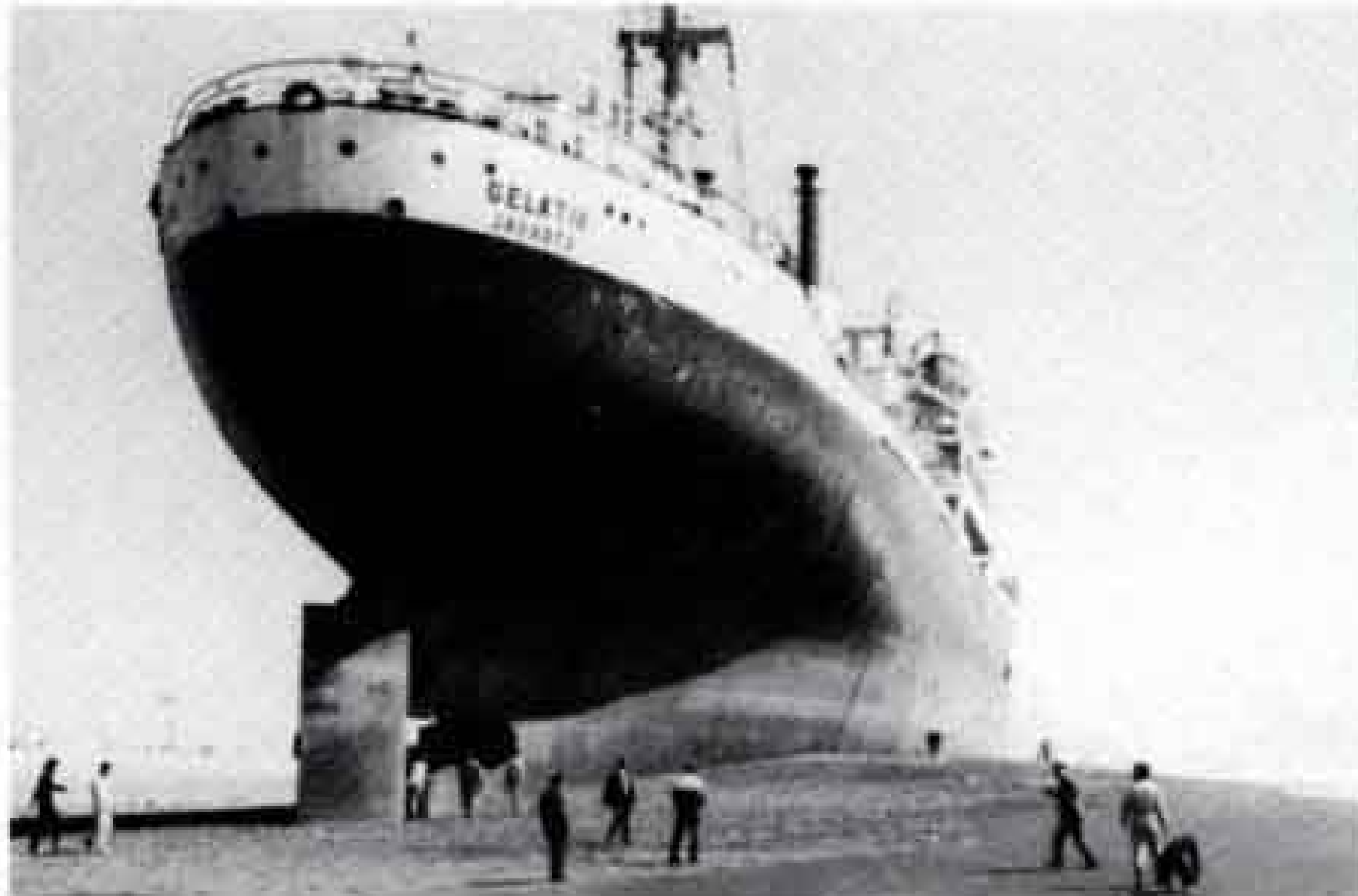
ゲラティック号が打ち上げられる (昭和54年)