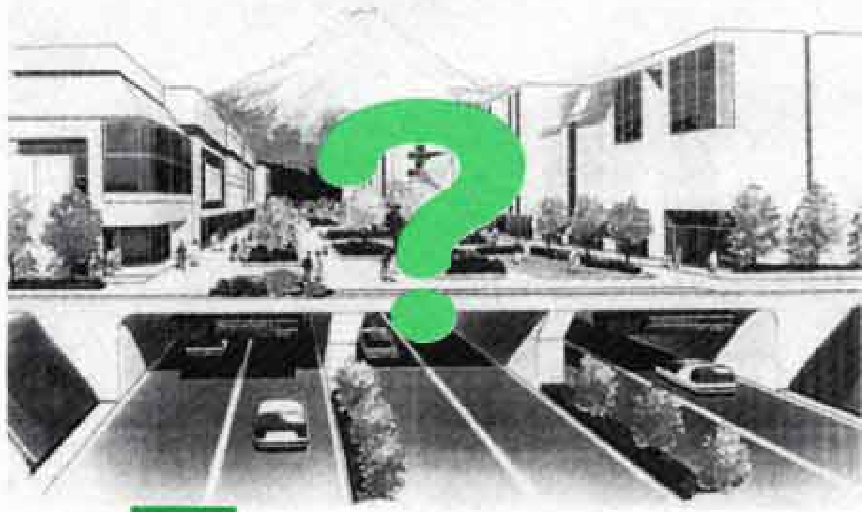
米国・オーシャンサイド市と姉妹都市提携（平成3年）