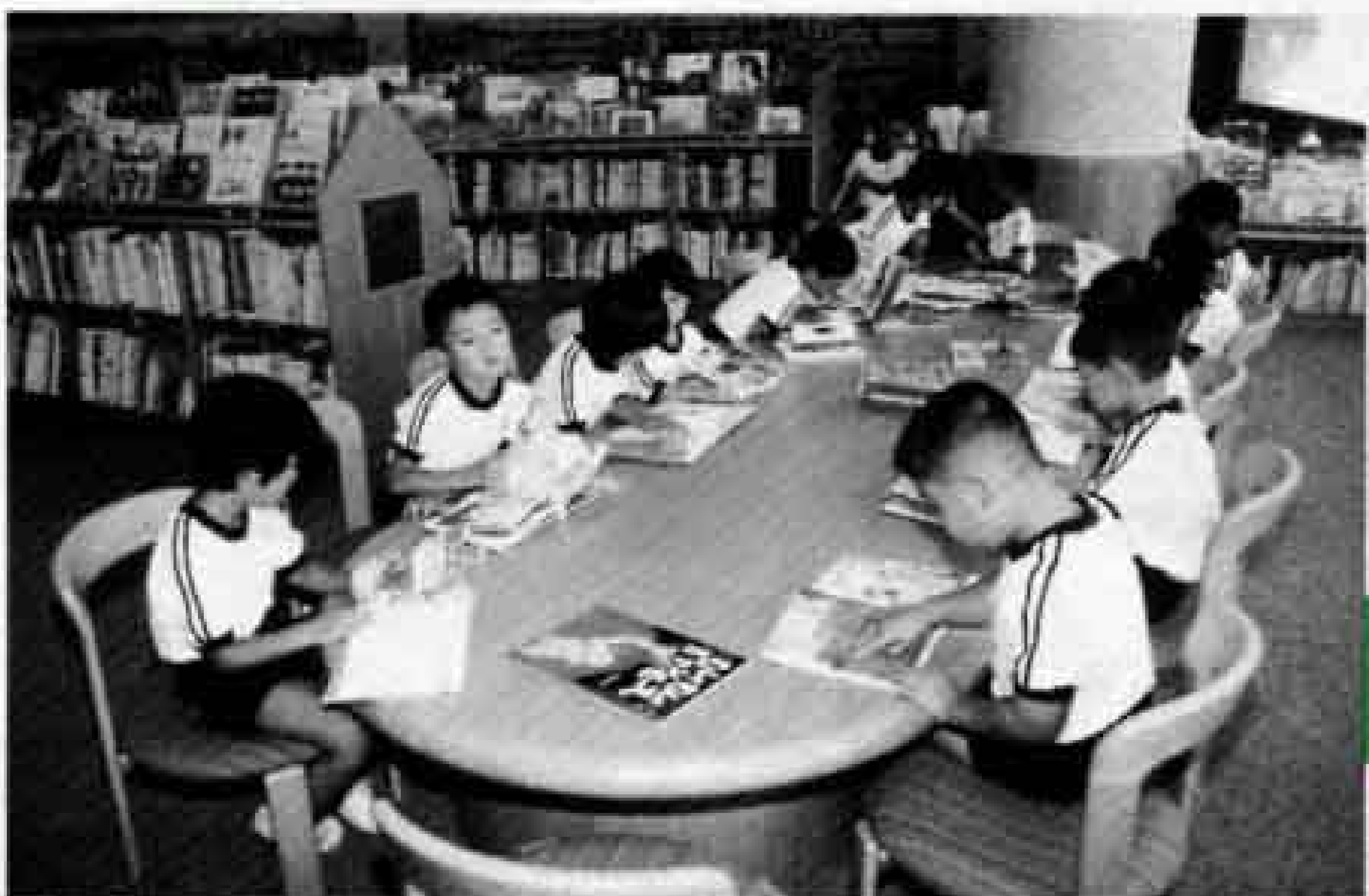
中央図書館がオープン（平成7年）