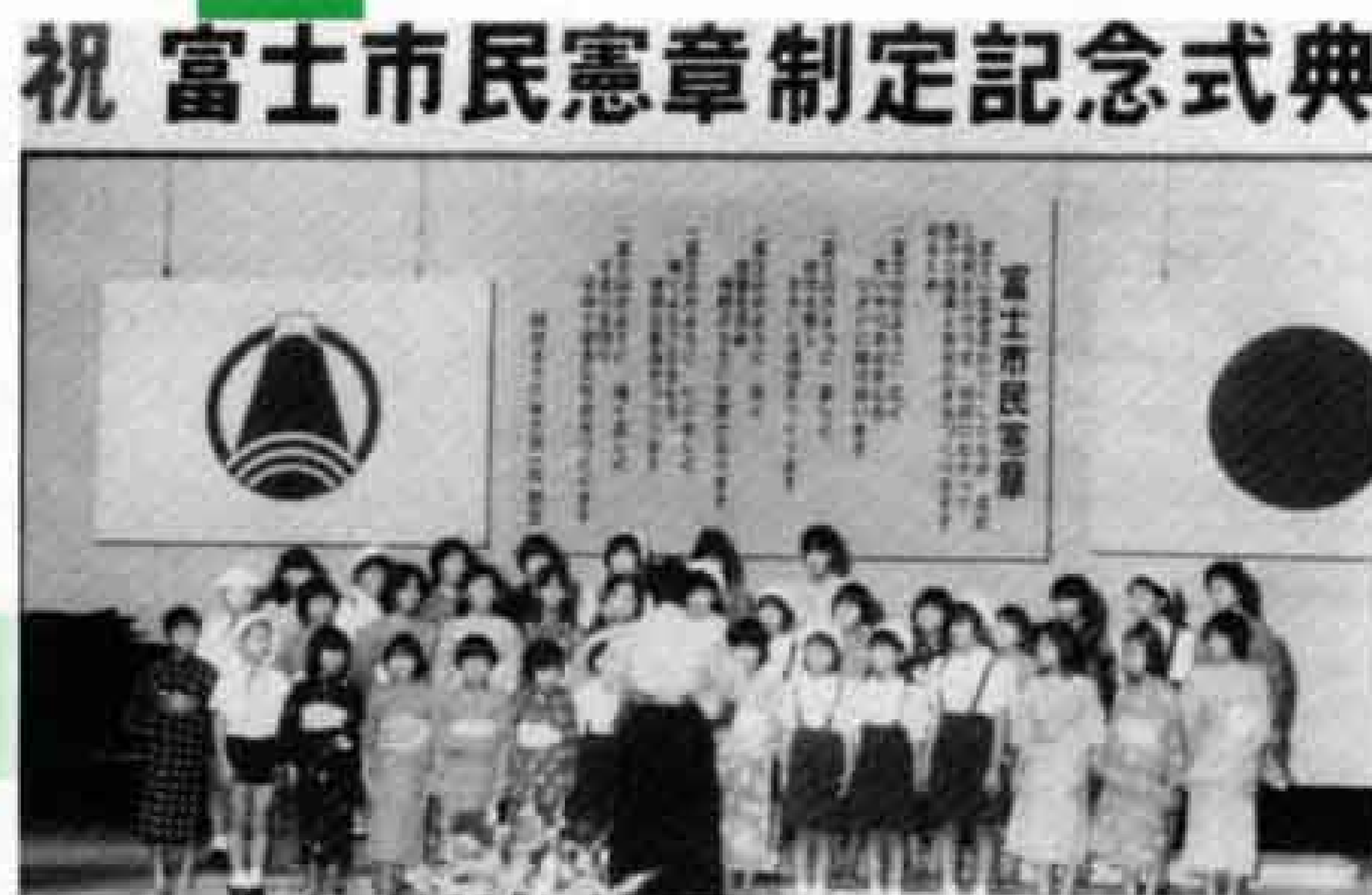
祝 富士市民憲章制定記念式典 富士市民憲章が制定される (昭和58年)