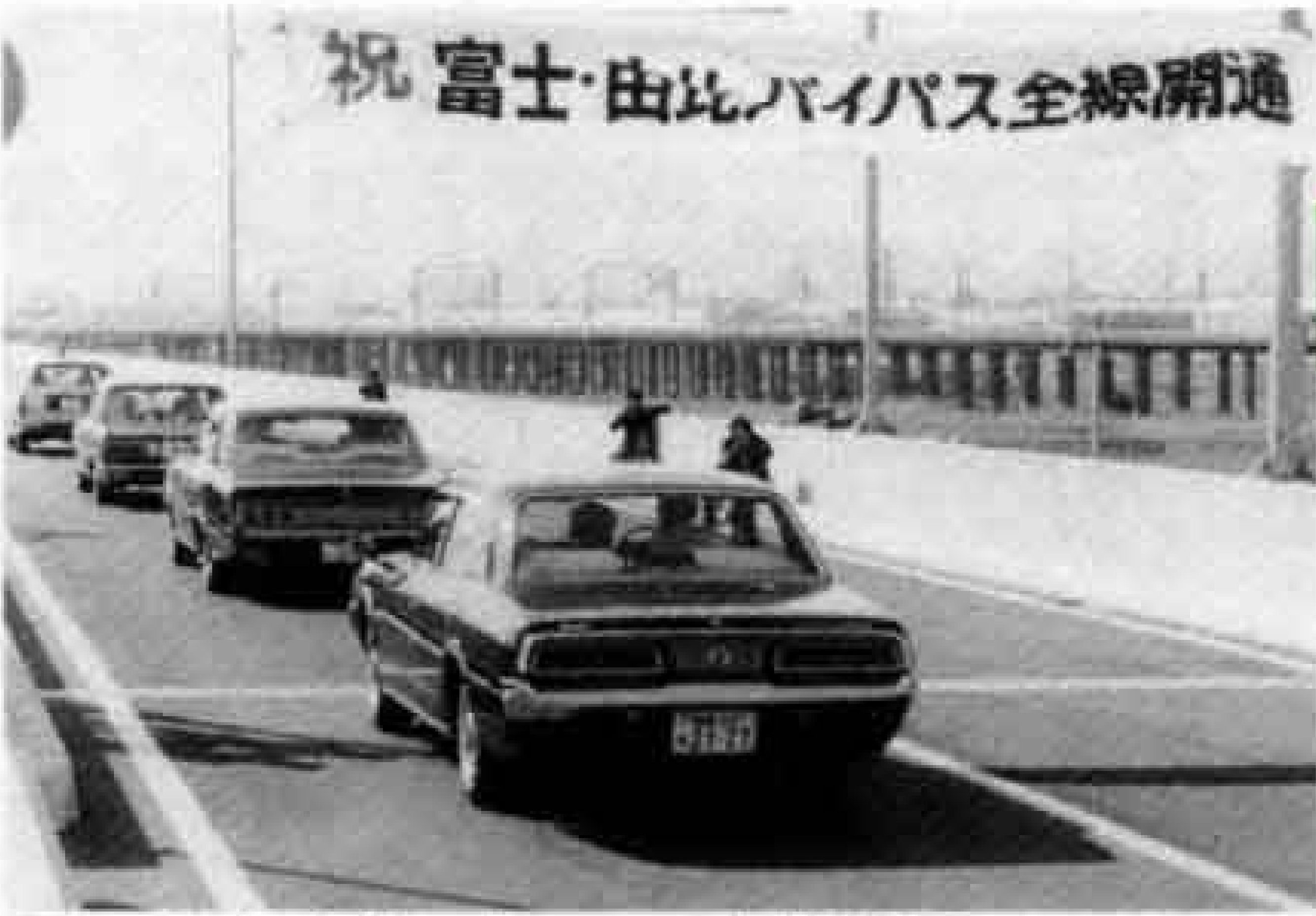
国1 富士由比バイパス全線開通(昭和50年)