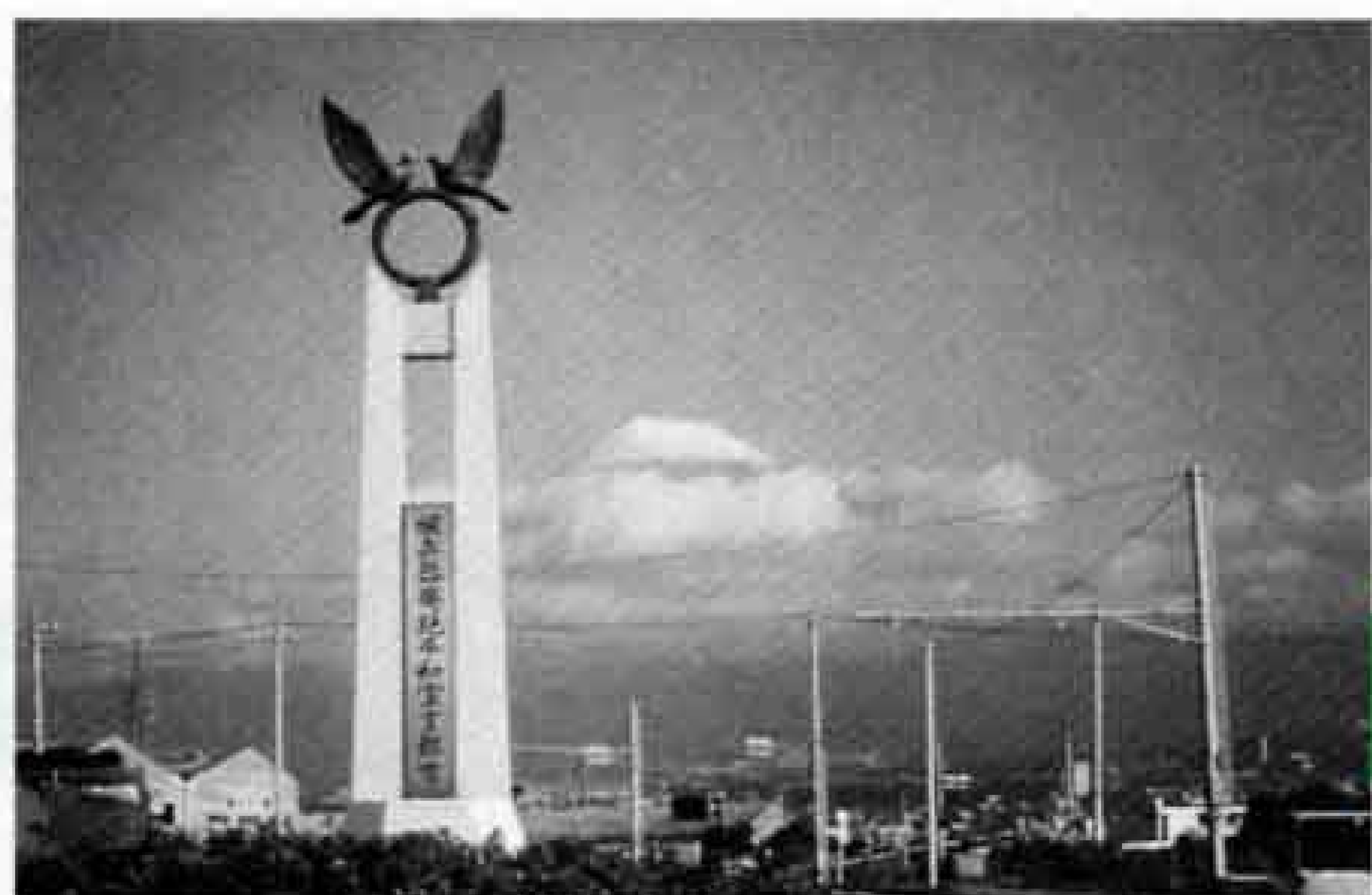
核兵器廃絶平和都市を宣言 (昭和60年)