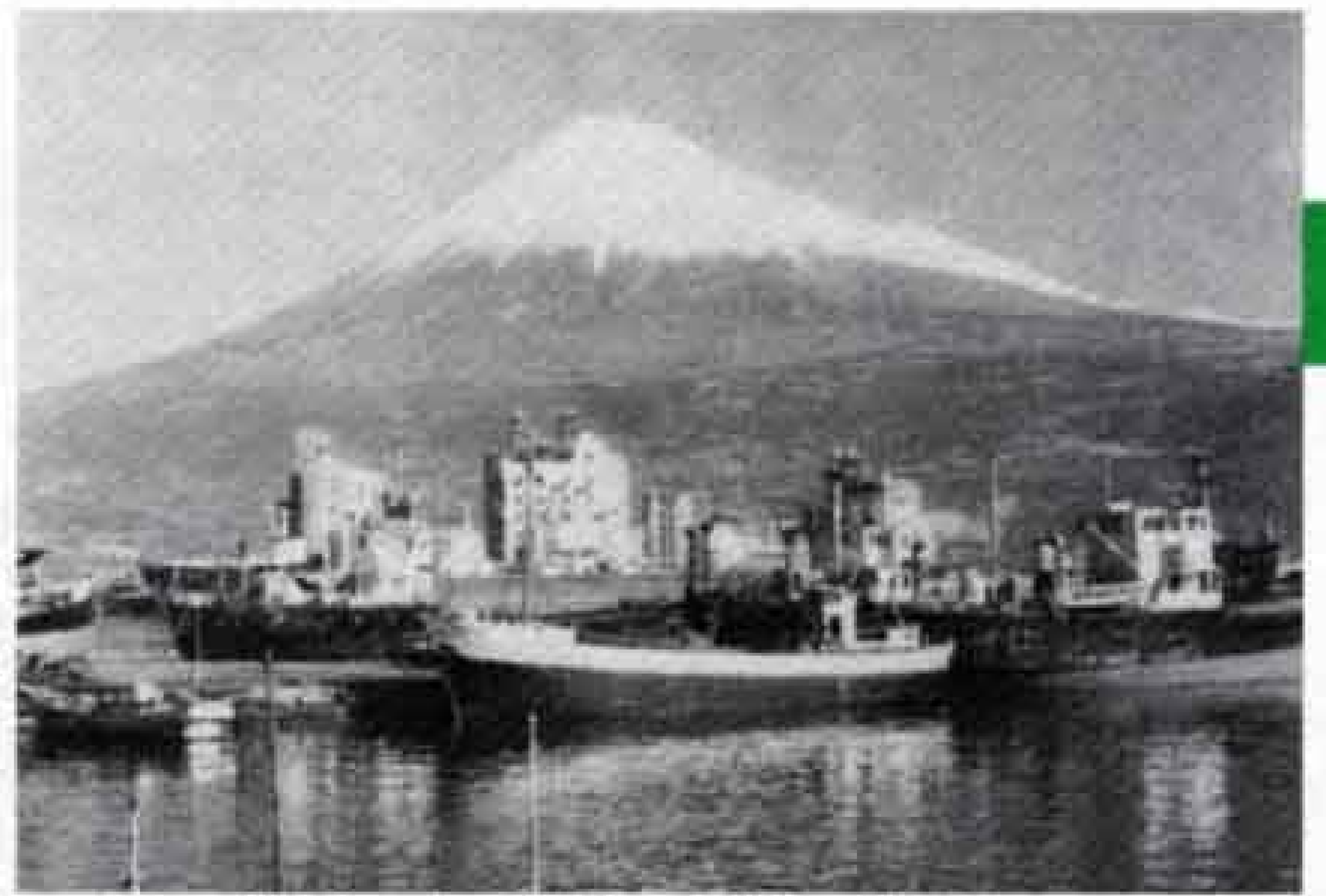
田子の浦港が国際貿易港に指定(昭和41年)