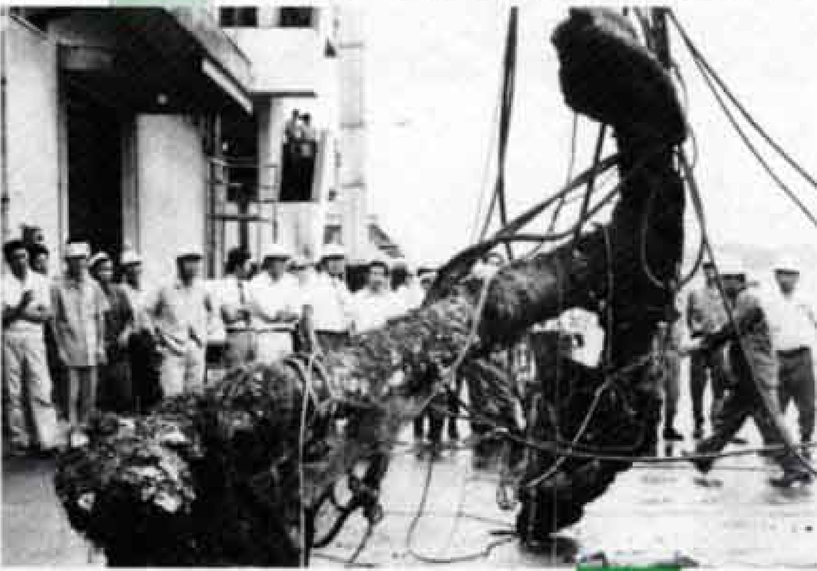
ディアナ号のいかり引き揚げ(昭和51年)