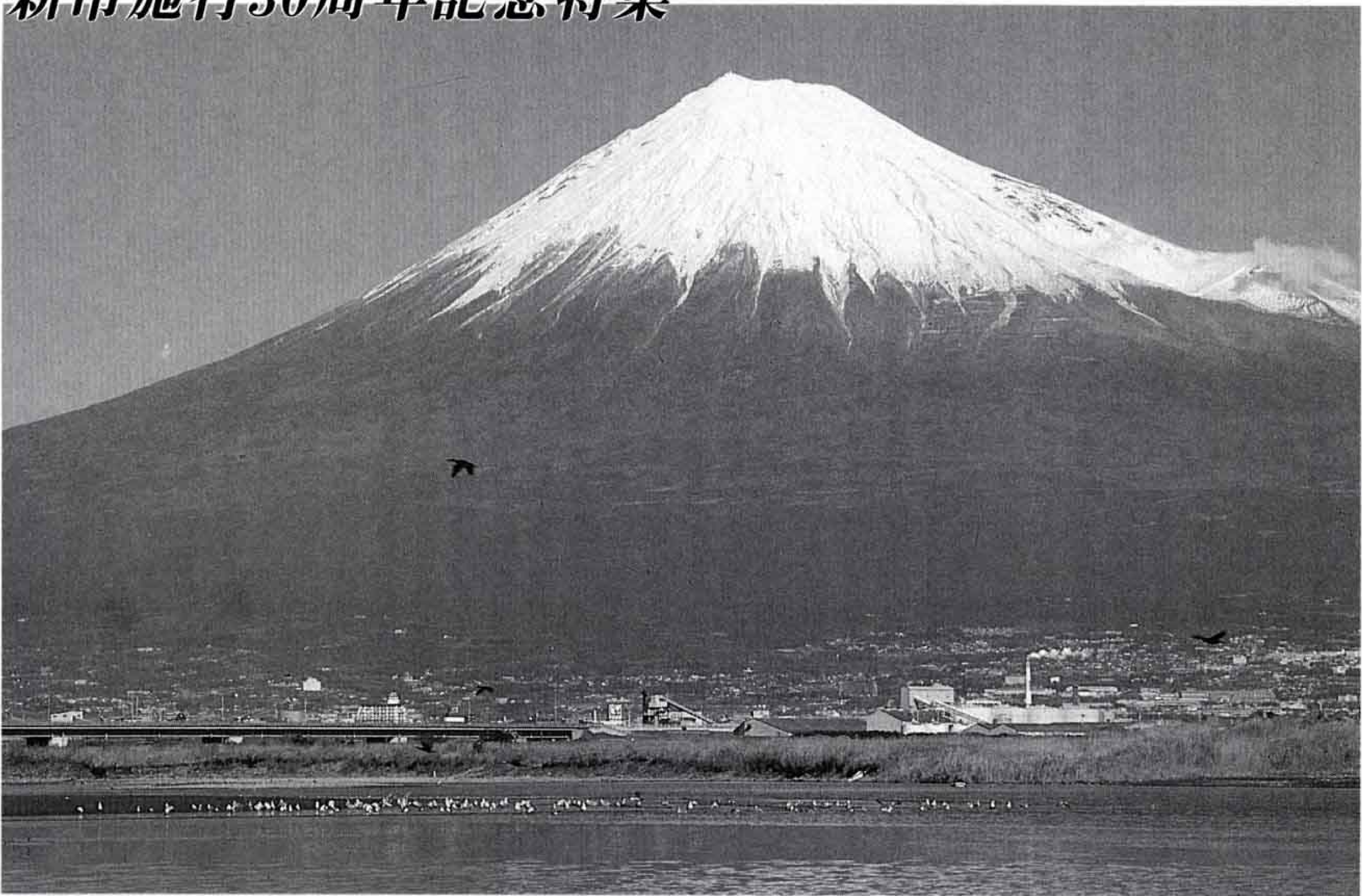
富士山は、富士市の水や自然、文化、産業の源

目ではないでしょうか。もちろん、そのために施設面だけでなく、福祉施策の質を高める努力もしていかなければなりません。