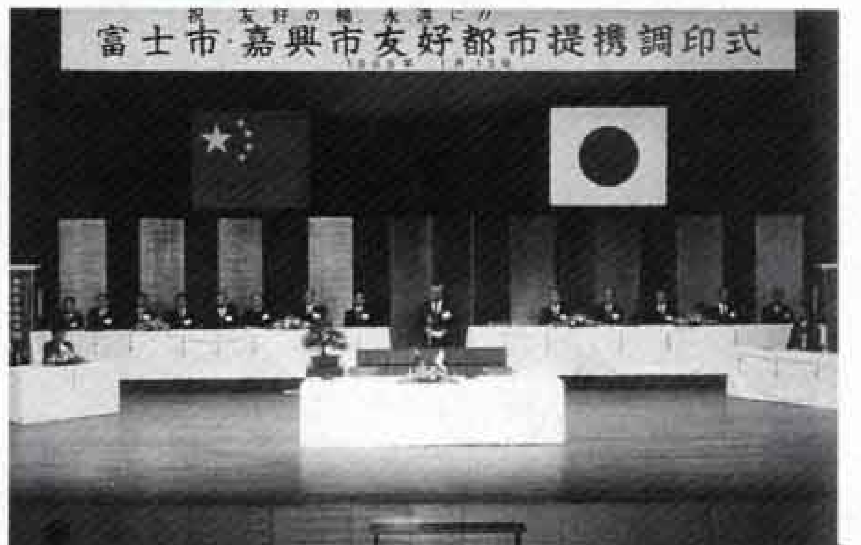
中国・嘉興市と友好都市提携（平成元年）