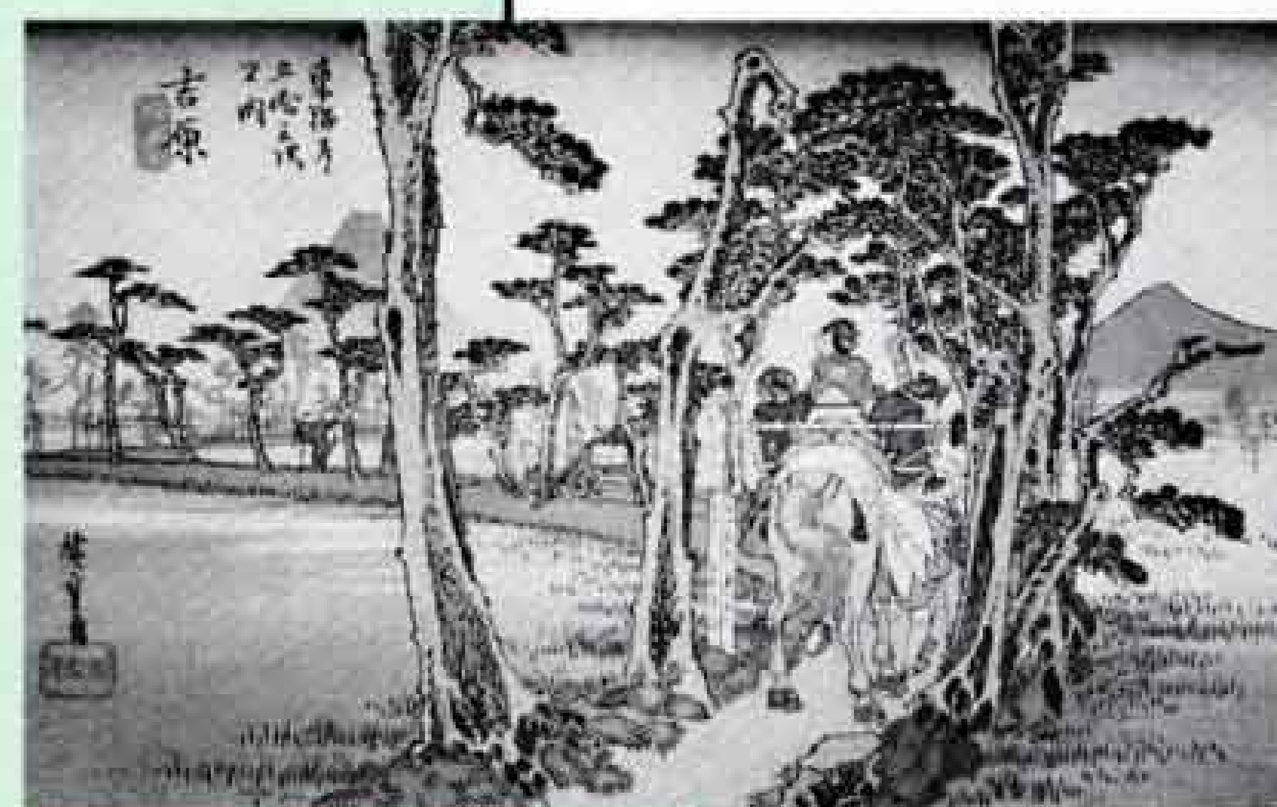
東海道五十三次「左富士」