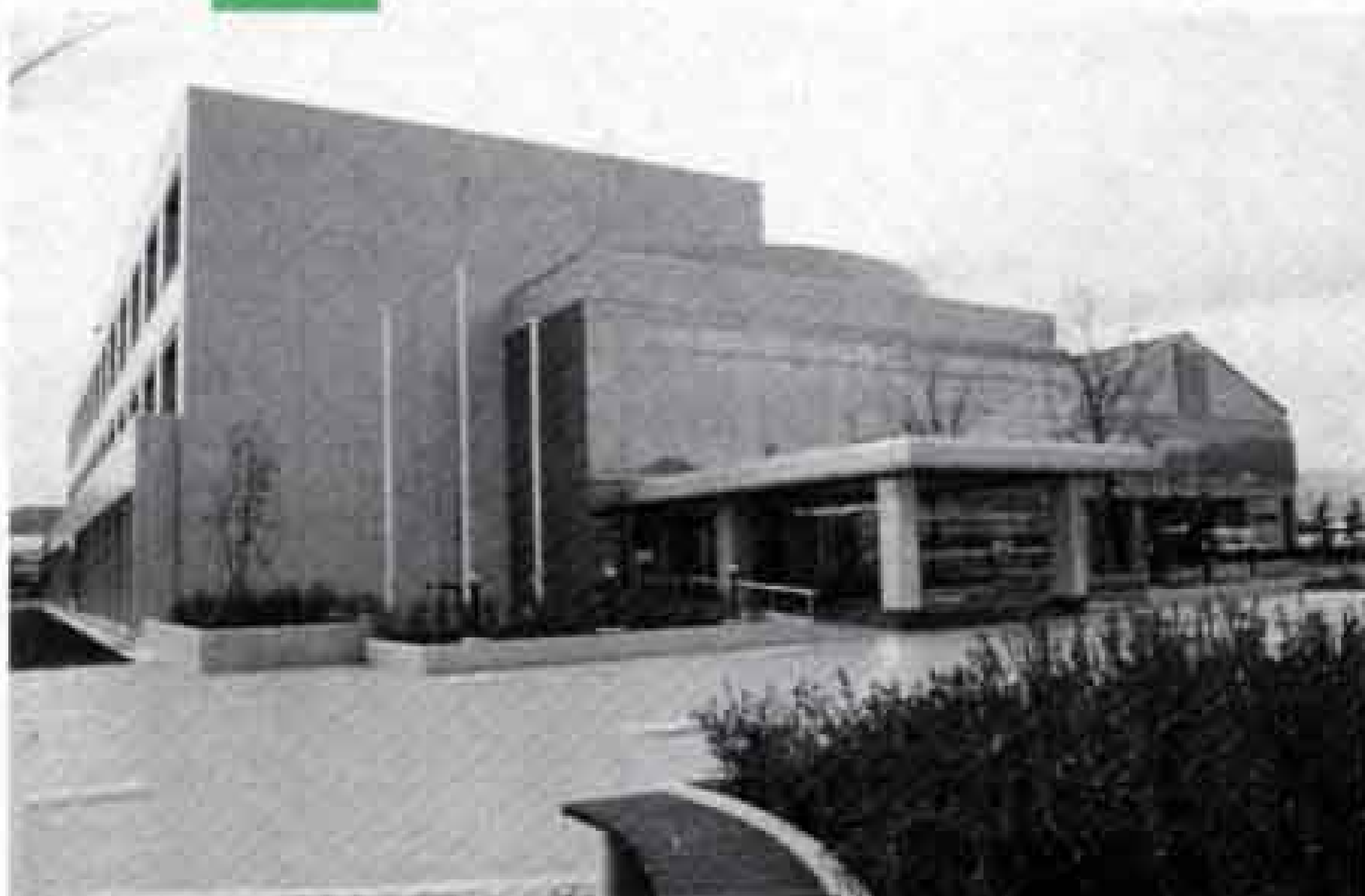
市立看護専門学校開校（平成5年）