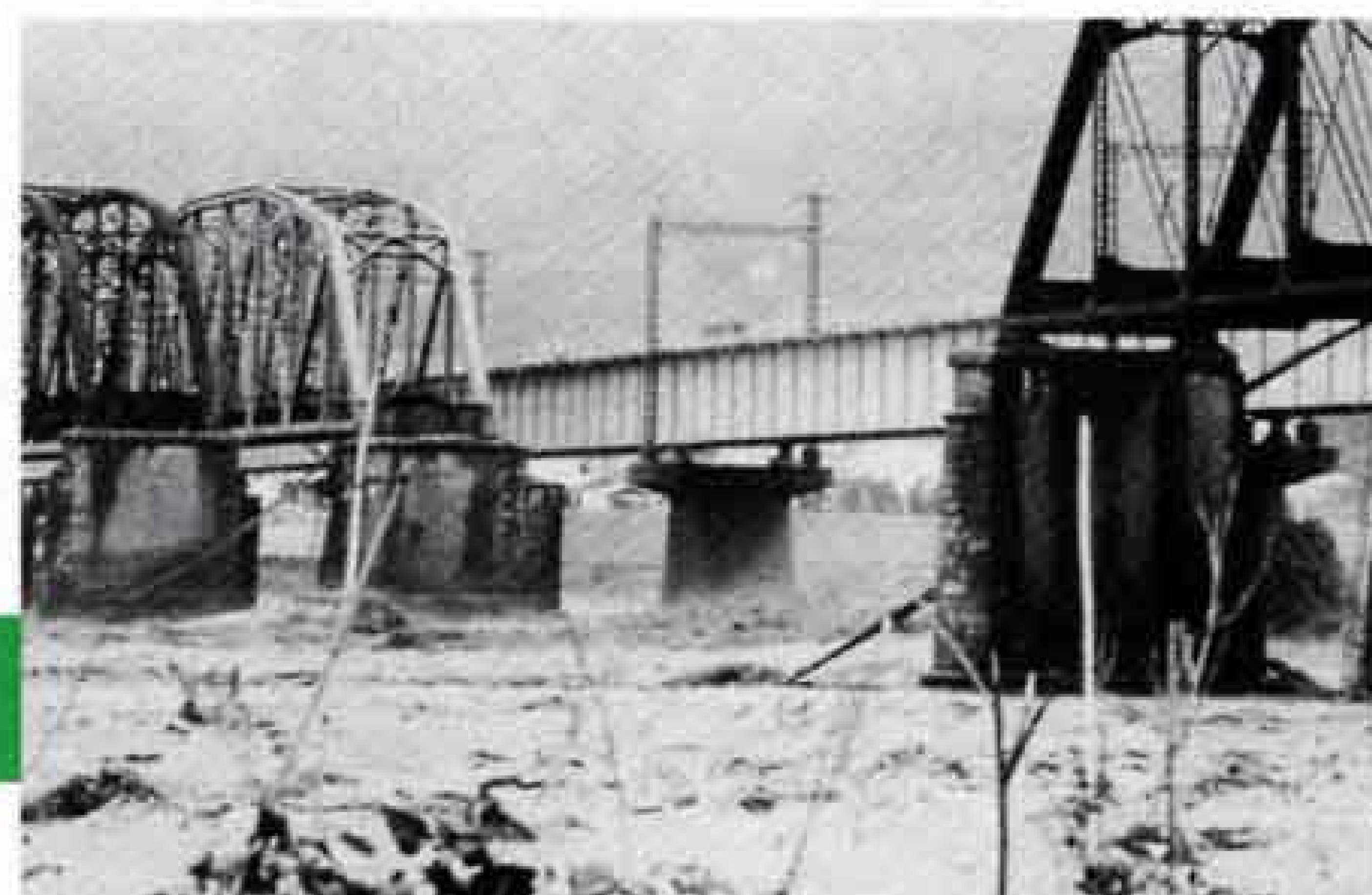
台風10号による富士川鉄橋橋脚流出 (昭和57年)