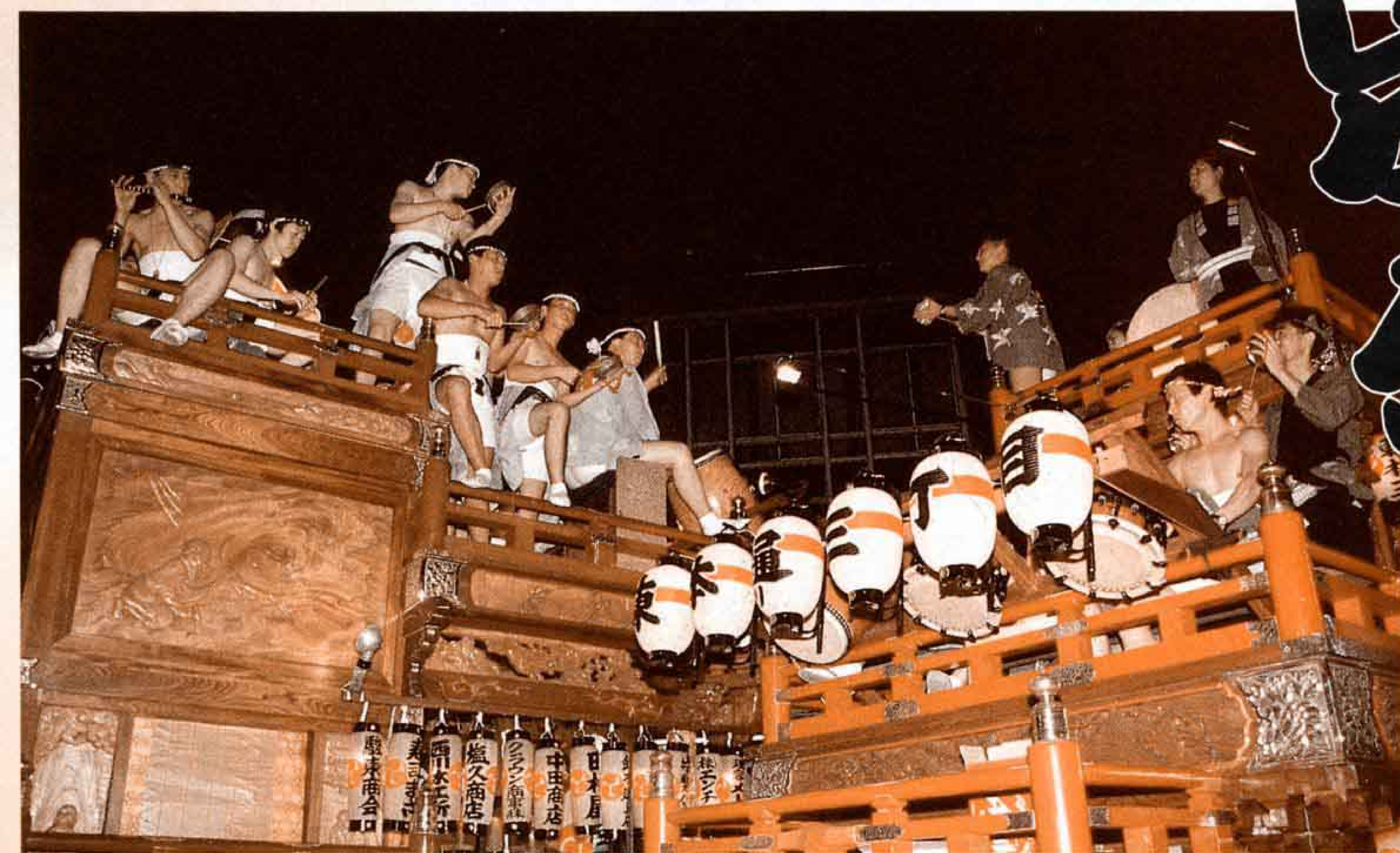
▼ 山車の競り合いは、まさに吉原祇園祭の最高潮