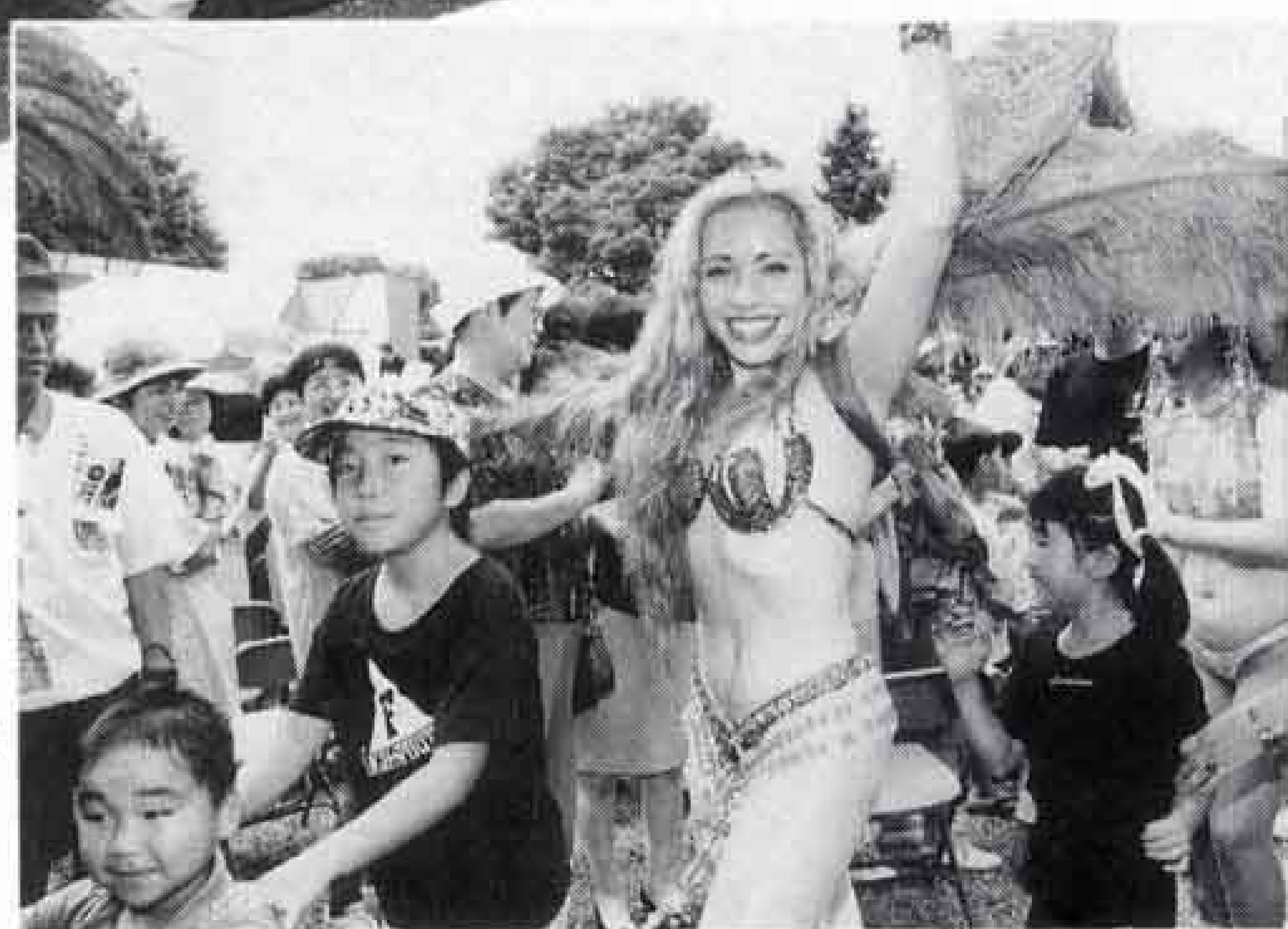
▲大興奮の「かぐや姫 1,000人大綱引き」