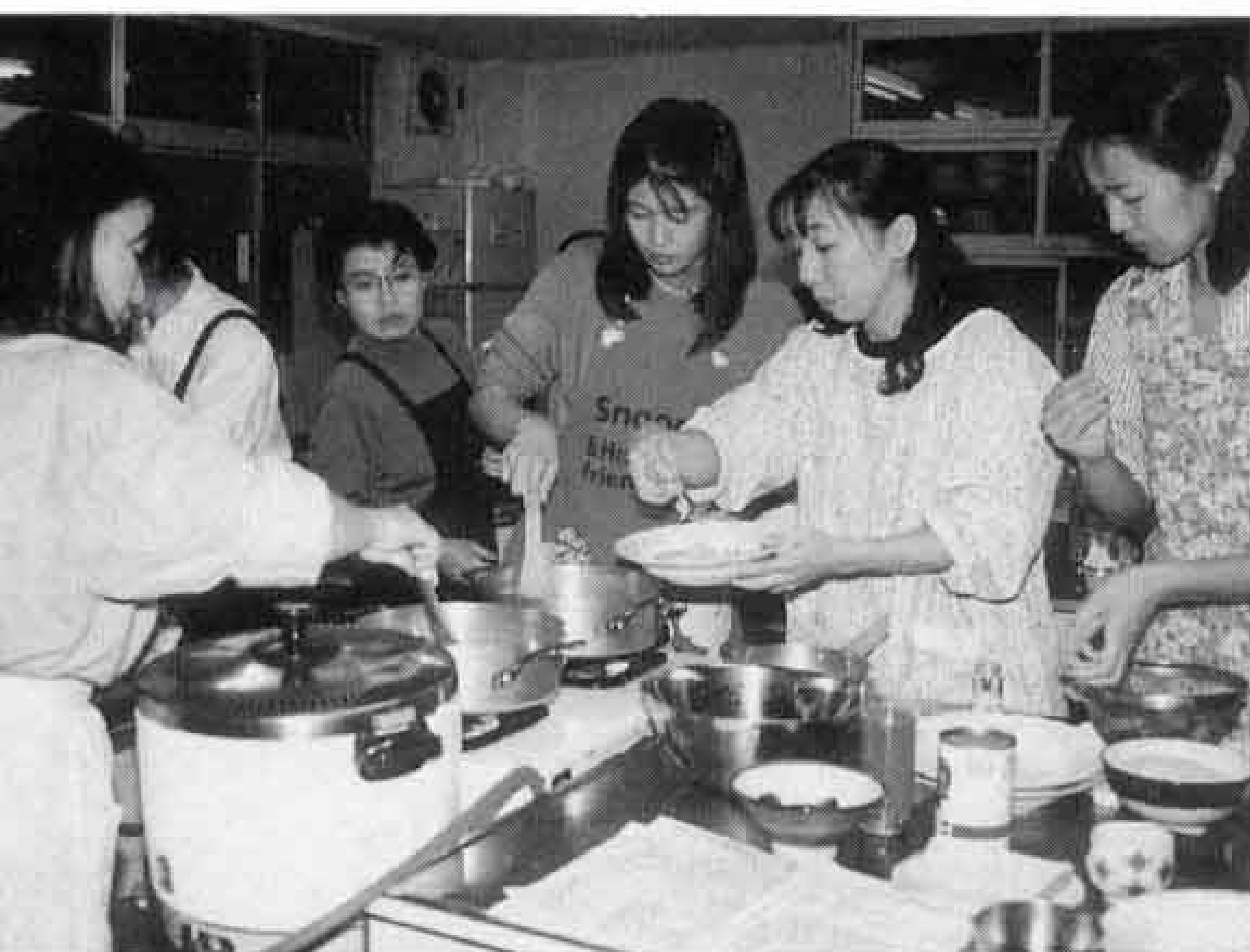
クッキングスクール 「パエリアとパンナコッタづくり」