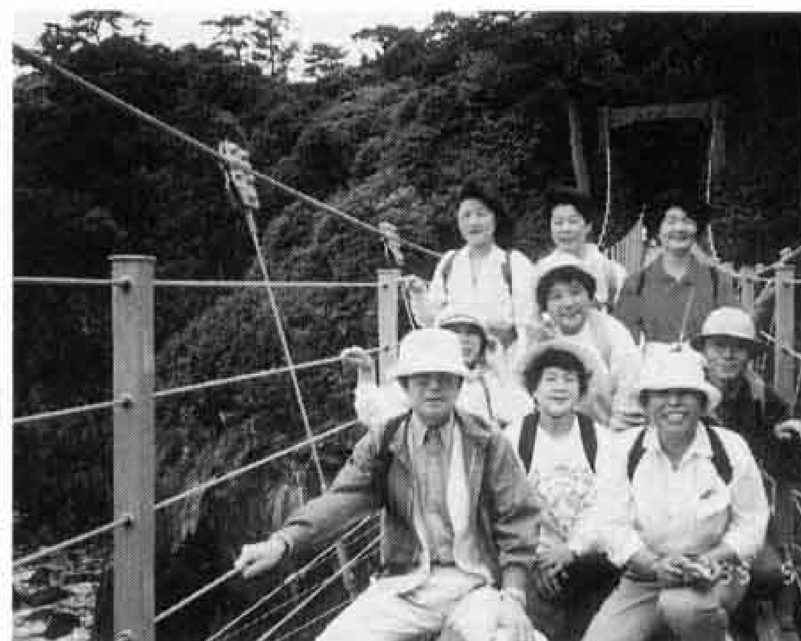
ハイキングツアー（伊東の城ヶ崎海岸）