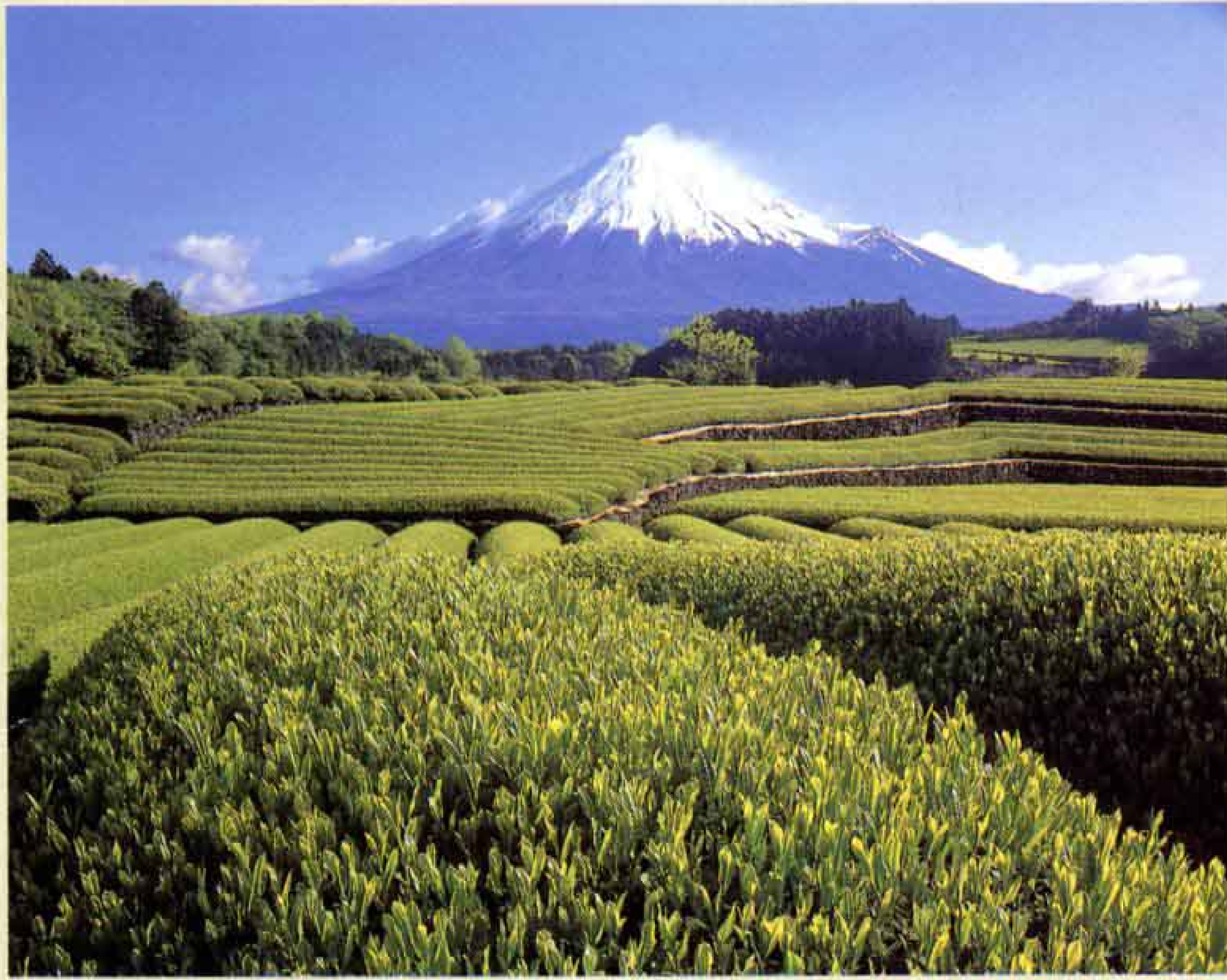
写真“新緑” 依田房夫さん(平垣)作 「富士山を撮り続けて40年。富士山は私にとって恋人のようなものです」