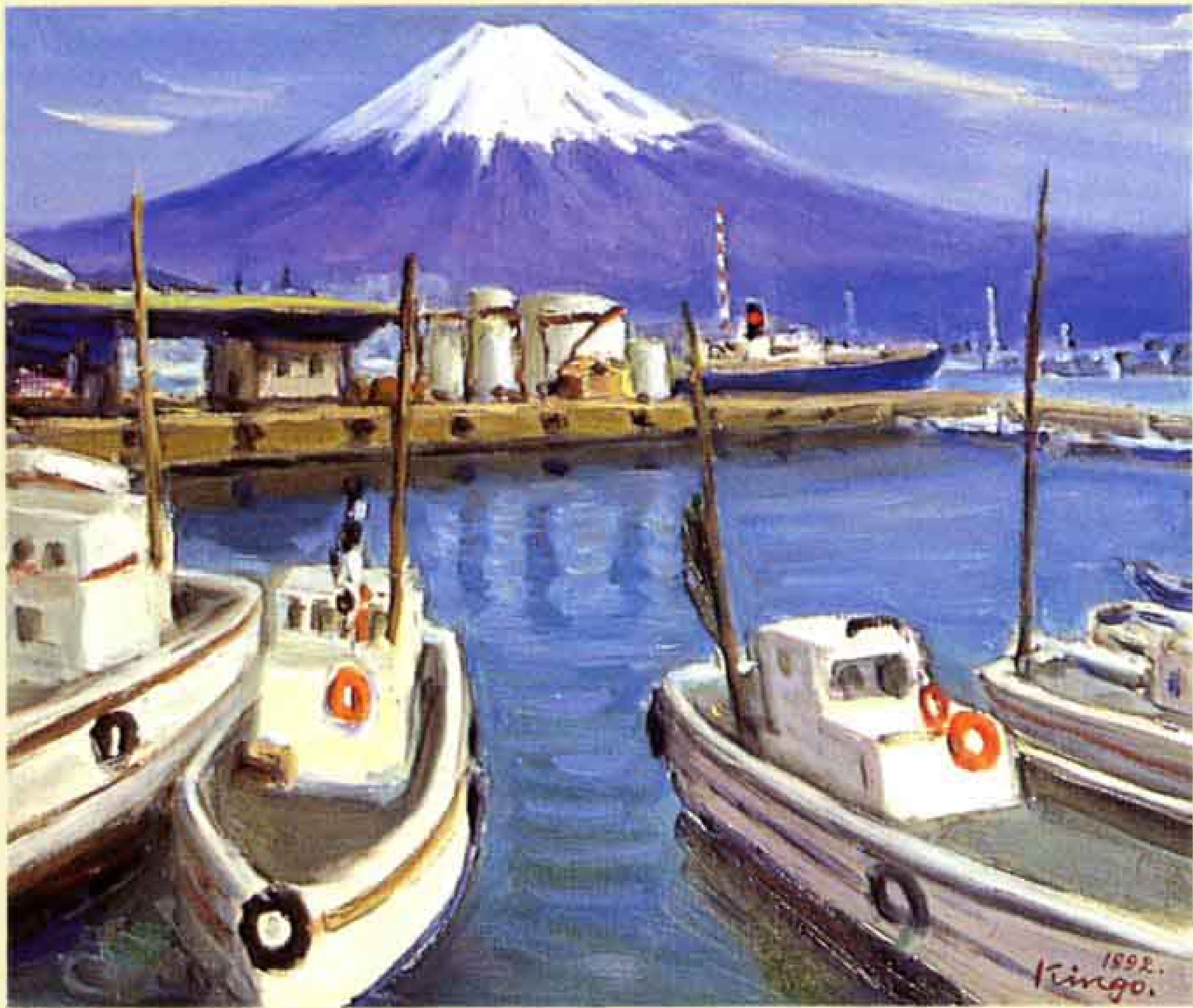
油絵 “田子の浦港の富士”