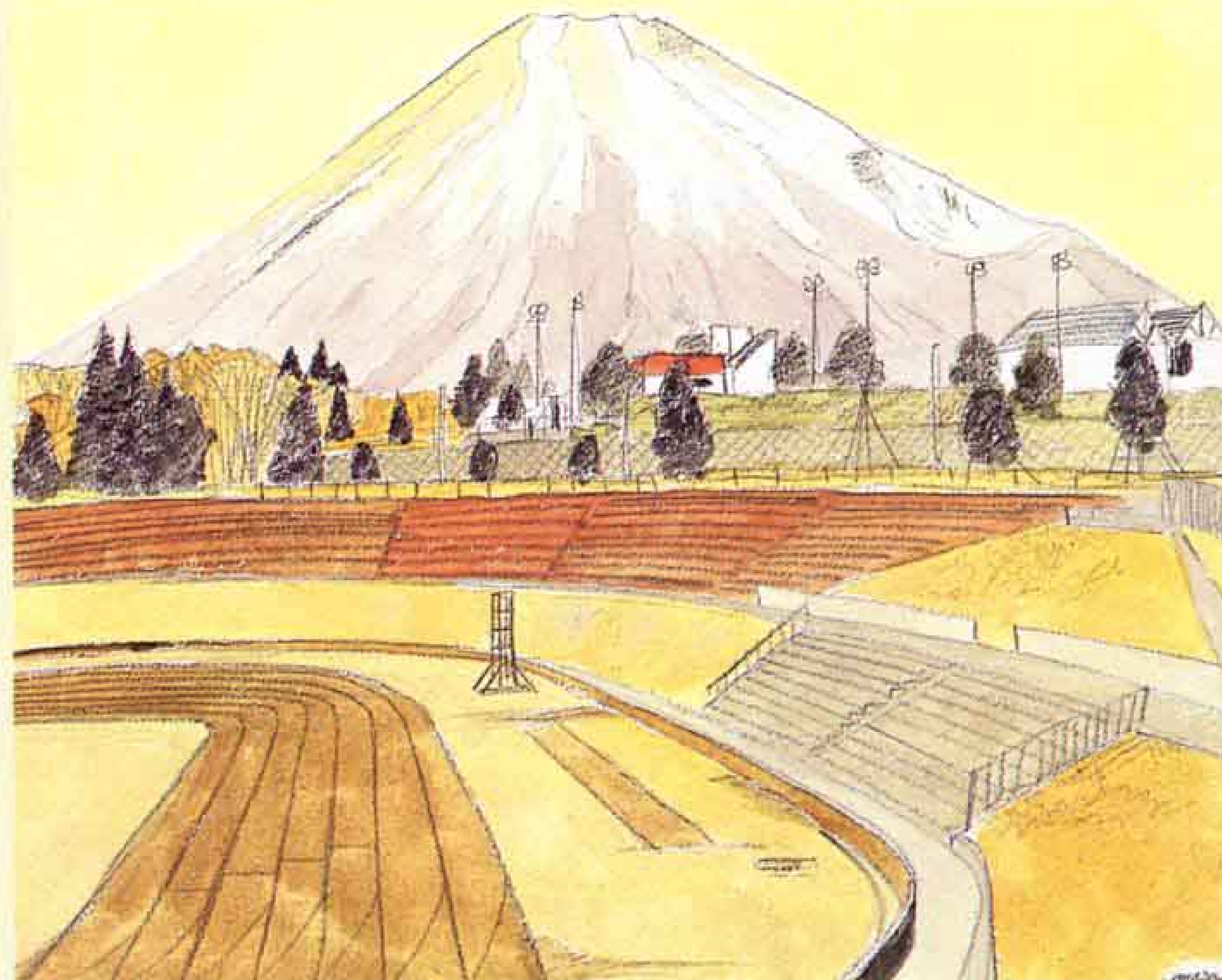
水彩画 “総合運動公園からの富士”

「富士山をめぐるすそ野は広い。変化に富む景を添えると、無限の新鮮さと雄大さを覚えます」