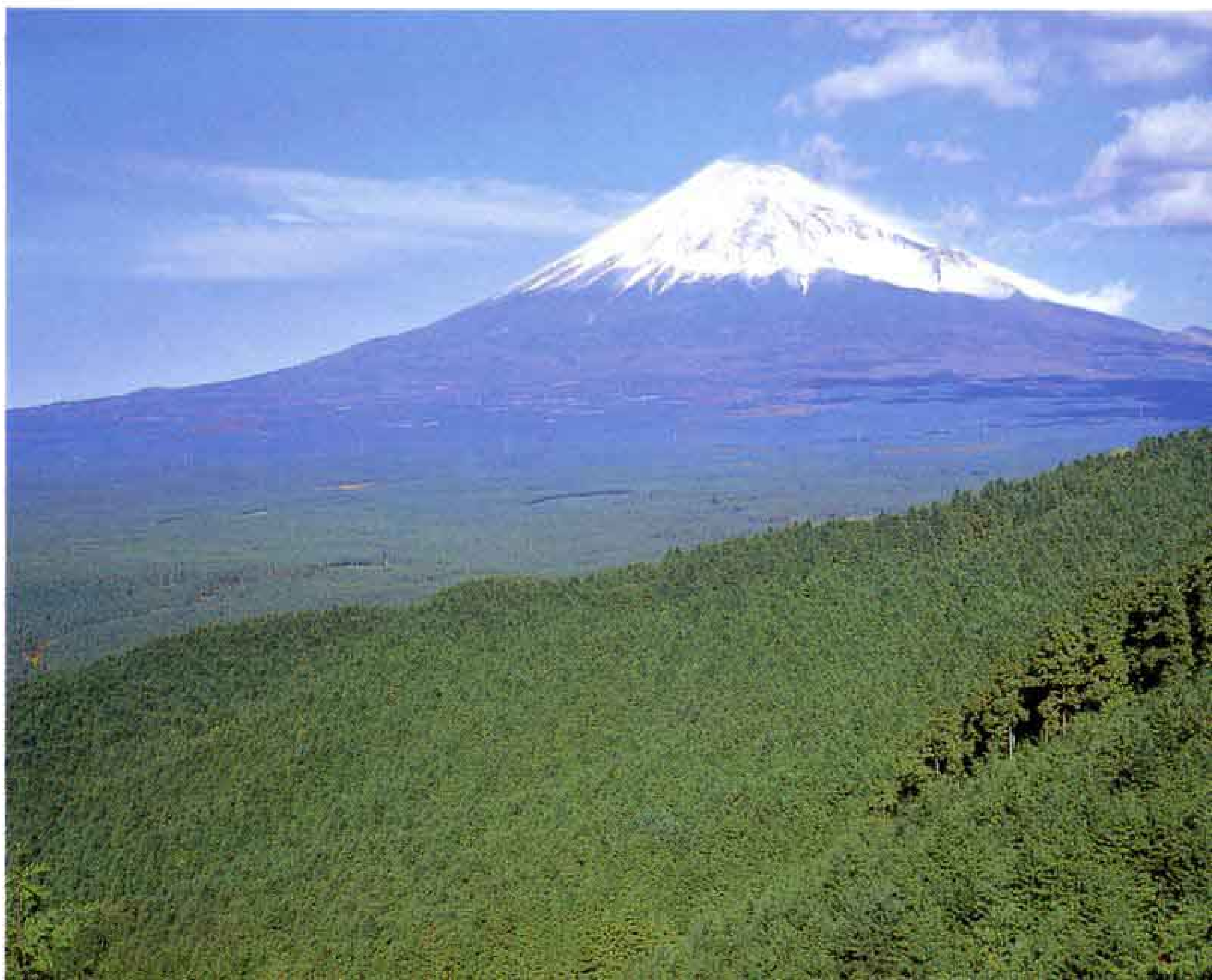
▶ かざき 桑崎から見た富士山。ブナやカエデなどの自然林(奥)とヒノキの人工林(手前)

もし富士山がなくなったら、今の富士市はなかつたでしょう。富士山は富士市の源なのです。それなのに、私たちは、その大いなる自然を壊してはいないでしょうか。私たちは、未来のためにも、富士山に感謝と敬愛を込めて、その自然を守つていかなければなりません。富士市は、ことし新市施行三十周年を迎えます。富士市が、今後ますます発展していくよう、雄大な富士山も温かく見守つていてくれることでしょう。