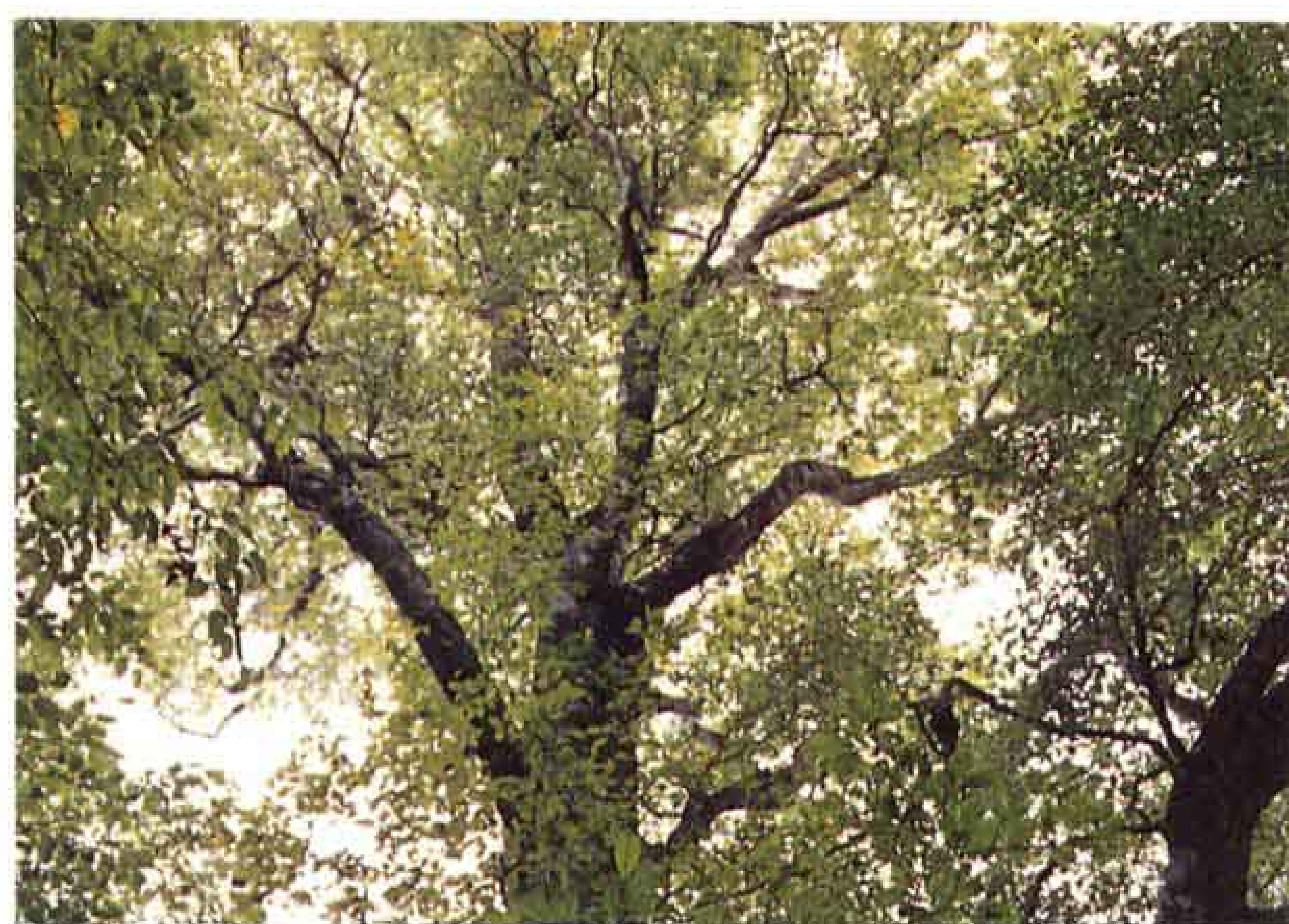
▲富士山2合目付近のブナ林

富士山ろくに広がる森林。富士市の面積の約半分は森林が占め、富士市は緑あふれる街なのです。そのほとんどは、ヒノキや杉の人工林ですが、自然林も残っています。特に、富士山は標高差があるので、標高によつて、さまざまな植物が生育しています。中でも、丸火自然公園では、コナラやアラカシ、イタヤカエデなどの自然林が多く見られます。森林には、酸素を供給し、二酸化炭素を吸収する働きがあり、空気を浄化してくれます。また、洪水や土砂崩れを防止してくれるなど、森林は私たちの生活環境を守り、快適な環境をつくってくれる大切な資源なのです。