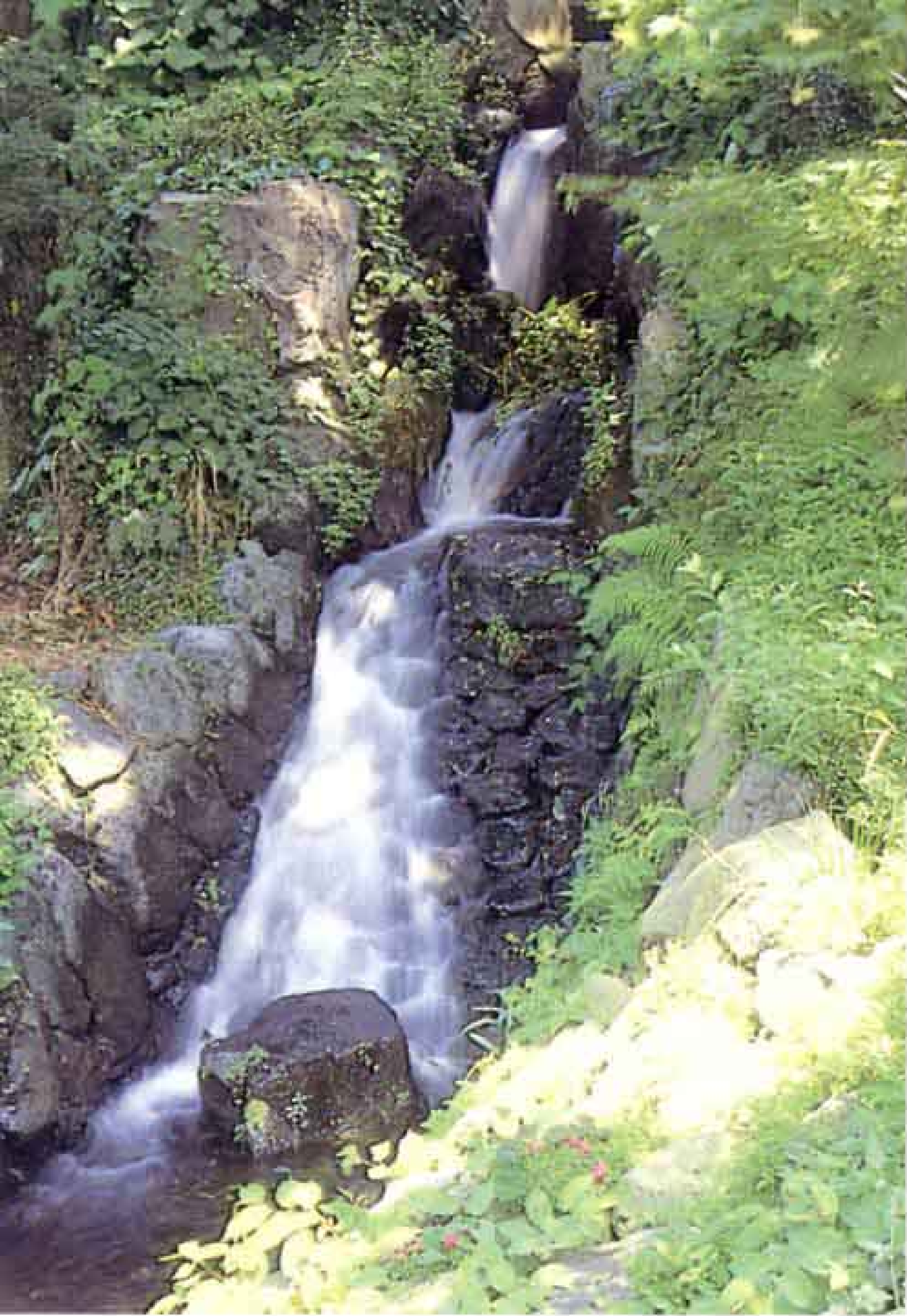
▲こんこんとわき出る水を利用してつくった原田の「 よろいがふち 鑑ヶ淵親水公園」。夏の夜空には、蛍も舞います