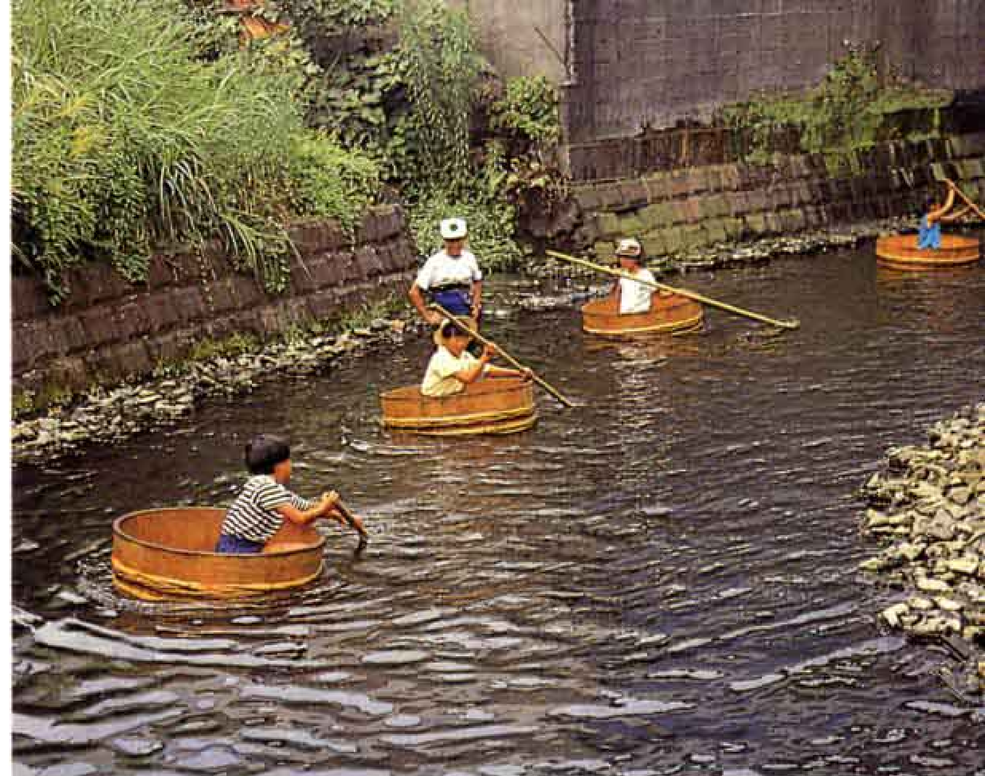
▼この田宿川には、わき水があふれ出ています