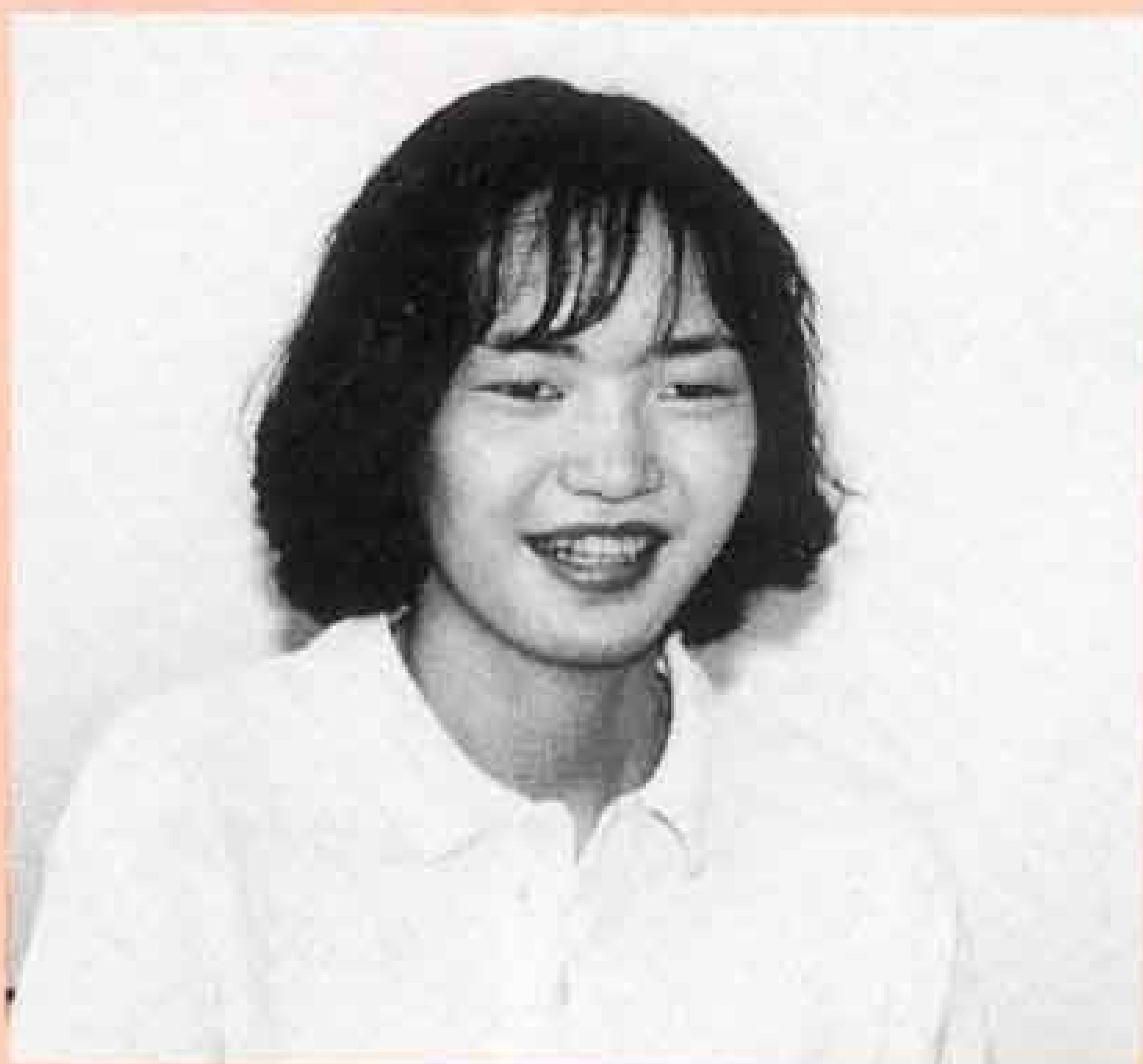
在宅介護支援センター「ヒューマンライフ富士」

デイケア以外にも、いろいろな福祉サービスがあるんですね。どうせなら、もっと早く市役所や支援センターへ相談に行けば、母を入院させてしまったら、そんなに悩んだりしなくてもよかったのかもしれない。とにかく、多くの人に助けていただいたおかげで、母の状態も回復してきました。これからも、みんなで力を合わせて頑張っていければ、と思っています。