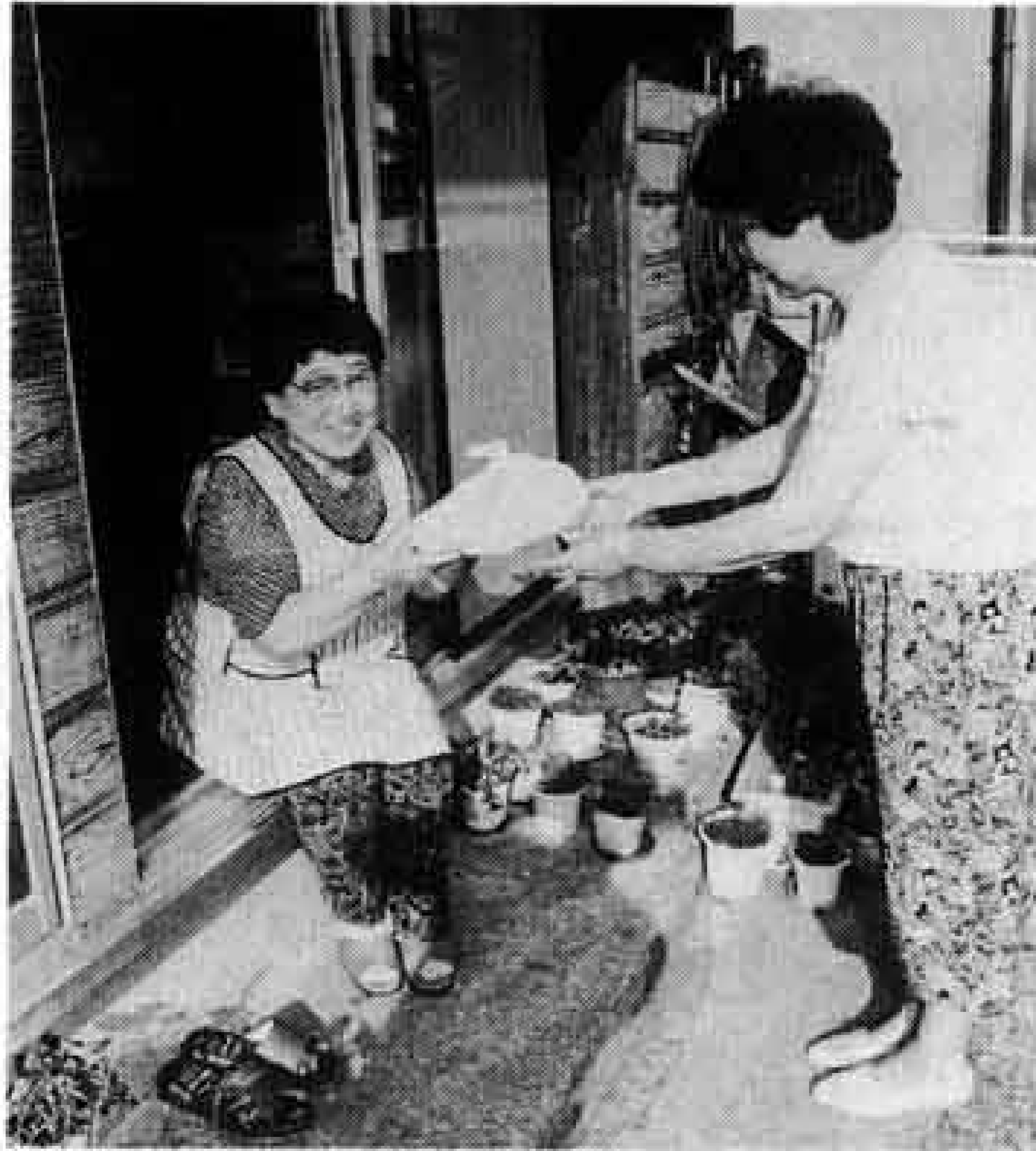
地区福祉推進会に関する問い合わせは 社会福祉協議会 ☎64-6600

地区福祉推進会は、小学校区を単位とした住民の組織です。市内には、現在富士南、富士見台、今泉、吉永、天間、須津、岩松、富士駅南（発足順）の八地区に福祉推進会があります。