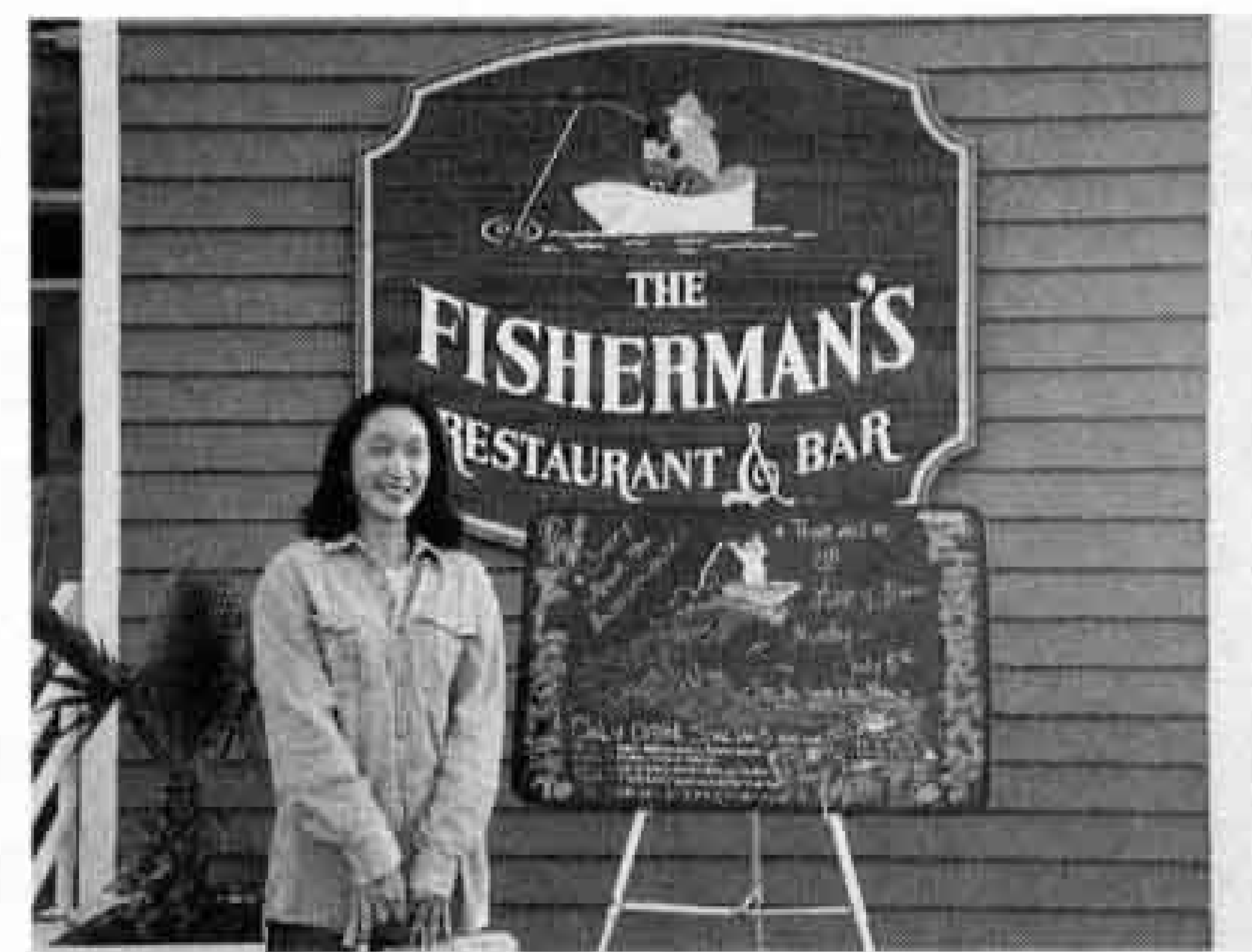
△桟橋の先にある市営レストランの前で

友好の翼では、普通の海外旅行では行けないような場所へも行くことができました。オーシャンサイド市役所で市長にお会いしましたし、そのほか警察、教育委員会、小学校を見学。小学校はちょうどサマースクールで、障害児と健常児と一緒に勉強していて、驚きました。日本では考えられないよう