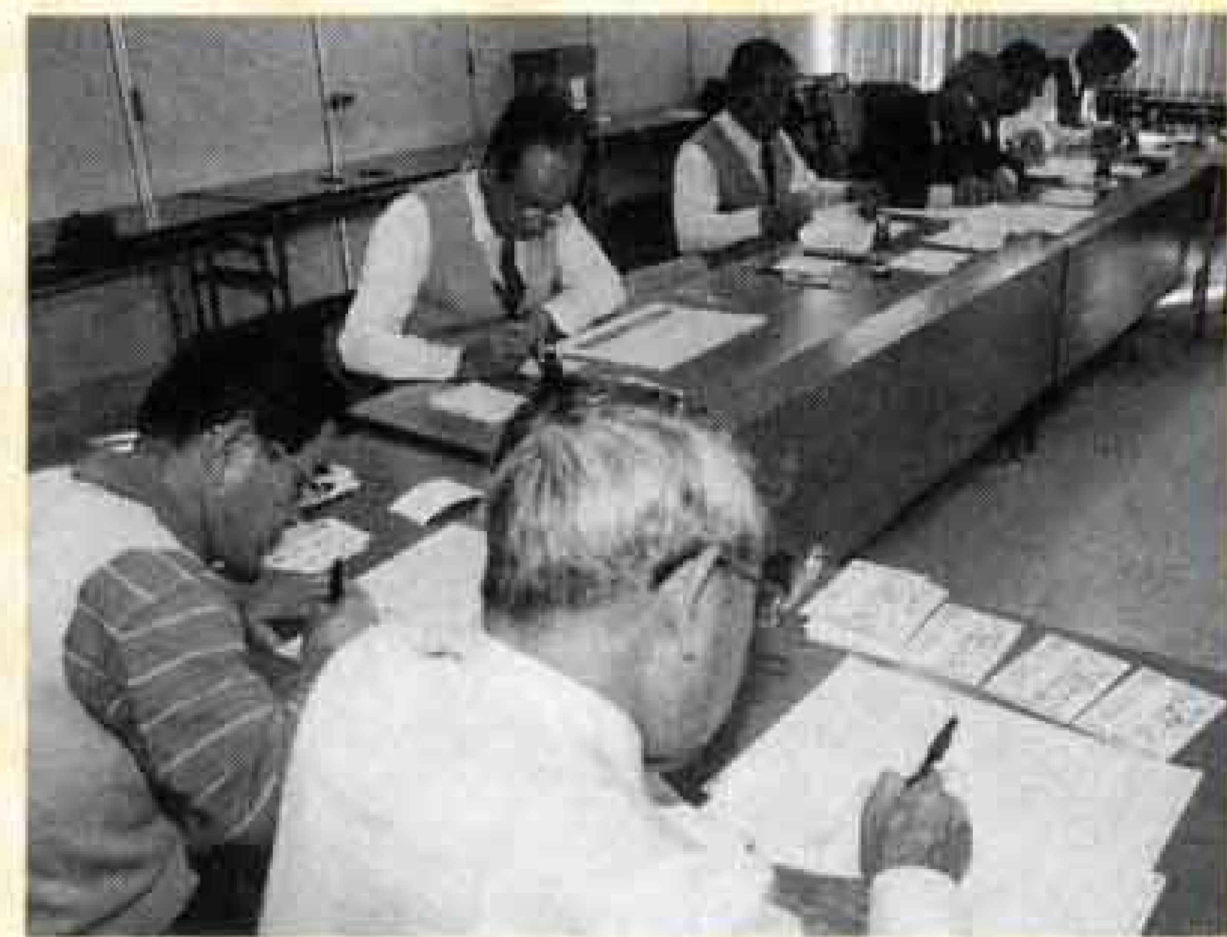
△新成人へ投票を呼びかける手紙を送りました

けで社会が変わるなんて思えないと思うかも。確かに一票の重さはなかなか目に見えませんが、しかし、皆さんの新しい意識が反映された一票一票が、私たちの代表者を選び、政治や生活のあり方を決めていきます。ですからこの権利を大切に、自分の信頼する候補者に投票することが、とても重要だと思いませんか。 選挙の投票率は、全国的な傾向で低下してきています。富士市でも、特に若い有権者の投票率が、非常に低い状態です。若い人の政治や選挙への関心が、あまりないのではないのでしょうか。しかし、二十歳になったからには、もう人ごとだなんていつてられませんか。身近な問題として、政治に参加していきましょよ。