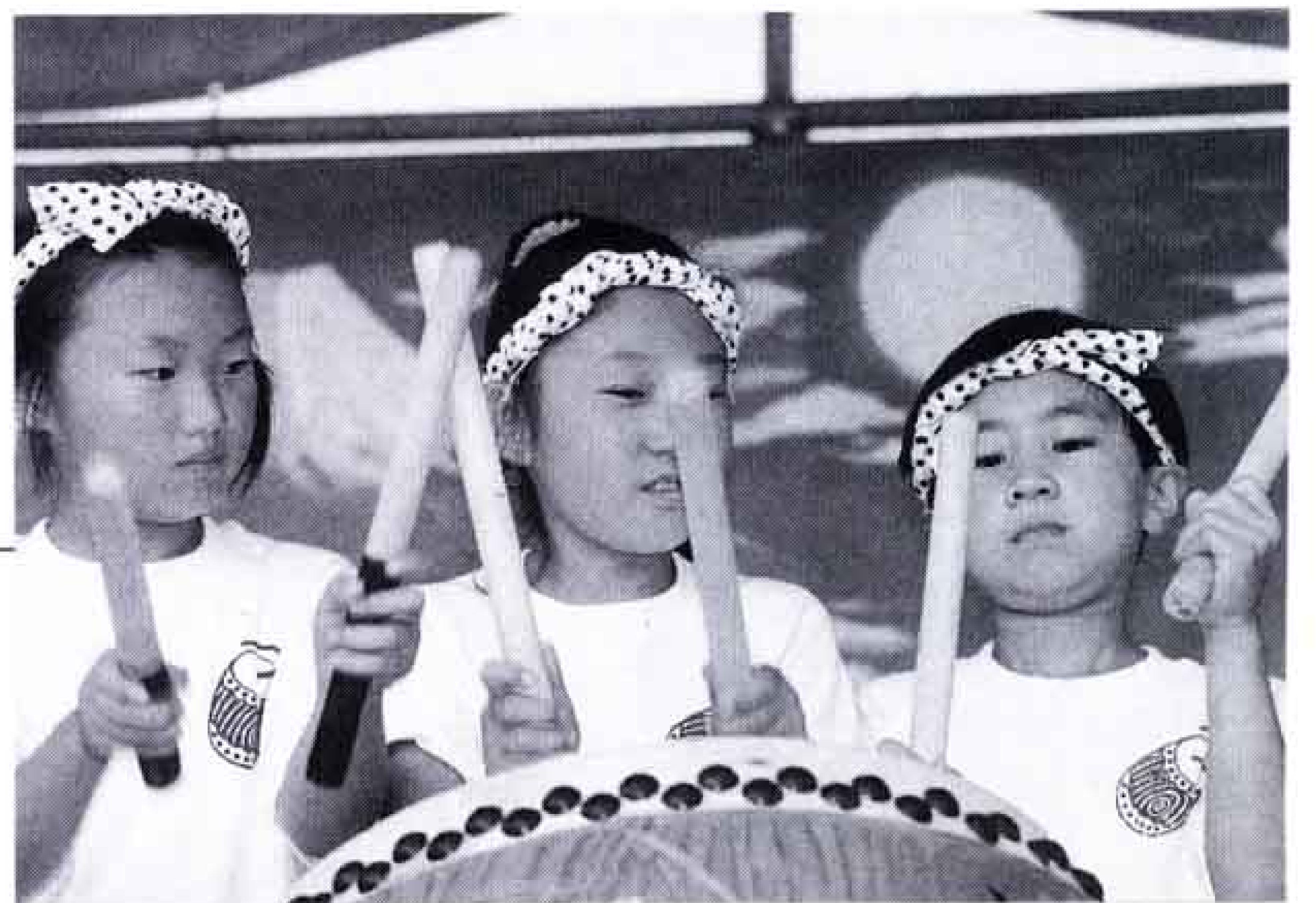
△さあ練習どおりがんばろうネ!

富士駅南地区では「小木の里まつり」。地区外からの参加もあり1万8千人の人出。新しく「小木の里太鼓」も登場。祭りに花を添えました。