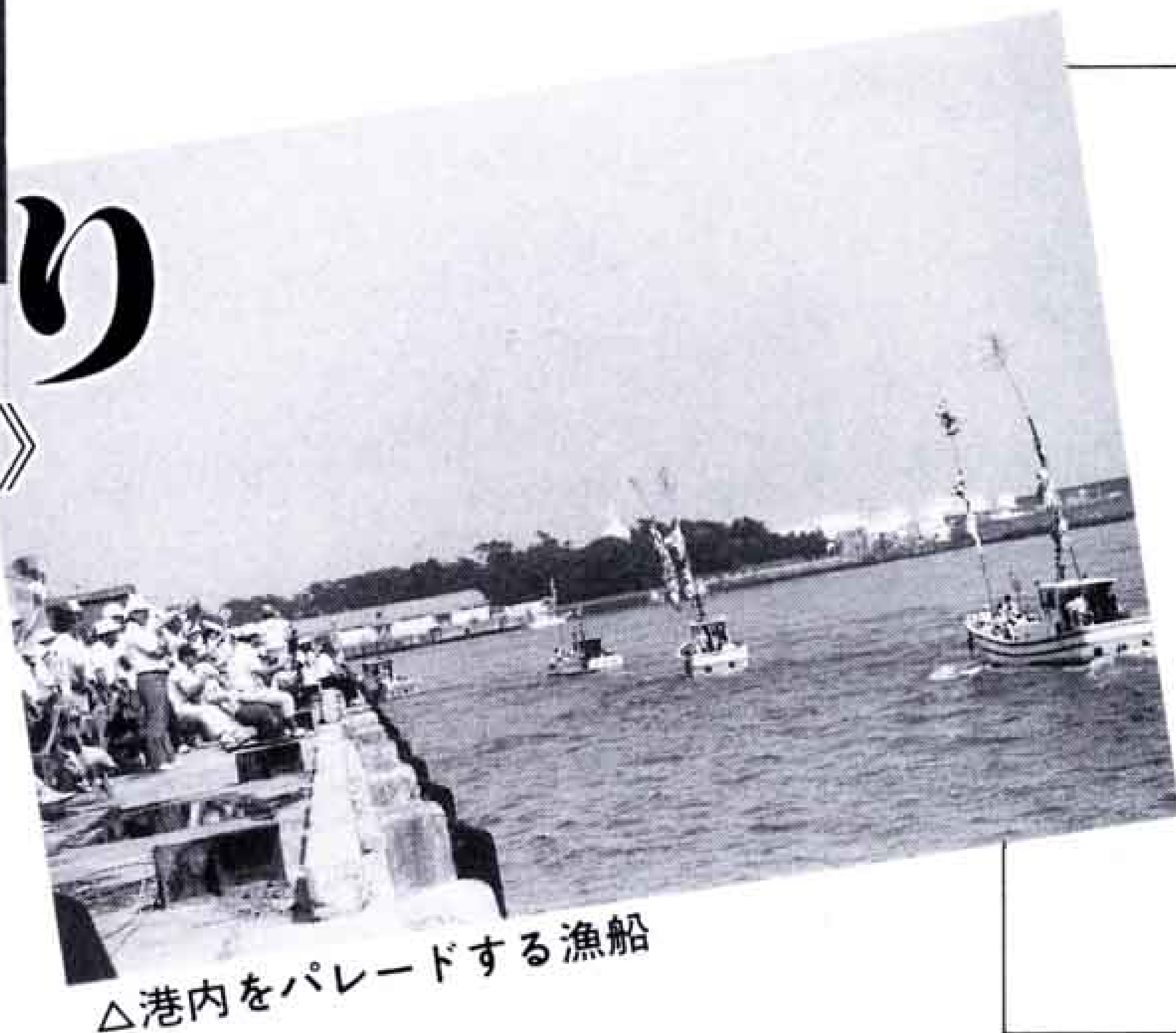
△港内をパレードする漁船