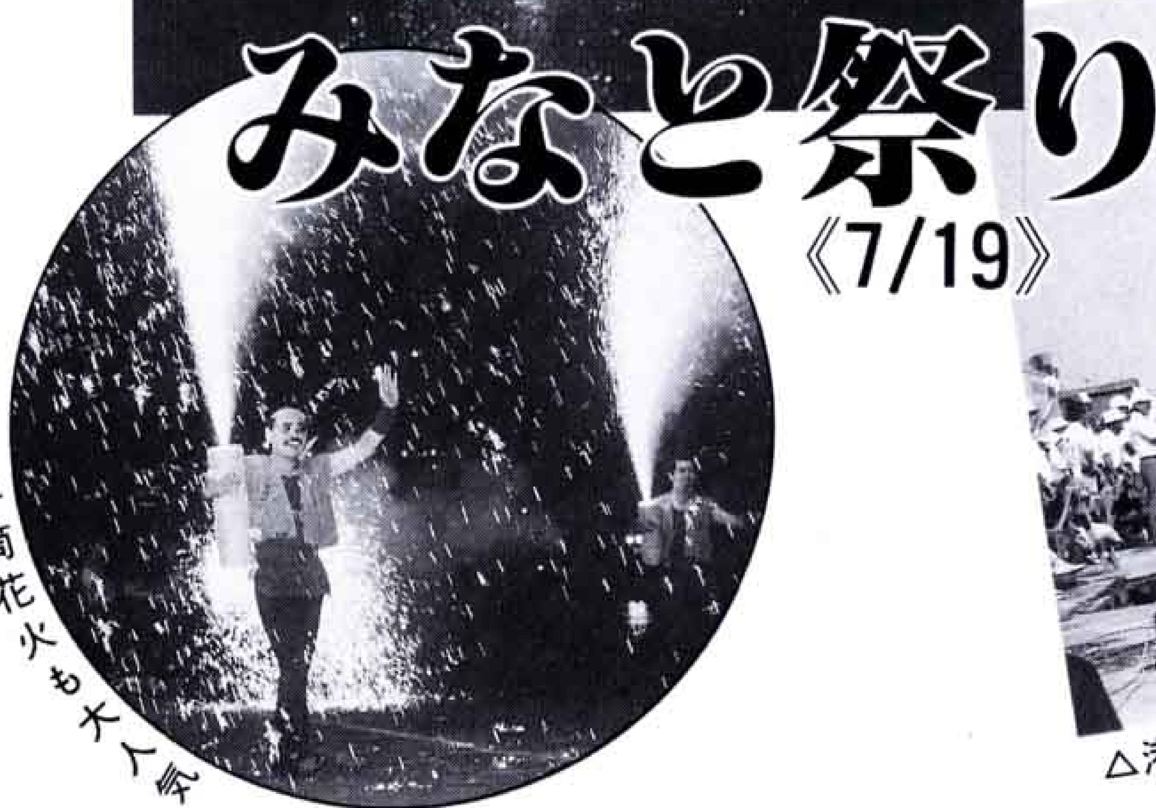
手筒花火お大人版