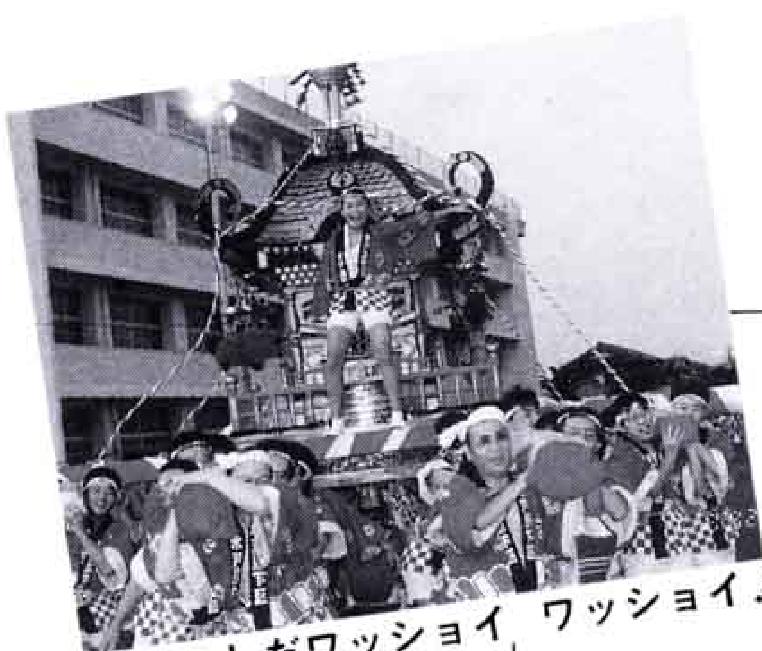
△みこしだワッショイ ワッショイ!

富士駅南地区では「小木の里まつり」。地区外からの参加もあり1万8千人の人出。新しく「小木の里太鼓」も登場。祭りに花を添えました。