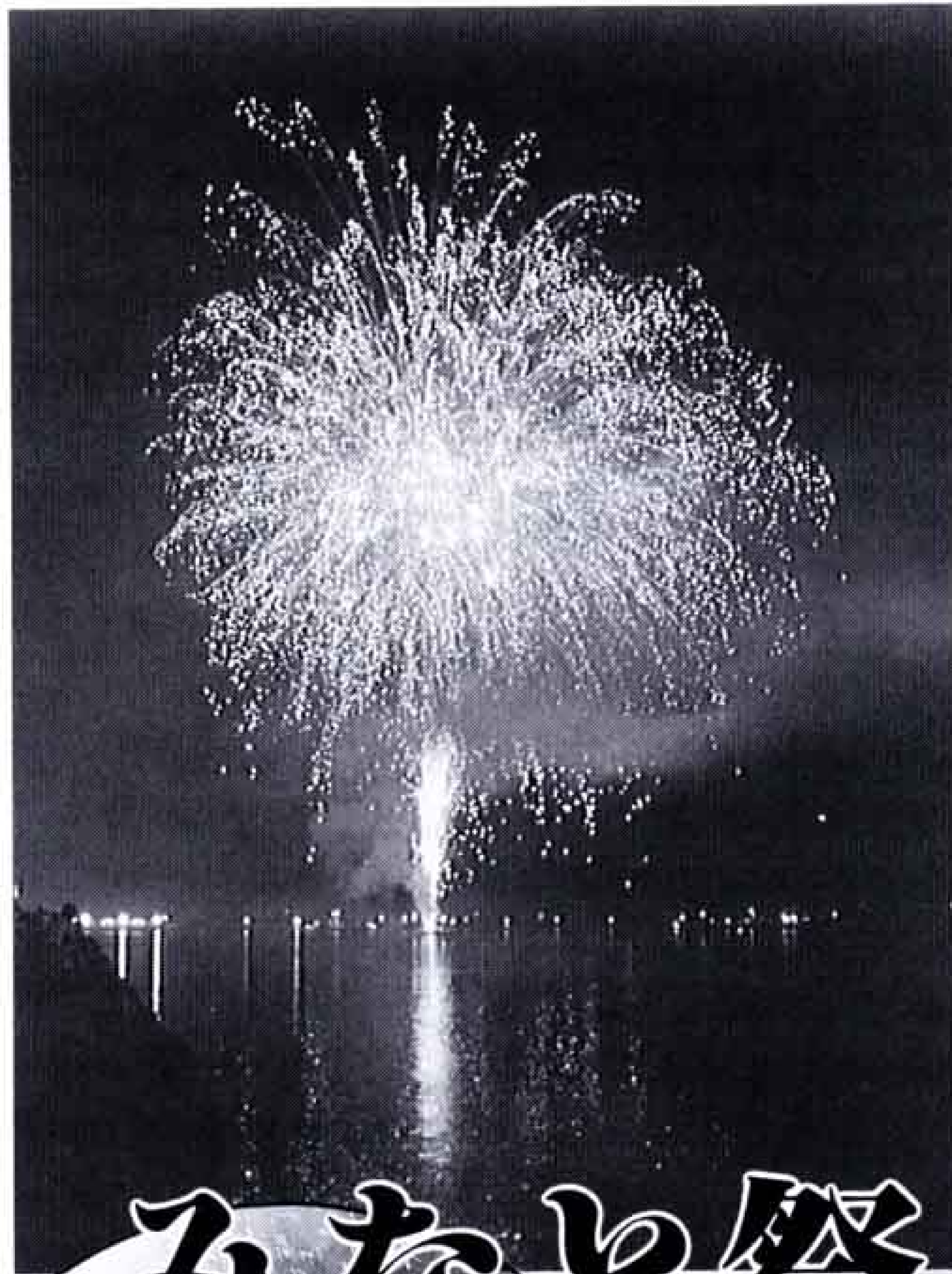
水上火火はまた格別