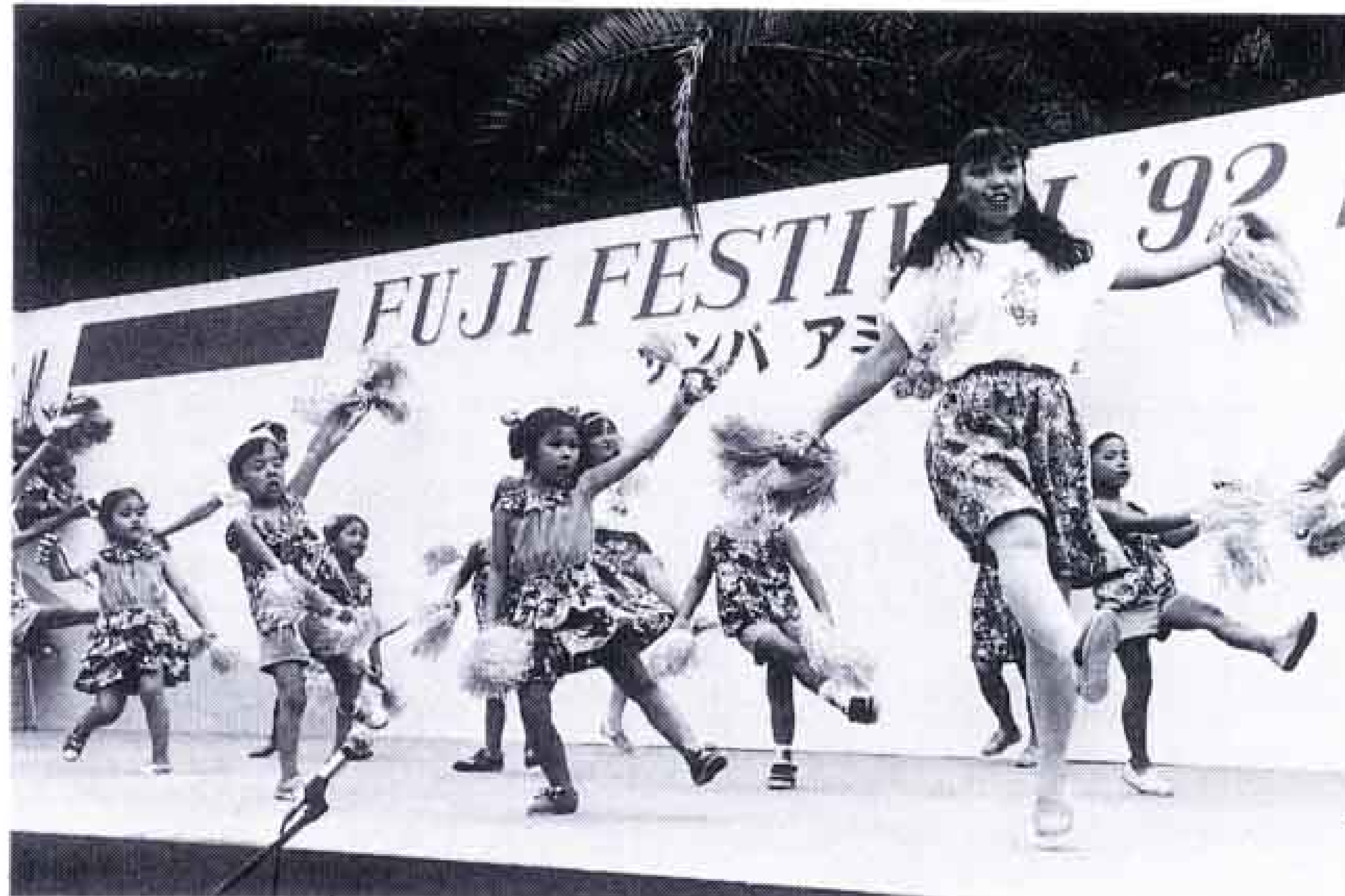
△さあ元氣よくサンバアミーゴ

7月は、お祭りの多い月。特にことしは「みなと祭り」も行われ、祭り好き、花火好きの富士っ子にはこたえられない月となりました。