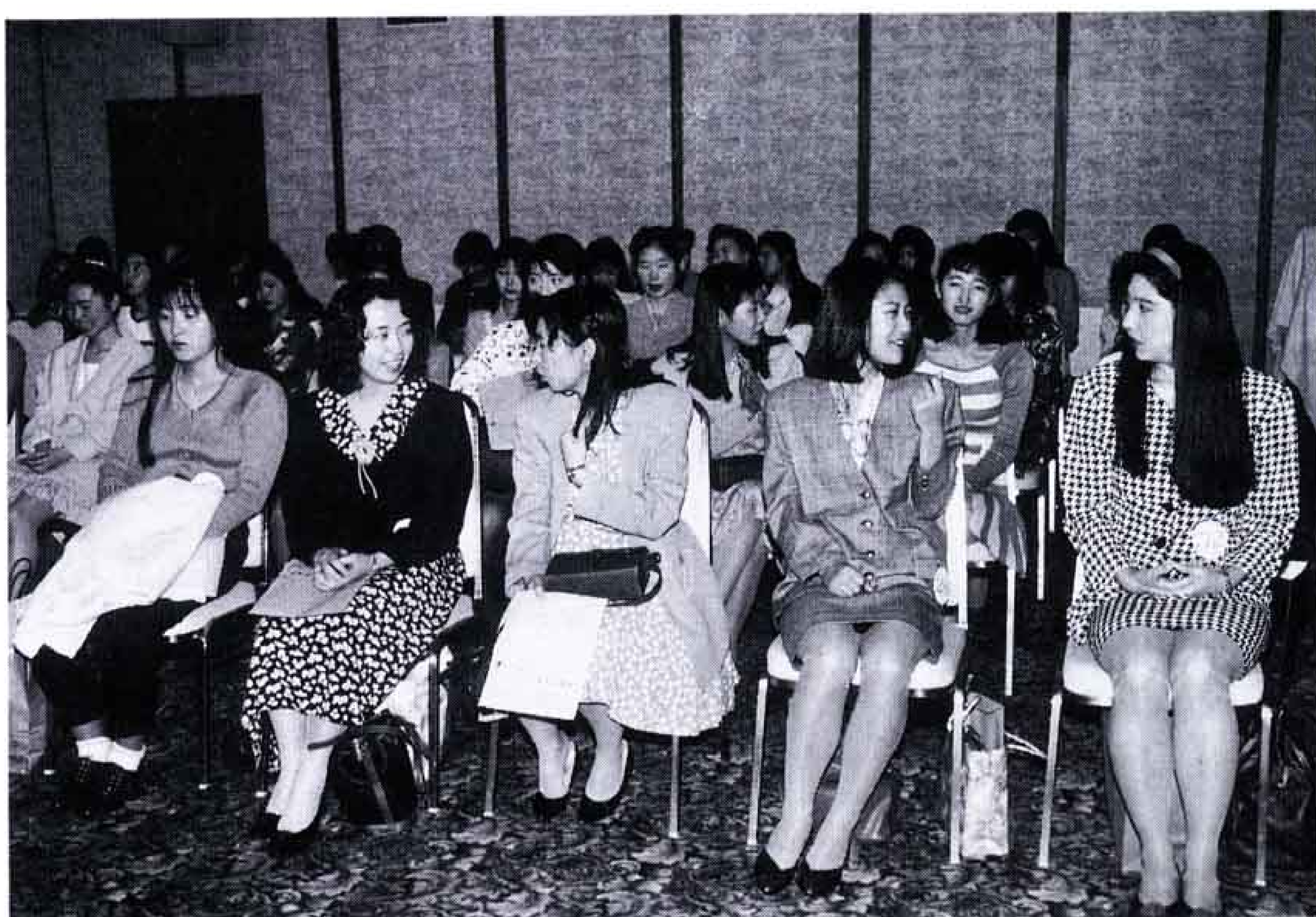
△一次審査が終わり、緊張から解放されて