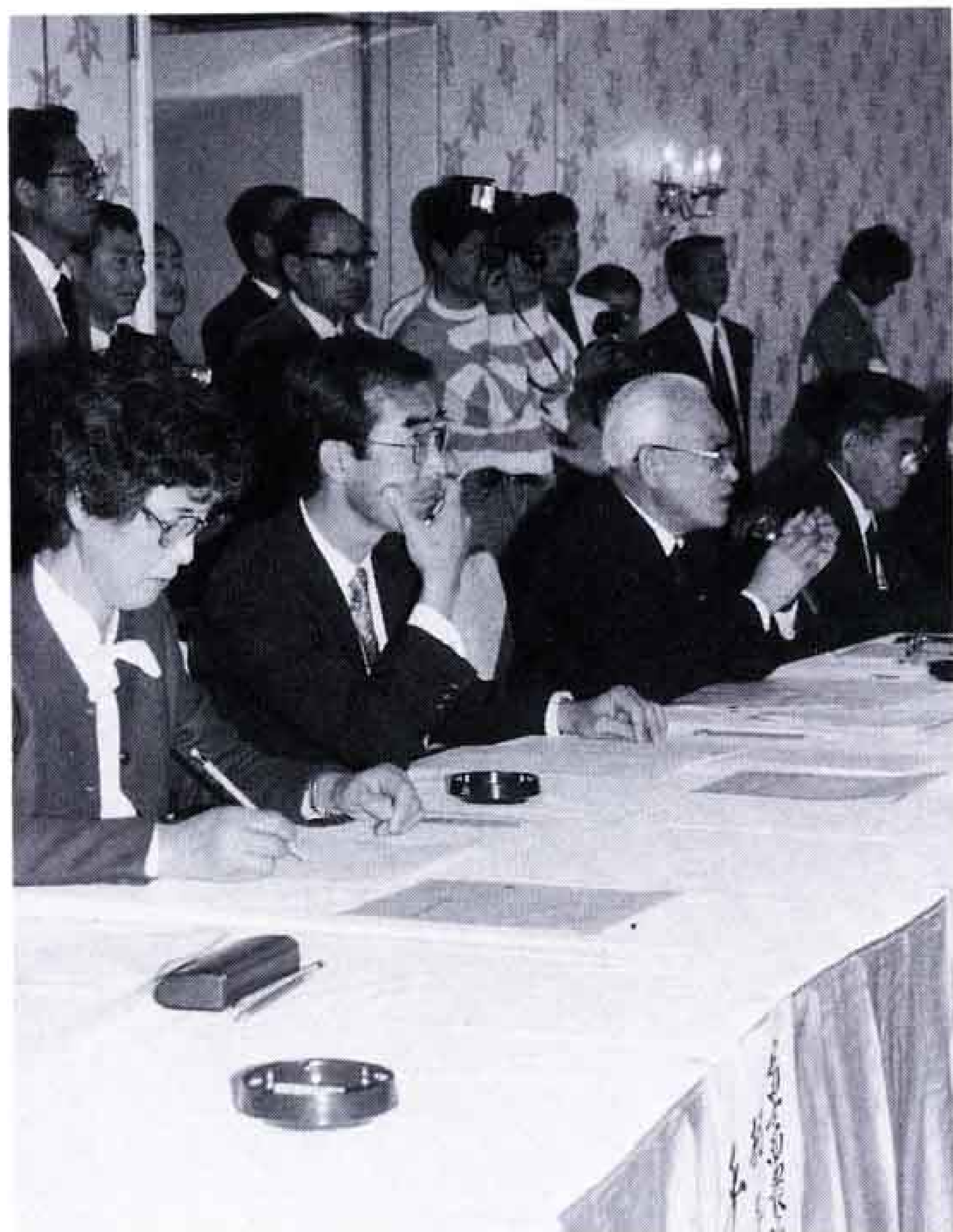
△う〜ん、みんな美人で迷うな