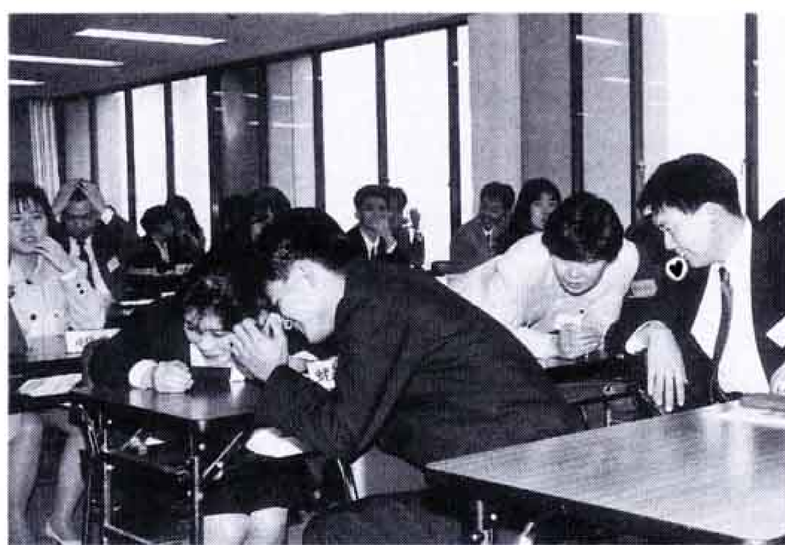
△言葉で正確に伝えるのは難しい(伝達ゲーム)

四月一日から、市役所で新人研修が始まりました。研修生は九十五人。十四日間で市職員としての心構えなど、基本を学びます。市役所のお客さんは、主に市民の皆さん。そこで、研修の仕上げは「市民の声を聞く講座」。研修生たちは町に出て「憩いと触れ合いのある公園」「余暇時代を迎えた公民館の役割」など、六つの大きな課題について、利用する皆さんのご意見を伺いました。研修を終え、フレッシュな笑顔と声で対応する、新人の活躍にご期待ください。