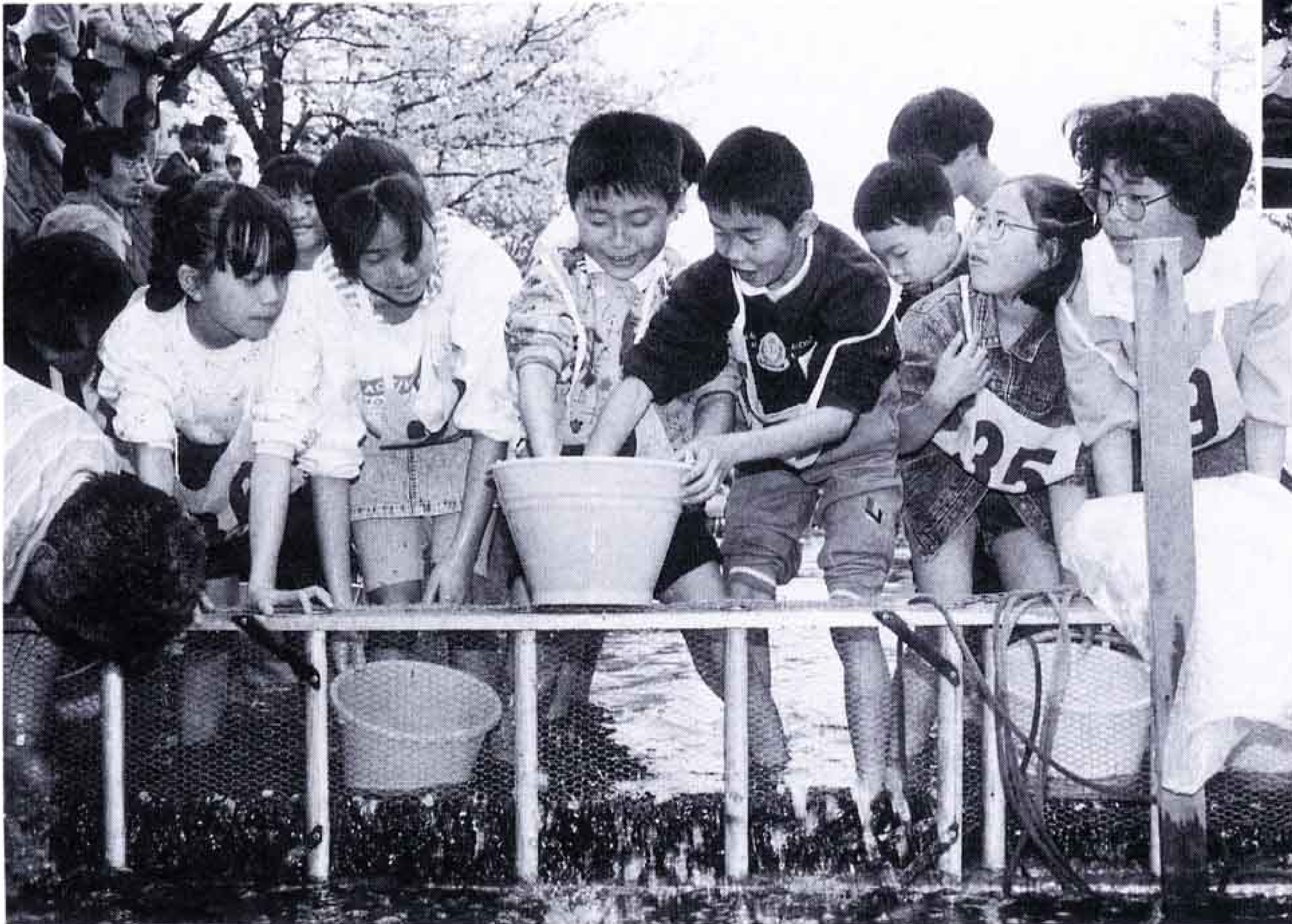
△「やった、つかまえたぞ」小潤井川をせきとめて、子供たちがウナギのつかみ取り