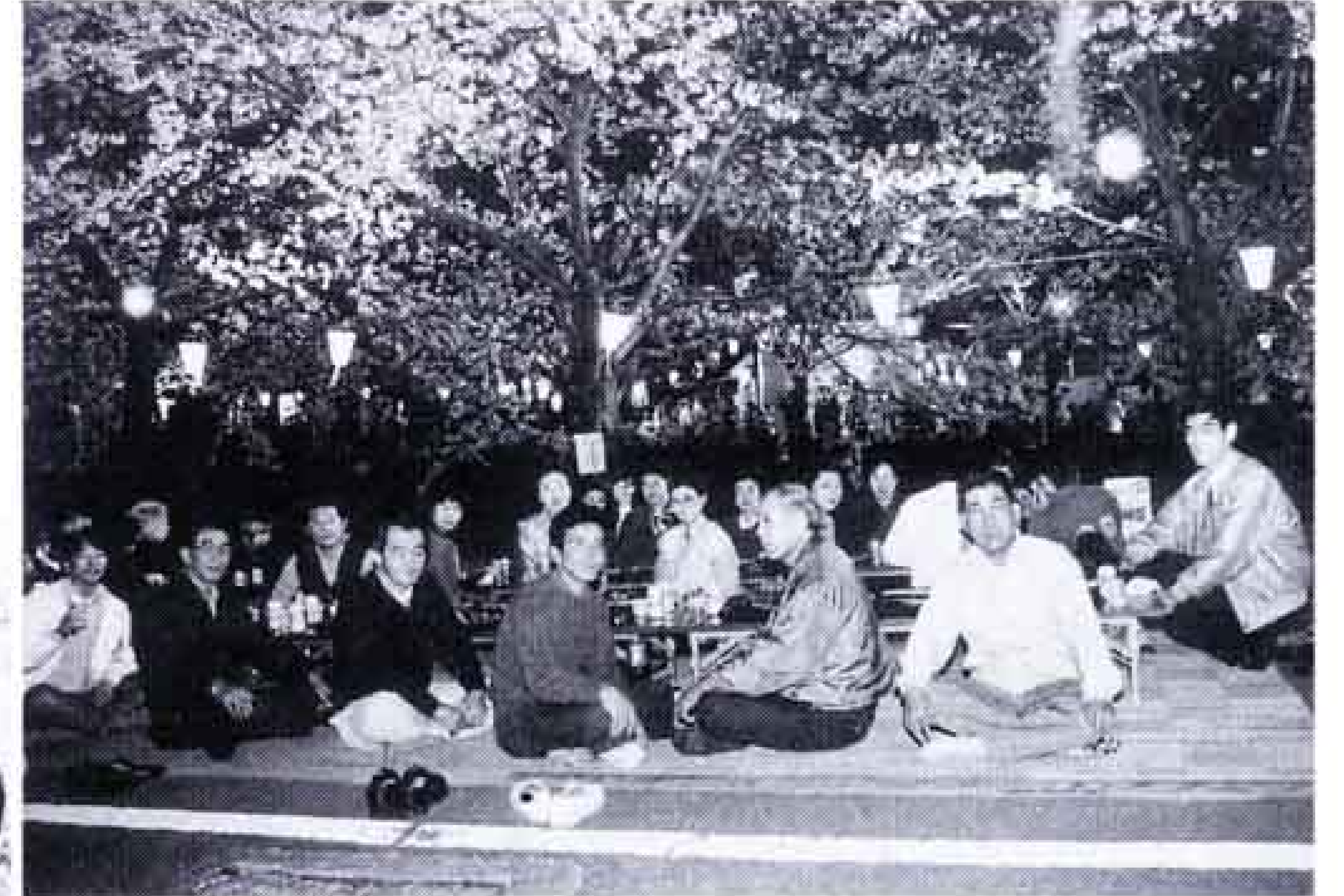
△緑町の人たちも机を並べて大宴会

第5回を迎えた祭。桜の開花を予想し、日を決定するのは大変難しいのですが、今年はピッタリ。満開の桜の下は、夜遅くまでにぎわいました。