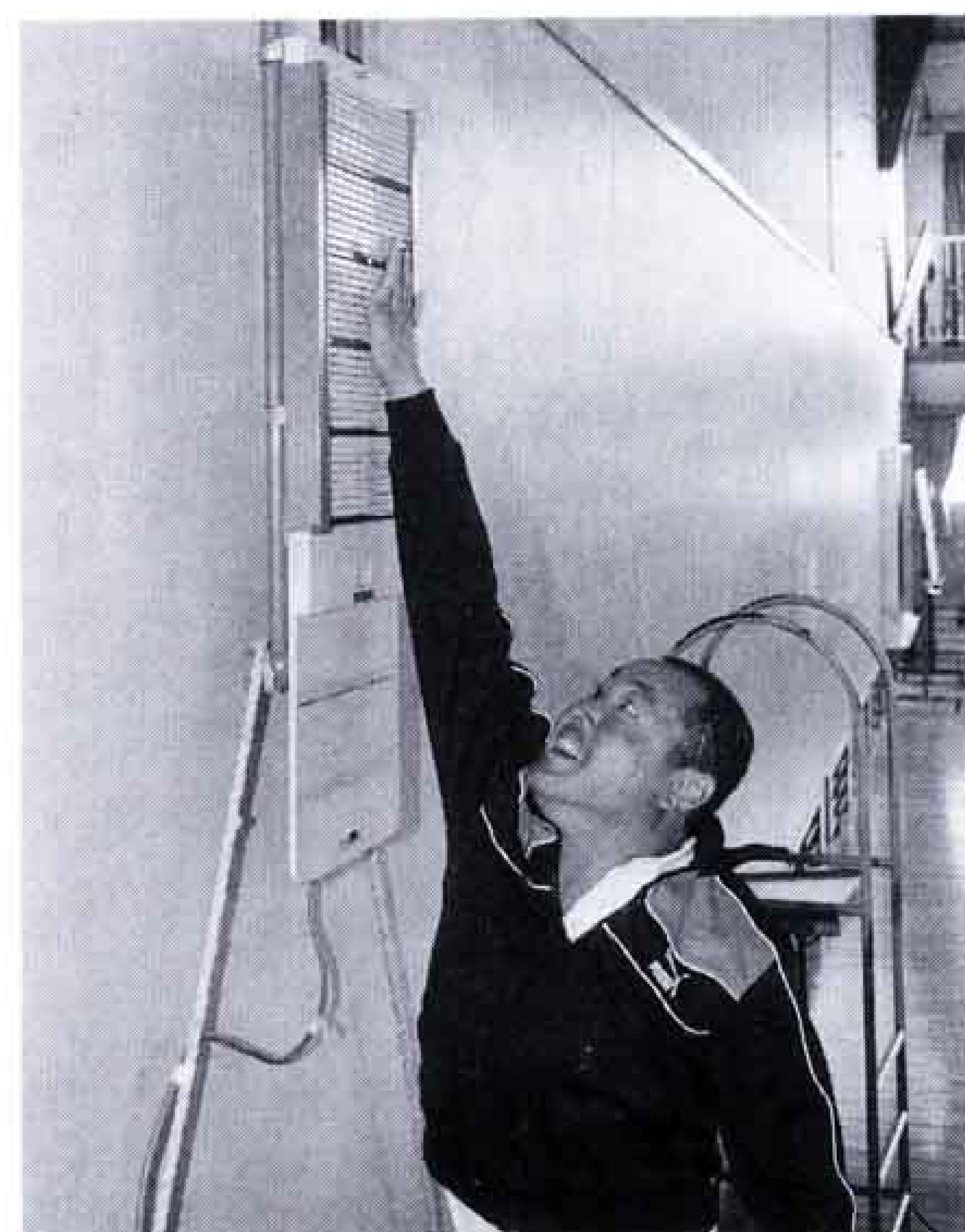
△垂直跳びは61センチが満点

市内一の健康づくりを旨とする今泉地区で二月二日に、体力と年齢を知る会が今泉小学校を会場に行われました。今年で八回目を向かえたこの会は、体力テストを通じて自分の体力を知り、健康増進に役立ててもらおうものです。参加したのは約百人。ほとんどの人が「疲れた」、「こんなに体力がないのかな」と口ぐちに言いながら、種目の一つひとつをこなしていました。