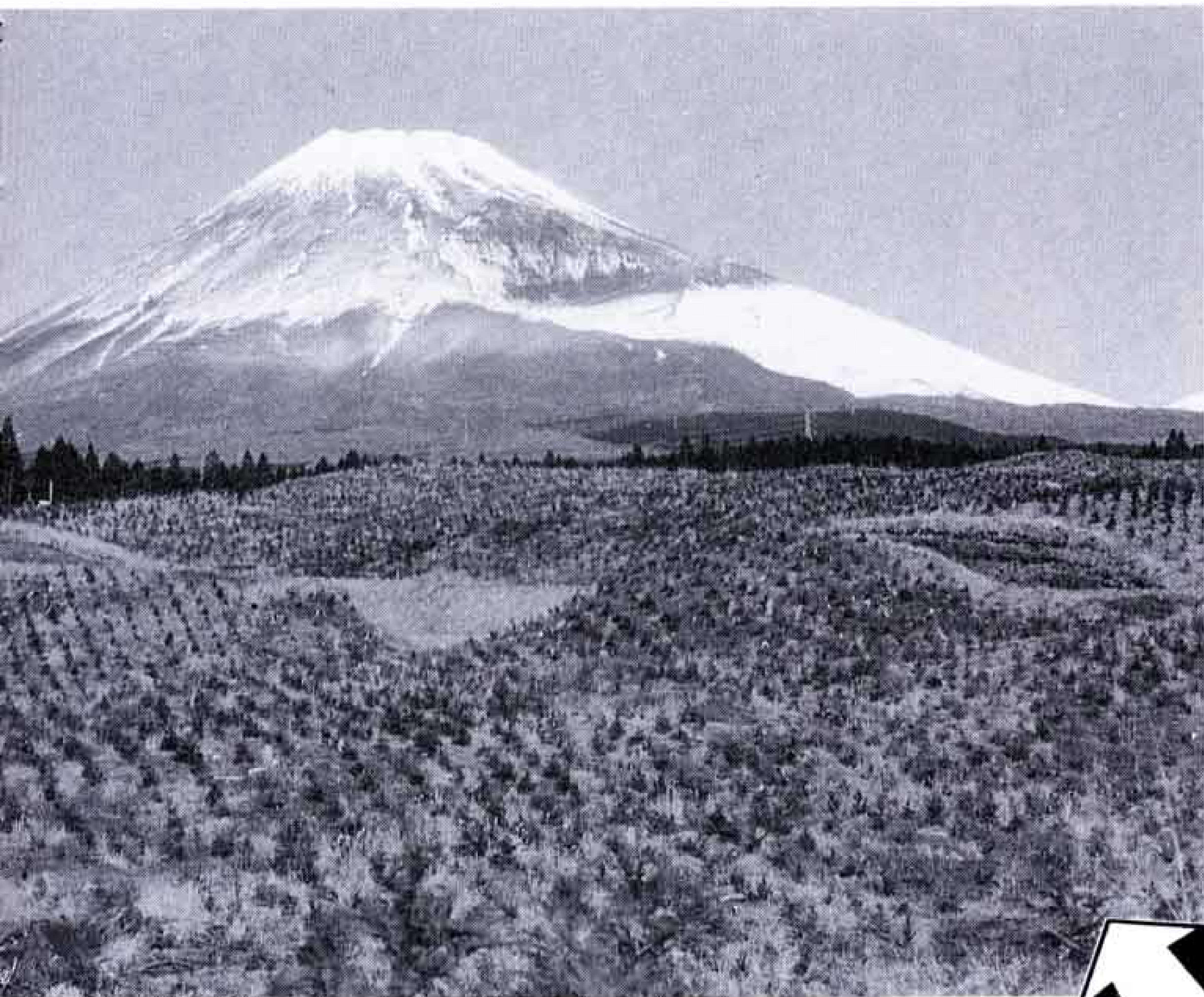
△雄大な富士山を目の前に見て（建設予定地）