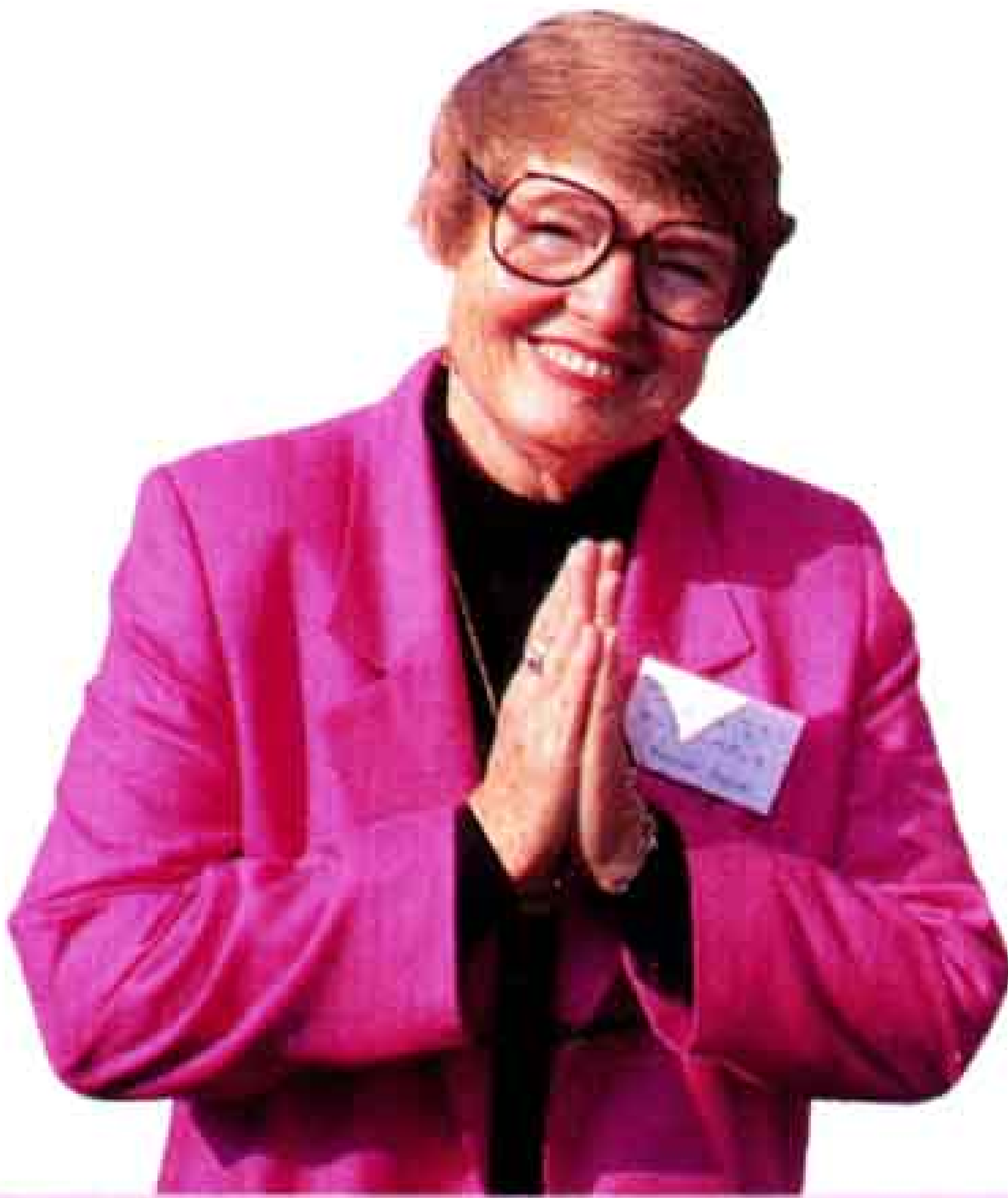
バグレイ市長夫人