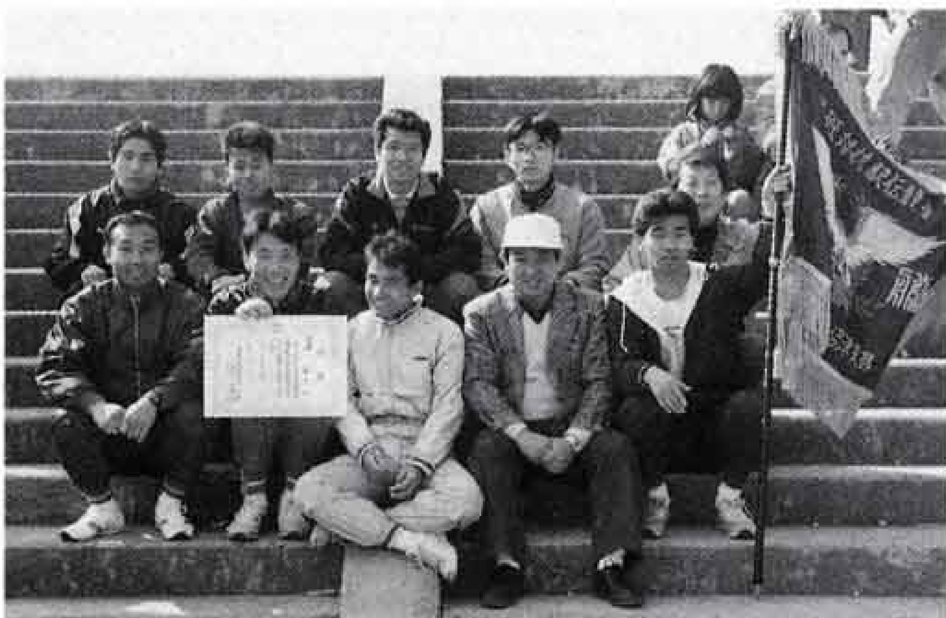
△優勝しましたハイ・チーズ

私たちは、東京電力(株)富士営業所の駅伝チームです。当面の目標は、2月に行われる社内事業所対抗駅伝大会の7年連続優勝です。40年の歴史があるこの大会で、過去6年連続優勝したチームはありますが7年連続は初の快挙となり、メンバーは張り切っています。