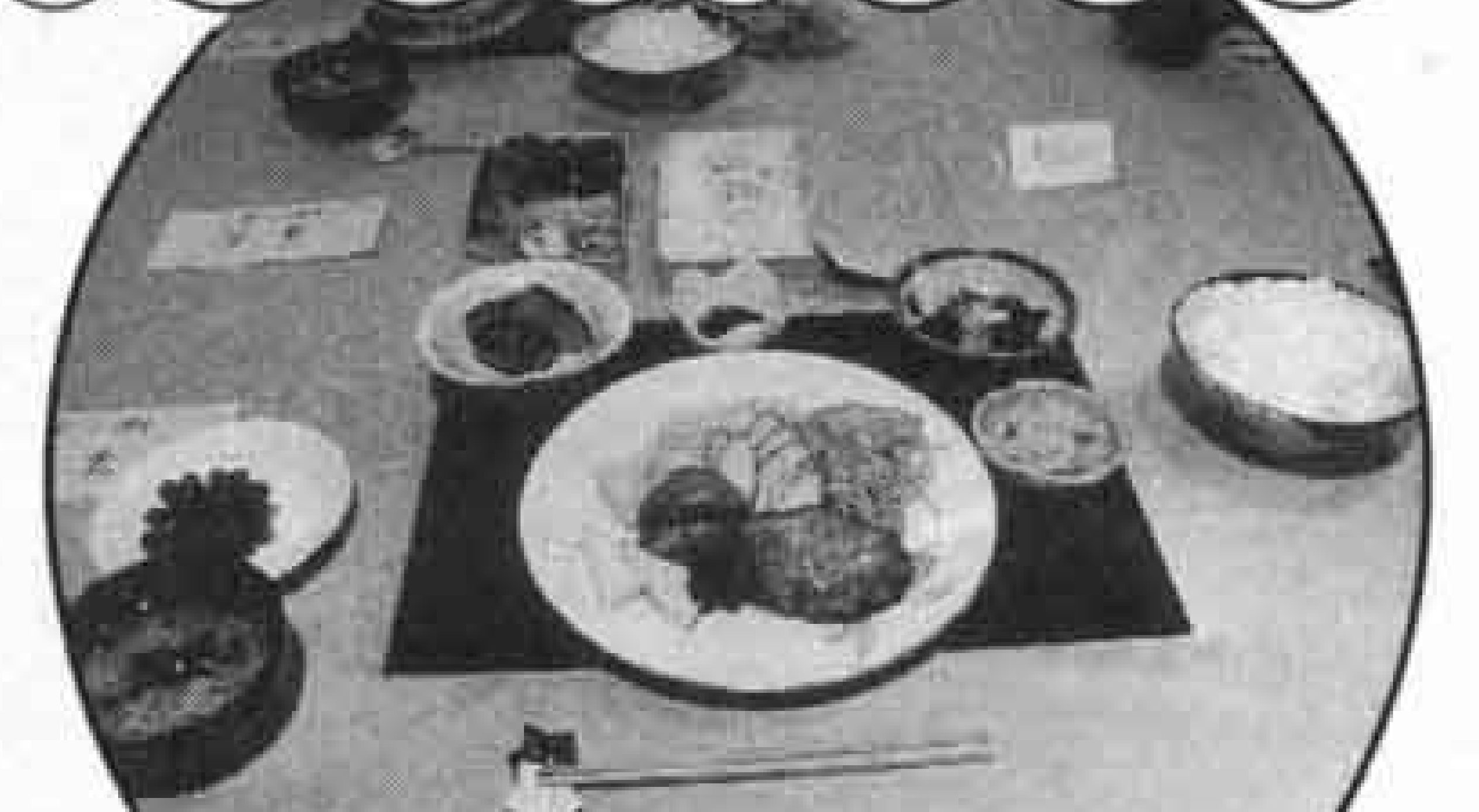
1日3食で約4,000カロリーあります