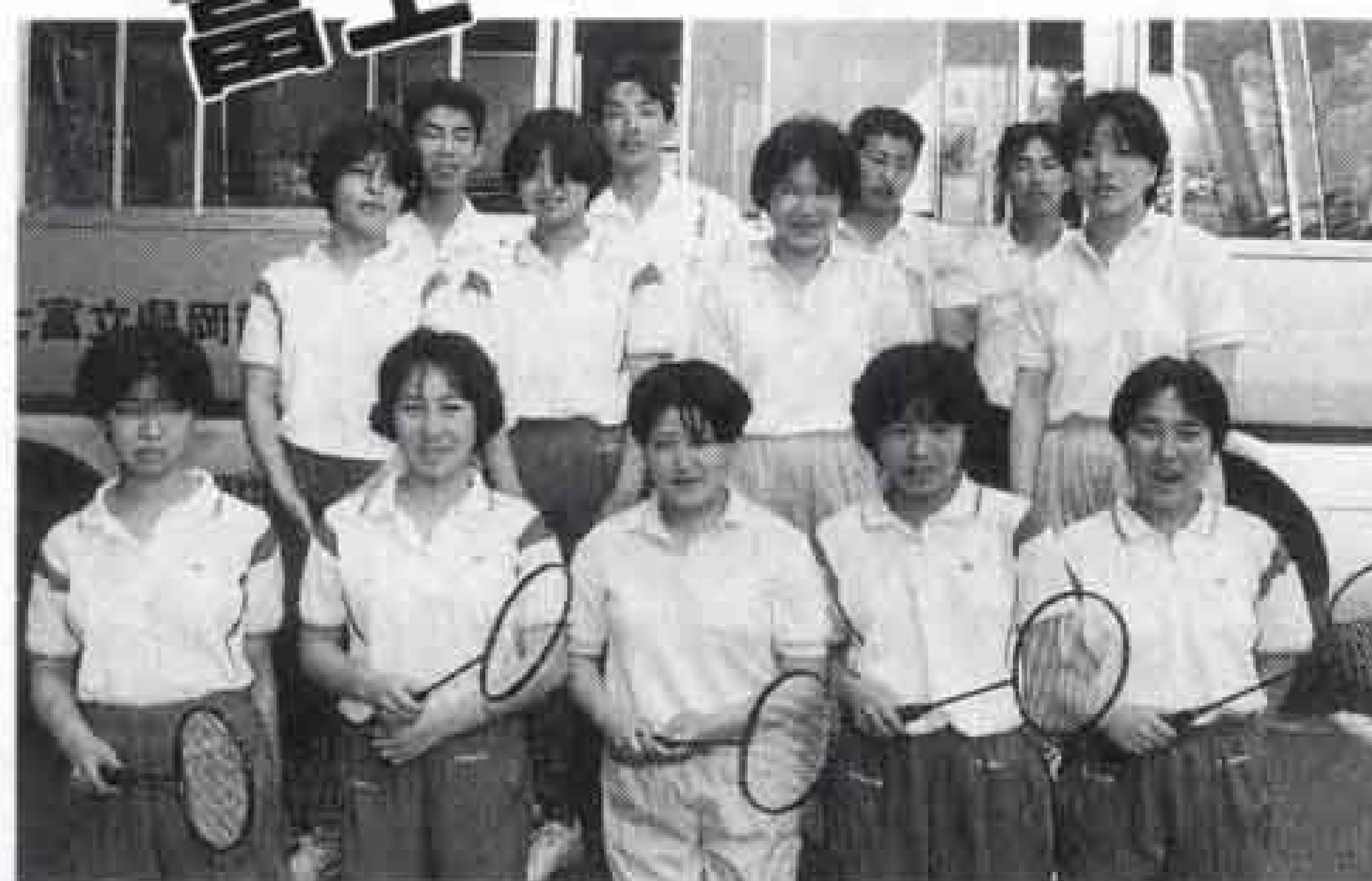
県代表として、富士、富士見、吉原工業高校が全国の強豪と競い合います