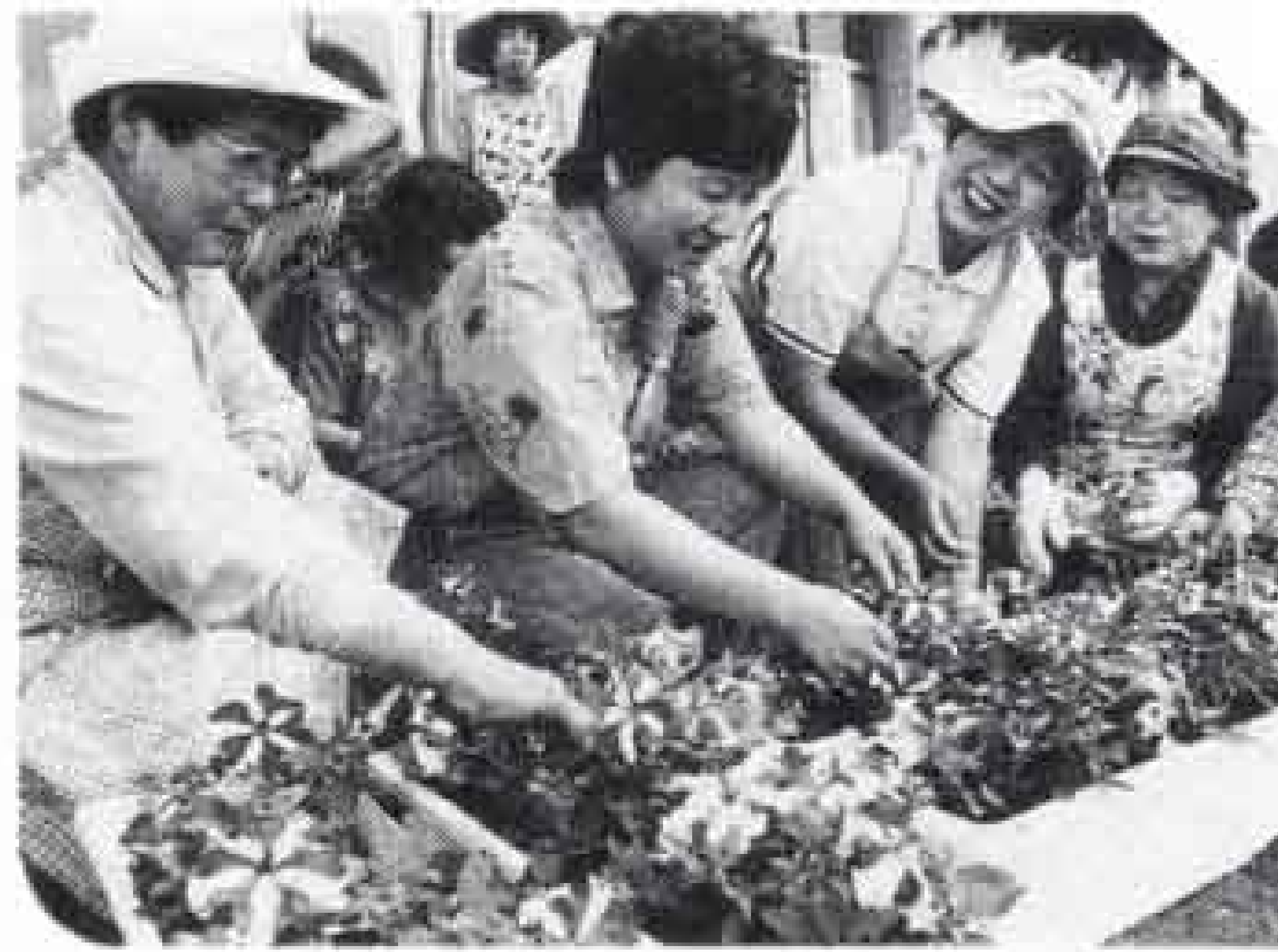
開花時期の調整に気を使います

競技会場や道路を花で飾ろうと、半年も前から準備をしている皆さんがいます。花の会は、新富士駅から富士体育館までの幹線道路を担当。二月の種まきから、プランターへの定植まで、毎日の世話が欠かせません。特に苦心するのが、開花時期を総体に合わせること。ルドベキアやペチュニアなどの花を、八月に一斉に咲かせるため、きょうも、会員の眼差しが花に注がれます。