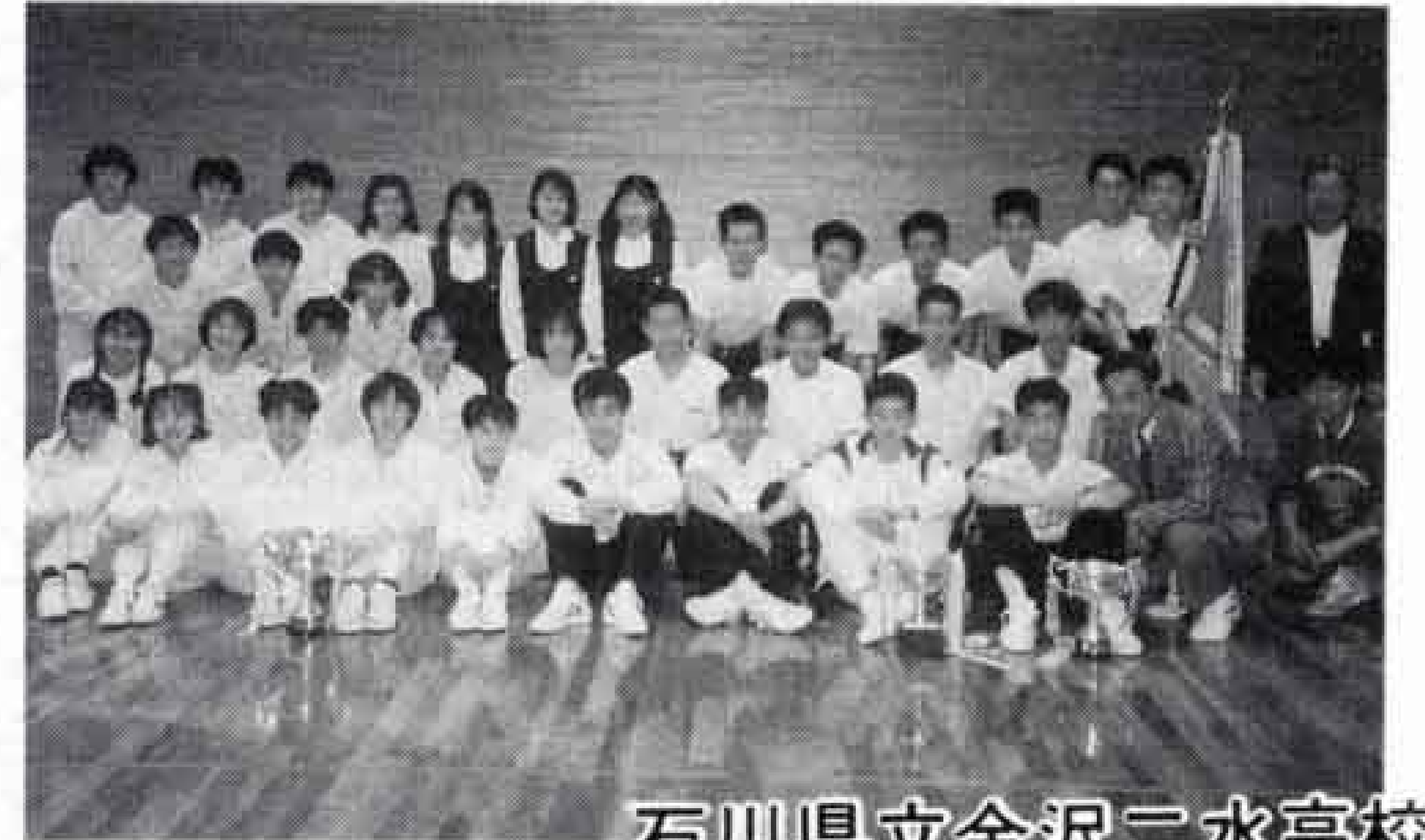
石川県立金沢三水高校