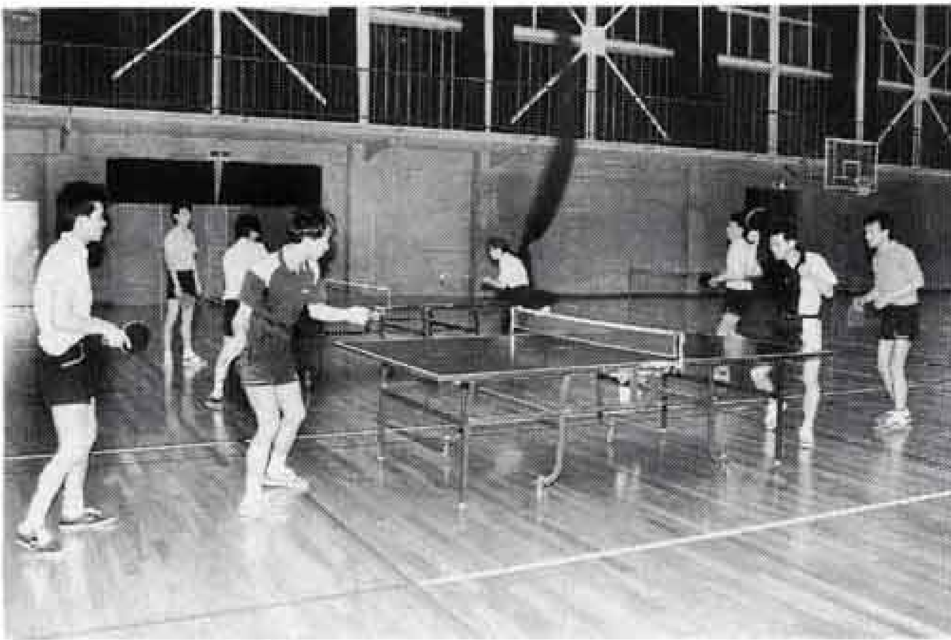
△試合も近い、ファイト

オレンジボールにブルーの卓球台。暗いと言われてきた卓球もファッションを取り入れ、ユニホームも鮮やかな色彩になってきました。