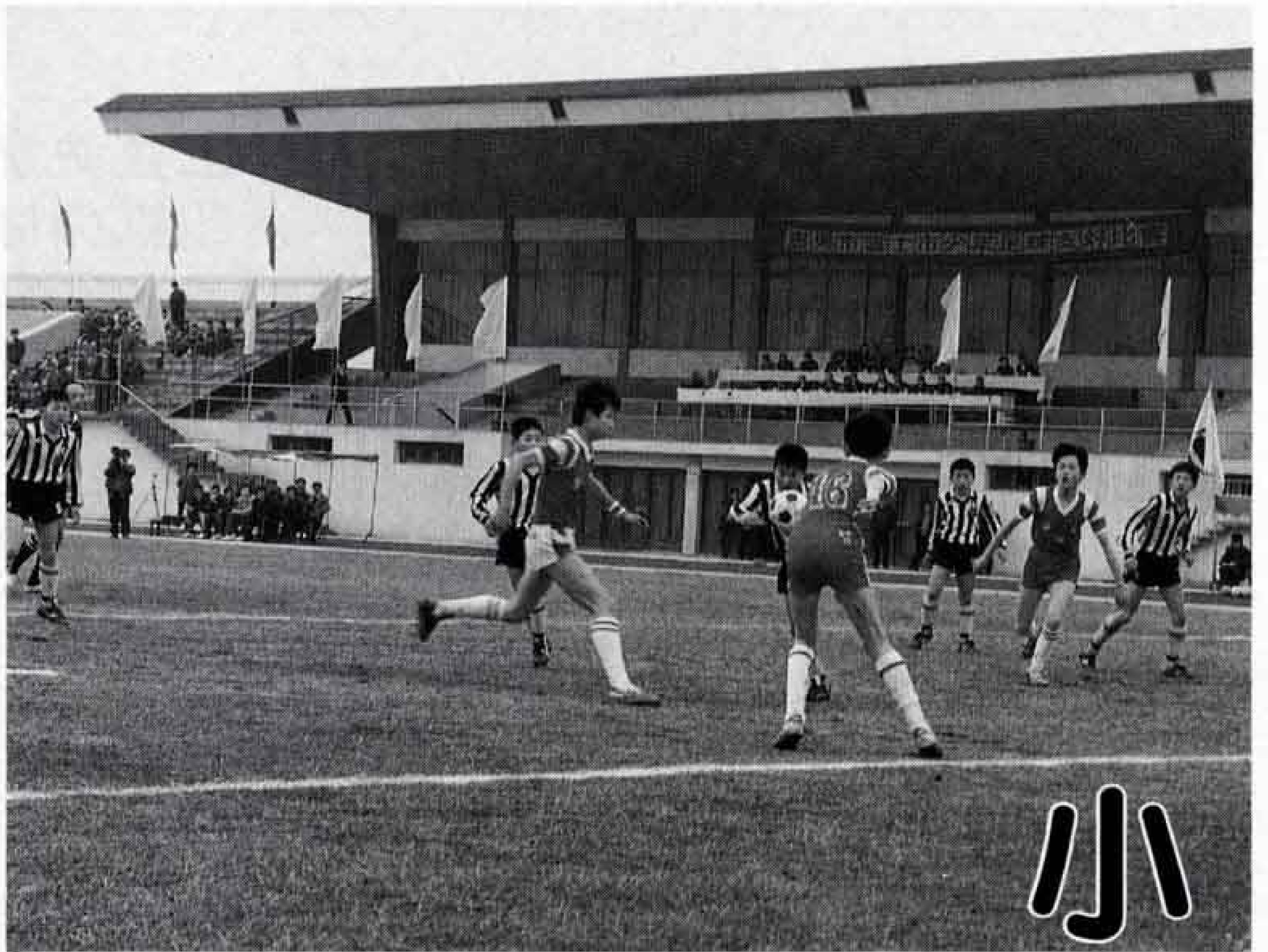
△白熱した両イレブン