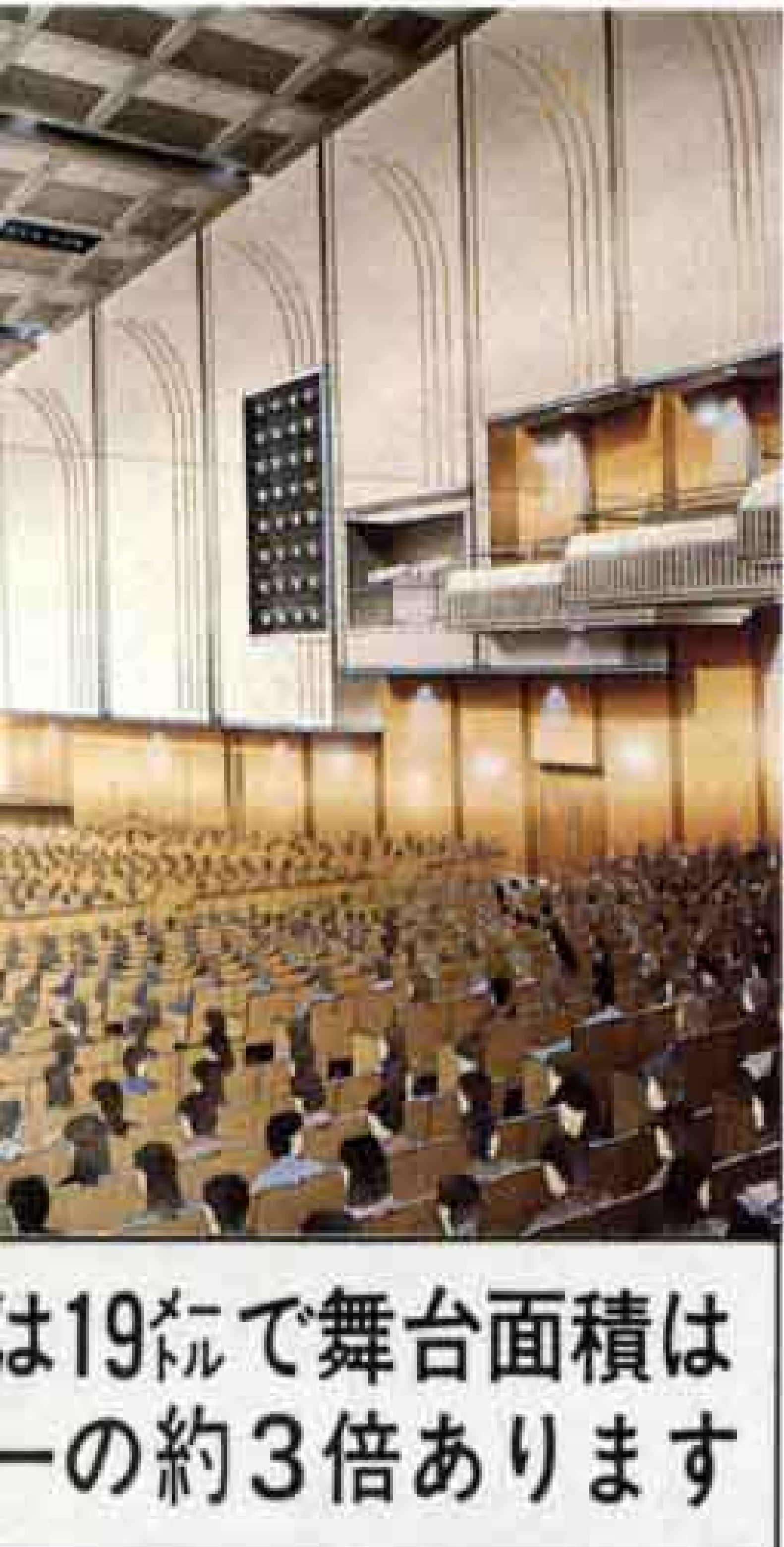
は19で舞台面積は 一の約3倍あります