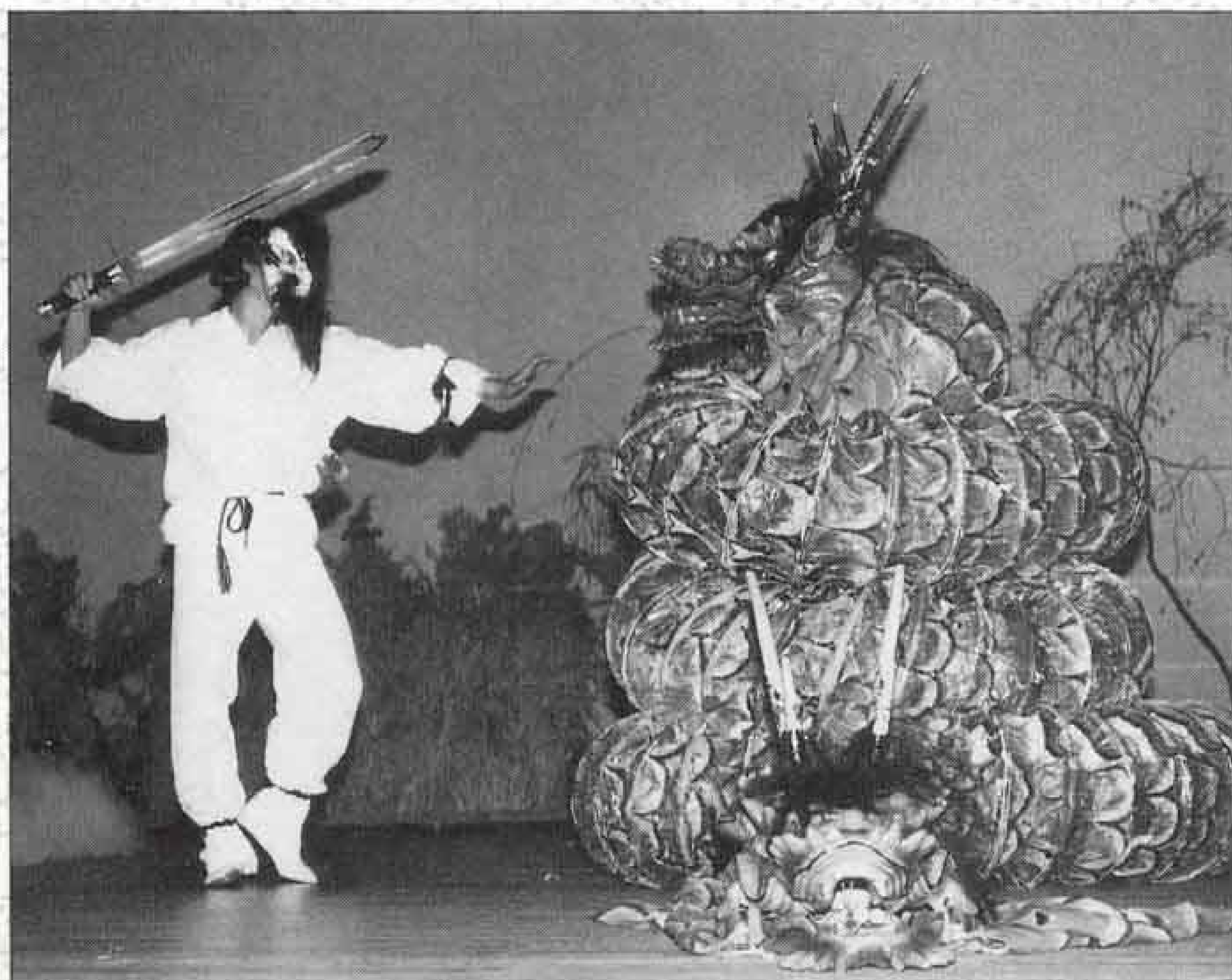
△迫力満点の大龍の舞