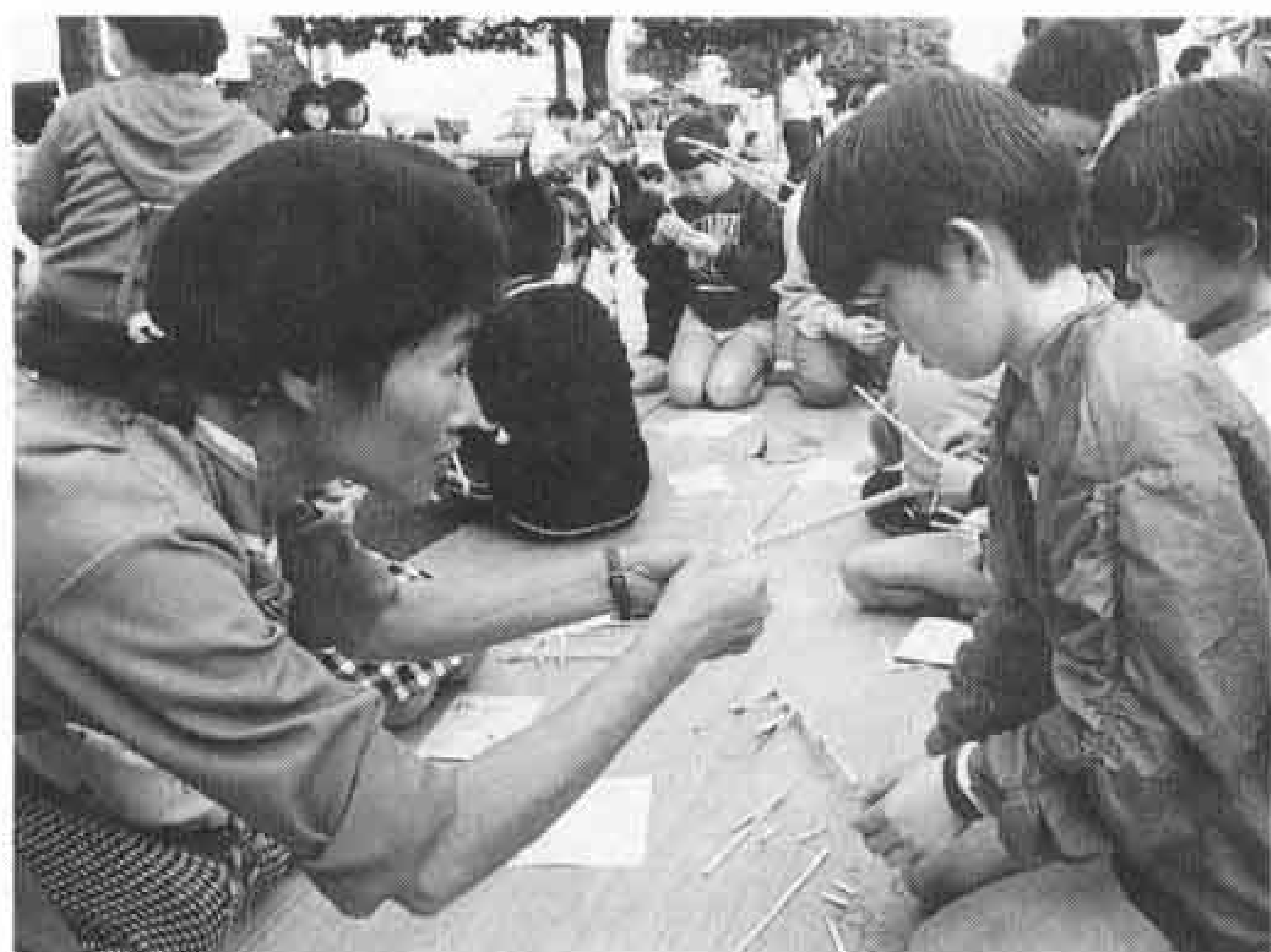
△人気のあった割ばし鉄砲