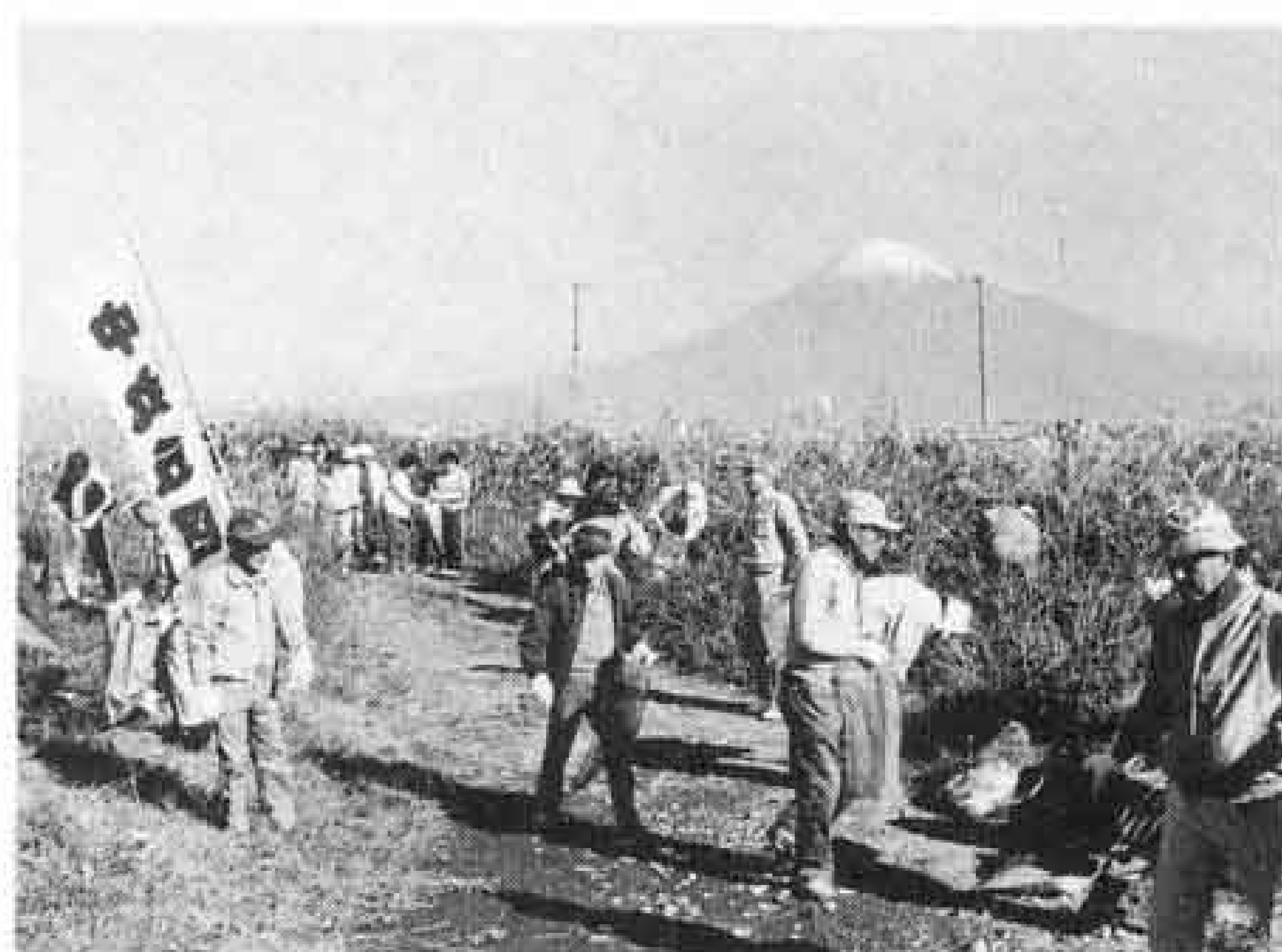
△富士山のように美しく

野鳥の楽園であり、レクリエーションの場でもある富士川。でも、残念なことにはたくさんのごみが捨てられています。十一月十一日、みどりと環境美化を推進する富士市民の会の皆さん約三千人が、一斉に「富士川クリーン作戦」を展開しました。空き缶から事業系のごみまで、見る見るうちに回収のトラックはいっぱい。皆さん、ごみを捨てないで。