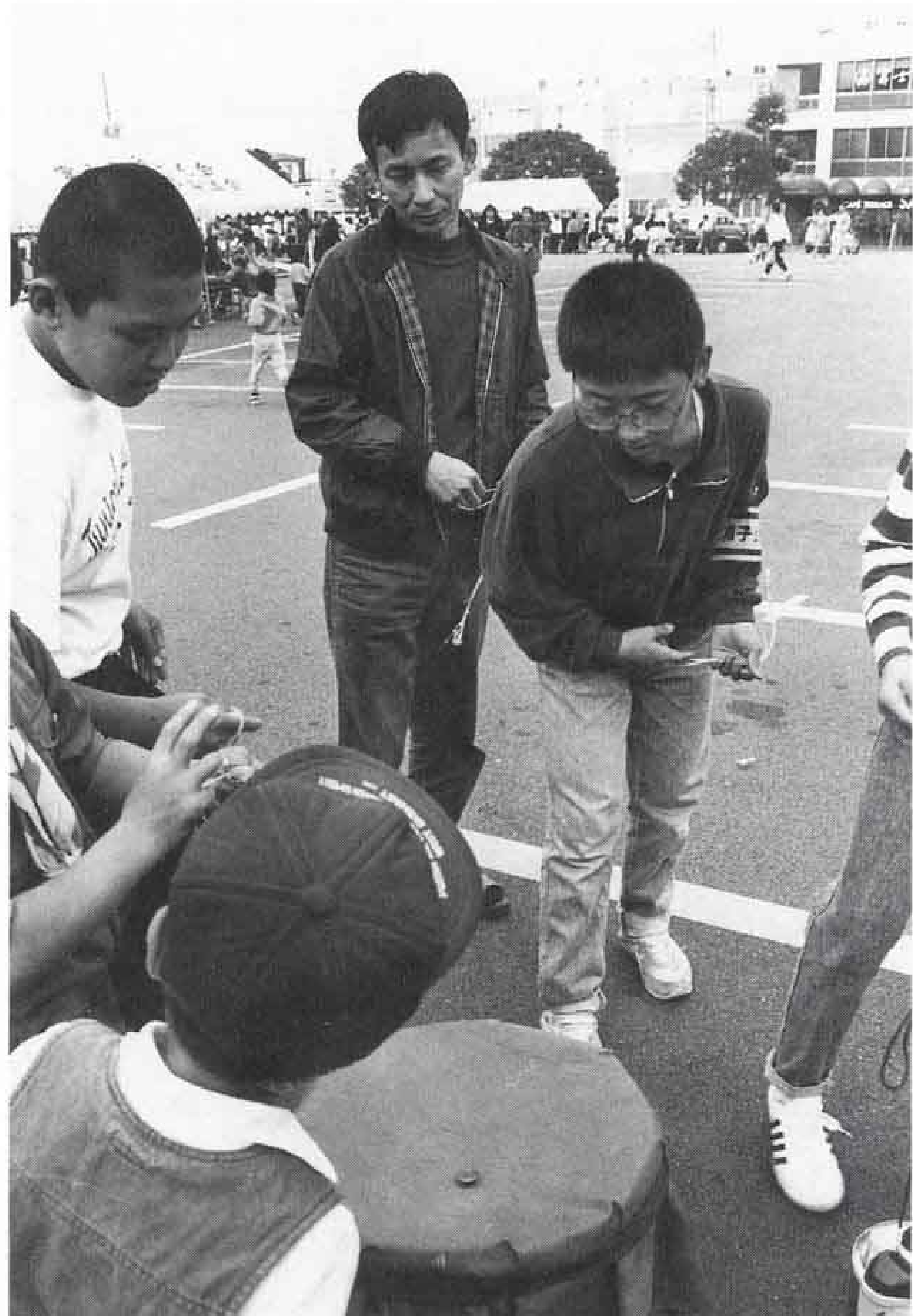
△大人も子供も楽しんだベーゴマ

ベーゴマ・竹馬などの懐かしい遊びや、割ばし鉄砲・紙飛行機などの手づくりの遊びを全員集合させた、子どもまつり「子どもあそびの国」が、十一月十八日、市役所駐車場で行われました。子どもたちは、ファミコンなどとは勝手の違う遊びに最初は戸惑い気味。でも、すぐになれて、遊びに夢中になりました。また、紙飛行機など遊びによつては、お父さんの方が熱中する場面も見られ、楽しい一日を過ごしました。