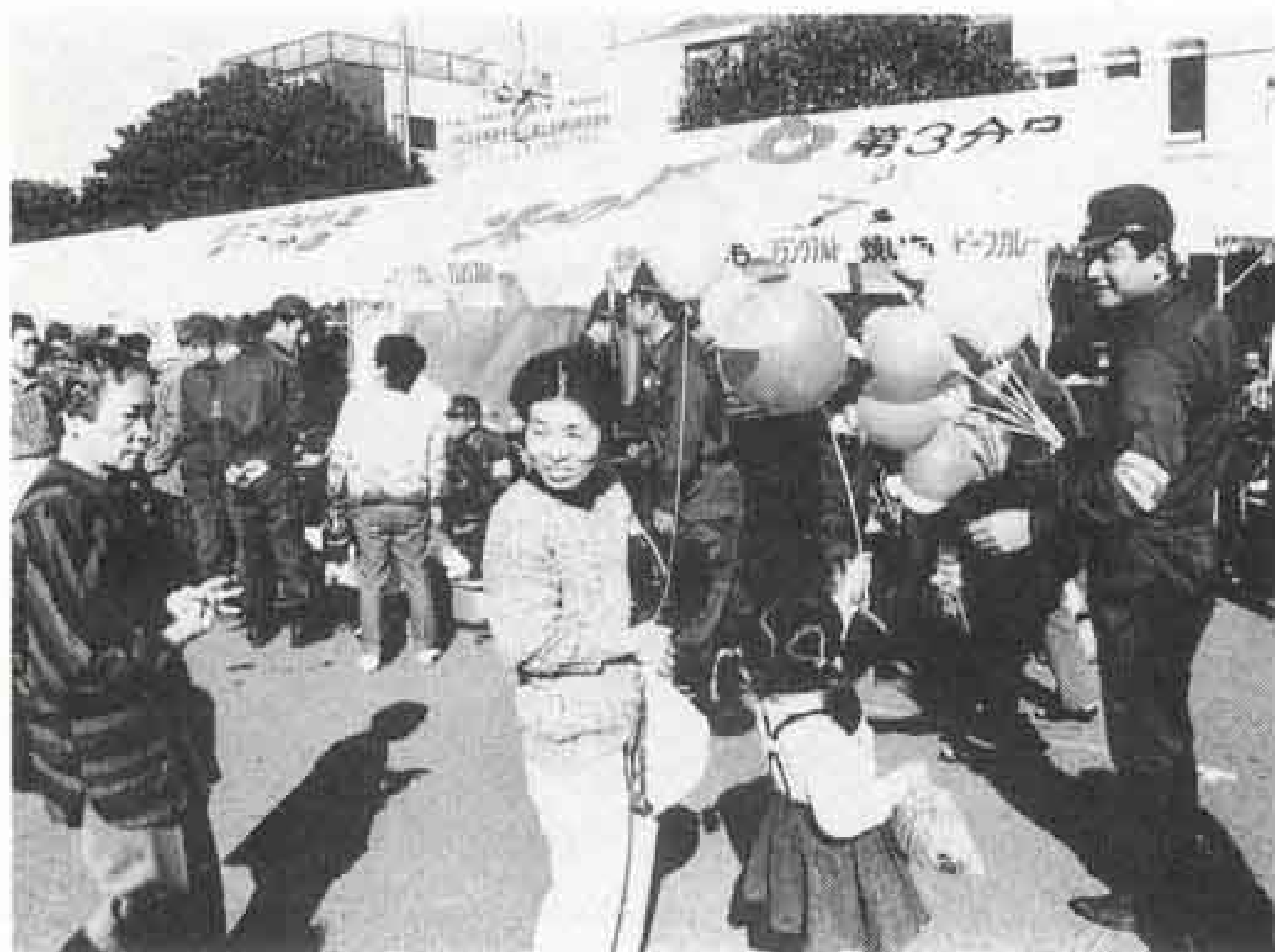
▽楽しい一日でした

会場では、煙ハウスやちびつ子レンジャー、放水体験コーナーなどを初め、防火クイズ、各分団ごと工夫を凝らした模擬店など、さまざま催しが行われました。訪れた皆さんは、消防を身近に感じ、防火に対する意識を新たにしようでした。