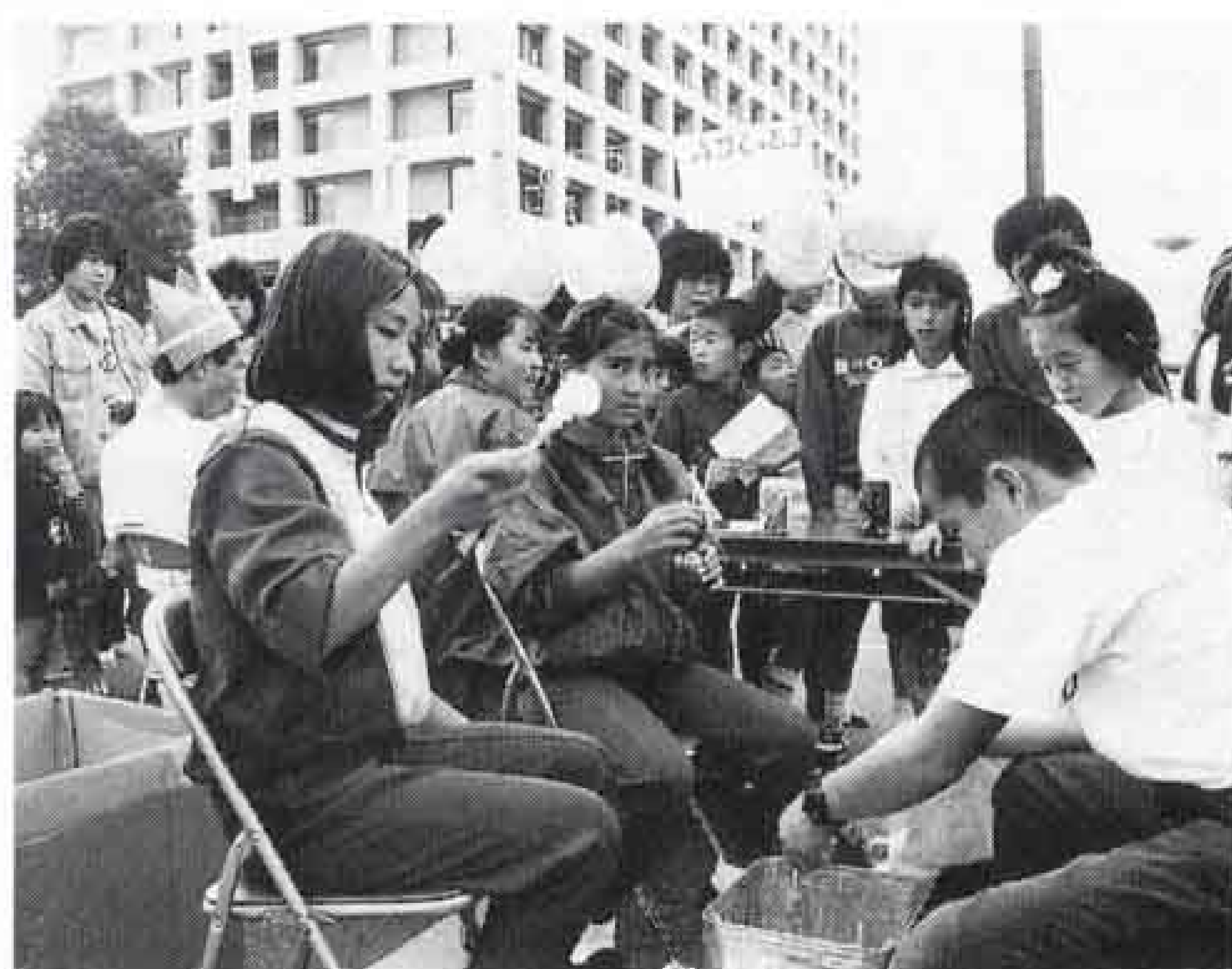
△水あめには長い列が…