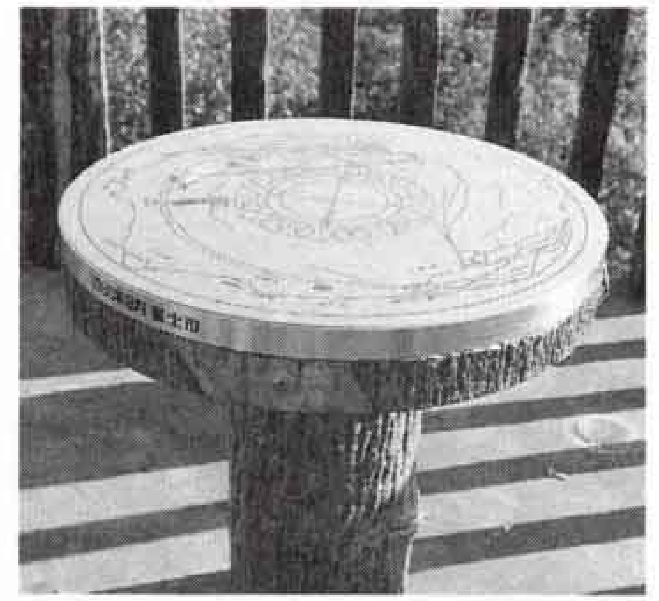
△盗まれてつくりなおした方位板 (岩本山公園)