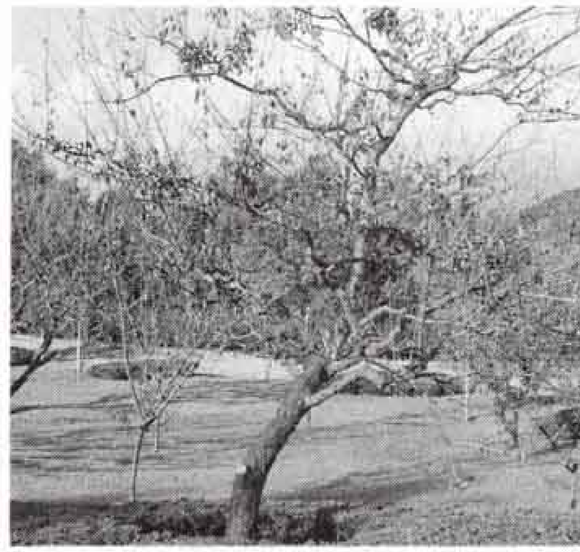
△梅園の梅の実を全部一度に盗まれた (岩本山公園)

公園は、完成したときが赤ん坊です。上手な維持管理と、大勢の人が利用してくれることによって、年々成長し立派になっていきます。皆さんと一緒になって、立派な公園を育てたいと思いますので御協力ください。