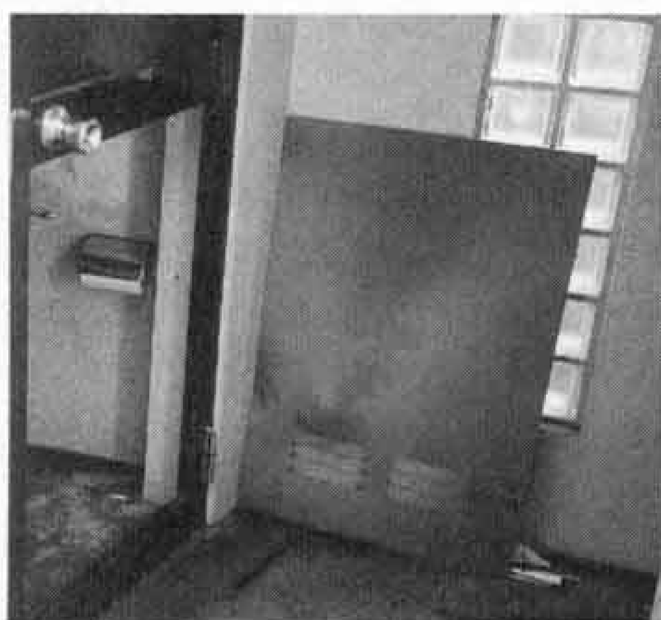
△トイレのドアを壊された (厚原スポーツ公園)