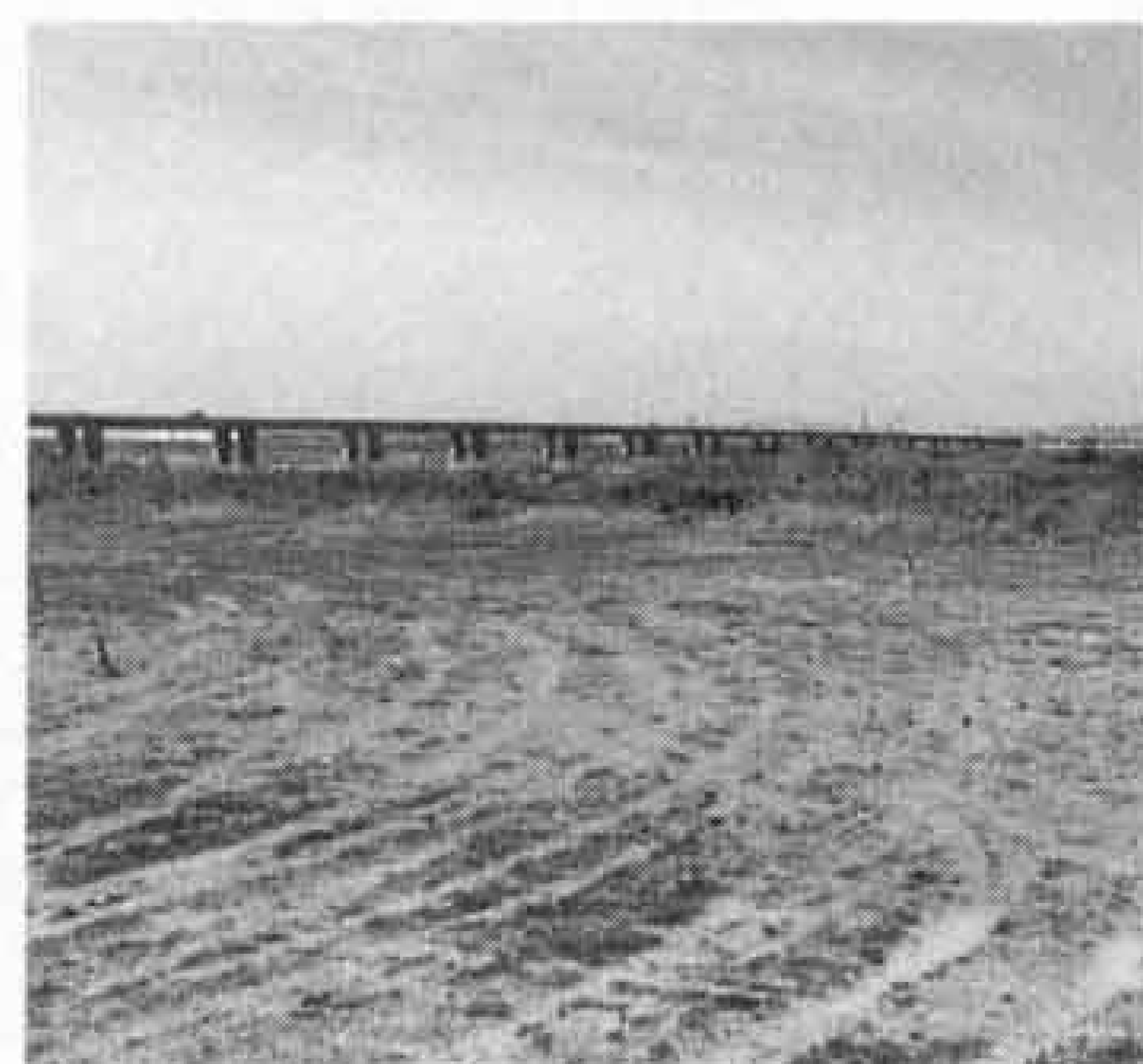
△ソフトボール場のわだち (富士川緑地)

富士川緑地や雁公園など芝生のある公園内で、ゴルフの練習をしている人を最近多く見かけます。