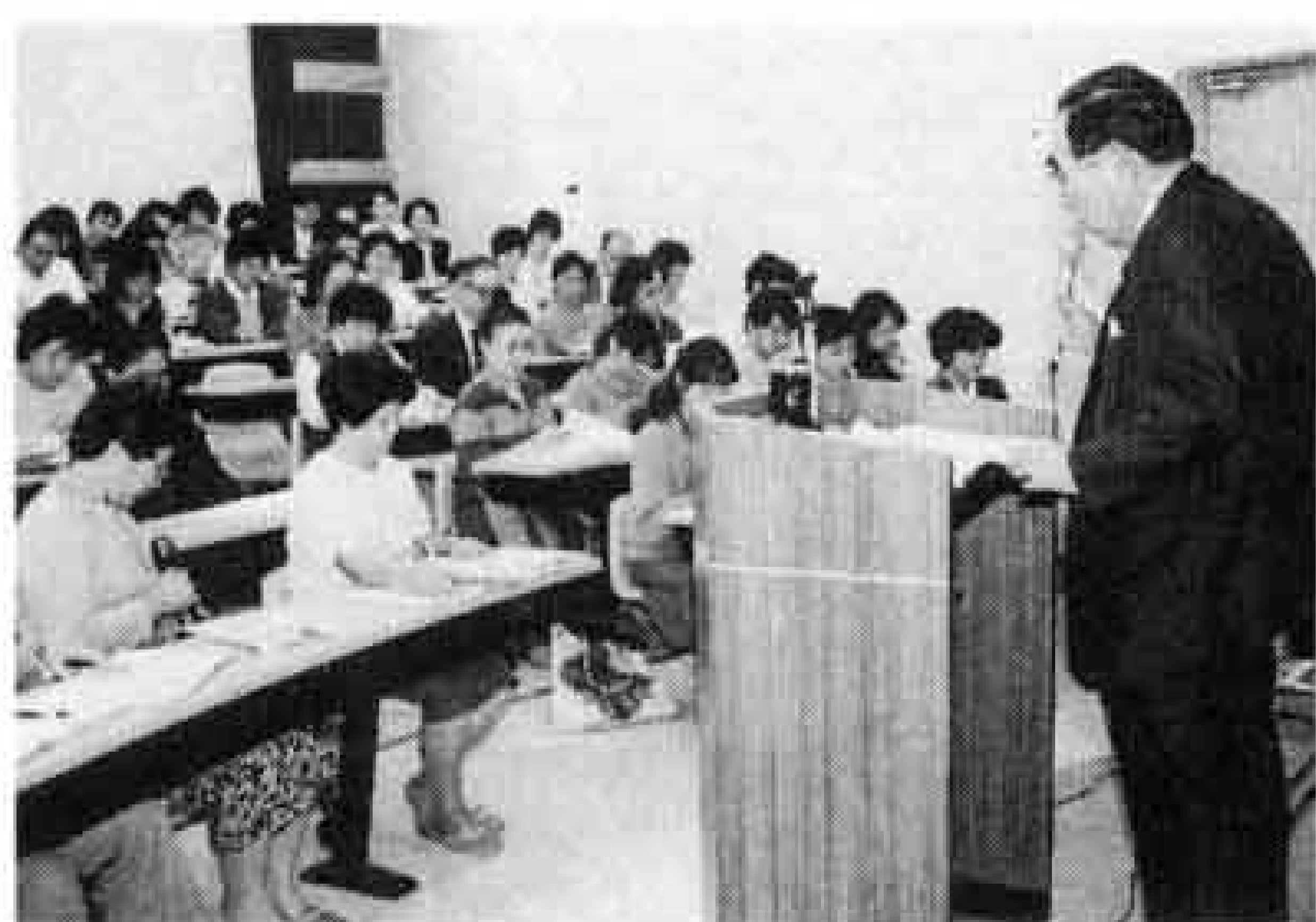
△会場はアカデミックな 雰囲気

本年4月開学した常葉学園富士短期大学で、10月18日から一般市民を対象とした公開講座が始まりました。