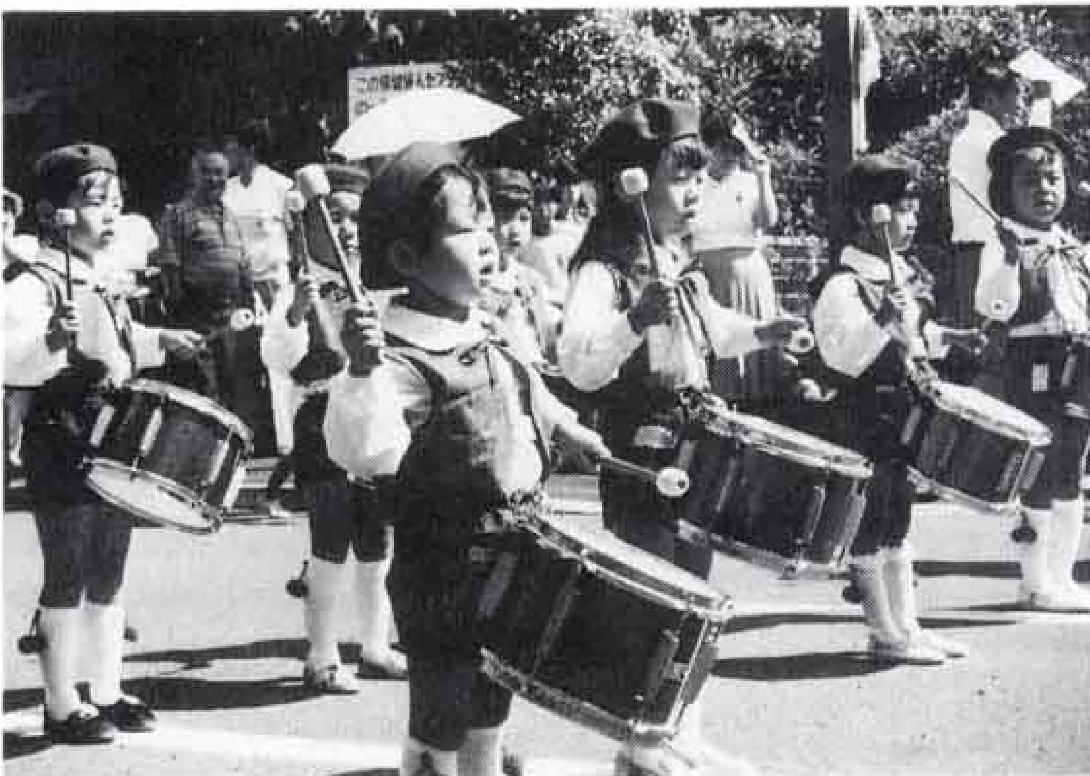
△すみれ幼稚園舎鼓笛隊の演奏で開場