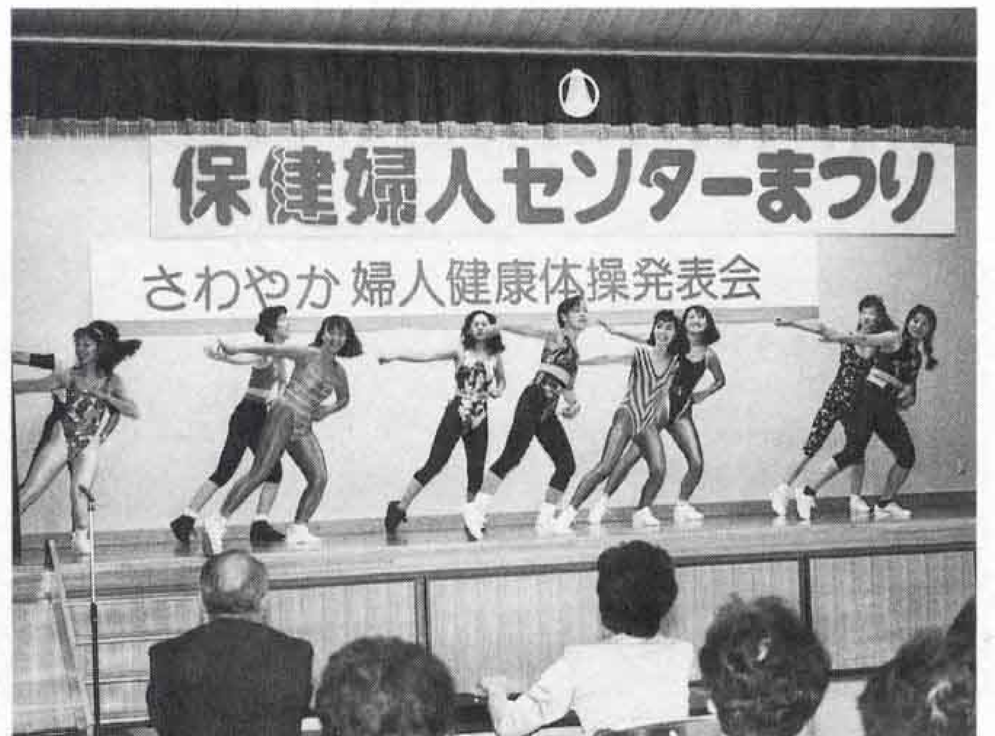
△ちびまるこちゃんの歌に乗せて