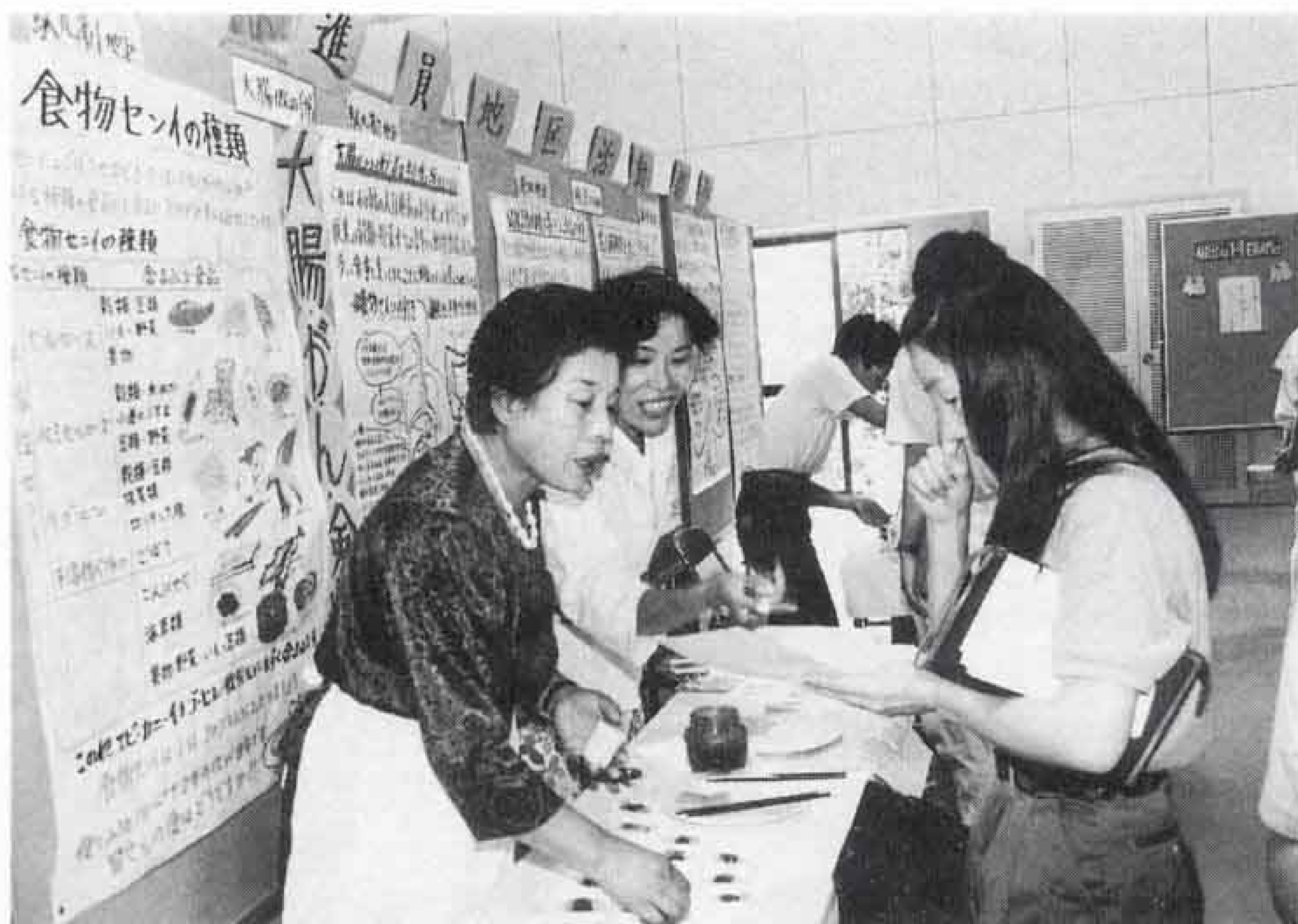
△最近人気の食物繊維の効用は