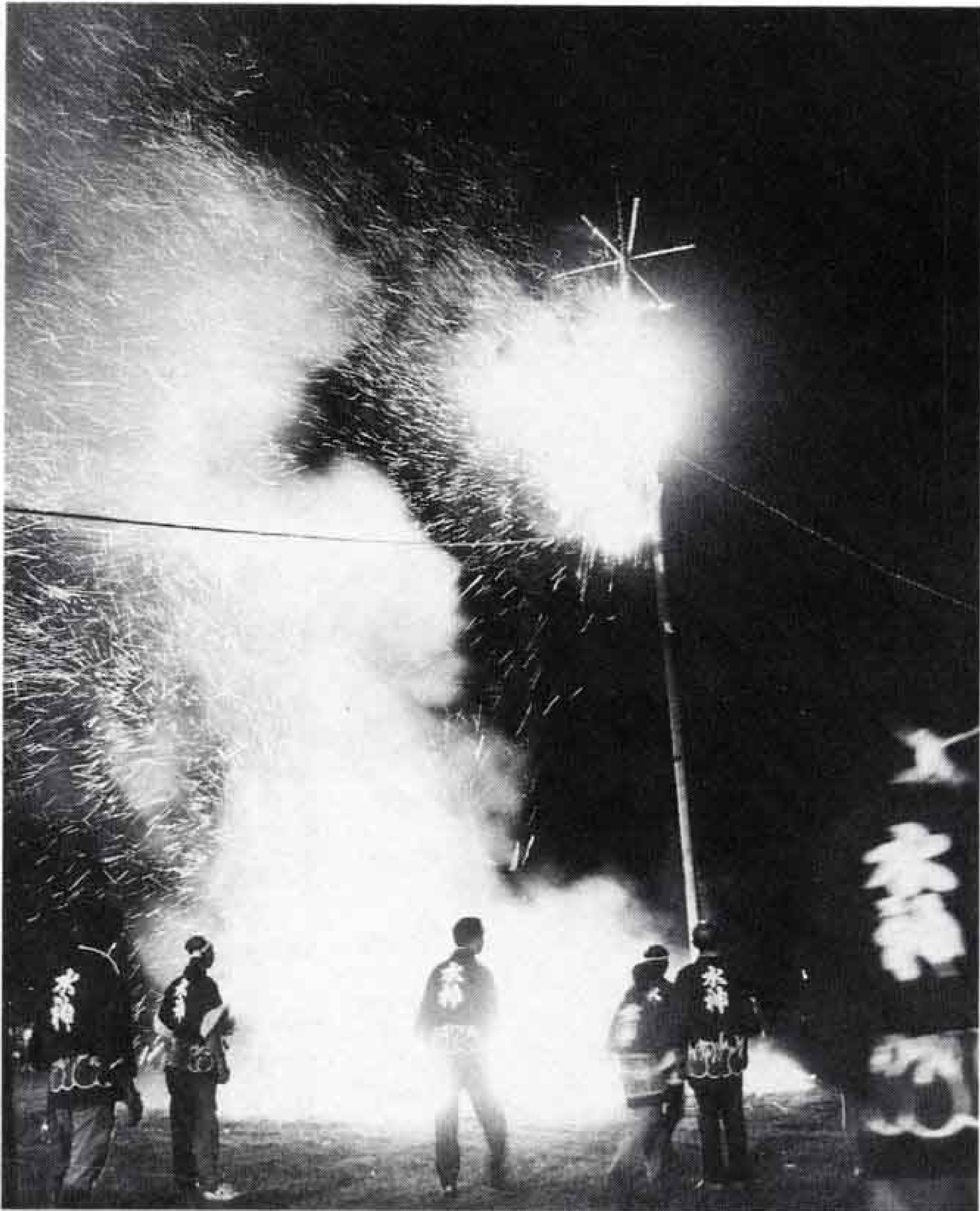
△火の粉を飛ばして燃え尽きます

十月六日、富士川の雁公園で、第三回かりがね祭りが行われました。昼間は投げもち、バナナのたき売りなどに人が集まりましたが、やはりメインとなるのは、暗くなつてからの投松明と花火。投松明は、ひもで縛つたまきに火をつけ、ぐるぐる回し、遠心力で投げ上げますが、なかなか届きません。今回は、十五分ほどで火がつき、見物人から大きな拍手が起りました。