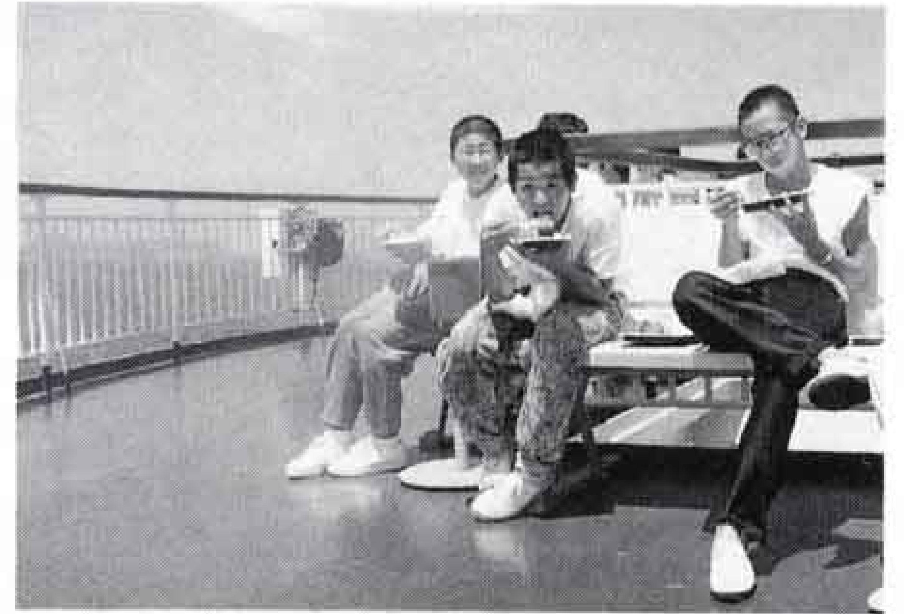
△潮風を受けて食事、気分は最高