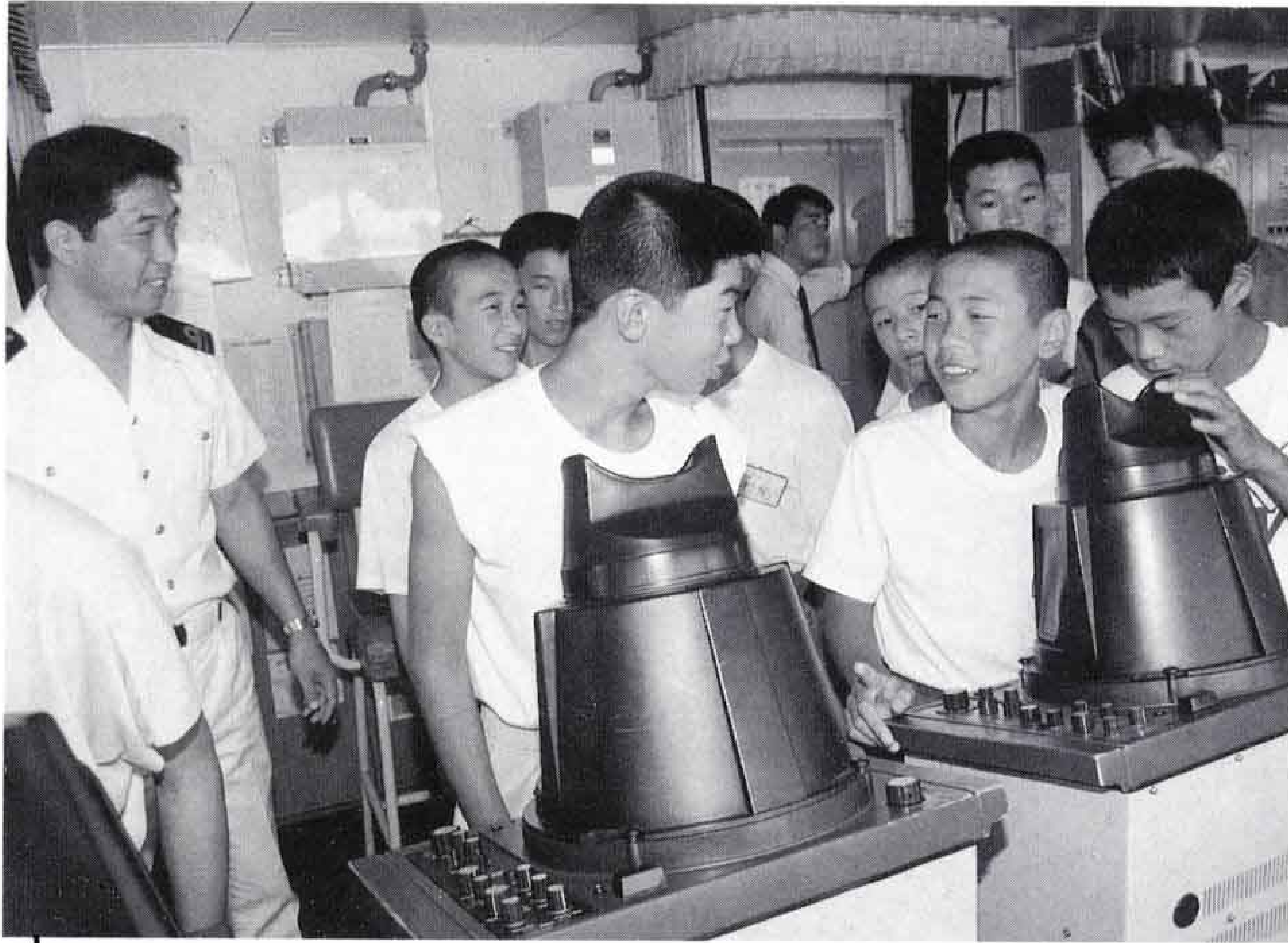
△研修船「サンシャインふじ」の各種機器を見学