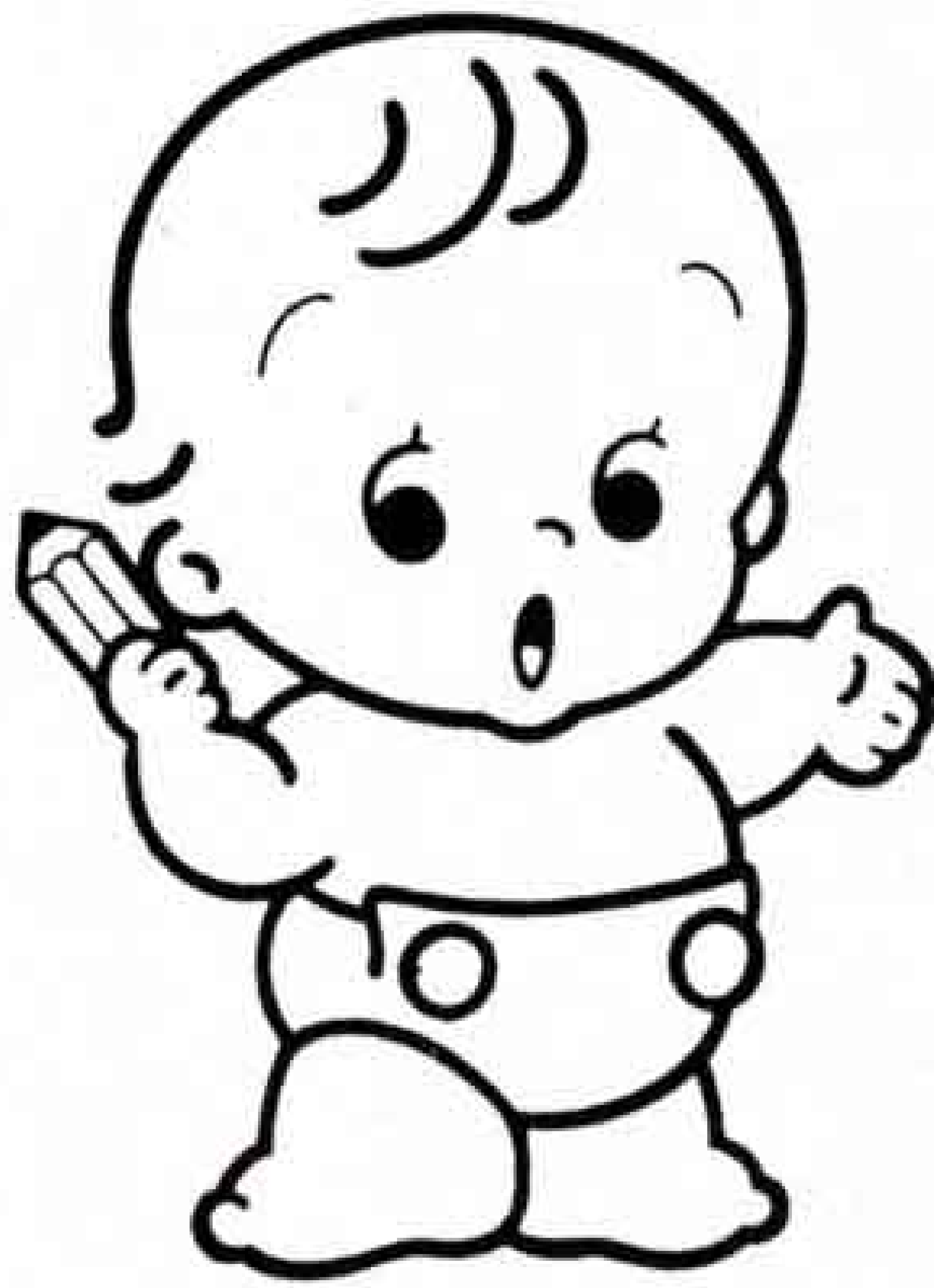
国勢調査のマスコット