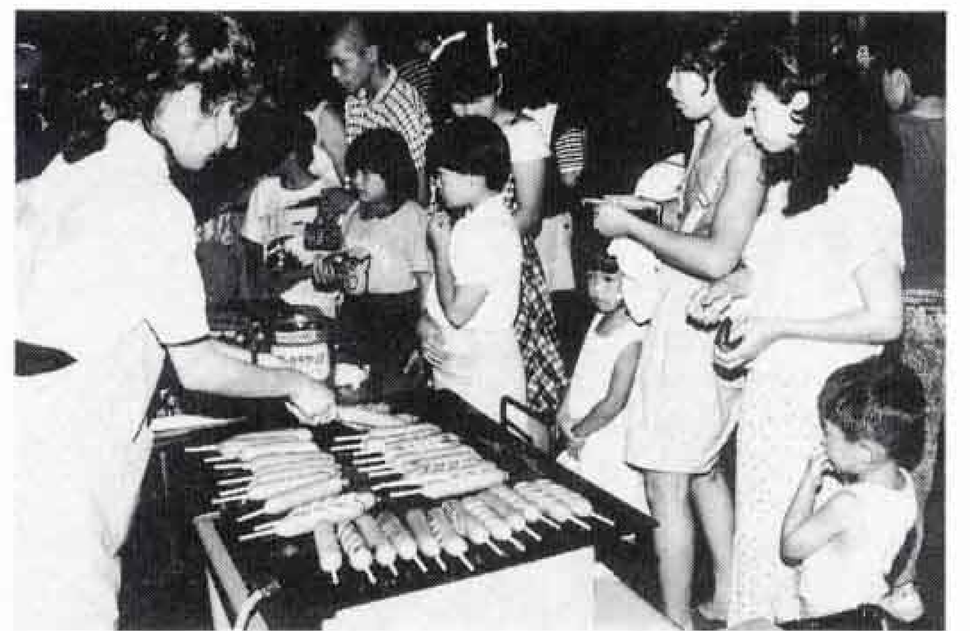
△バザーも大にぎわい