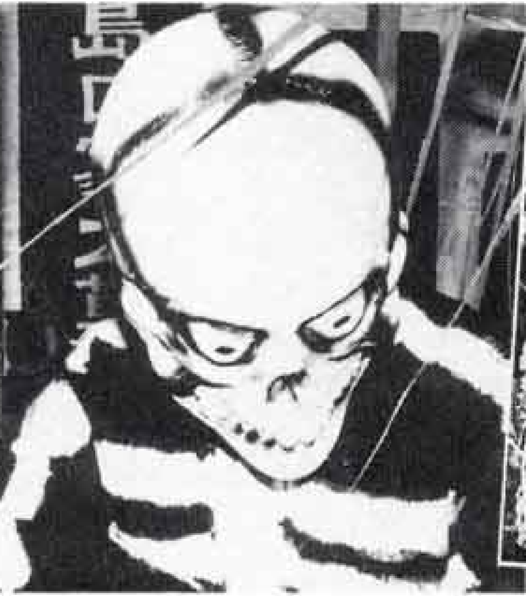
△おばけにどくろは欠かせません