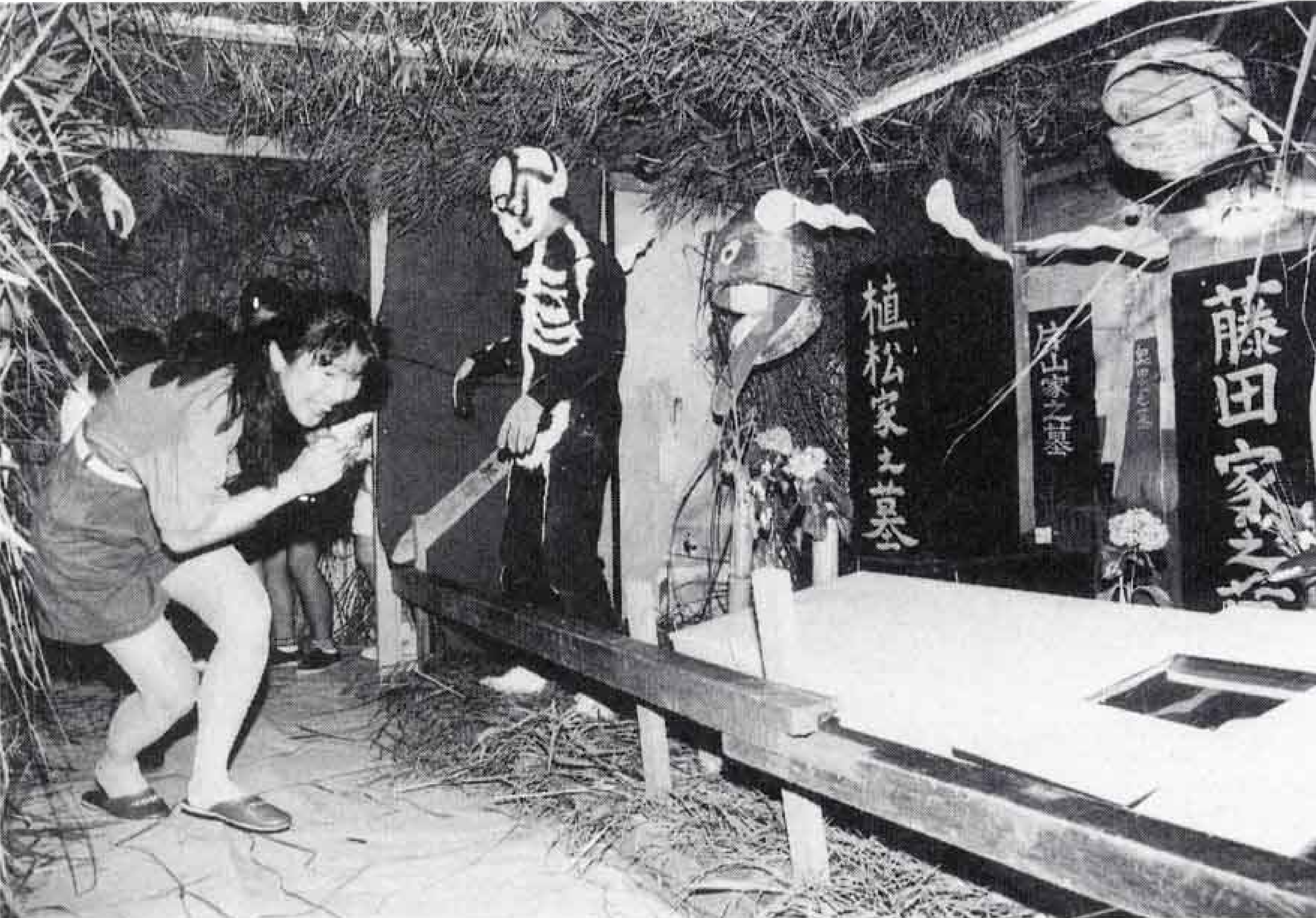
△「キャー」大人も怖がったお墓

ポクポクポク…チーン BGMはお経。ササの葉の道を恐る恐る進む子供たちの前にあらわれたのが、雪女、どくろ、ホラー映画の怪物。夏の暑さをふっ飛ばす青少年センター(広見)恒例のおばけ屋敷が、七月二十三・二十四の夜行われました。訪れた青少年は二日間二千人を超え、大盛況。会場は悲鳴に一つままれていました。