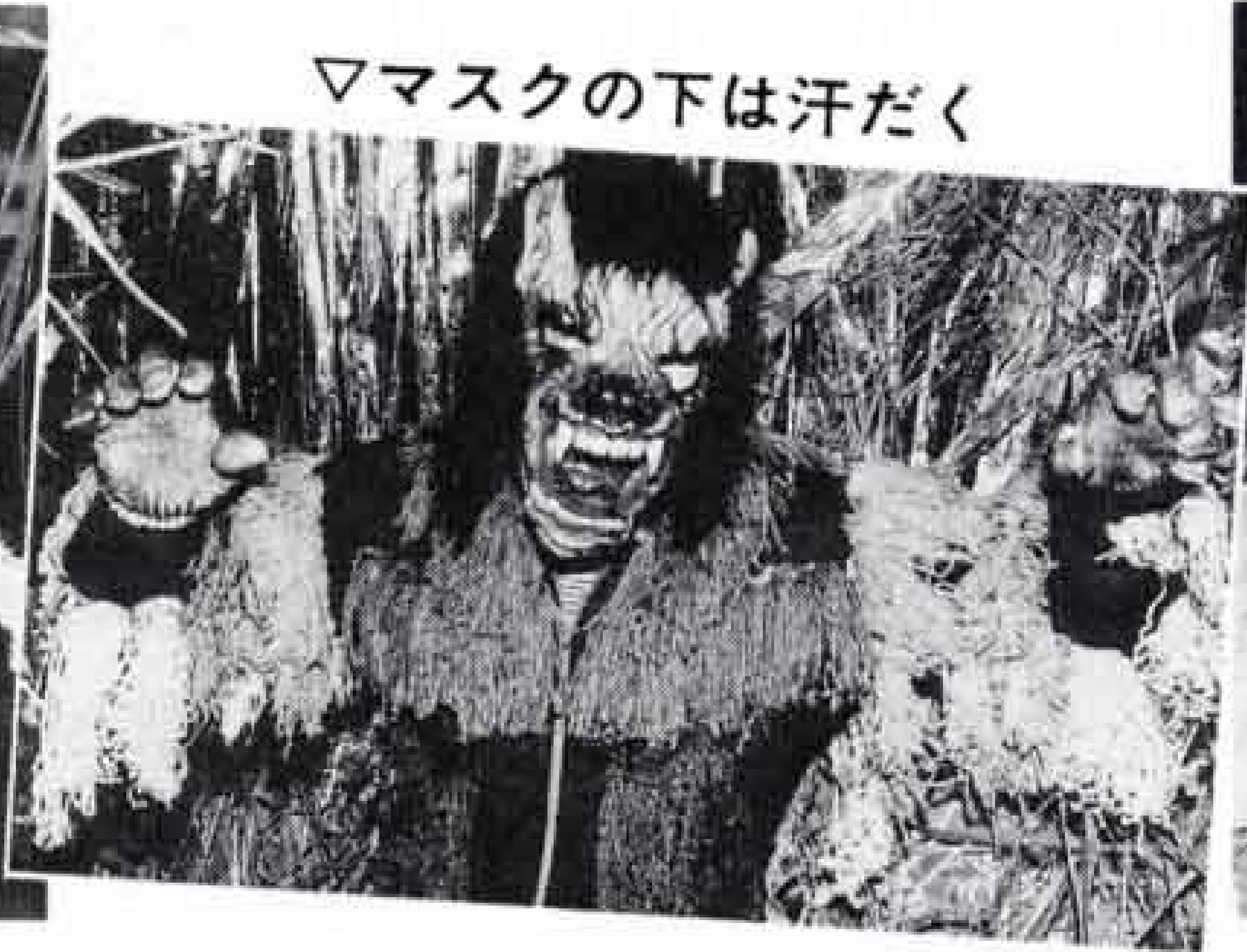
▽マスクの下は汗だく