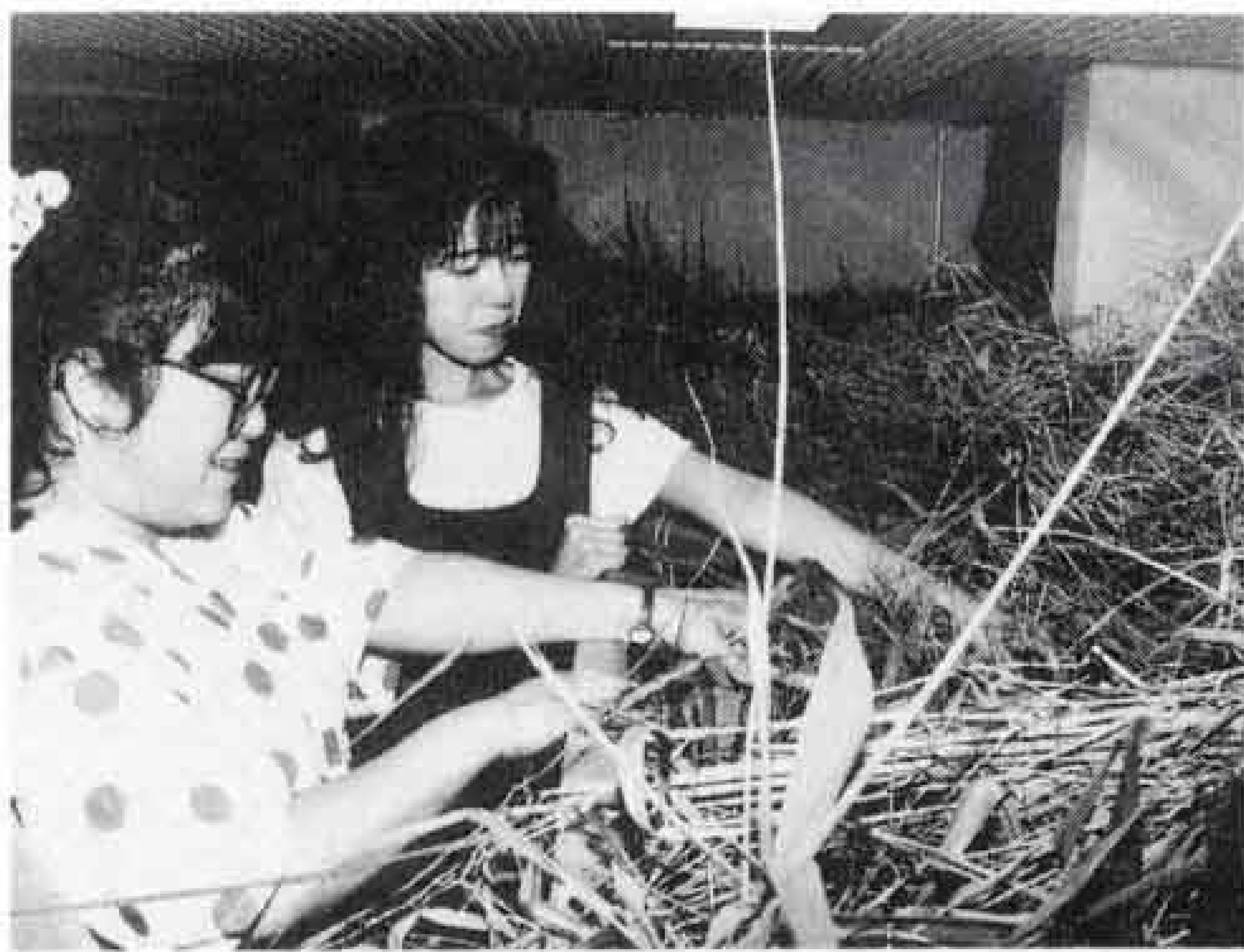
△おどかし役の裏方さんも大変

ポクポクポク…チーン BGMはお経。ササの葉の道を恐る恐る進む子供たちの前にあらわれたのが、雪女、どくろ、ホラー映画の怪物。夏の暑さをふっ飛ばす青少年センター(広見)恒例のおばけ屋敷が、七月二十三・二十四の夜行われました。訪れた青少年は二日間二千人を超え、大盛況。会場は悲鳴に一つままれていました。