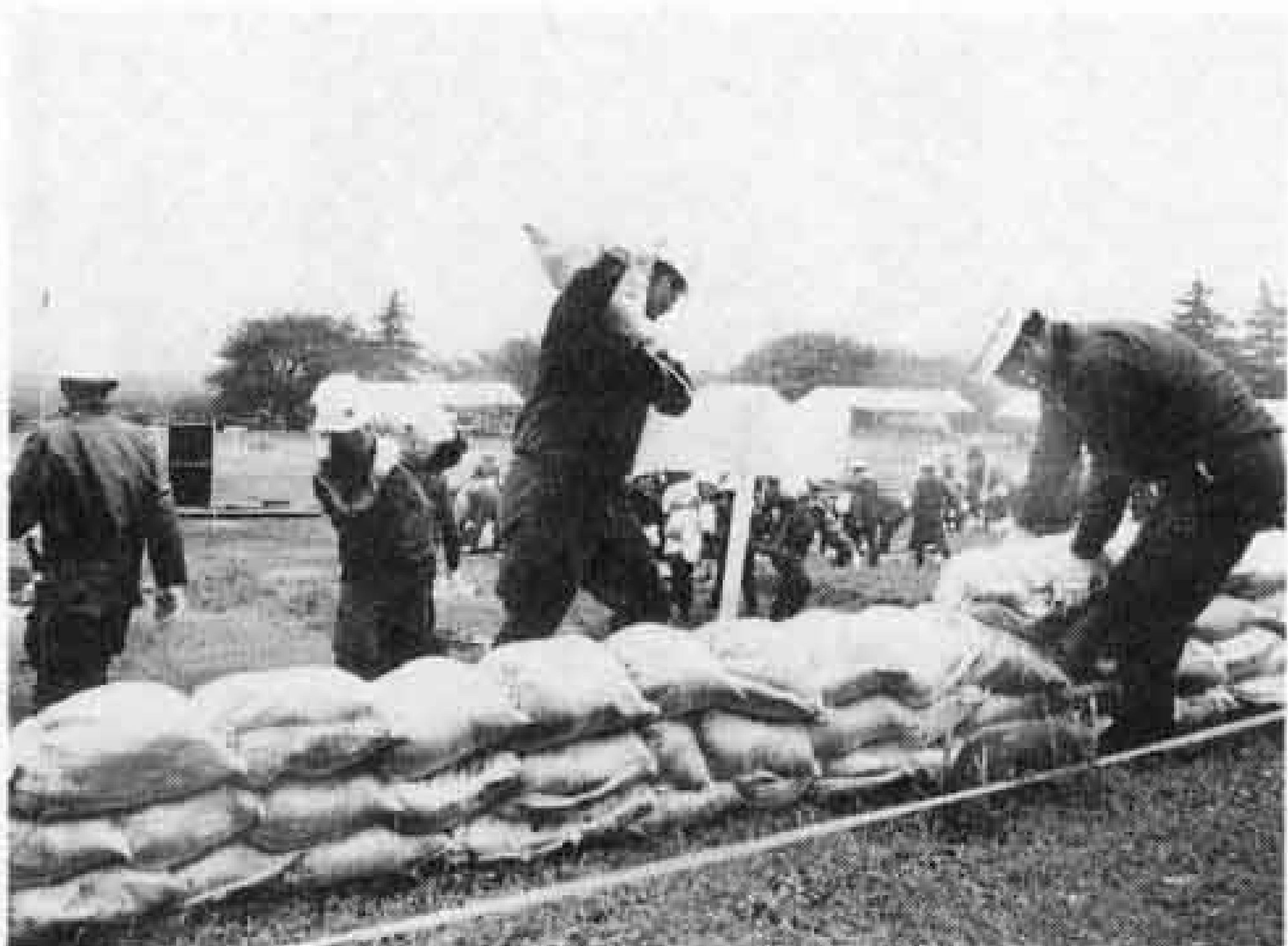
▷土のう積みが基本

当日は本番さながらのすごい雨。参加した約五百人の団員は、ずぶぬれになりながら、土のうづくりや、流れを緩めたり被害の拡大を防ぐ各種の工法を披露しました。そのうち、各団対抗で行われた「川倉工法」では、潤井川右岸水防分団が優勝しました。