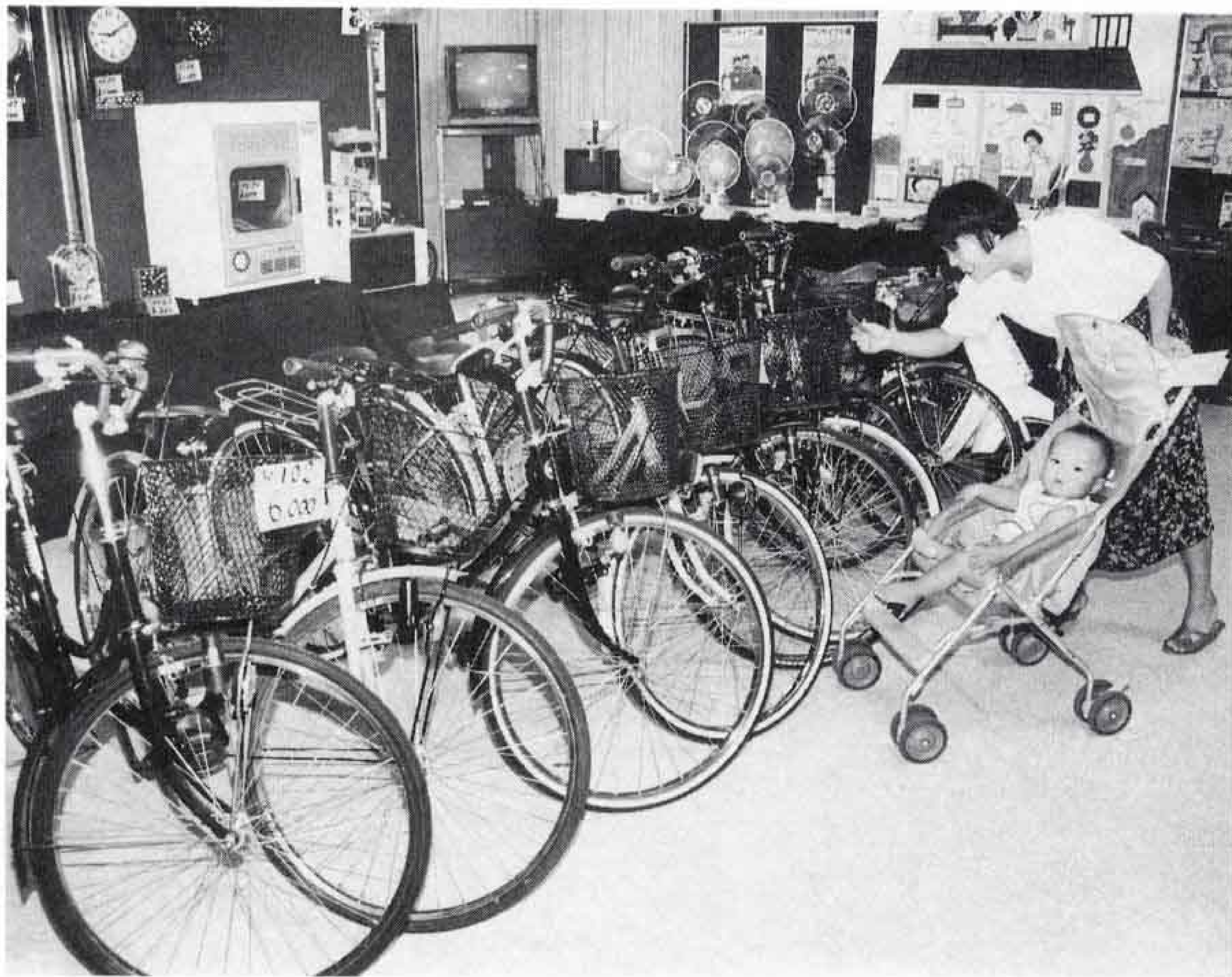
△よみがえった品物

七月十六日から二十二日まで、富士公民館を会場として第十回三リサイクル展が開かれました。時計五百円、ラジカセ千円、自転車六千円：会場は安売り店と間違えそうな雰囲気。品物はすべて第一清掃工場の職員が、ごみから修理、再生したものです。訪れた人々の口から出たのは「もつたいない。これがごみ？」。 展示終了後、リサイクル品は抽せんにより値札の価格で分けられました。