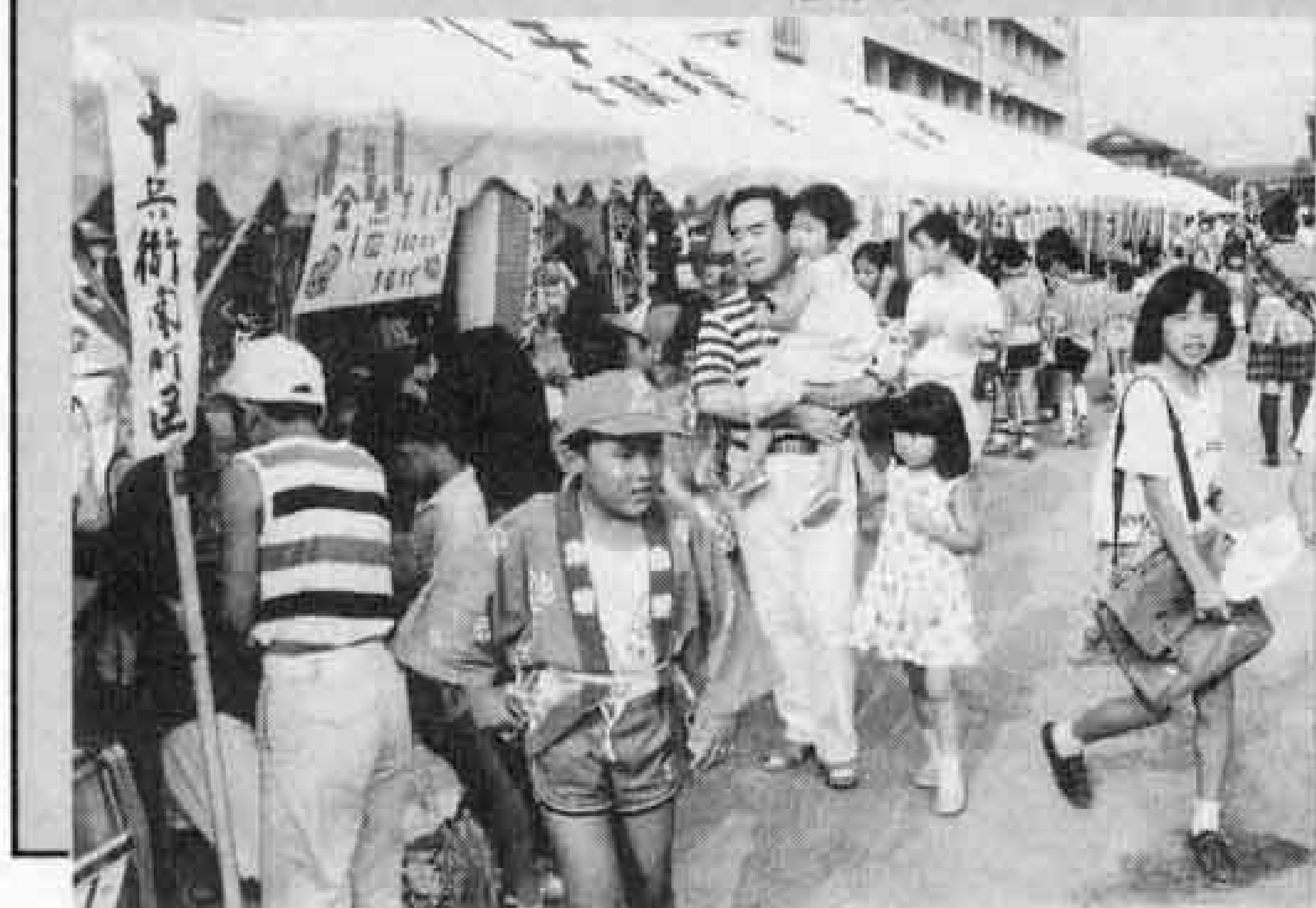
▽各町内ごとに工夫された模擬店

パレードやみこしの練り歩き、各町内の模擬店など多くの催しが行われ、駅南地区をあげて楽しいひとときとなりました。