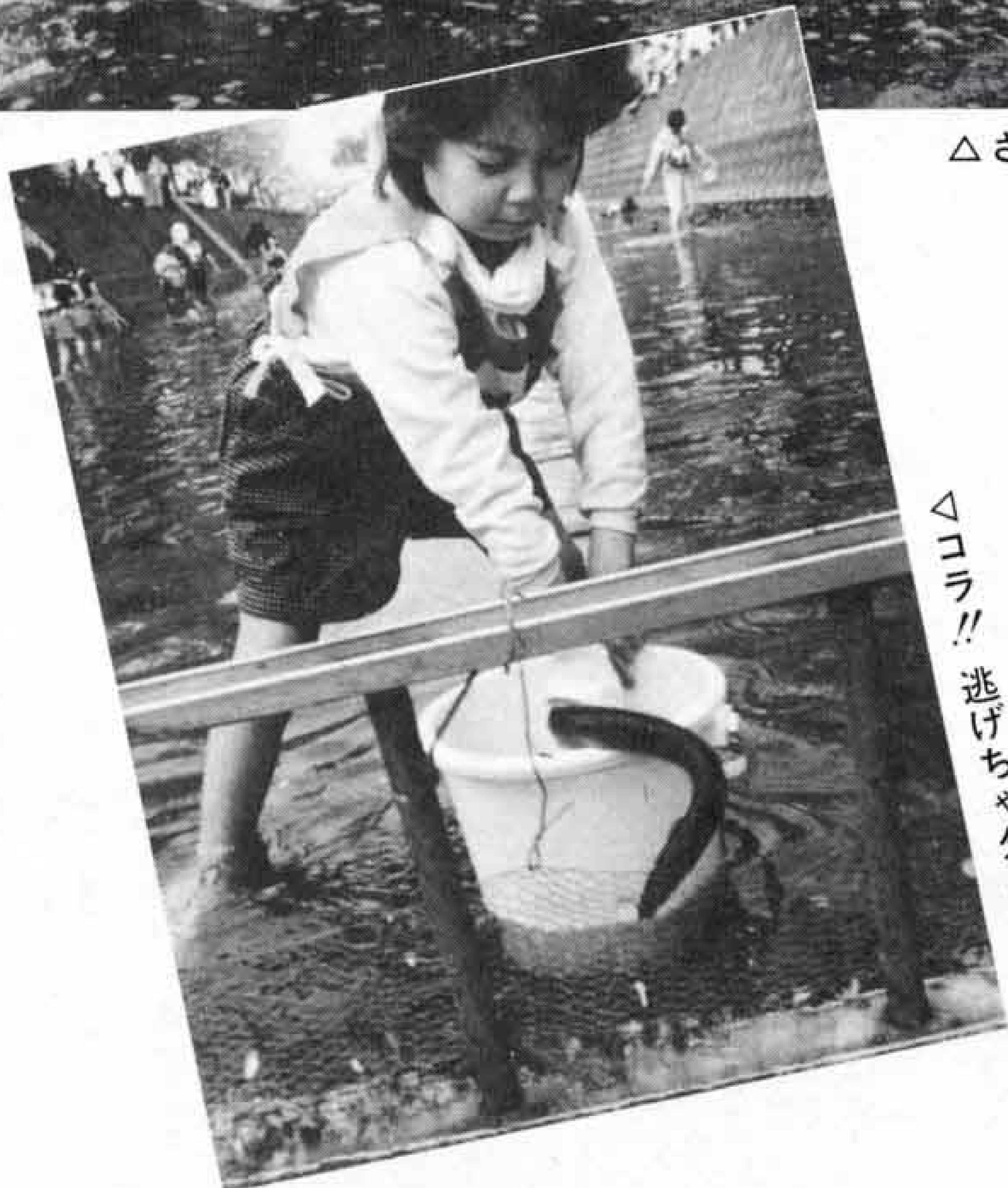
△コラ!! 逃げちゃダメ!!

吉原地区に、すつかり根をおろした小潤井川の「桜まつり」。ことは、桜だけでなく水にも親しもうと、「ウナギのつかみ捕り大会」が四月一日に行われました。大会には、小学生や一般の人など約百五十人が参加し、花見客や家族の応援を背に、逃げ回るウナギを追いかけて大奮闘。中には、何匹も捕まえた子供もいました。これで晩のおかずは大丈夫ですね。