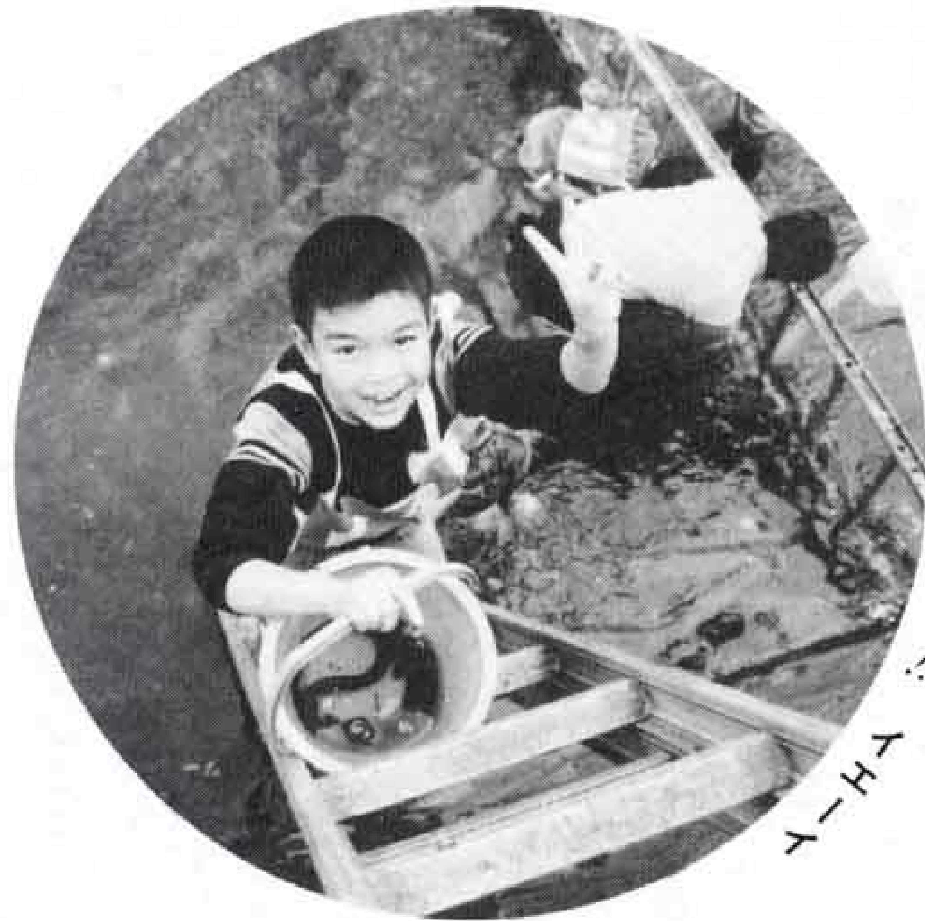
ヤッターゼ!!! ムーハイ