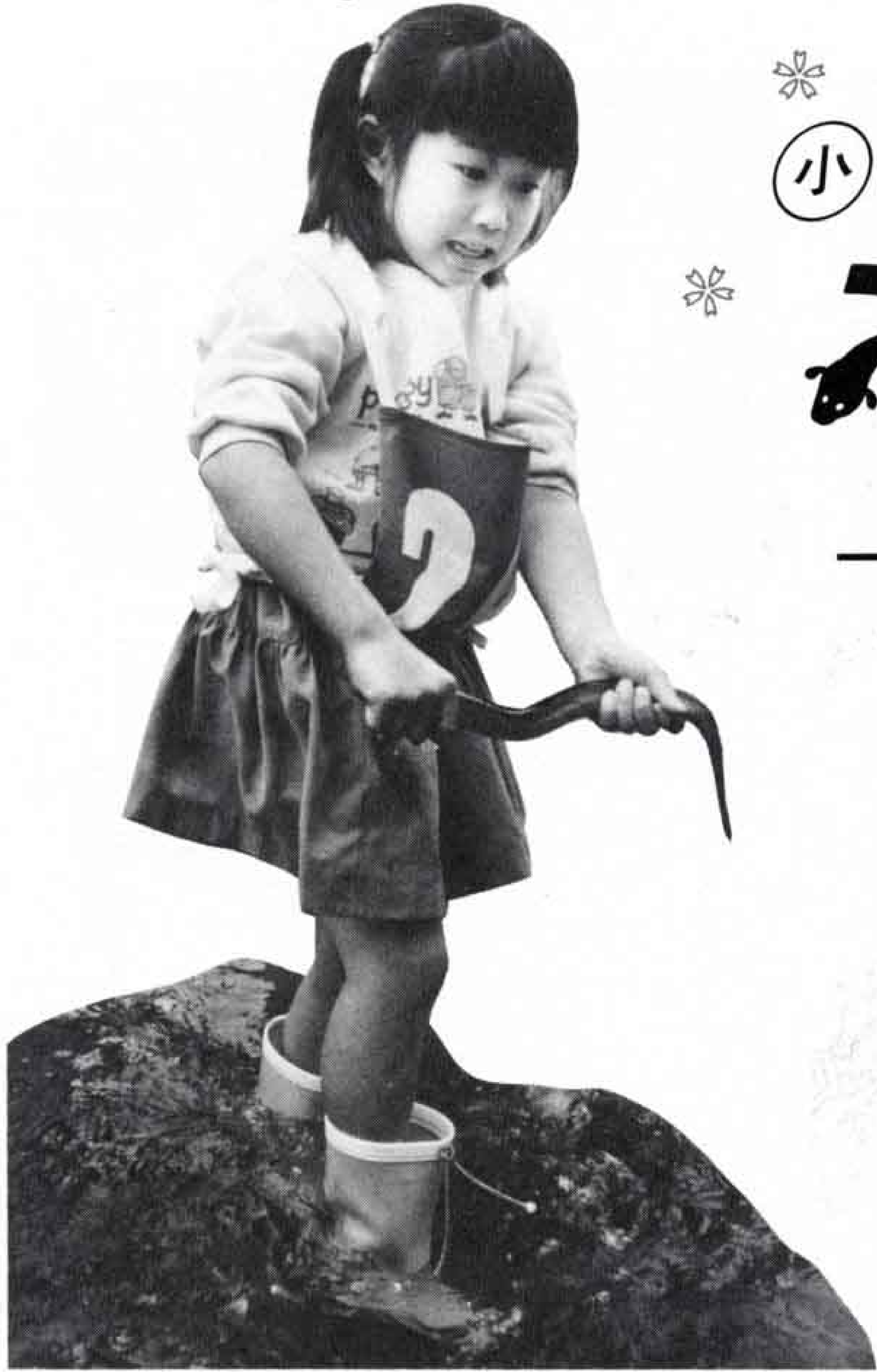
▽町中が一つになった楽しいひとときです