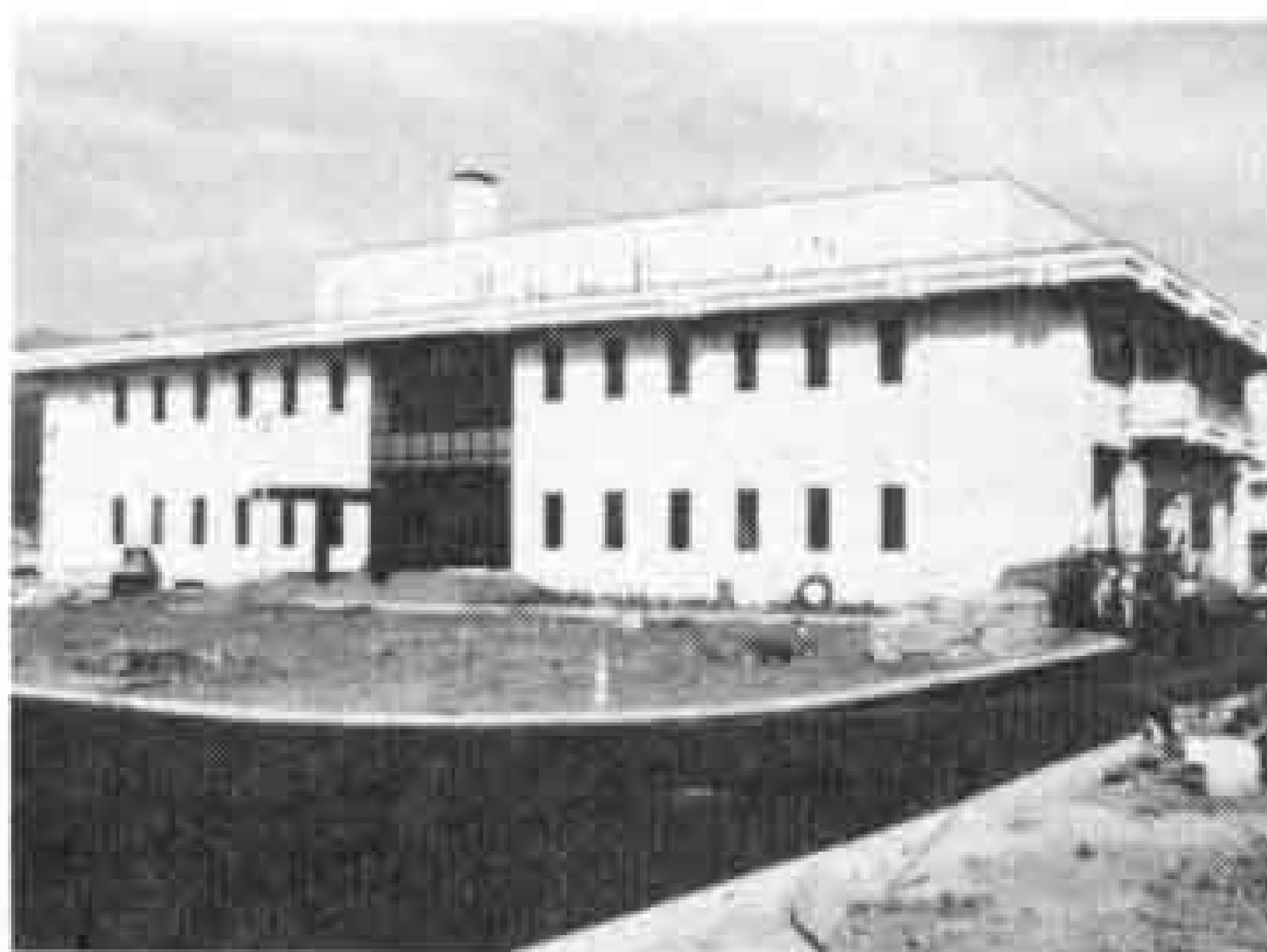
△4月1日から通水を開始した東部の下水道浄化施設