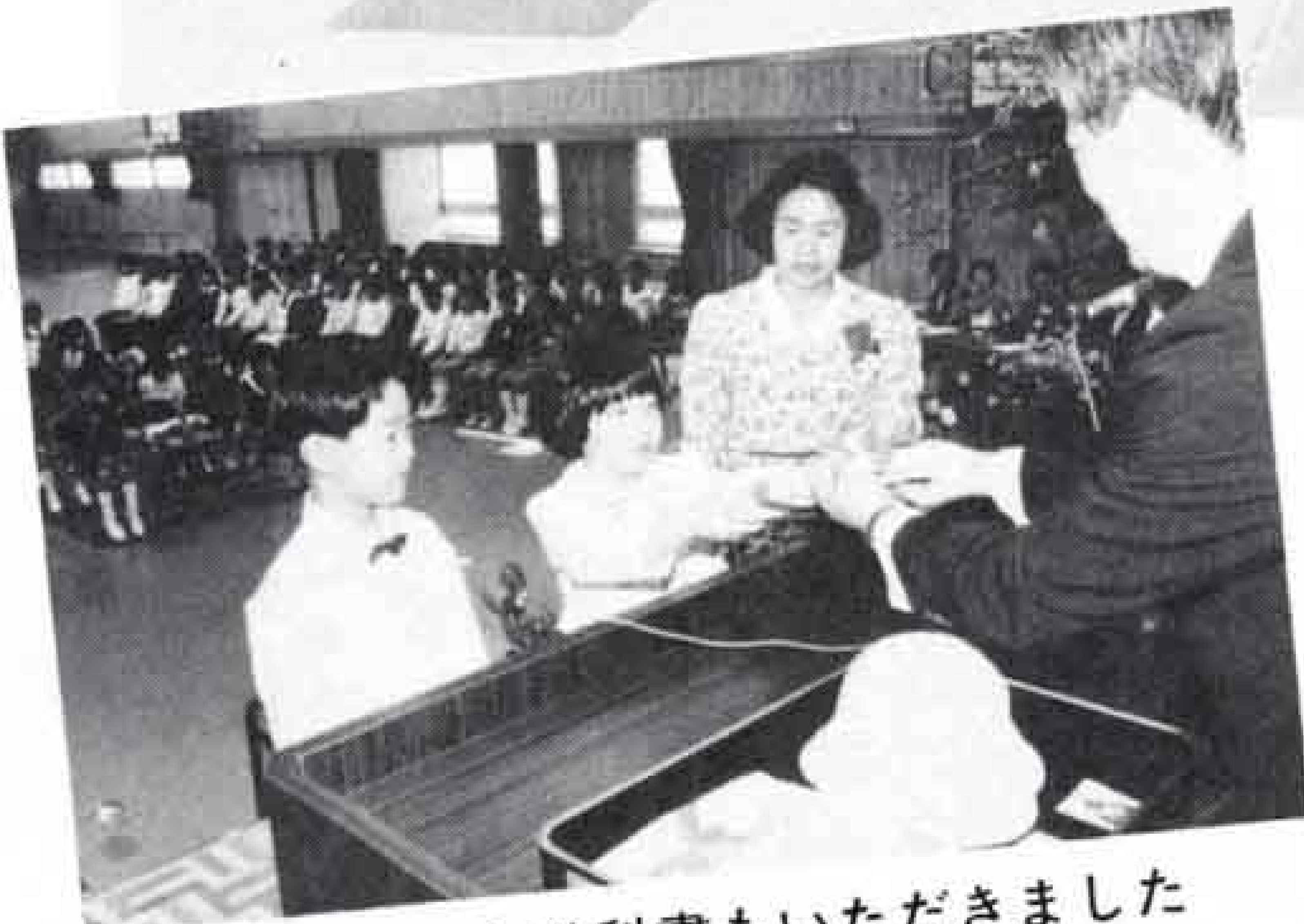
△校長先生から教科書もいただきました