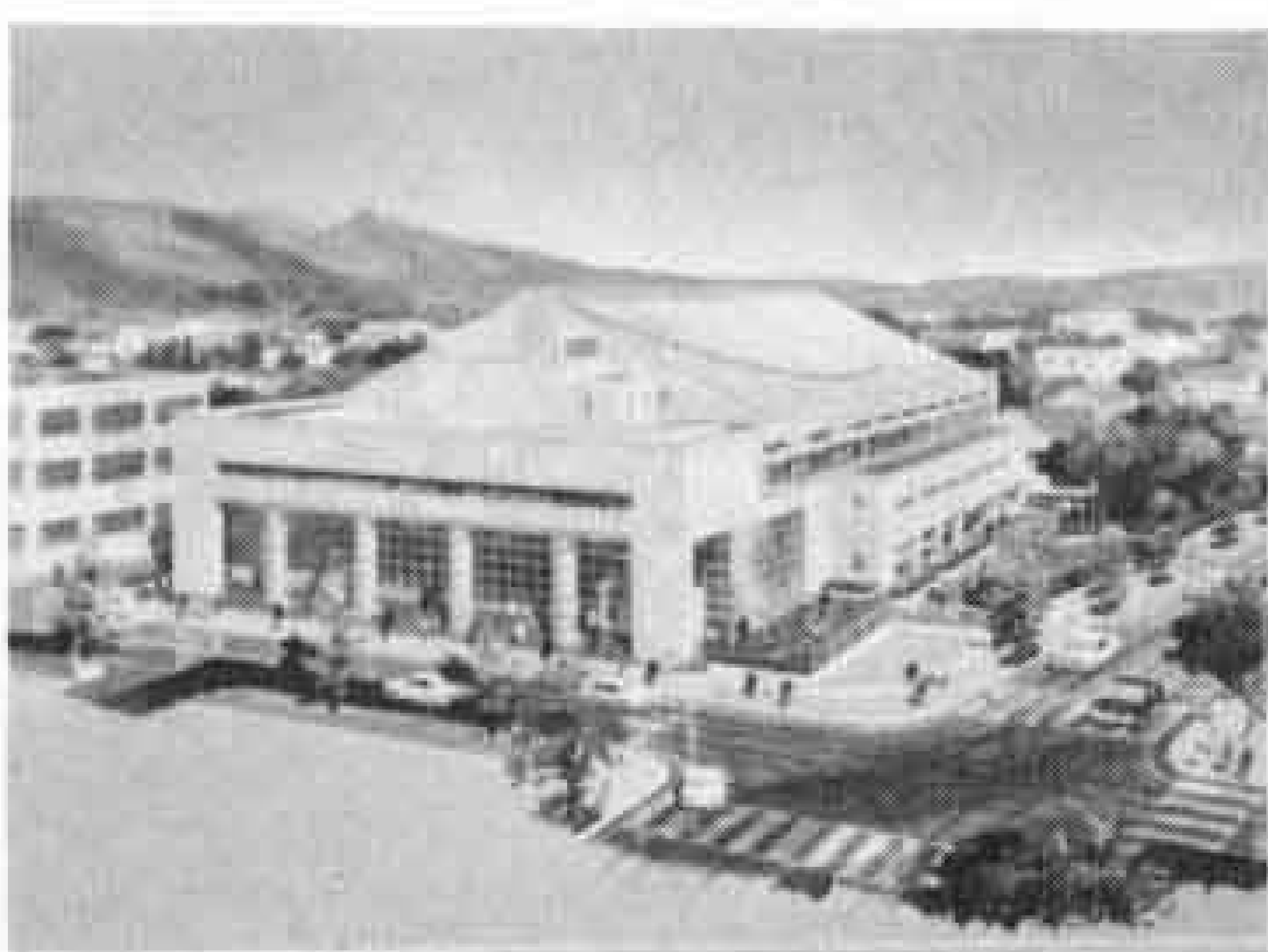
△高校総体、バドミントン会場となる市立体育館完成予想図