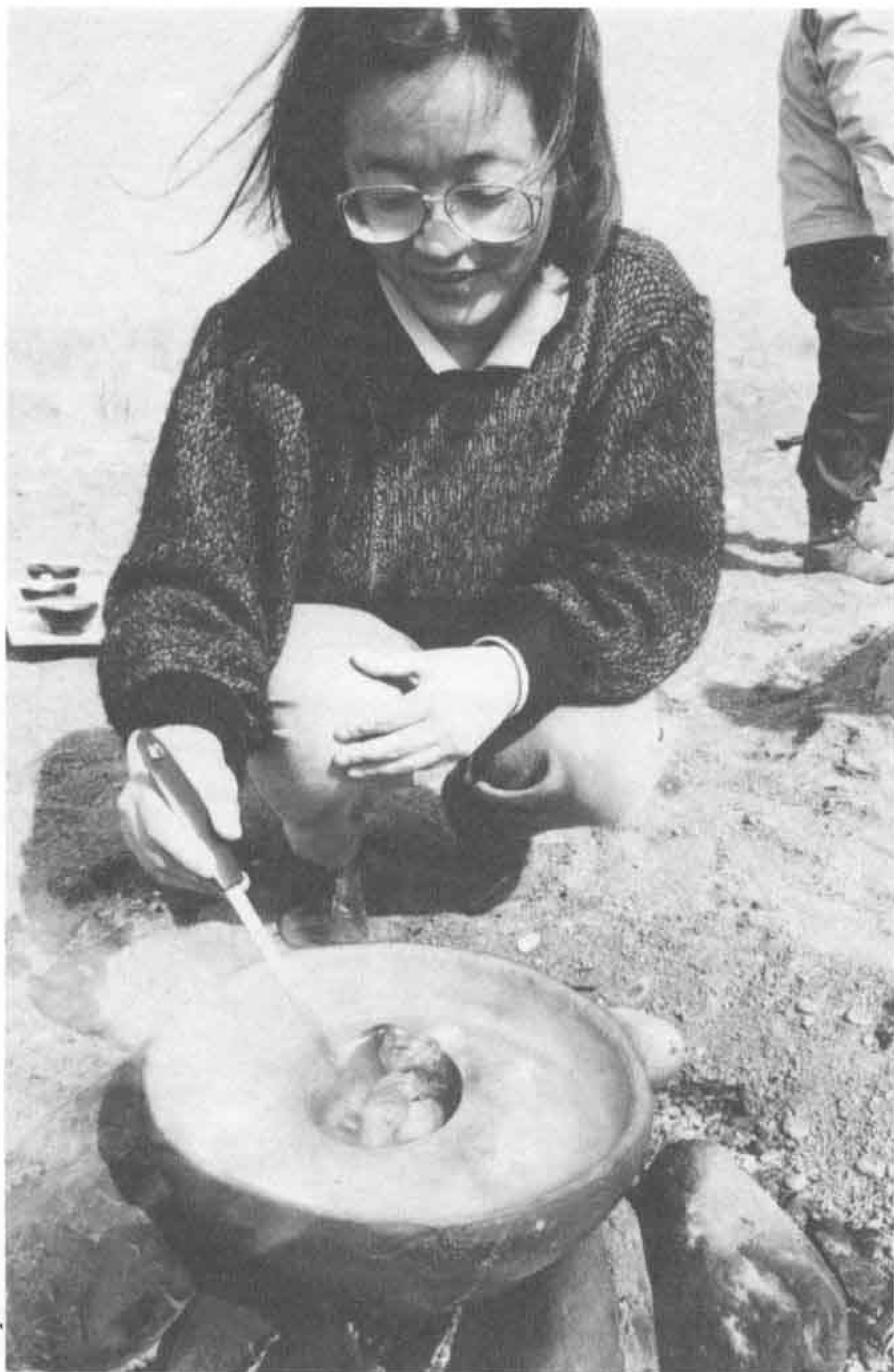
△土器であさりを煮てみました。なかなかグー。