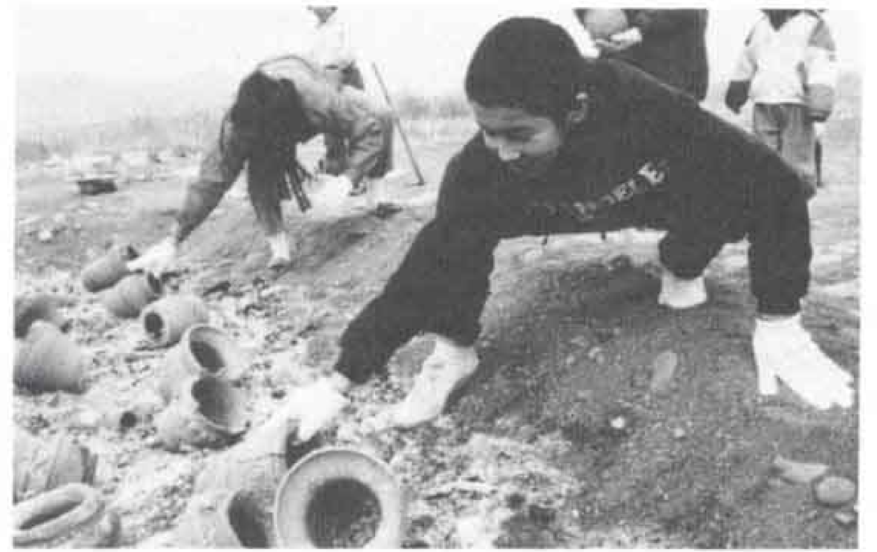
△「アチチ」焼き上がった作品はとても熱い。