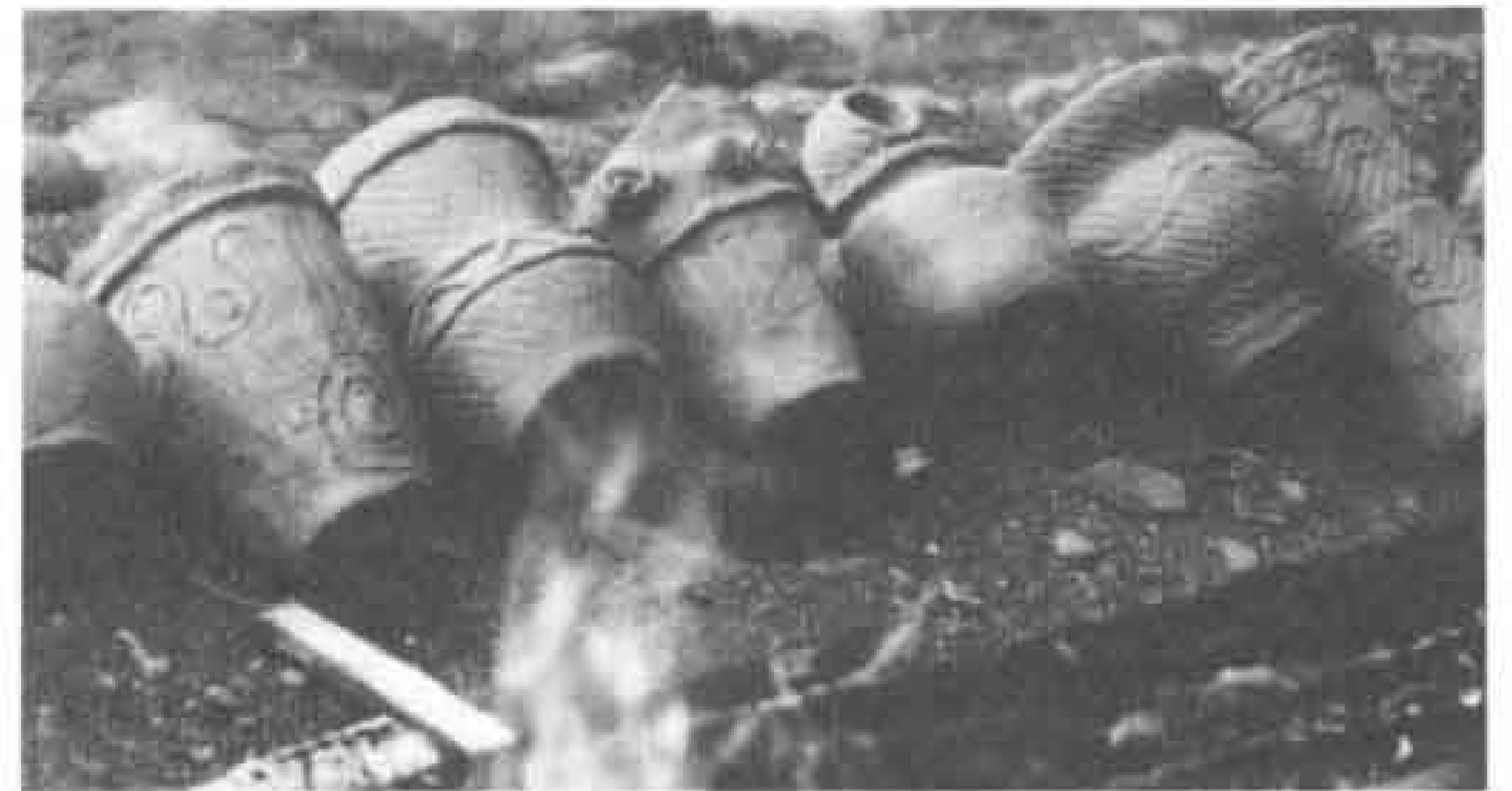
△どこから見ても縄文土器。