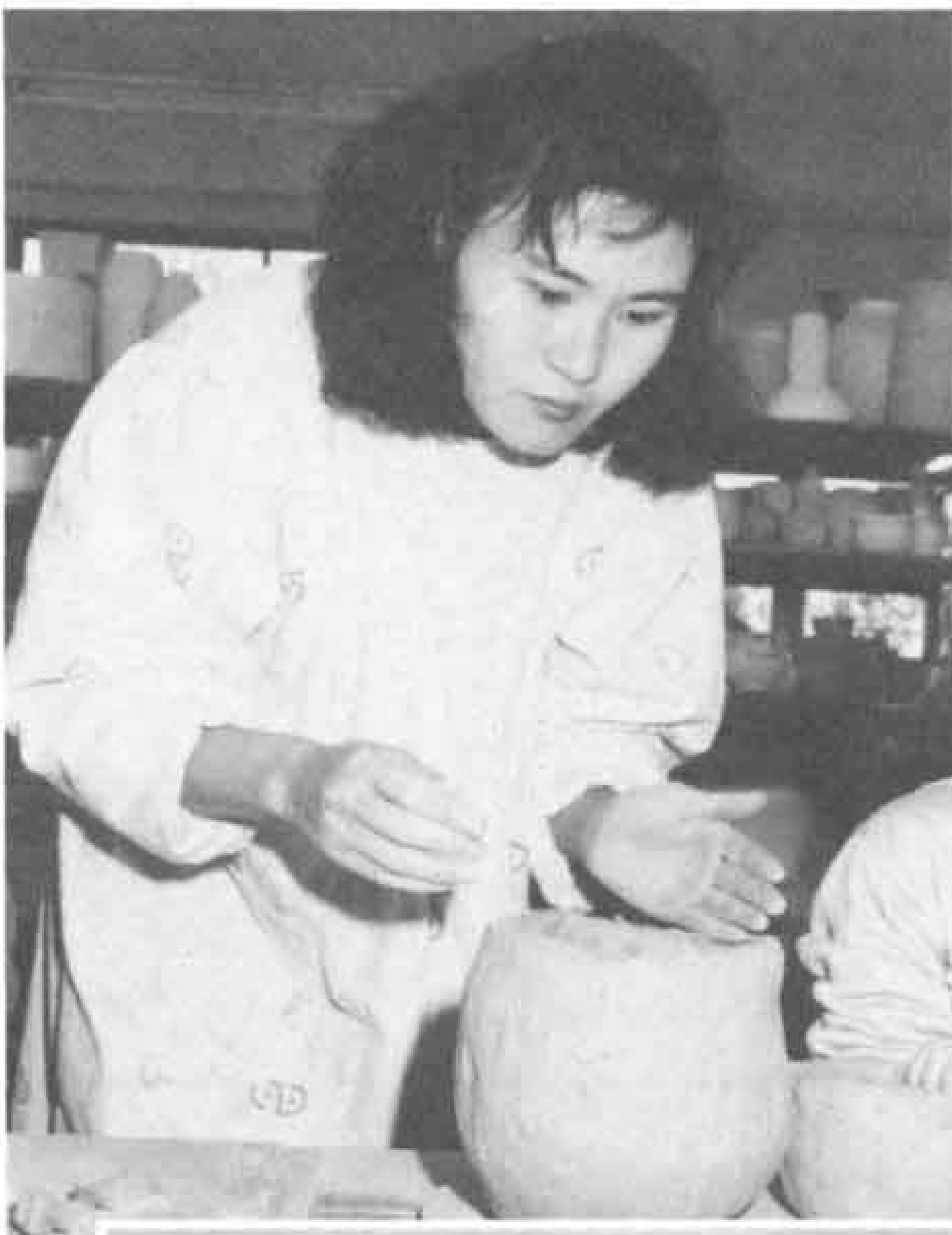
△形がなかなか思ったとおりになりません。

二月四日(日)と十八日(日)の二日間にわたって「縄文土器づくり講座」が市立博物館の主催で開かれました。参加者は中学生から熟年者まで十人。四日は博物館工芸室で土器を粘土から形づくり、十八日には富士川で野焼きをしました。焼ける間には、縄文時代の道具を使って、当時の料理にもチャレンジ。参加した皆さんは古代人の知恵を改めて知ったようでした。