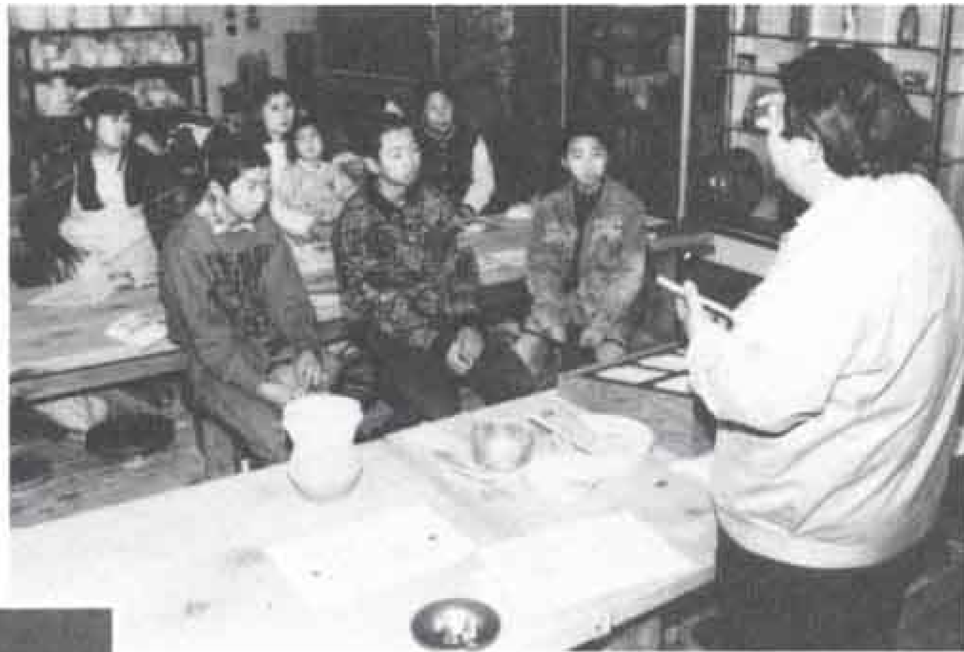
△縄文時代の生活のことも含めて、最初は講義。

二月四日(日)と十八日(日)の二日間にわたって「縄文土器づくり講座」が市立博物館の主催で開かれました。参加者は中学生から熟年者まで十人。四日は博物館工芸室で土器を粘土から形づくり、十八日には富士川で野焼きをしました。焼ける間には、縄文時代の道具を使って、当時の料理にもチャレンジ。参加した皆さんは古代人の知恵を改めて知ったようでした。