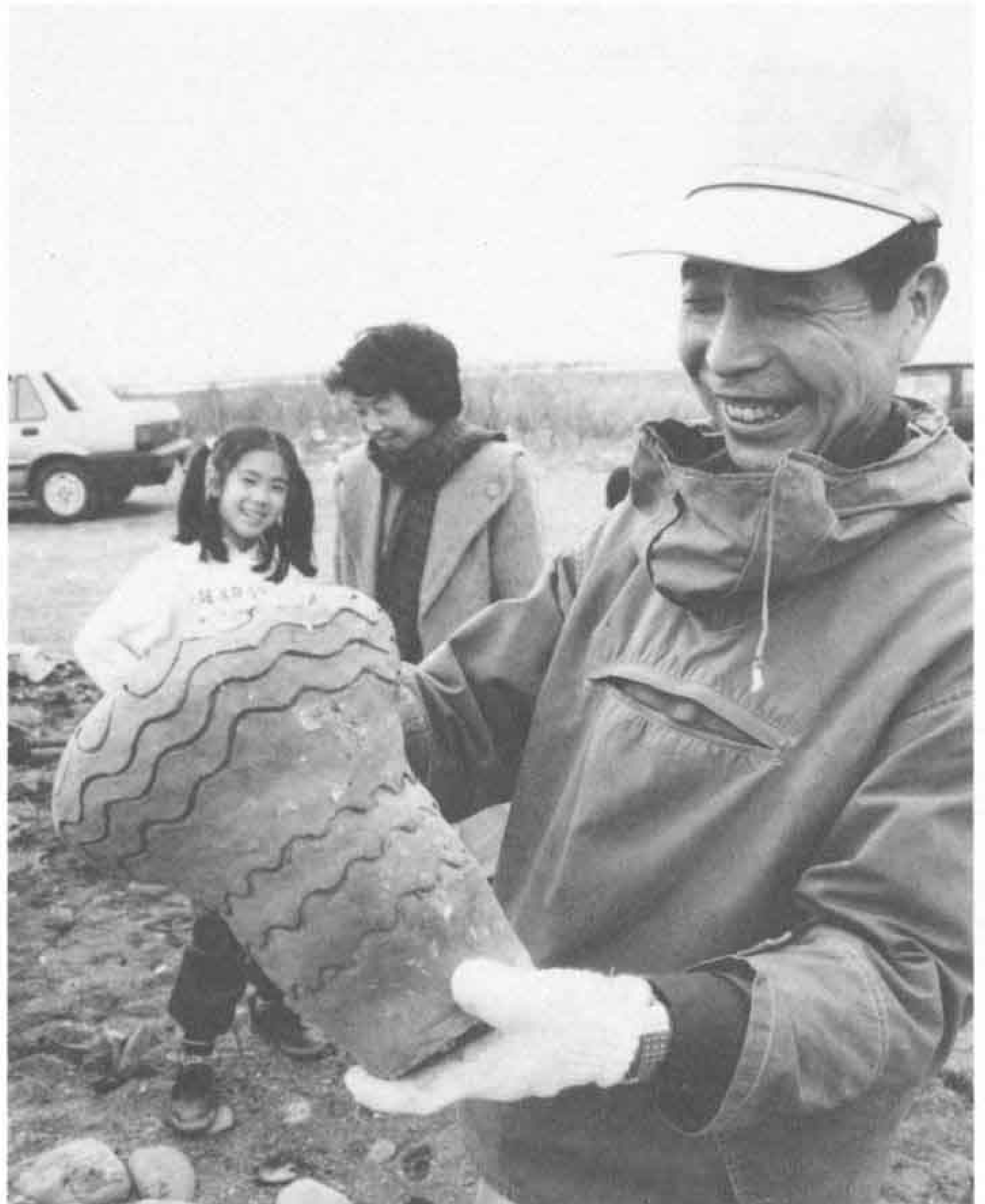
△約六時間燃したのちにでき上がり、思わず顔がほころぶ。