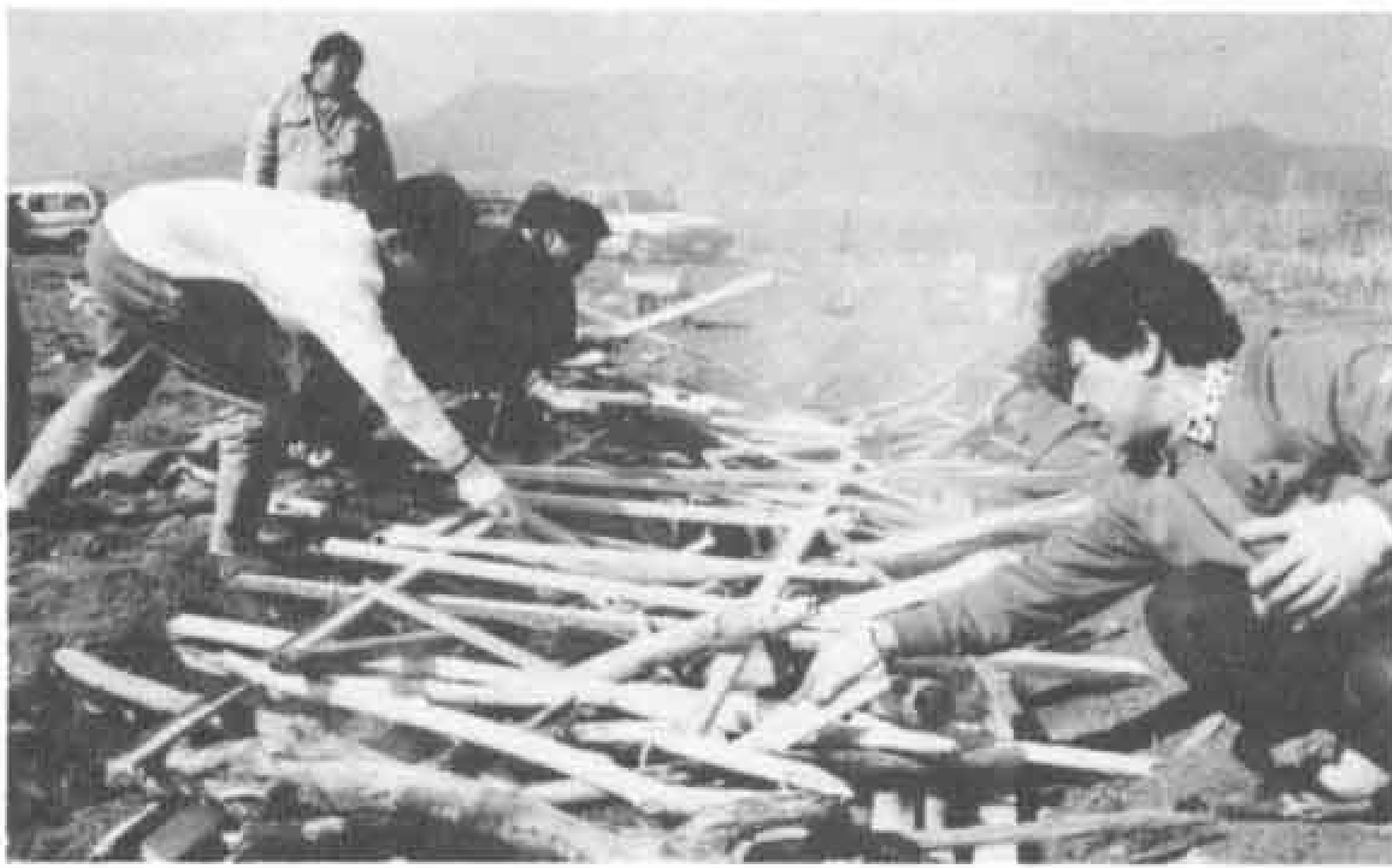
△いよいよ本格的に燃やす。