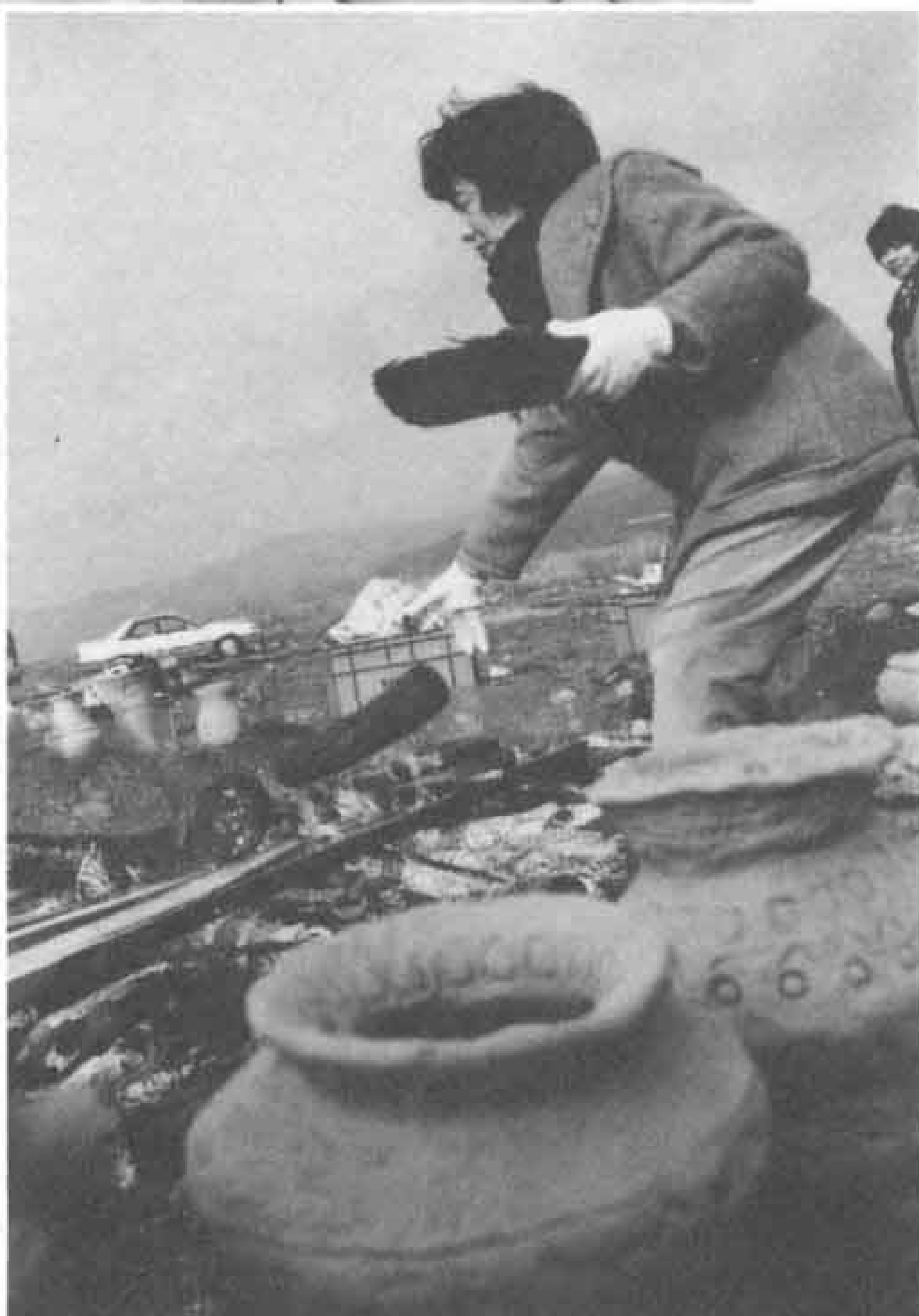
▷初めは火の周囲に置いて乾かす。