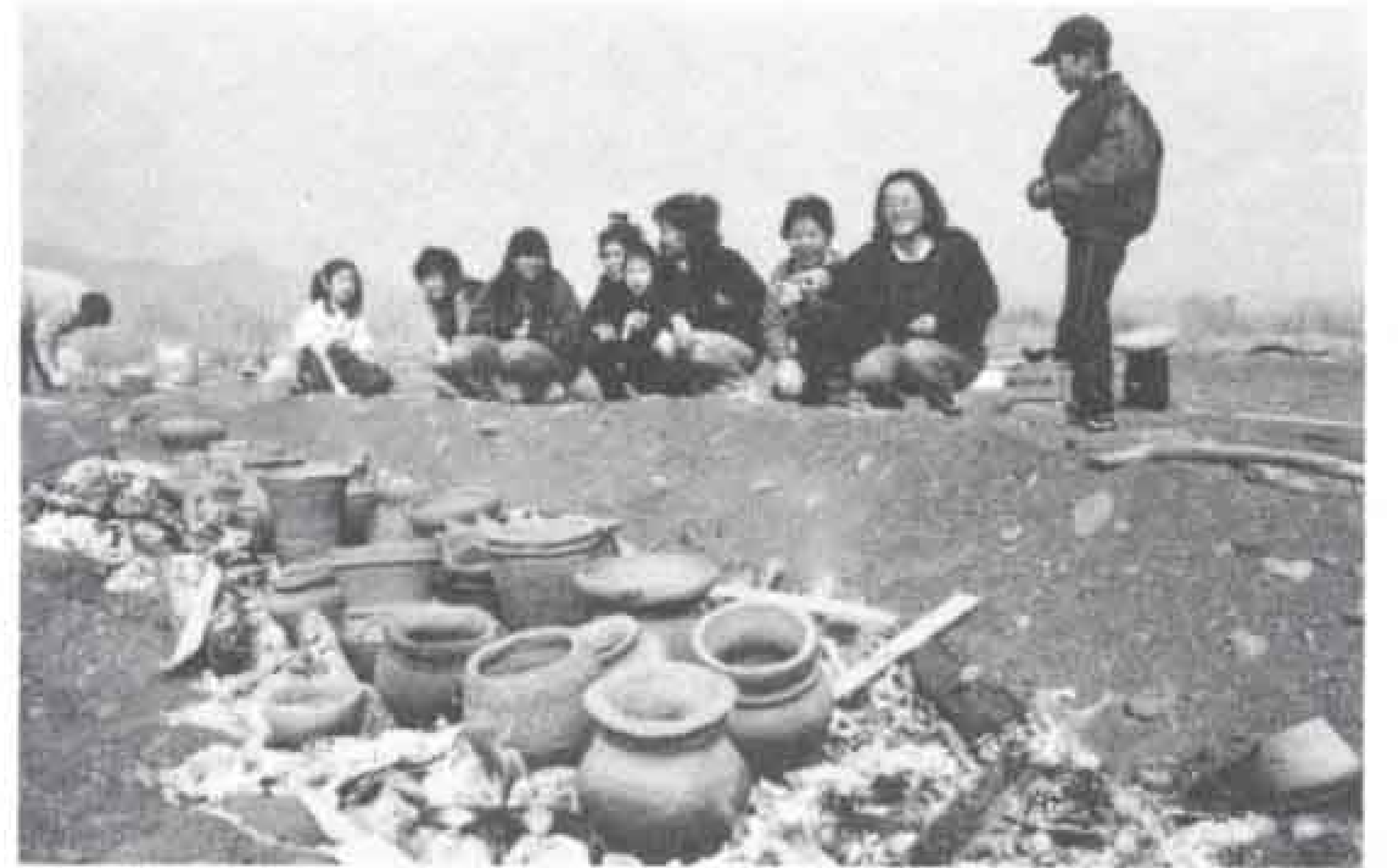
△おきの上に置いてさらに乾かす。