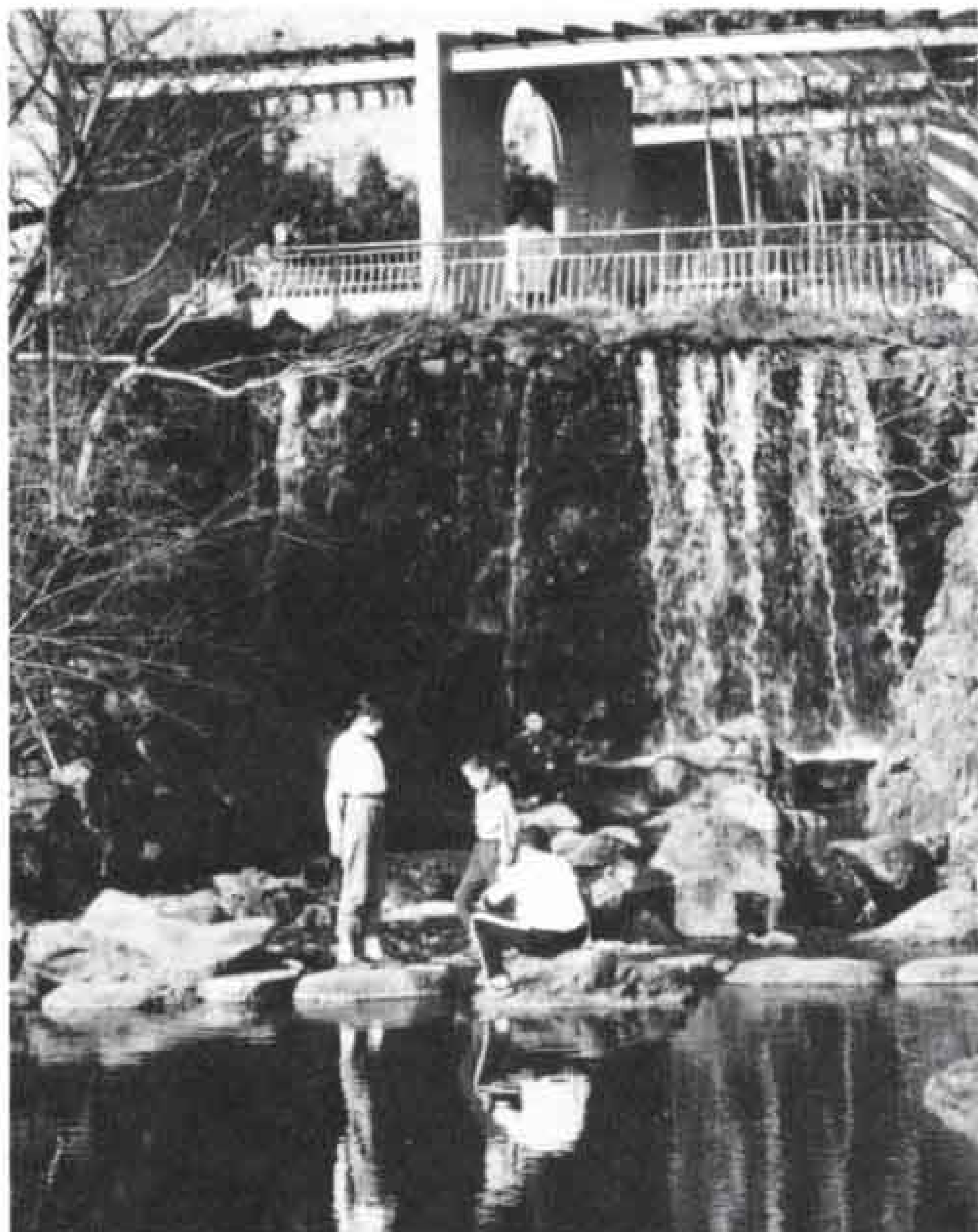
△見どころの一つ「滝」