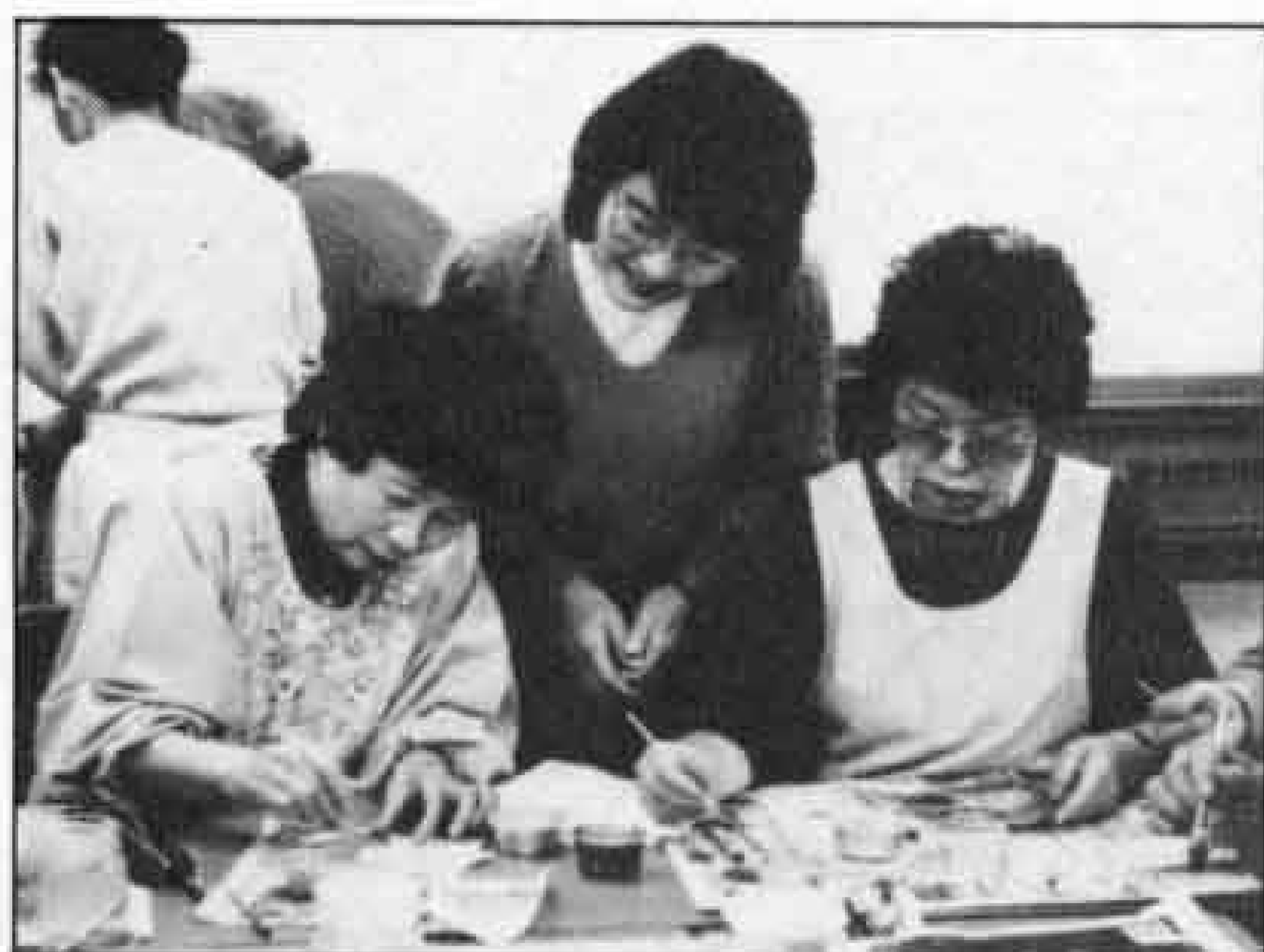
△皆さんとても熱心