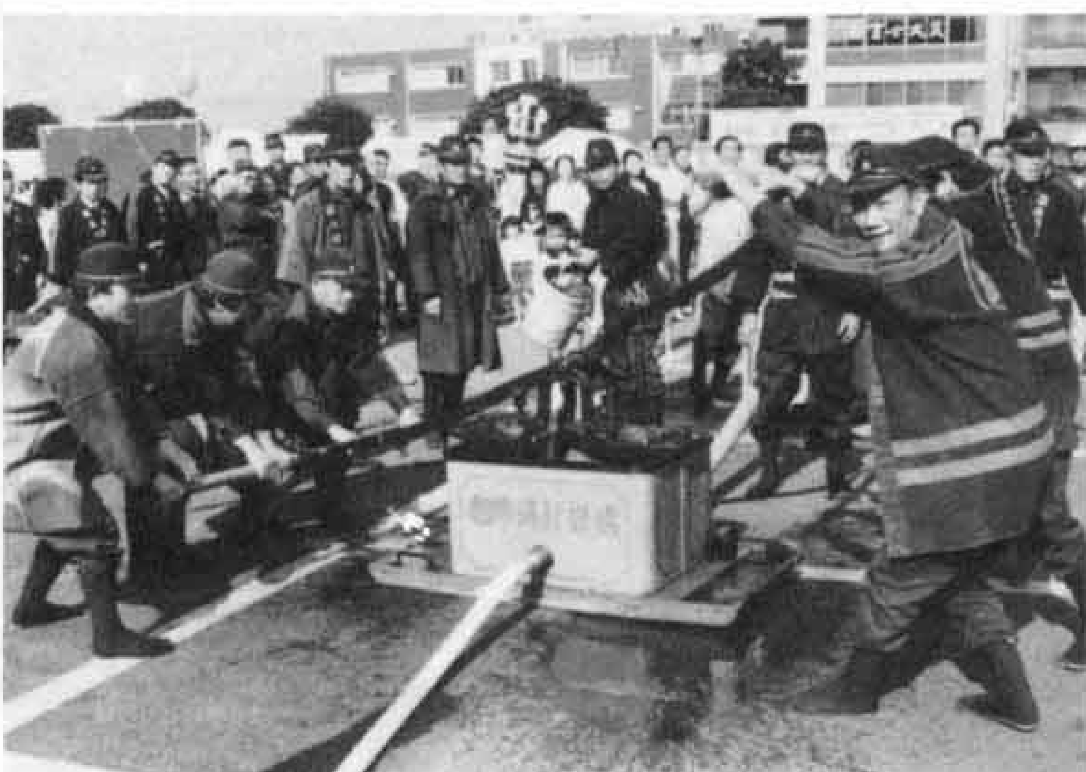
▷今は使われていない腕用ポンプも登場

晴天に恵まれた十一月十二日、「第三回消防まつり」が市役所の駐車場で行われました。会場では、消防車や救急用具を展示しPRに努める一方、一丁十円の豆腐、マグロのぶつ切りの無料配布などサービス品も盛りだくさん。また演技会場では、カラーガード隊の演技、幼年消防隊の演奏なども披露され、楽しい一日となりました。途中で火事がなくてよかった!!