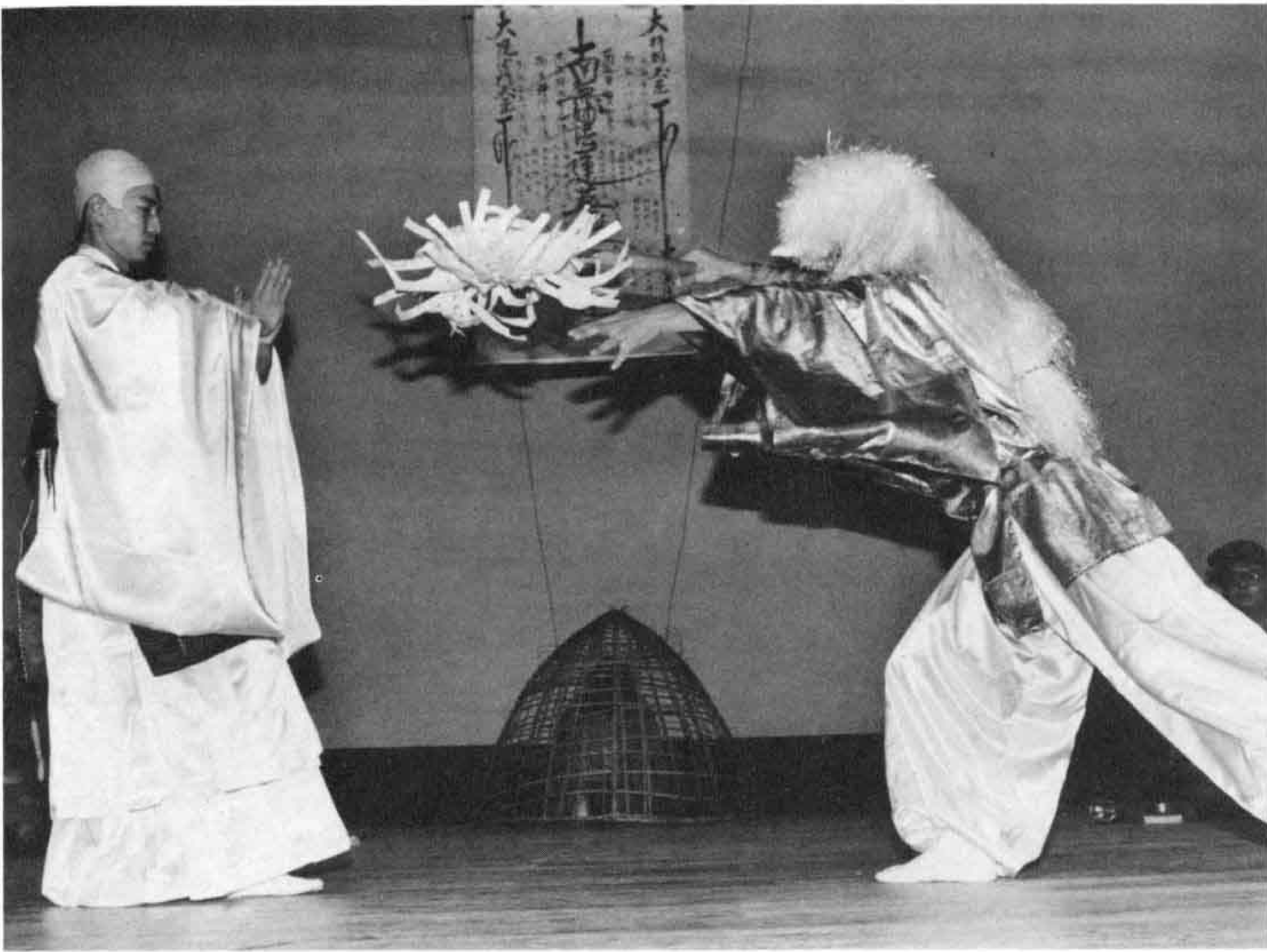
▷神戸青年団による「雨ごい曼陀羅」 まんだら

富士の風土から培われた郷土芸能が一堂に会する「ふるさと芸能祭」。六回目のことは、十一月十九日吉原市民会館で開催されました。「鶴無ヶ淵神楽」や「富士甲子離子」など伝統的な芸能と合わせ、今回は幾つか新しい試みもみられました。