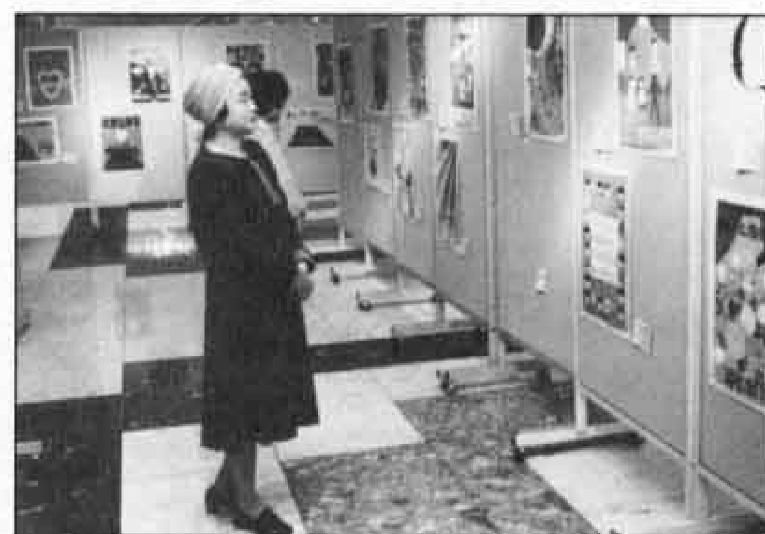
△カラフルで楽しいポスター展でした