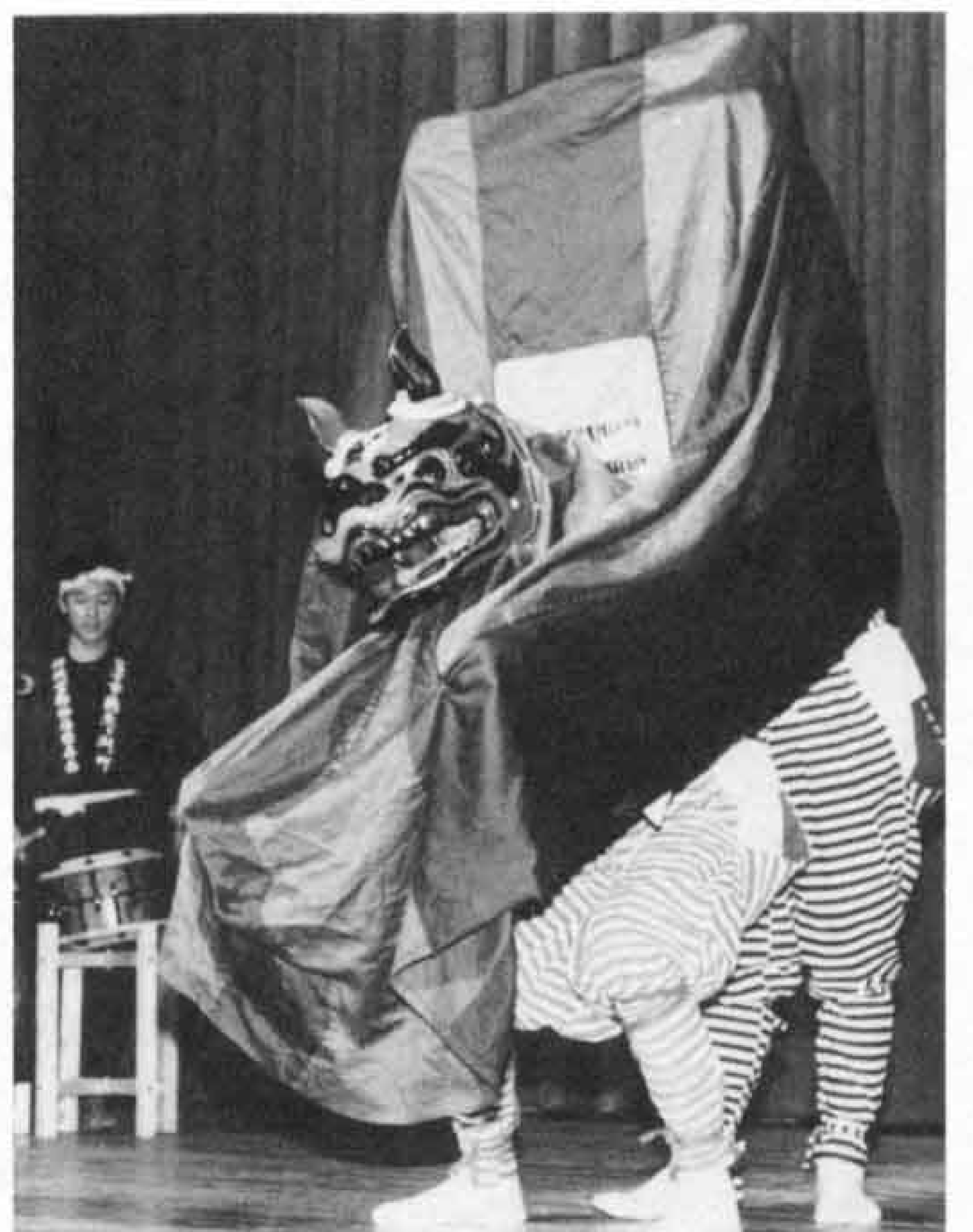
△鶴無ヶ淵神楽保存会による「鶴無ヶ淵神楽」