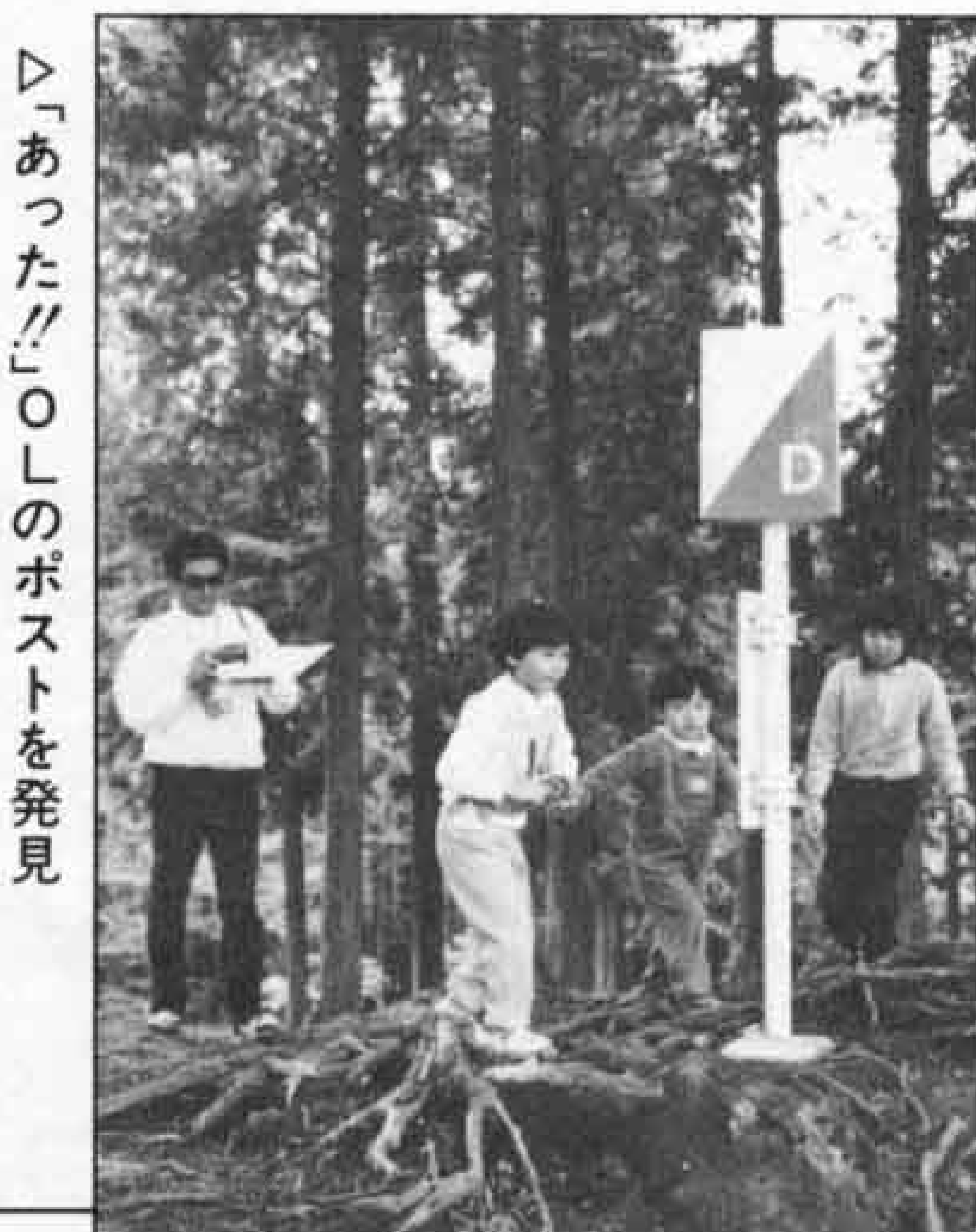
▷「あった!!」OLのポストを発見

参加者は親子30組、約100人。オリエンテーリング(OL)をしながら自然を満喫し、さわやかな汗を流しました。また、お昼には特製「丸火汁」で食欲の秋も味わいました。