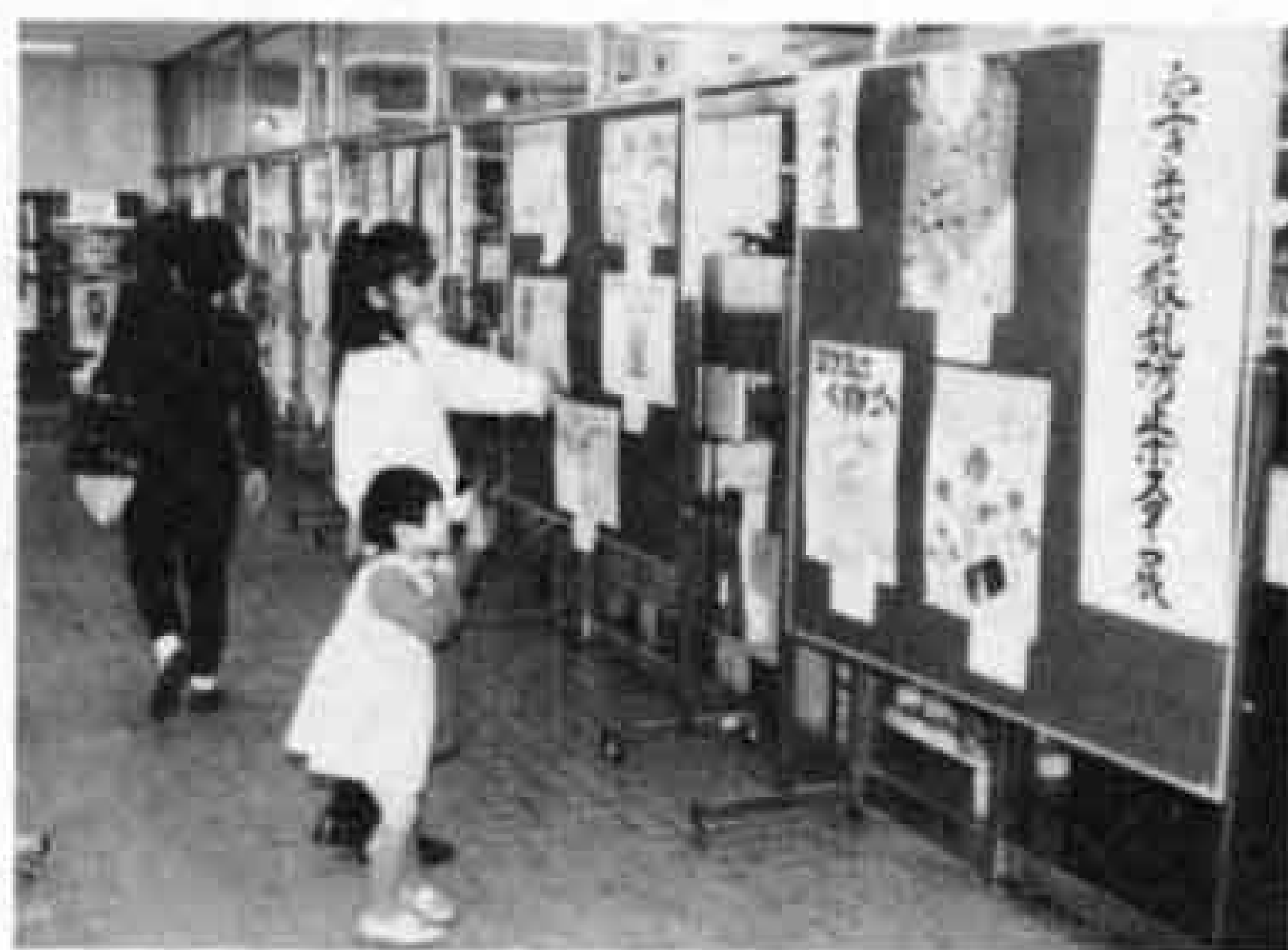
△「空き缶はくずかごへ入れるのよ」とお母さん

しかし、何せ新幹線のスピードです。日本一の長さと言っても、約25秒ぐらいで通り過ぎてしまいます。