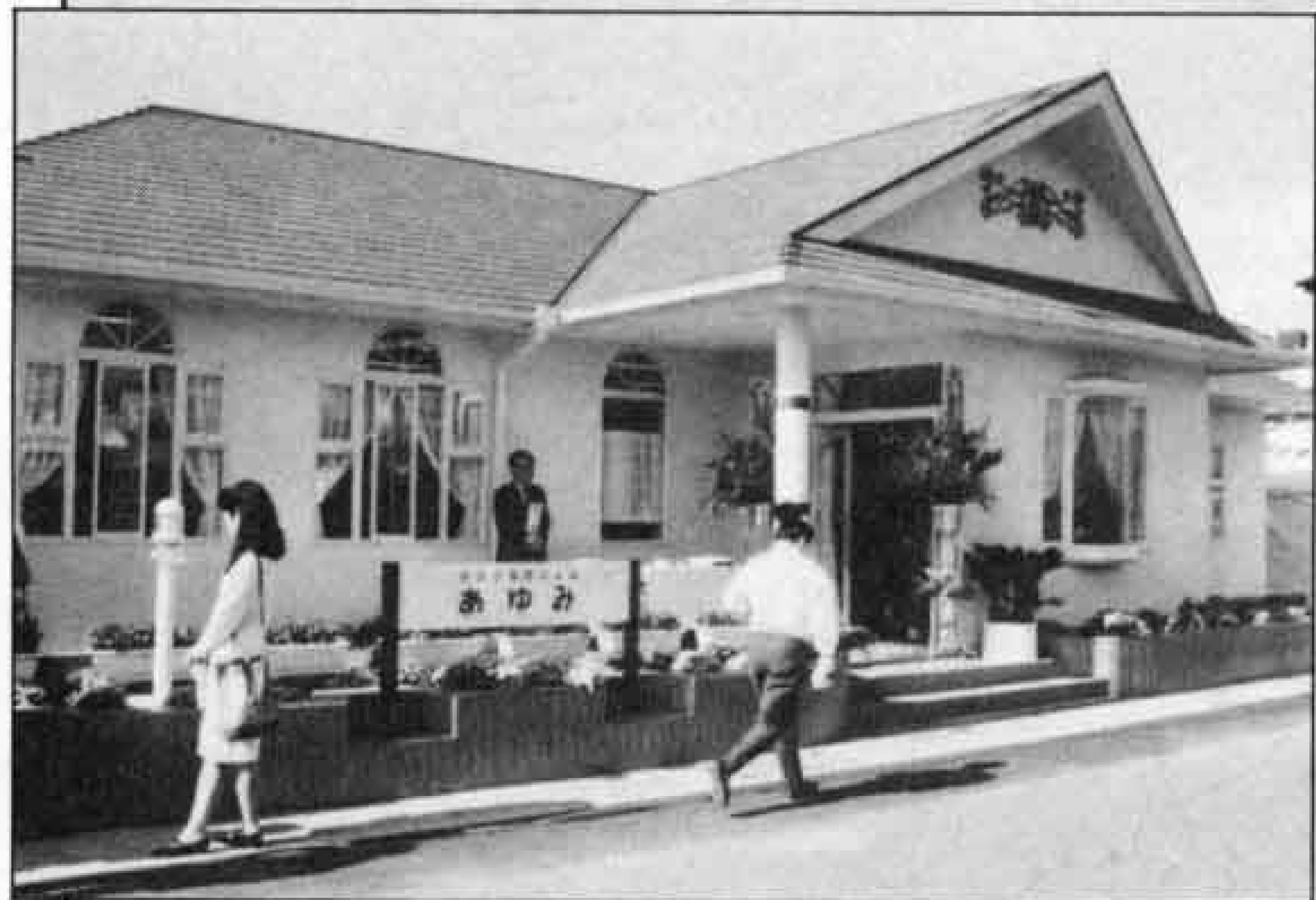
◁薄いピンク色のかわいい建物

時計や電気製品、自転車などのリサイクル品から、トイレペーパー・陶器・和紙人形・野菜など商品はいろいろ。冷やかし客も大歓迎。皆さんのお越しを心持ちにしています。営業時間等の問い合わせは☎64-0694へ。