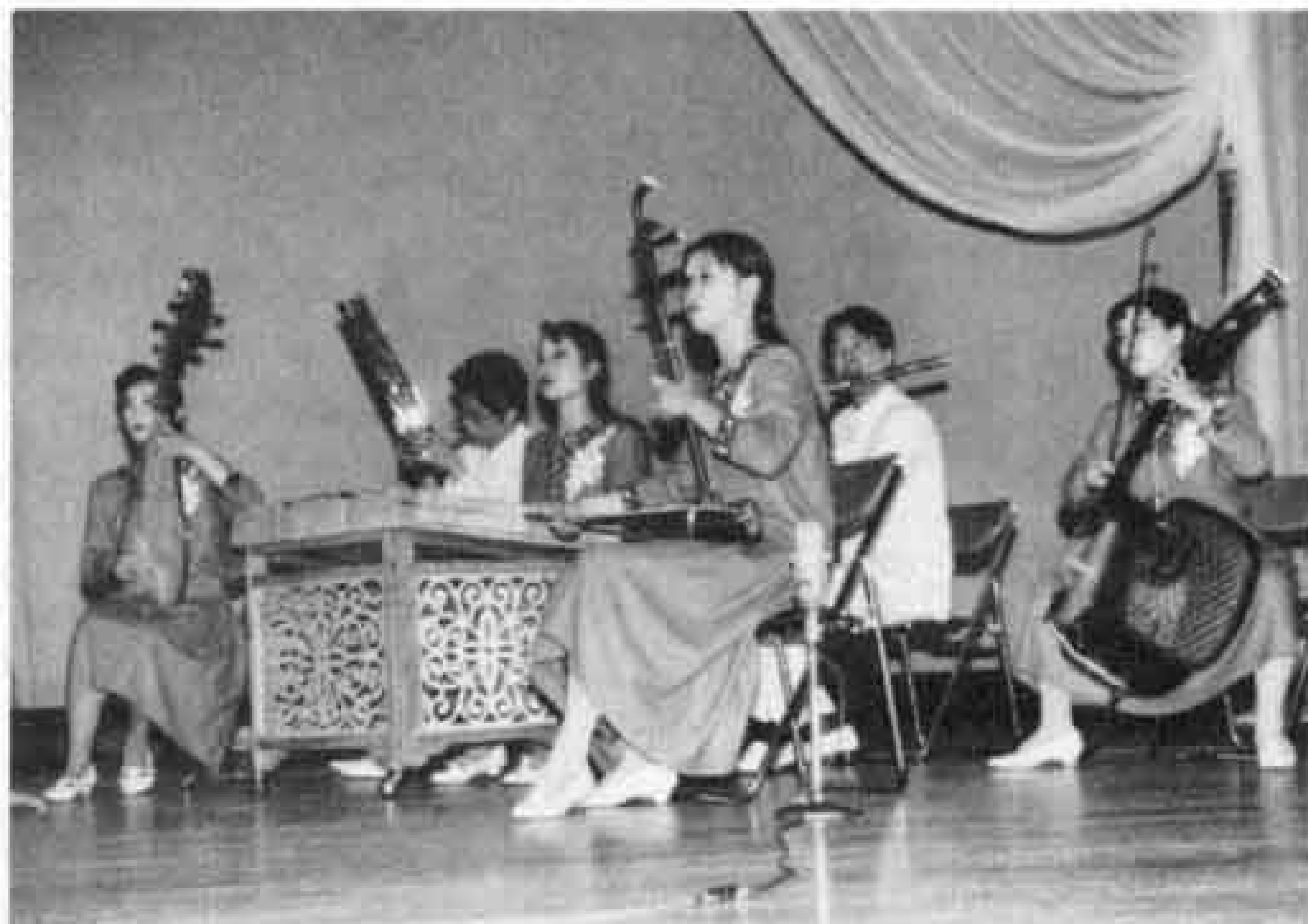
◁優雅な音色でした

また、富士市少年少女合唱団の皆さんが賛助出演して、「四季の歌」などを中国語もまじえて合唱。友好を深めました。