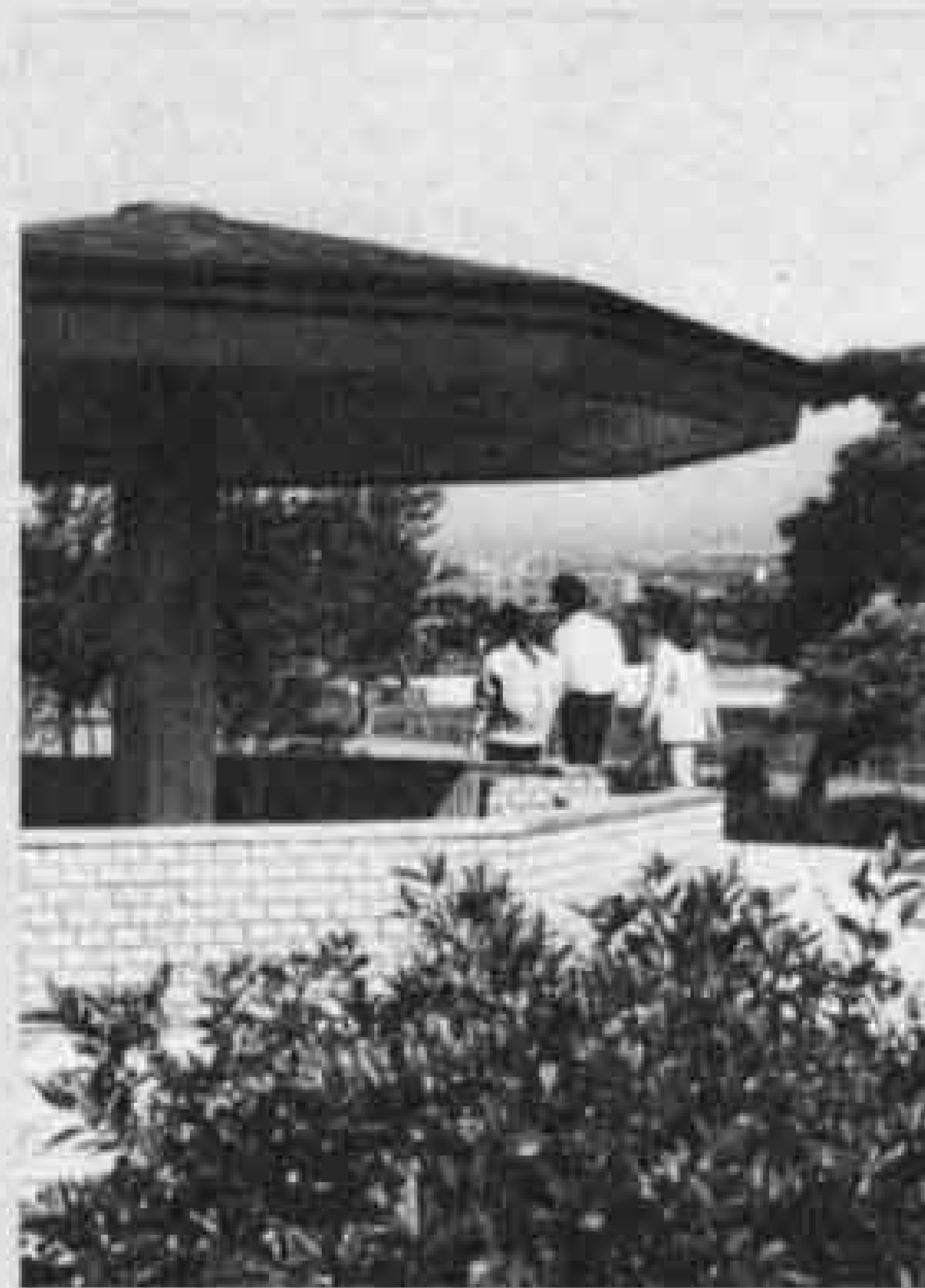
△高台にはあずまやが

平成三年三月の完成を目指し、急ピッチで工事が進められている中央公園。現在、潤井川添いの約半分、二ツ池が完成し散歩などに利用されています。見どころは、池に写る逆さ富士、二月ごろの梅、五月のハナシヨウブなどです。