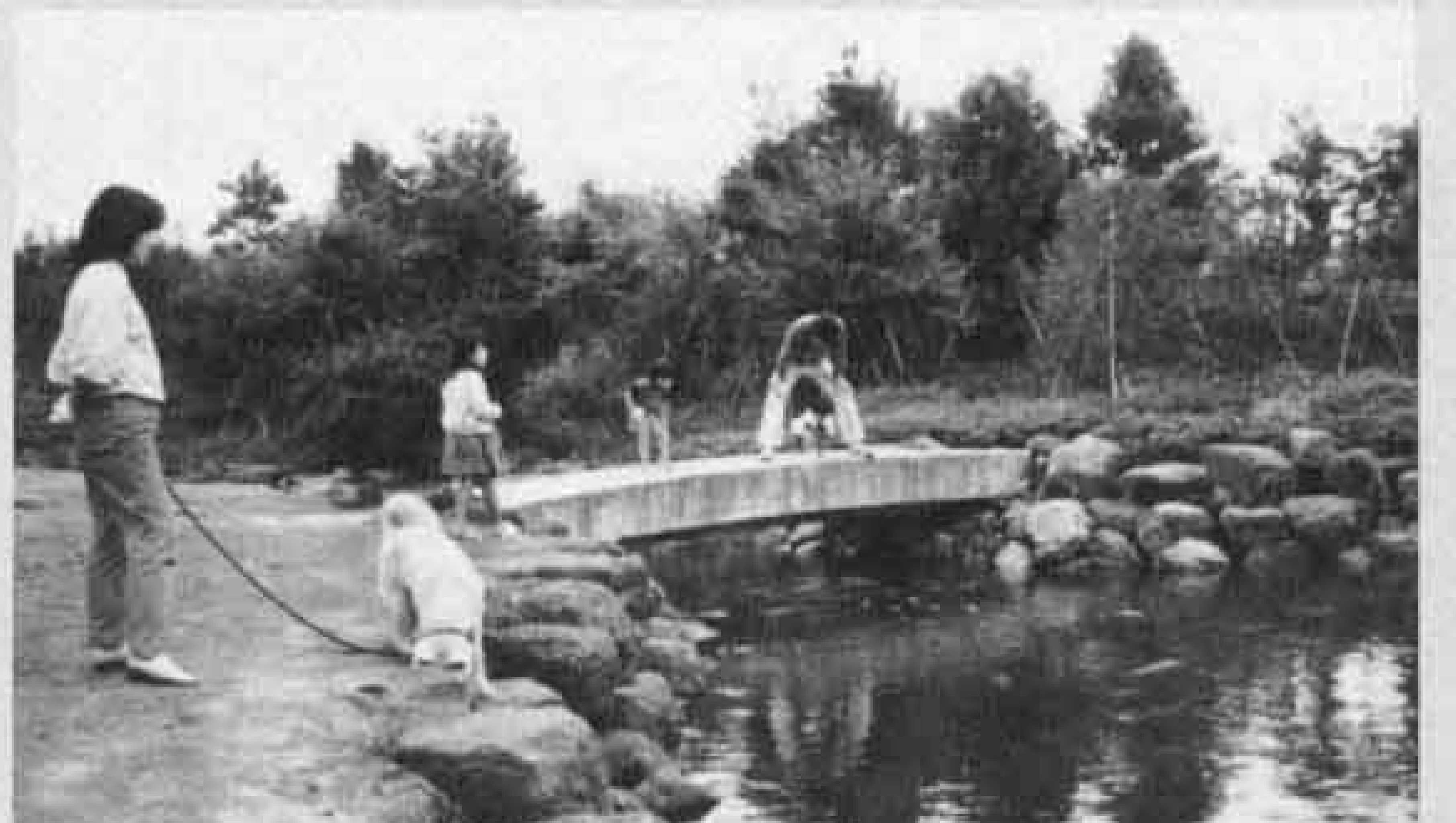
△出て来い出て来い池のこい