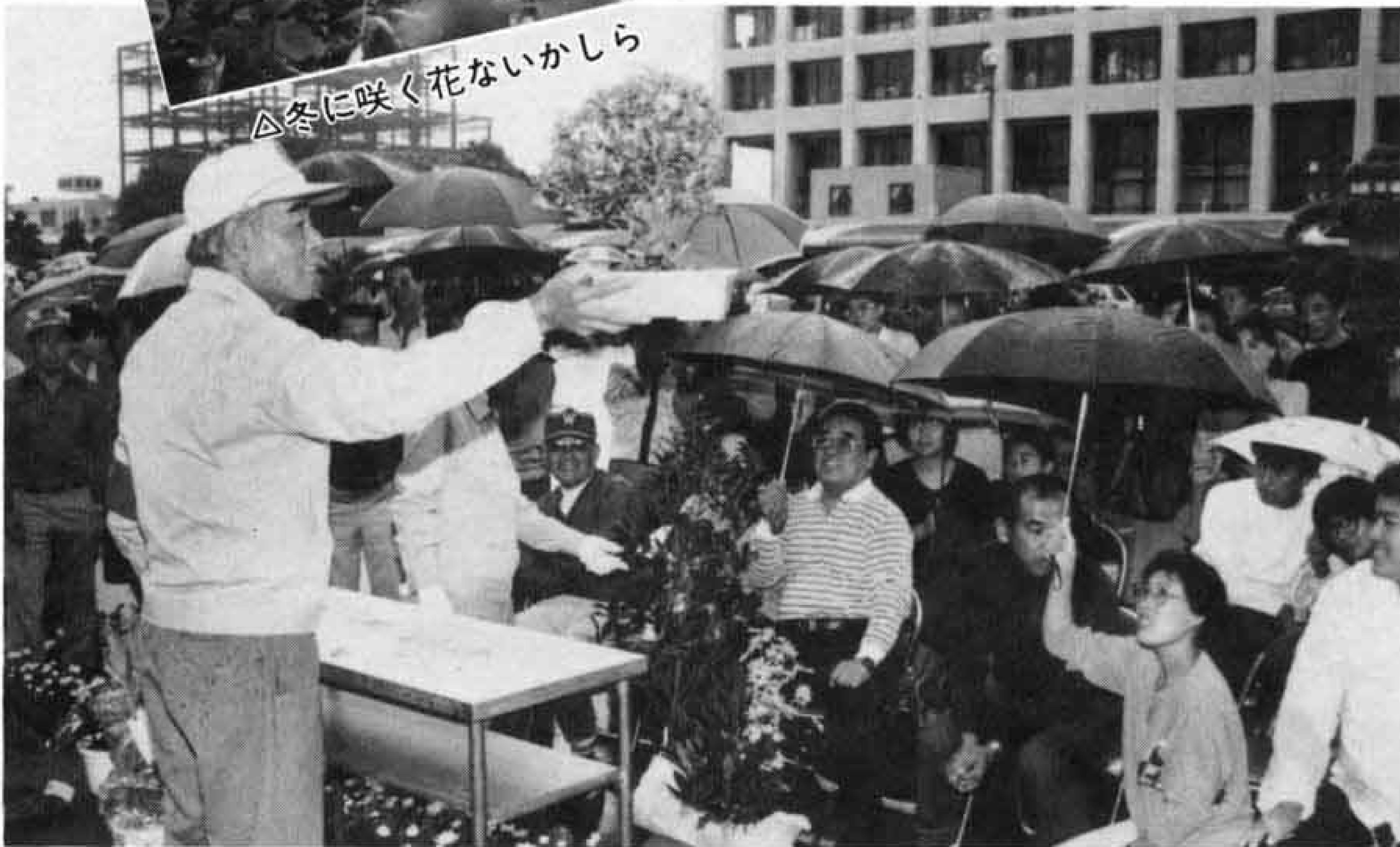
△冬に咲く花ないかしら