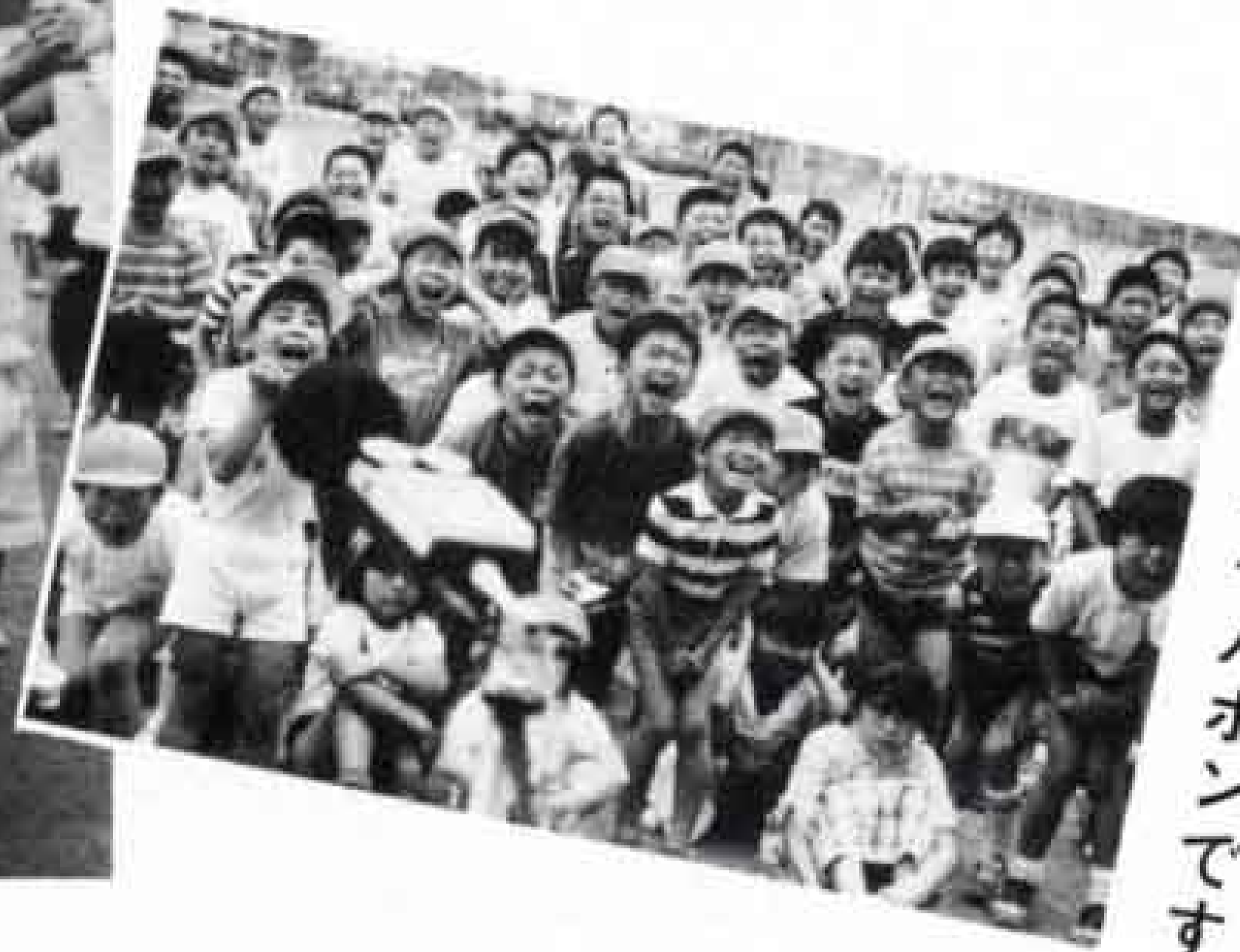
△みんなの声の大きさは百二十八ホンです