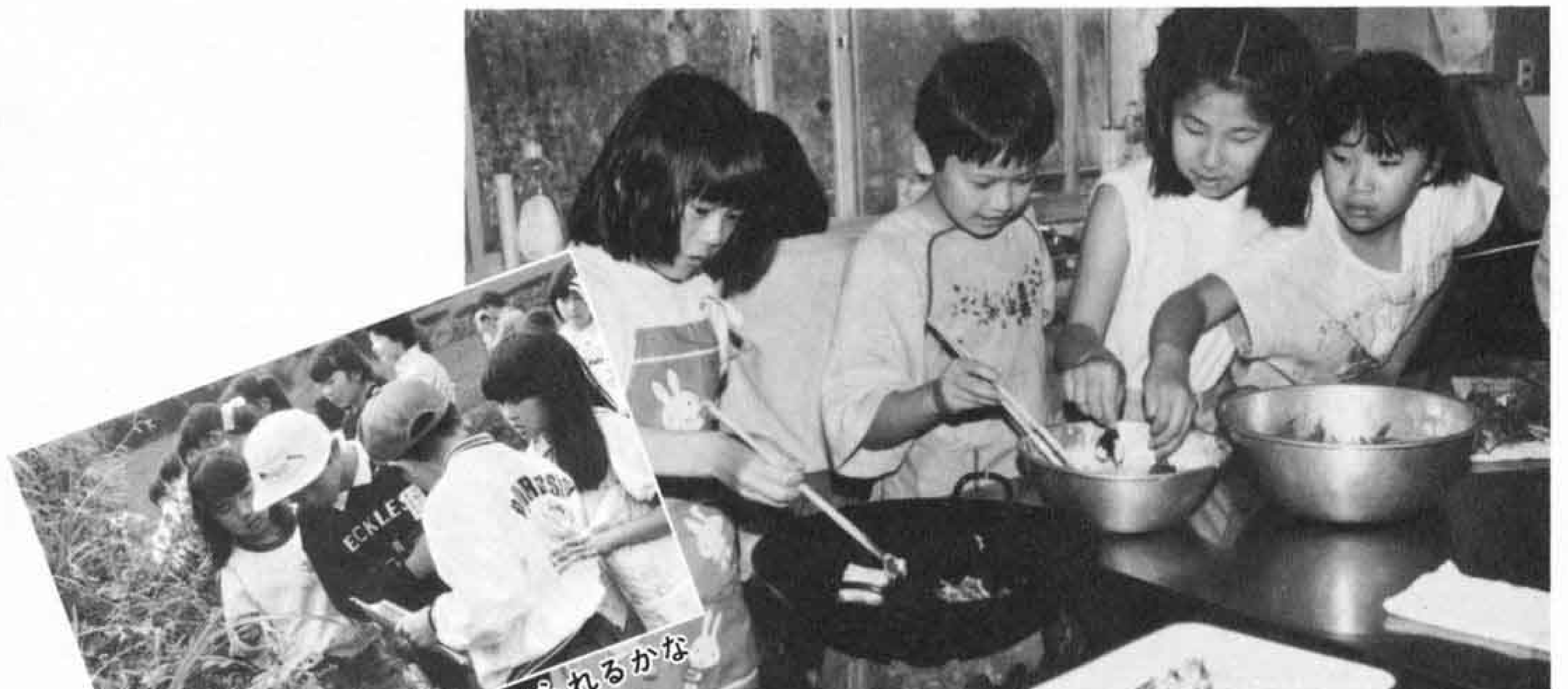
△どの野草が食べられるかな

神戸公民館では、神戸小学校の高学年を対象にしたなんでも挑戦教室で、「野草を食べる会」を行いました。道端などで採集した野草は、ツリガネニンジン、アケビ、ギシギシなど十二種。てんぷらにして食べたあと、「食べられるとは知らなかった」、「おいしかった」の声が聞かれました。