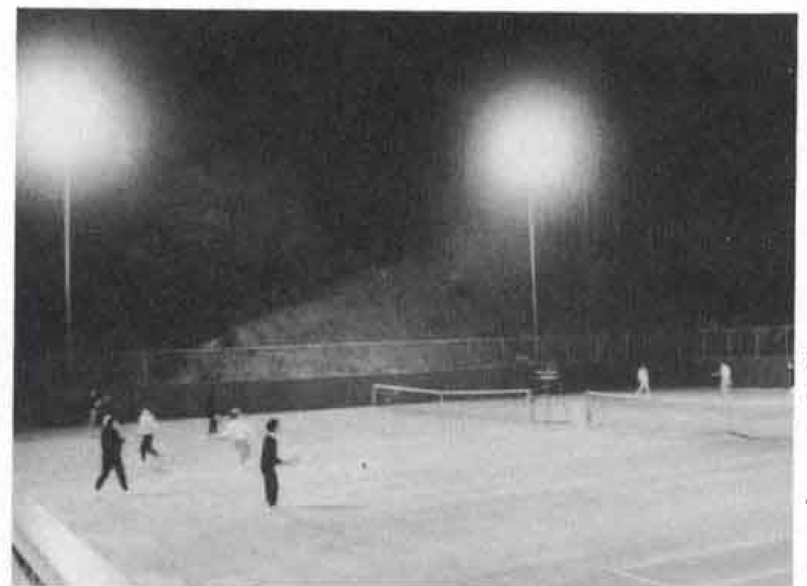
◁人気の高いテニス場、申し込みはお早目に