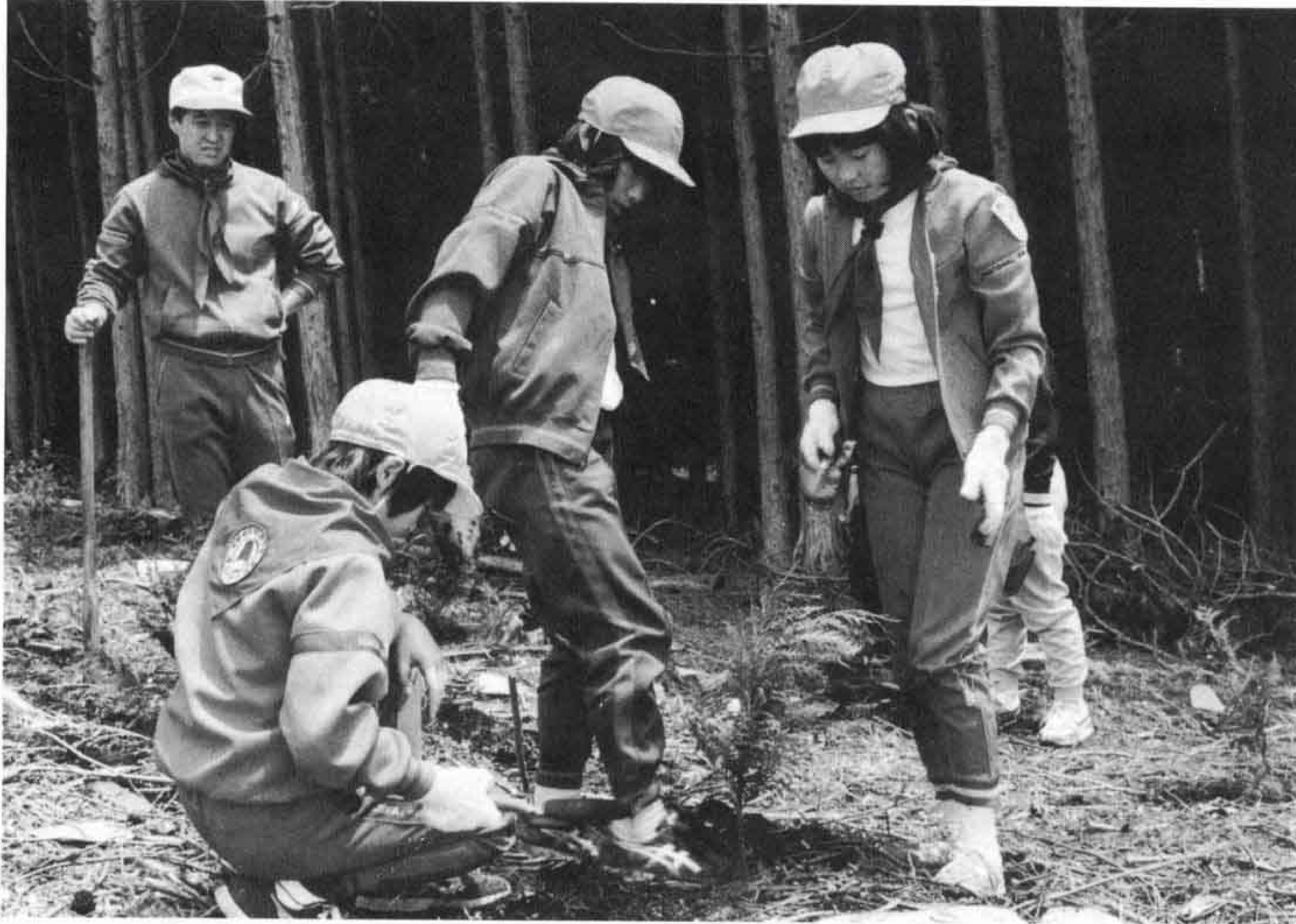
◁苗木は植えた後、根元を軽く踏み固めます