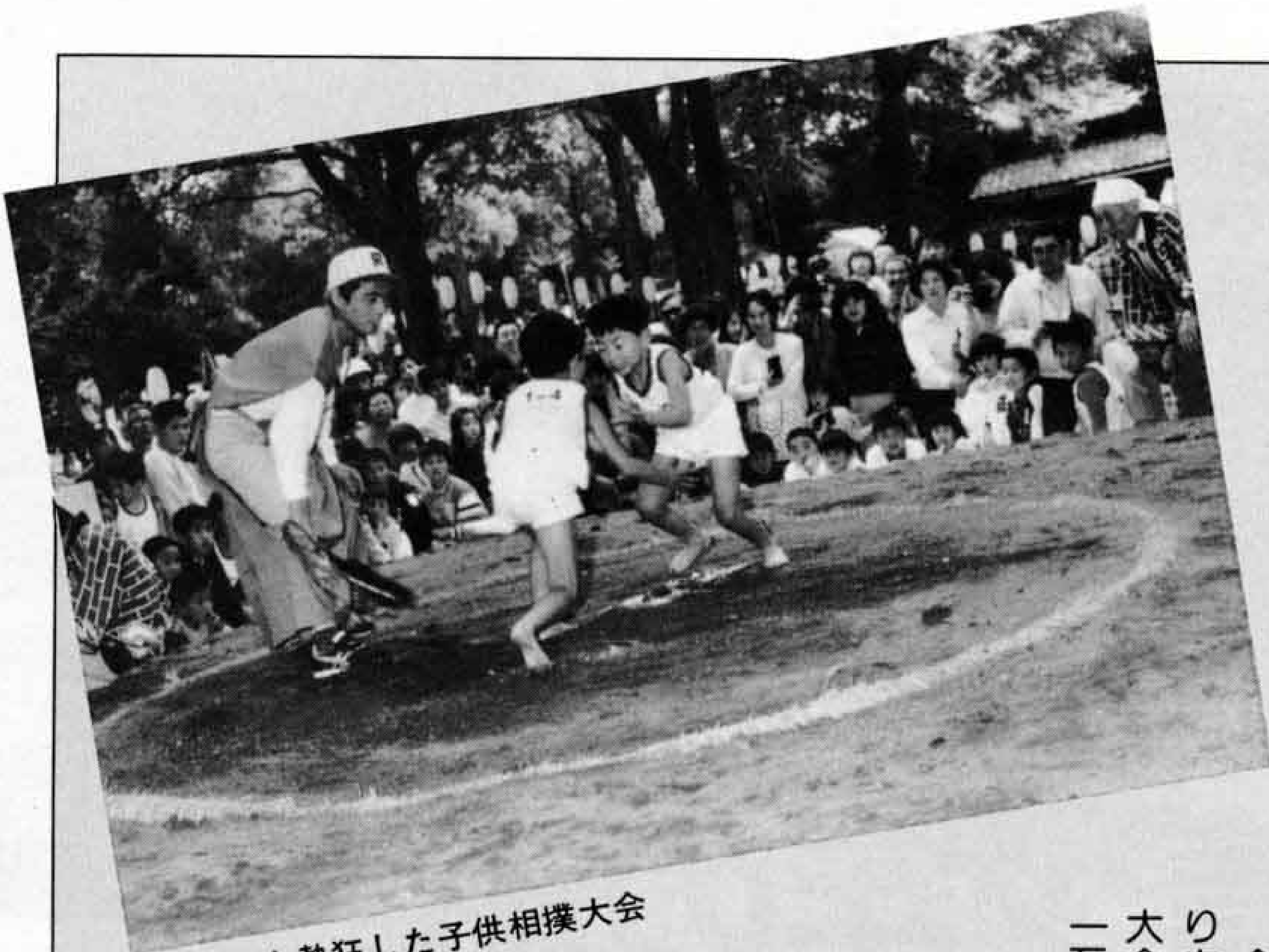
△観衆も熱狂した子供相撲大会