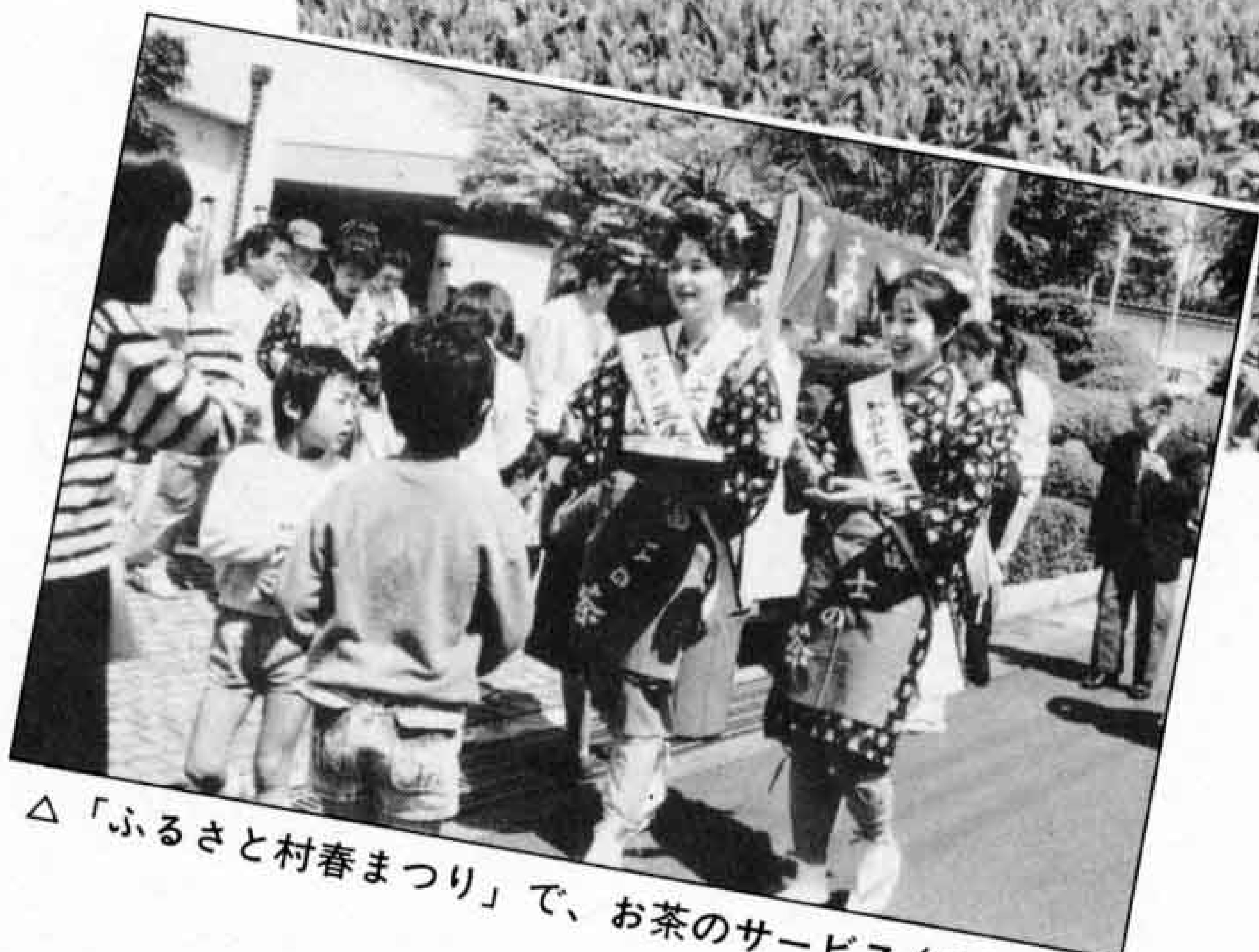
△「ふるさと村春まつり」で、お茶のサービス(4月29日)

四月二十二日のコンテストで、「ミス茶娘」に選ばれたばかりのお嬢さんたちは、ゴールデンウィークを返上して「富士のやぶ北茶」のPRに大活躍。 茶摘みの写真撮影や、ビデオの録画撮りのほか、「ふるさと村春まつり」ではお茶の接待、また新幹線新富士駅での「新茶フェア」にも三日間にわたり参加しました。茶娘たちは連日のキャンペーンに疲れも見せず、道行く人に笑顔で「茶どころ富士」をPRしていました。