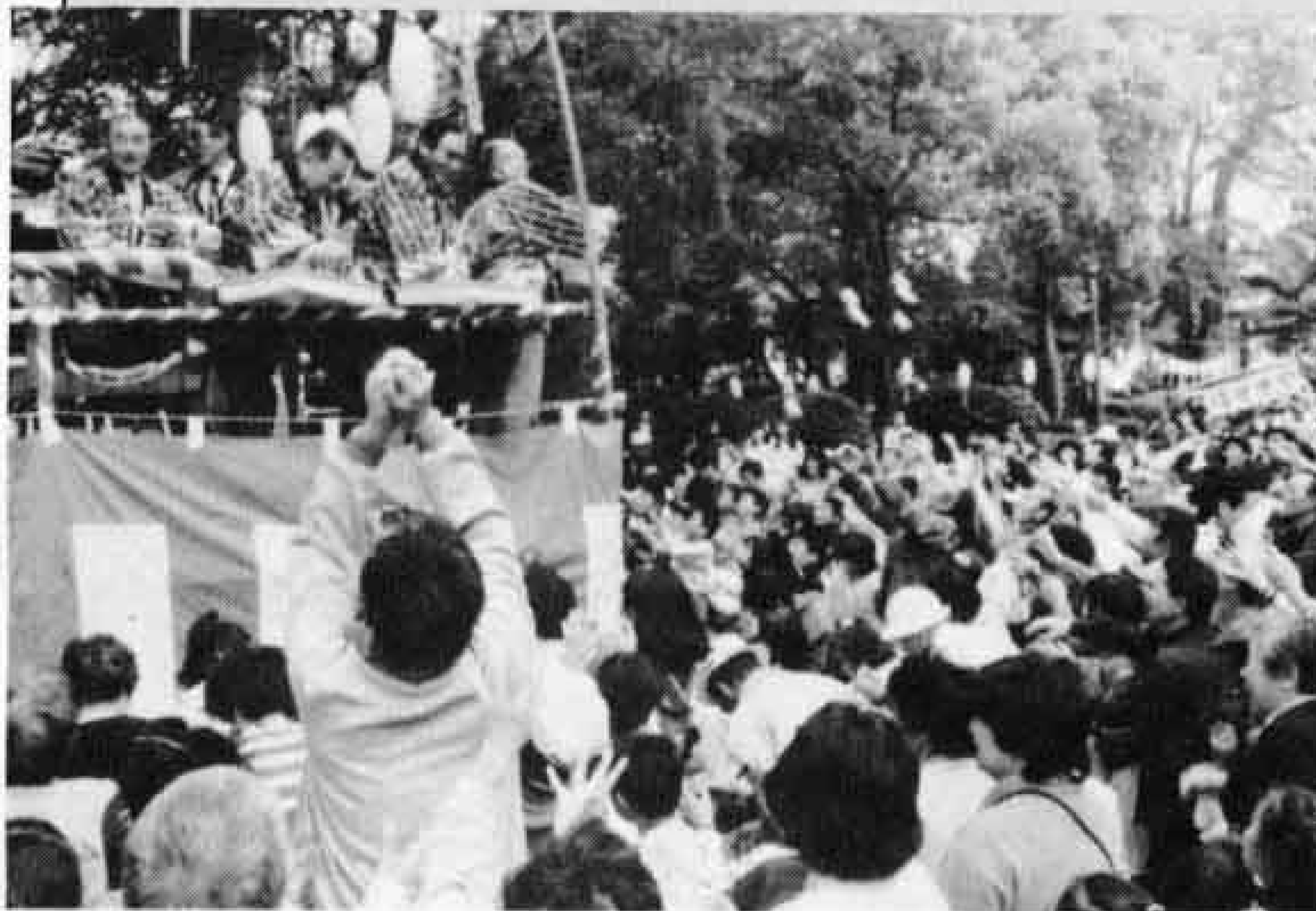
△投げもちに黒山の人だかり

青少年の郷土愛と連帯感のあるまちづくりを目指して、加島五千石の郷、富士駅北地区のまちづくり会議は、五月二日、米の宮神社を会場に「第一回かじま祭り」を行いました。 会場では、子供たちの鼓笛演奏や踊りを初め、太鼓に投げもち、子供相撲大会、町内対抗綱引きなどが催され約一万人の人出でにぎわいました。