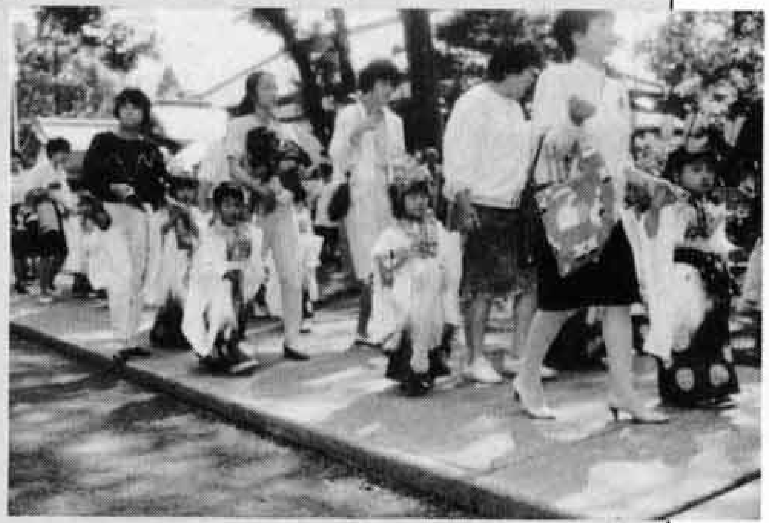
△稚児行列の後、まつりがスタート