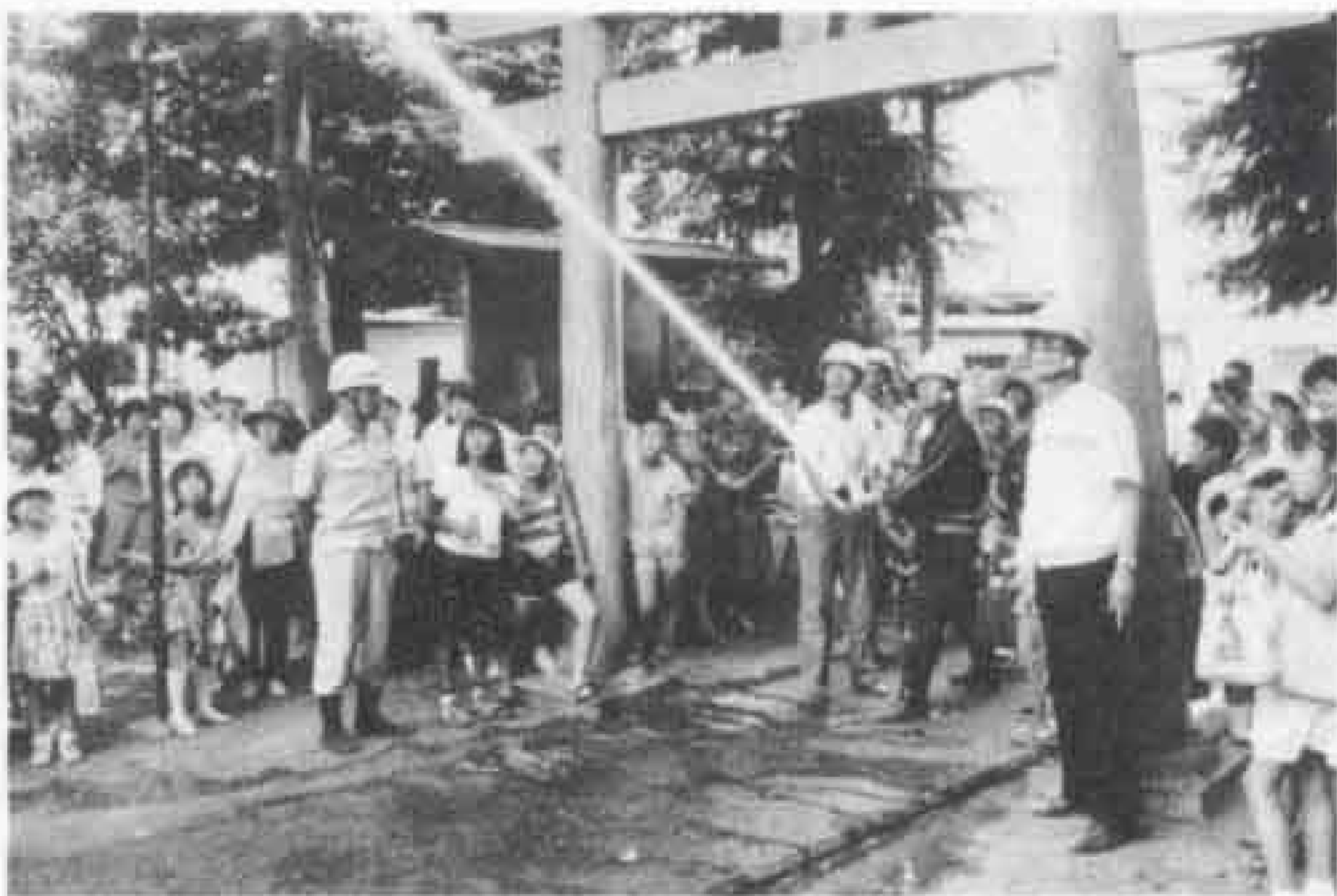
昨年9月1日の防災訓練