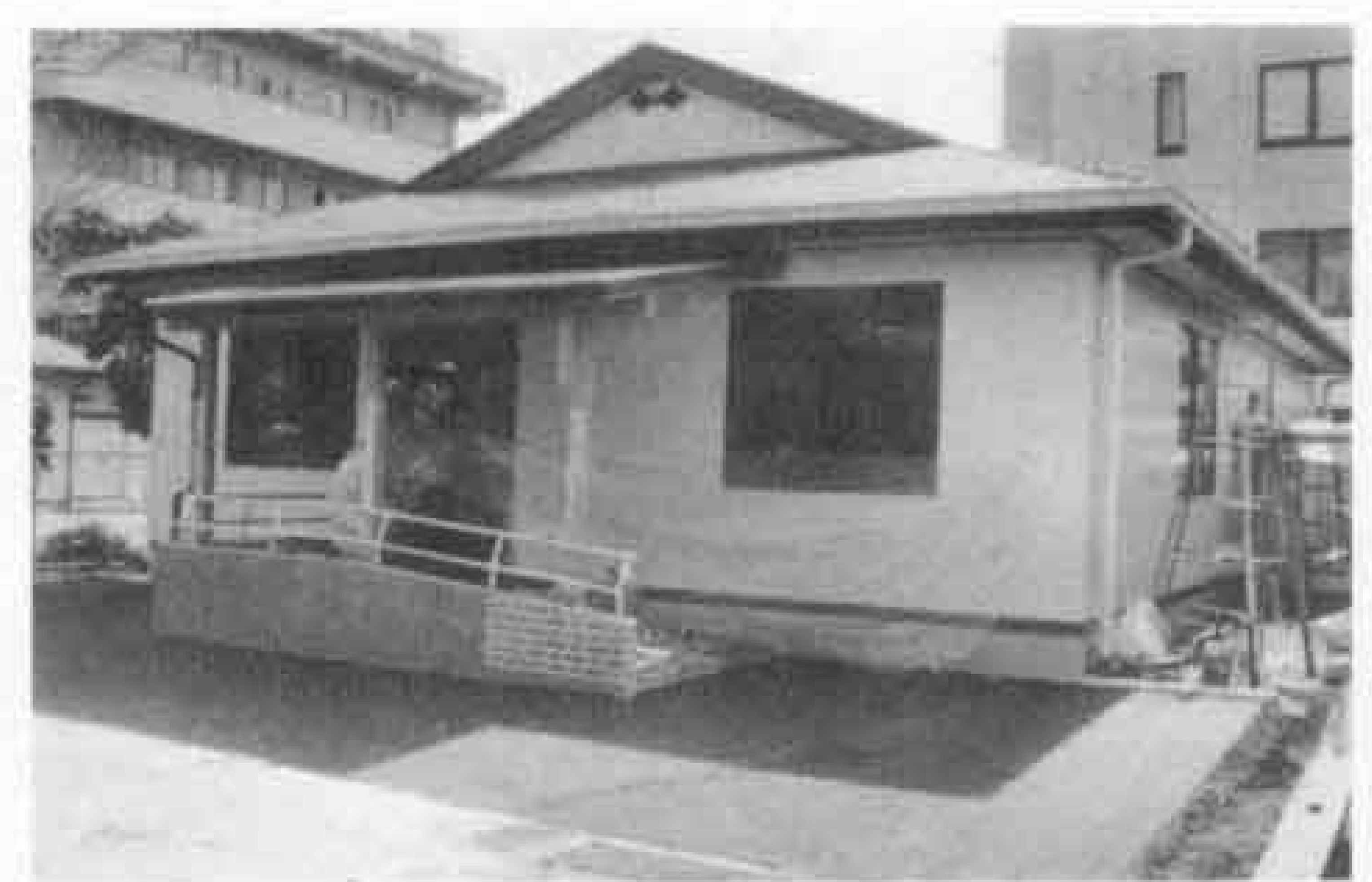
中央町に建設中の高齢者介護ホーム