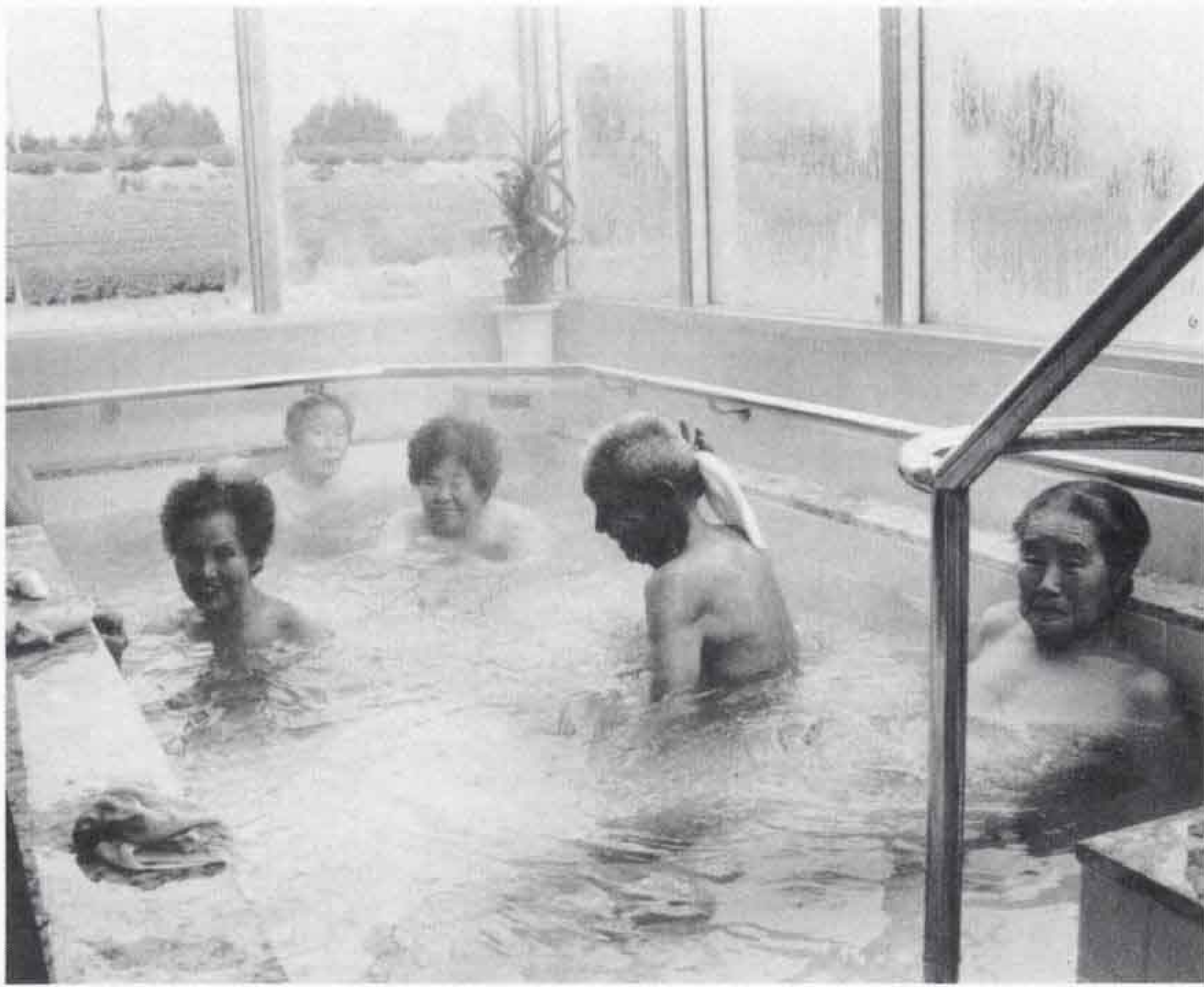
虚弱な老人のためのデイ・サービスは好評です

市長 元気なお年寄り、ゲートボールや趣味の活動をすればよいのですが、そうでない人にデイ・サービスはとても有効ですね。将来は、もっと広げたいと思っています。