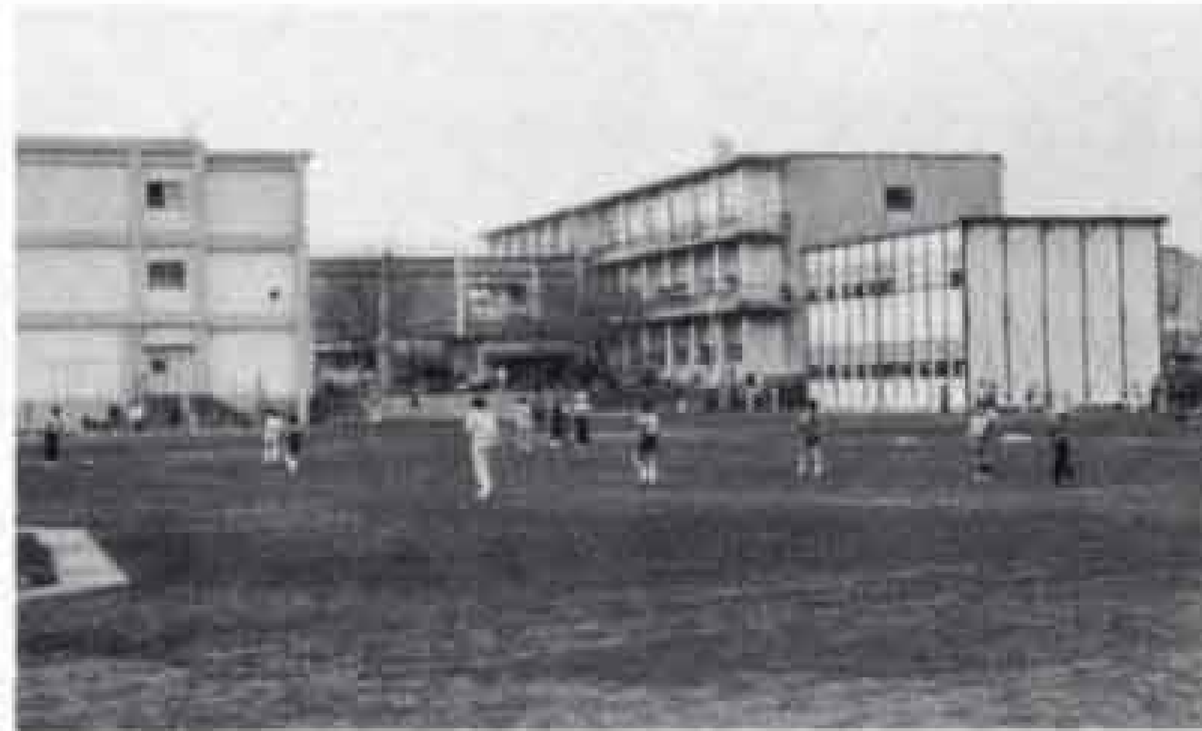
🕒 昨年3月に校庭が広がった