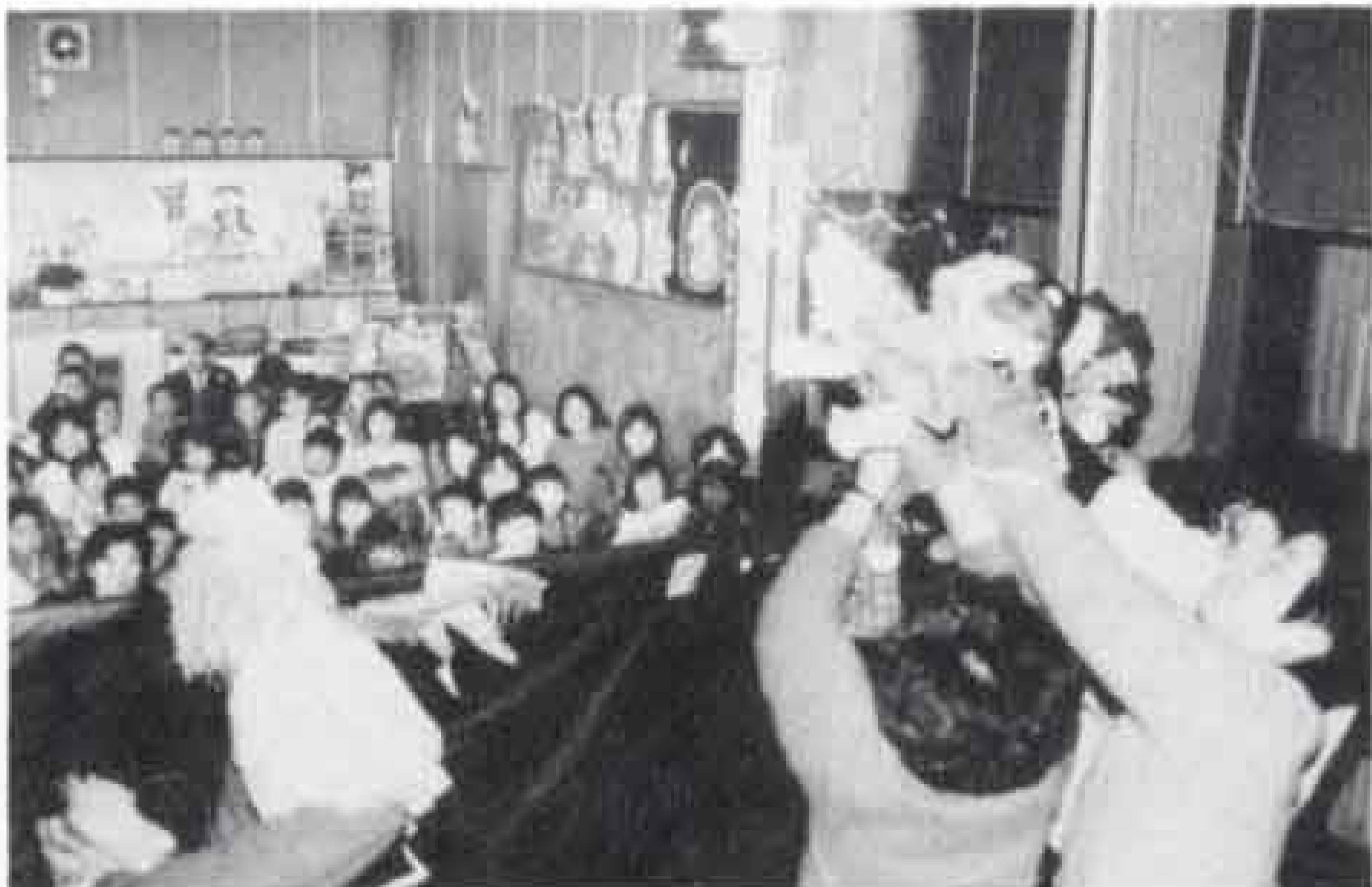
△芙蓉会の子供たちと「金のガチョウ」

まどの会は、まず自分の心の窓を開き、声をかけ合い、助け合い、互いに成長しようと大渕に生まれたグループです。