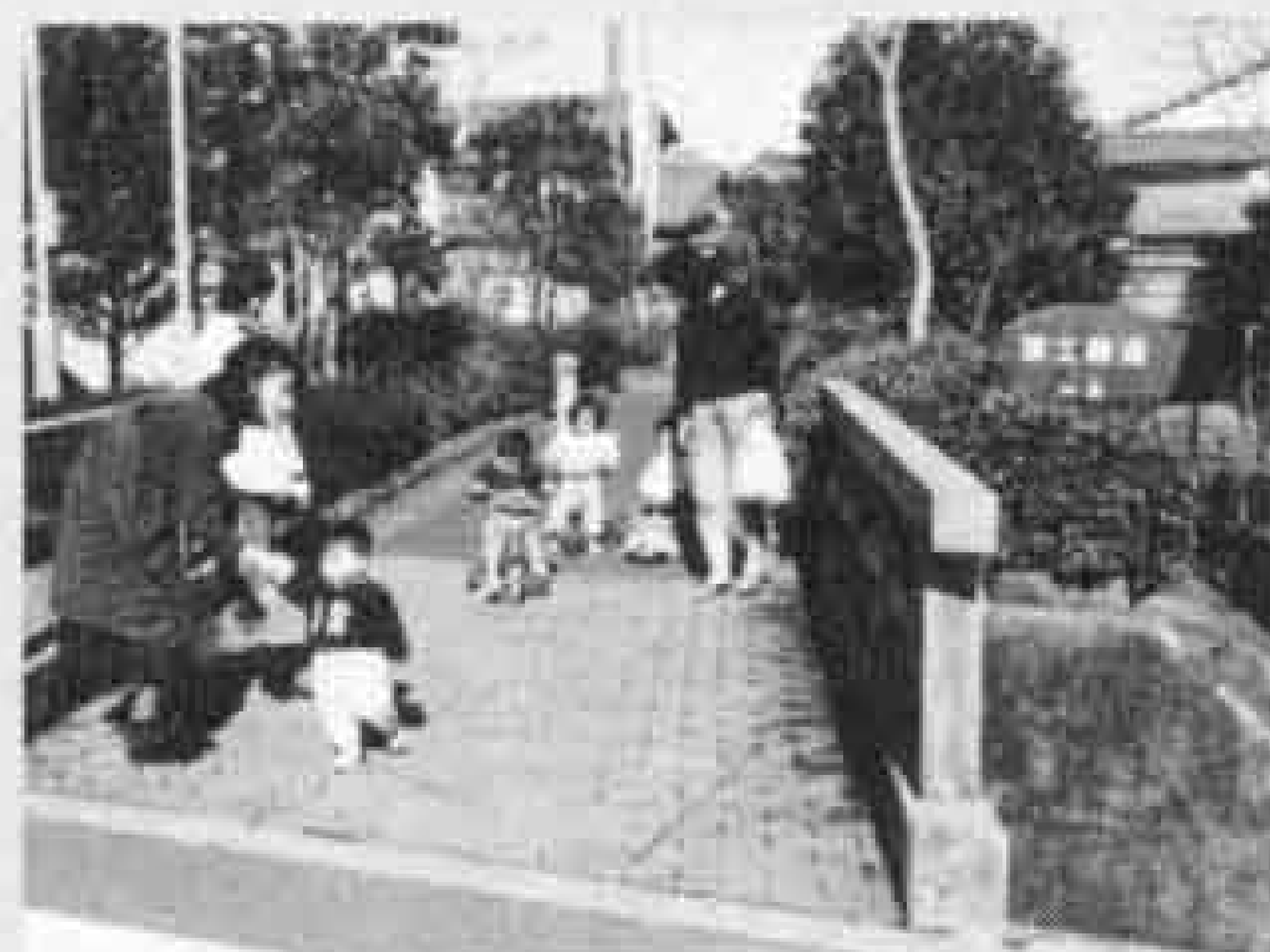
△富士緑道は中島のオアシス

中島村は古郡氏の加島新田開発によって成立した村です。中島という名称の由来は明らかではありませんが、加島平野の村々は富士川の洲にできた村ですから、中島は川の中の島という意味と思われる。