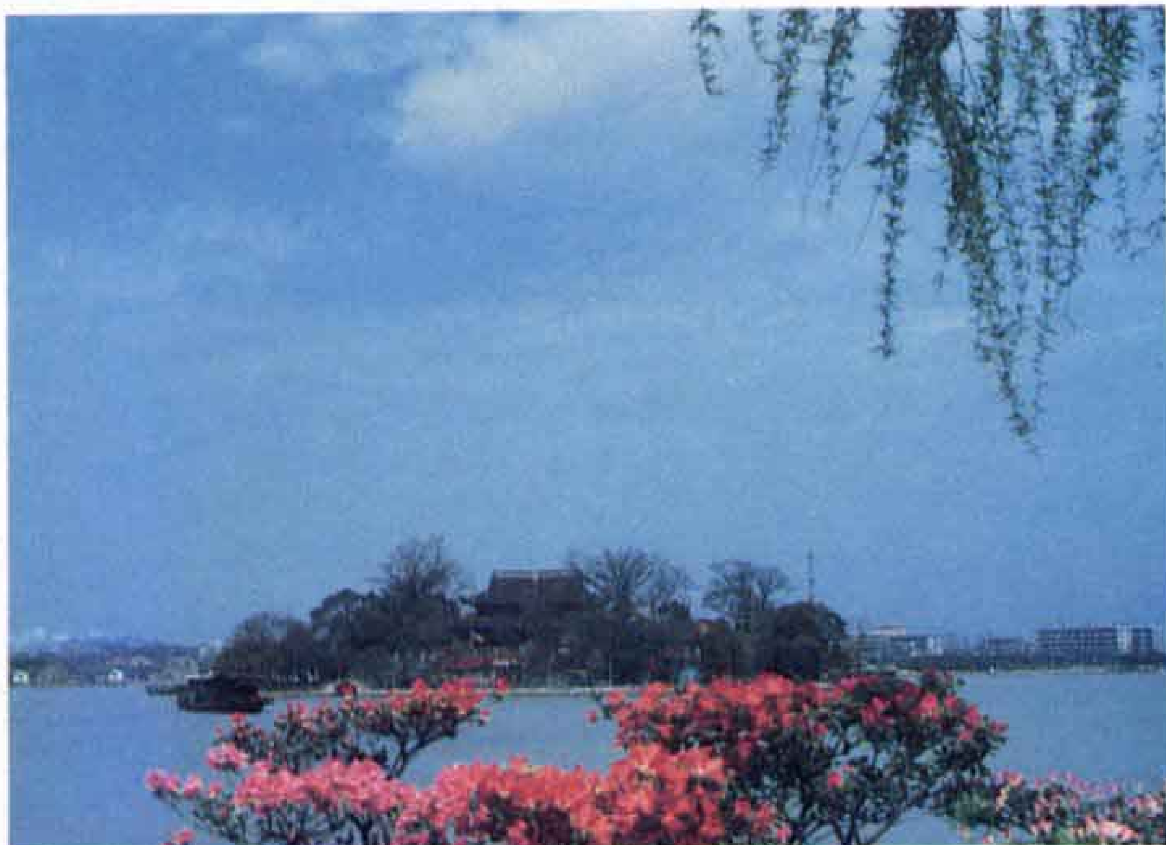
嘉興市の景勝地、南湖に浮かぶ烟雨楼