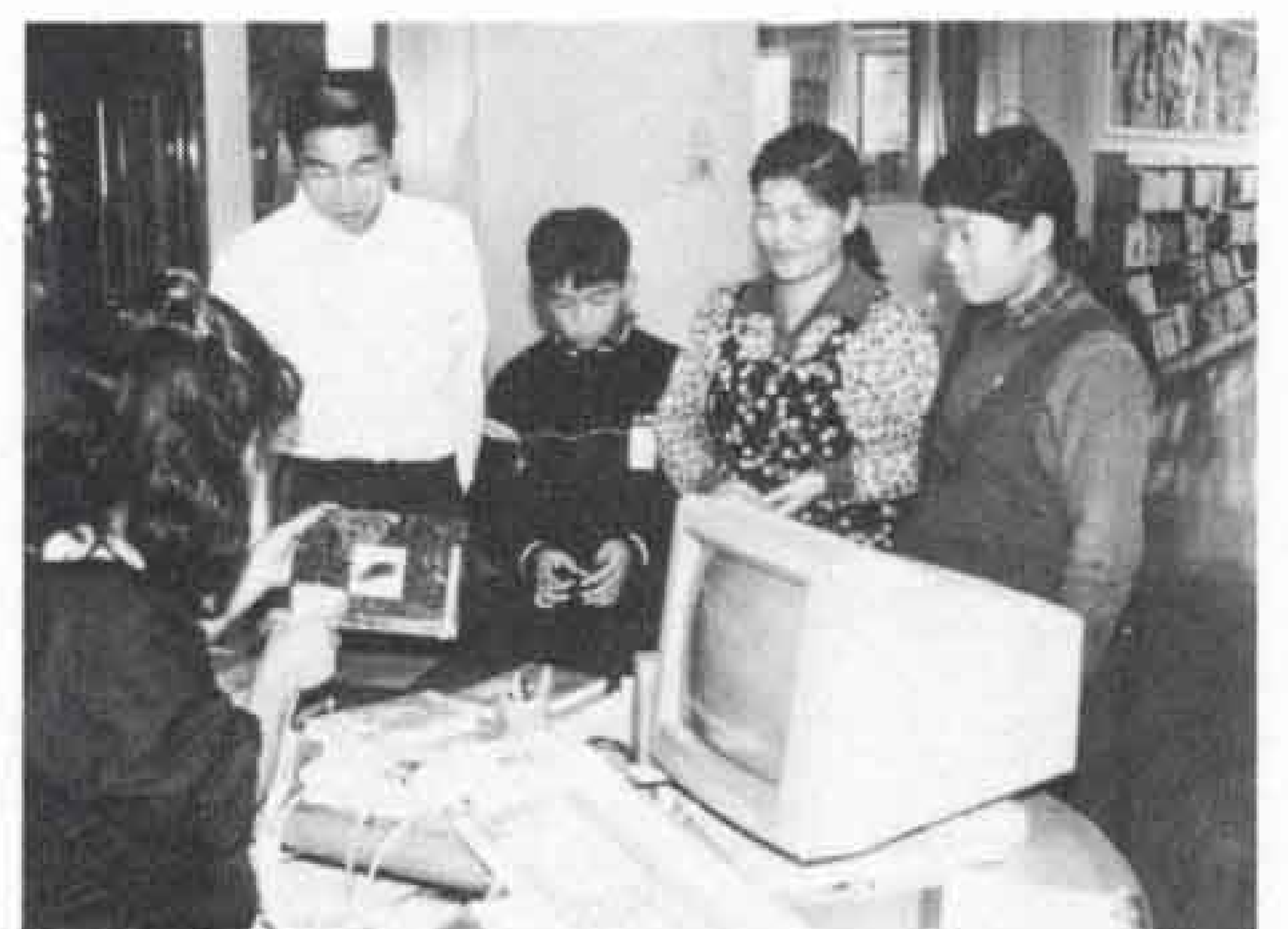
△東図書館はコンピューターで

べる人が多いと思いますが、今、その中身が変わって来ました。クラシック、ポピュラー、邦楽、民謡などの音楽と落語など千本のテープが追加されたのです。人気のあるものは、予約して少し待つこととなりますが、これからも数種類ともに充実していきます。