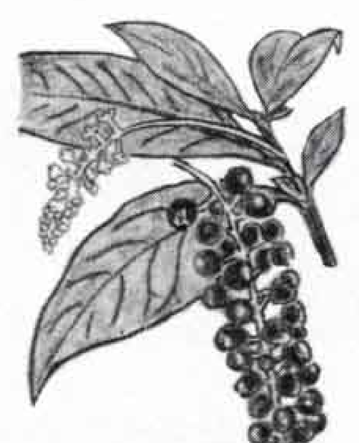
アメリカヤマゴボウ