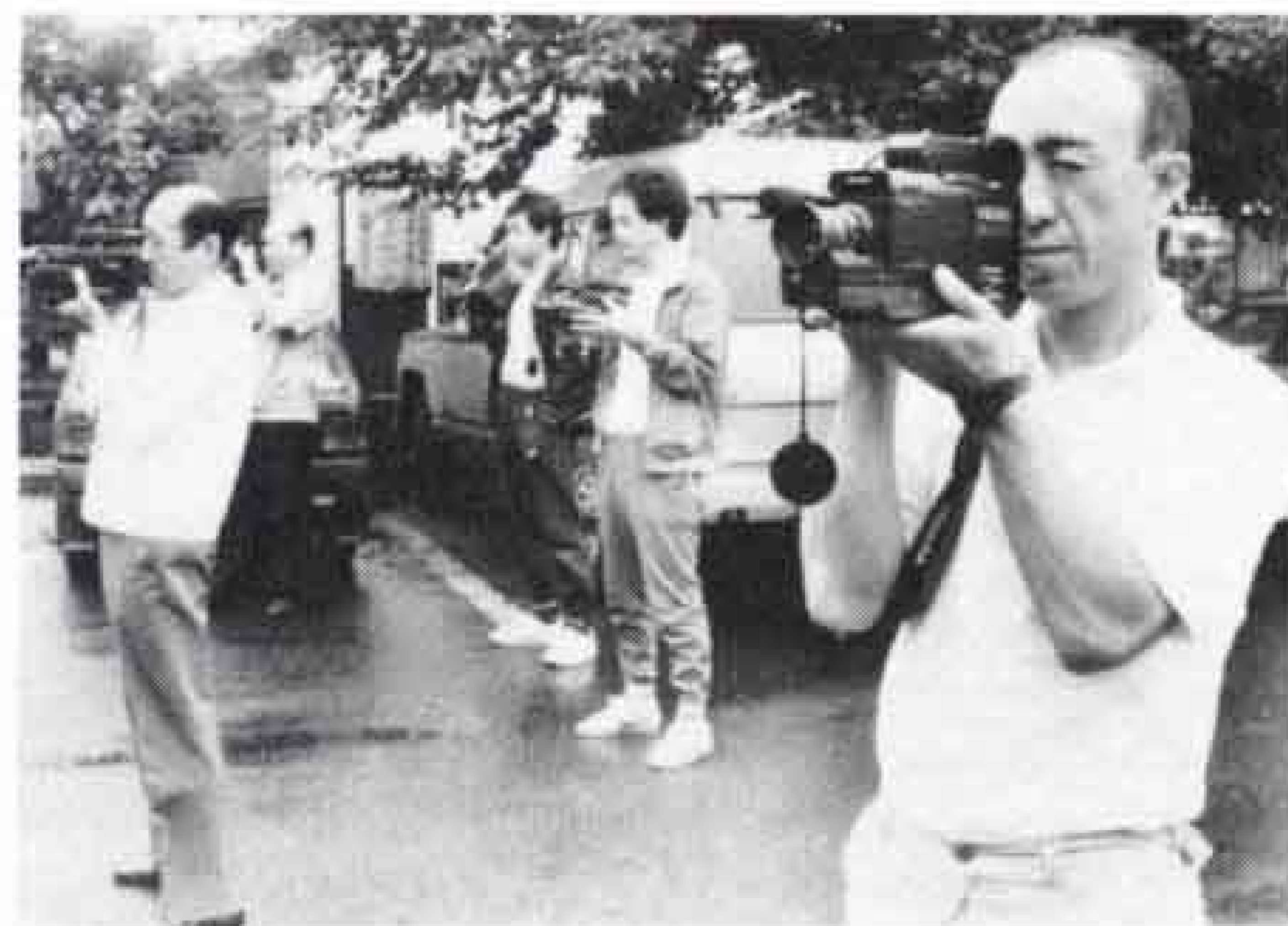
△カメラを安定させて…

冬でも水泳が楽しめる、『温水プール』の起工式が、六月二十六日、富士総合運動公園で行われました。 このプールの温水は、公園の南側にある第一清掃工場のゴミ焼却の予熱を利用してつくられます。プールの建設場所は公園内、弓道場の北側で、オープンは今年の五月ごろを予定しています。