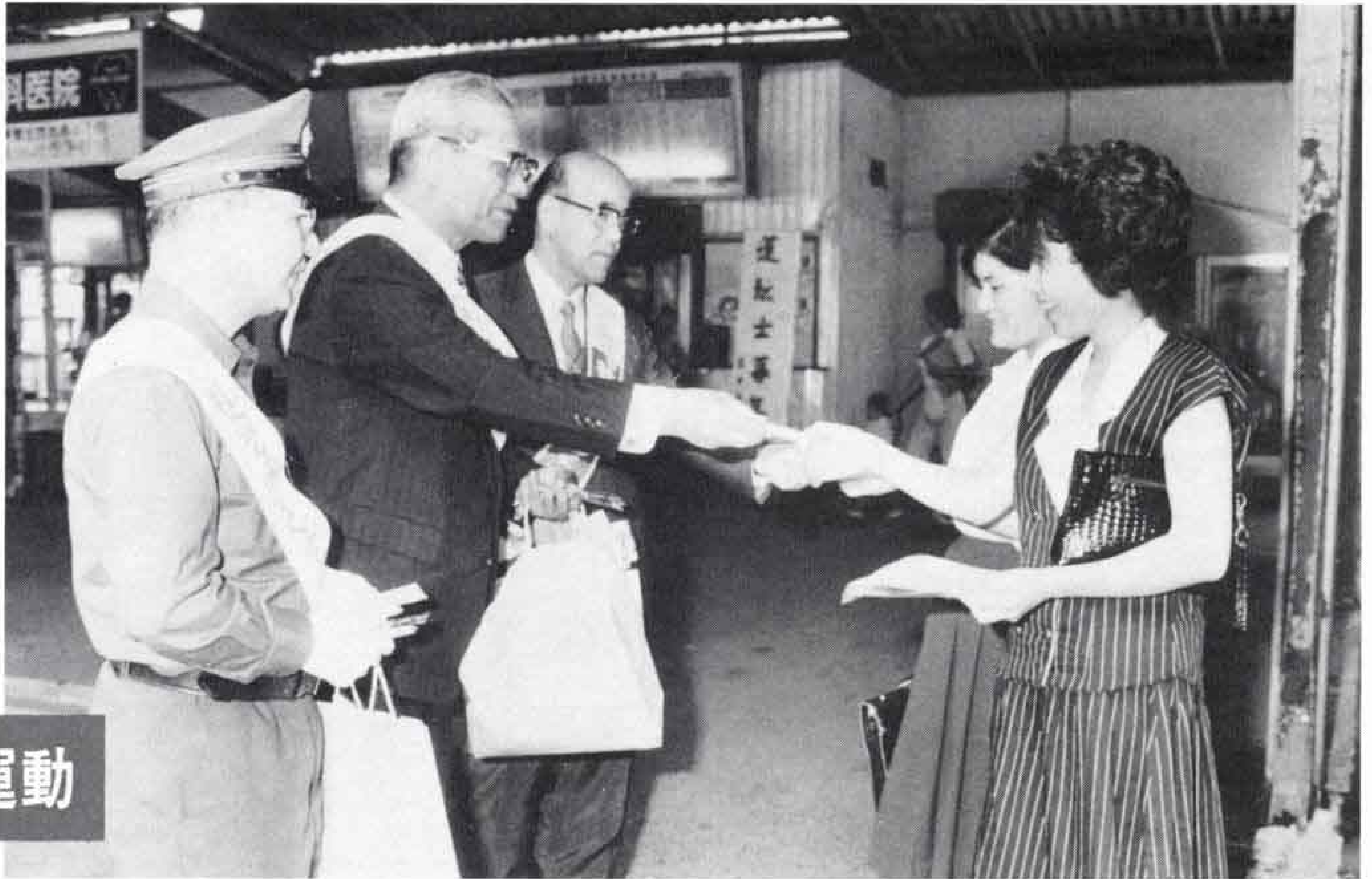
△吉原中央駅前での呼びかけ