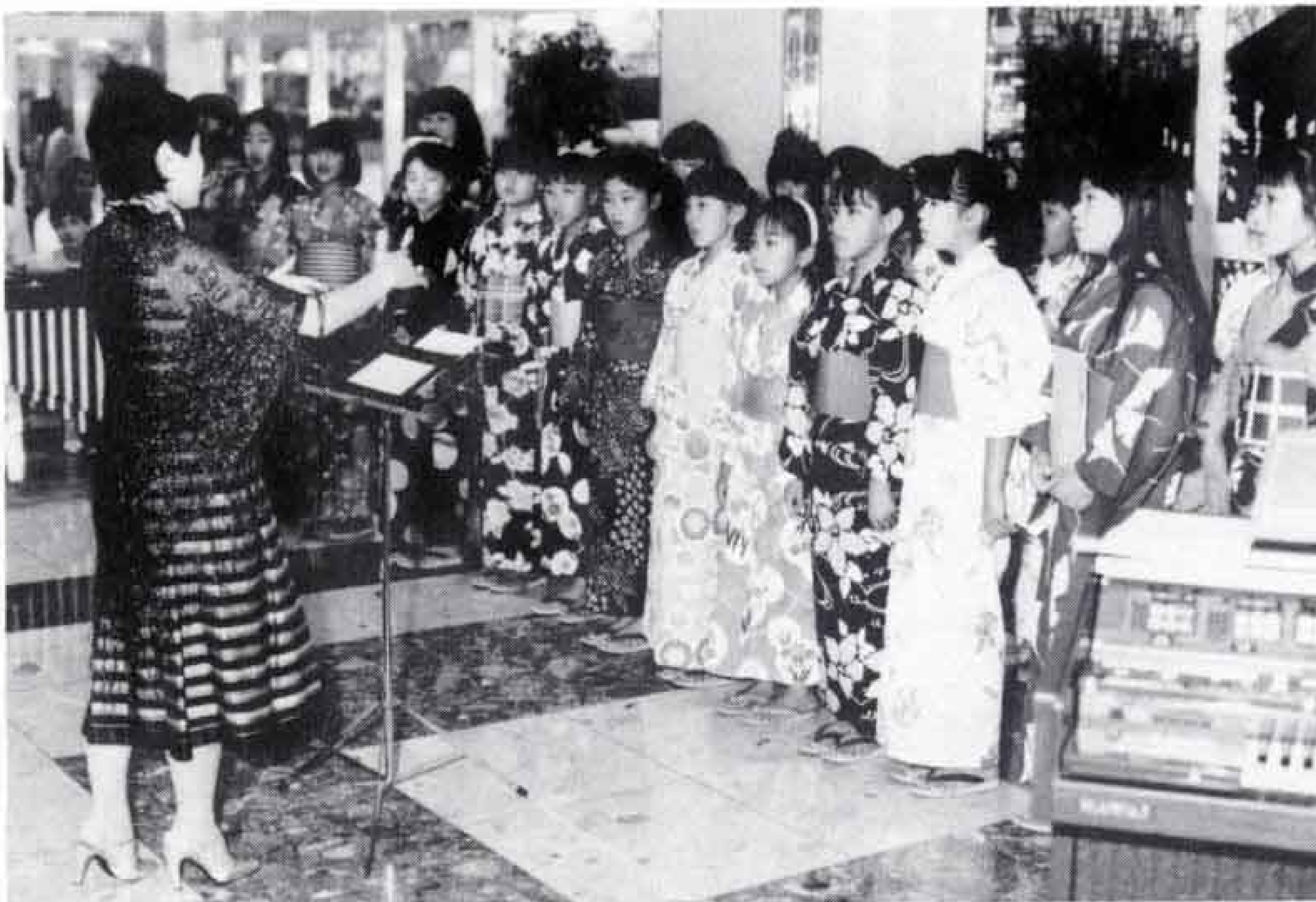
▷少年少女合唱団の皆さんも美声を披露