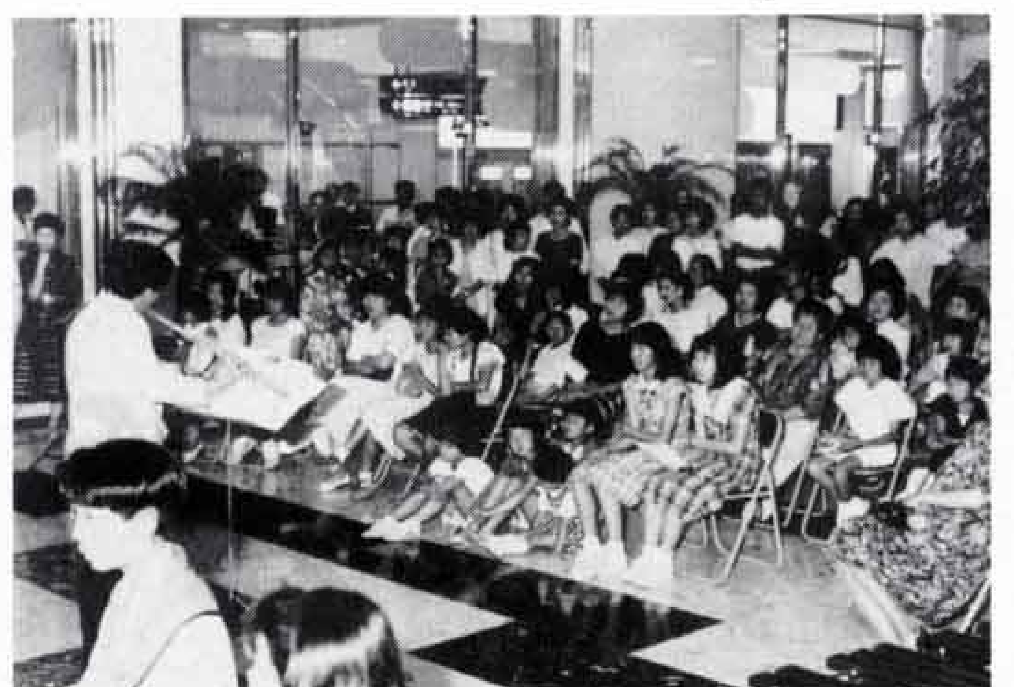
△立ち見の人が出るほど盛況

六月十八日の夕方、新富士駅に電子オルガンやマリンバ、フルートなどの演奏がこだましました。このコンサートは市内の音楽家によつて組織されているサロンコンサート実行委員会の皆さんがボランティアで出演してくれました。会場となつたステーションプラザFUJIIのステンドグラス前には多くの人が集まり、乗降客の皆さんも思わず足を止めて聞きほれていました。