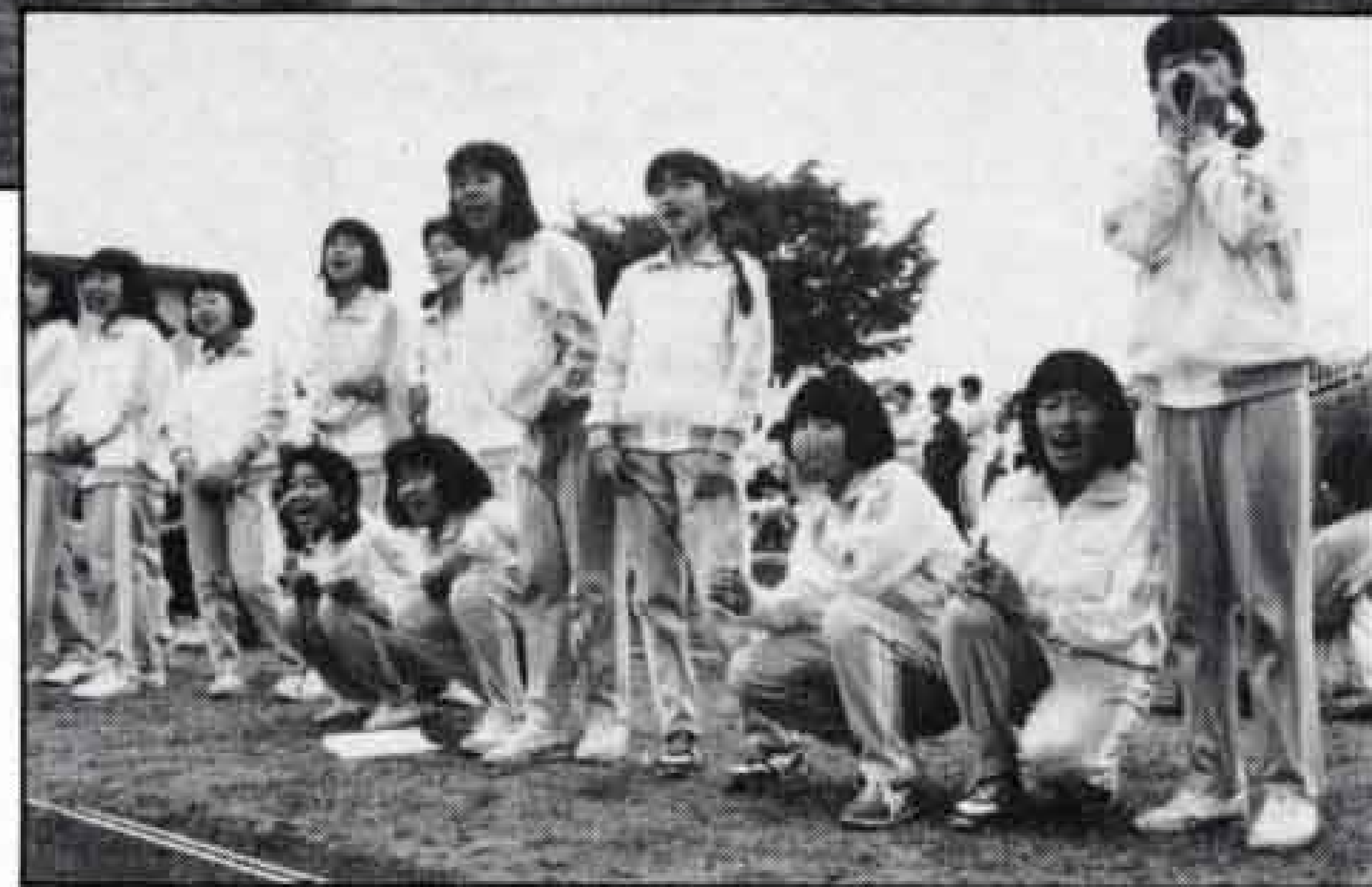
△せんぱ〜い、ファイト!

五月二十一日(日)、総合運動公園陸上競技場で「第二十二回市民陸上競技大会」が開かれました。この大会は、陸上競技の普及とレベルの向上を図ろうと毎年行われるもので、ことしも小・中学生の代表や一般選手など千二百人が参加しました。 新緑の中で始まった大会も午後からは雨。しかし、そんな悪コンディションにもかかわらず、五つの大会新記録が生まれました。