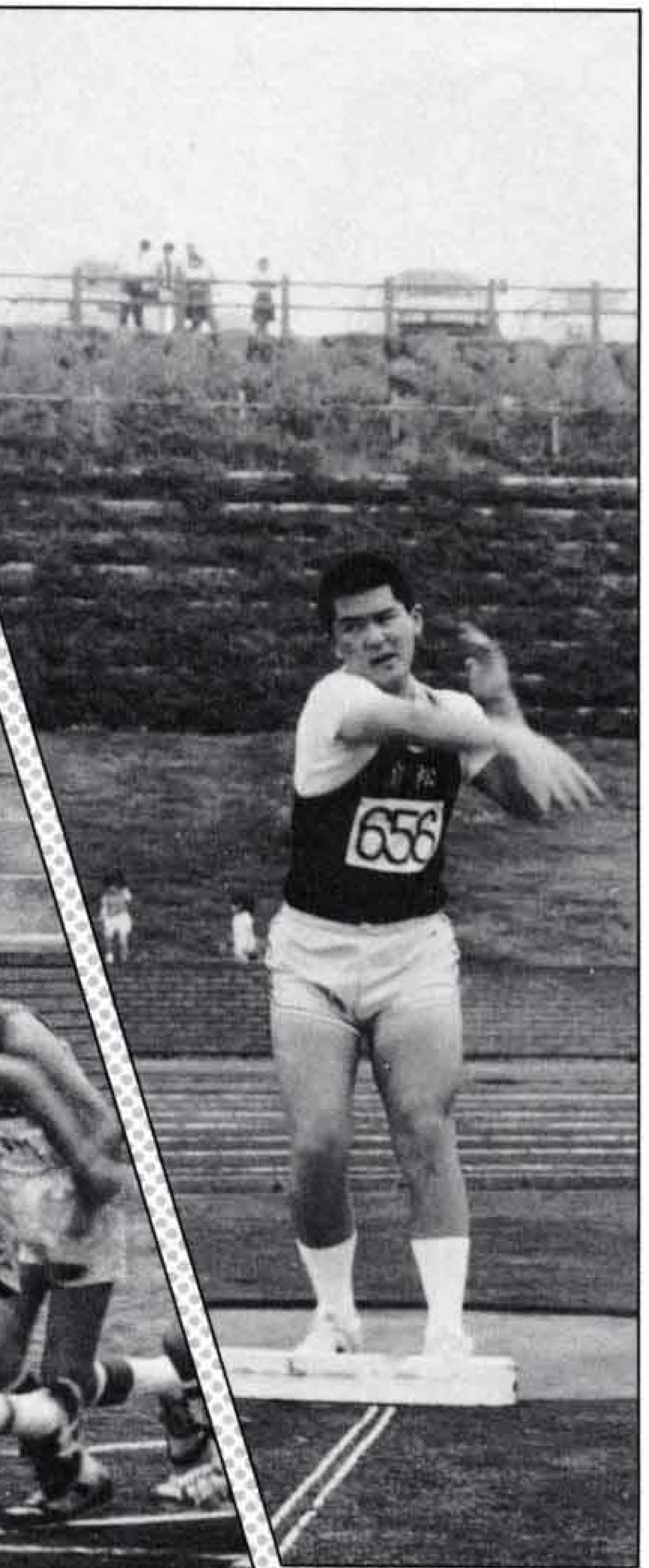
△砲丸投げは腰の回転がポイントです

五月二十一日(日)、総合運動公園陸上競技場で「第二十二回市民陸上競技大会」が開かれました。この大会は、陸上競技の普及とレベルの向上を図ろうと毎年行われるもので、ことしも小・中学生の代表や一般選手など千二百人が参加しました。 新緑の中で始まった大会も午後からは雨。しかし、そんな悪コンディションにもかかわらず、五つの大会新記録が生まれました。