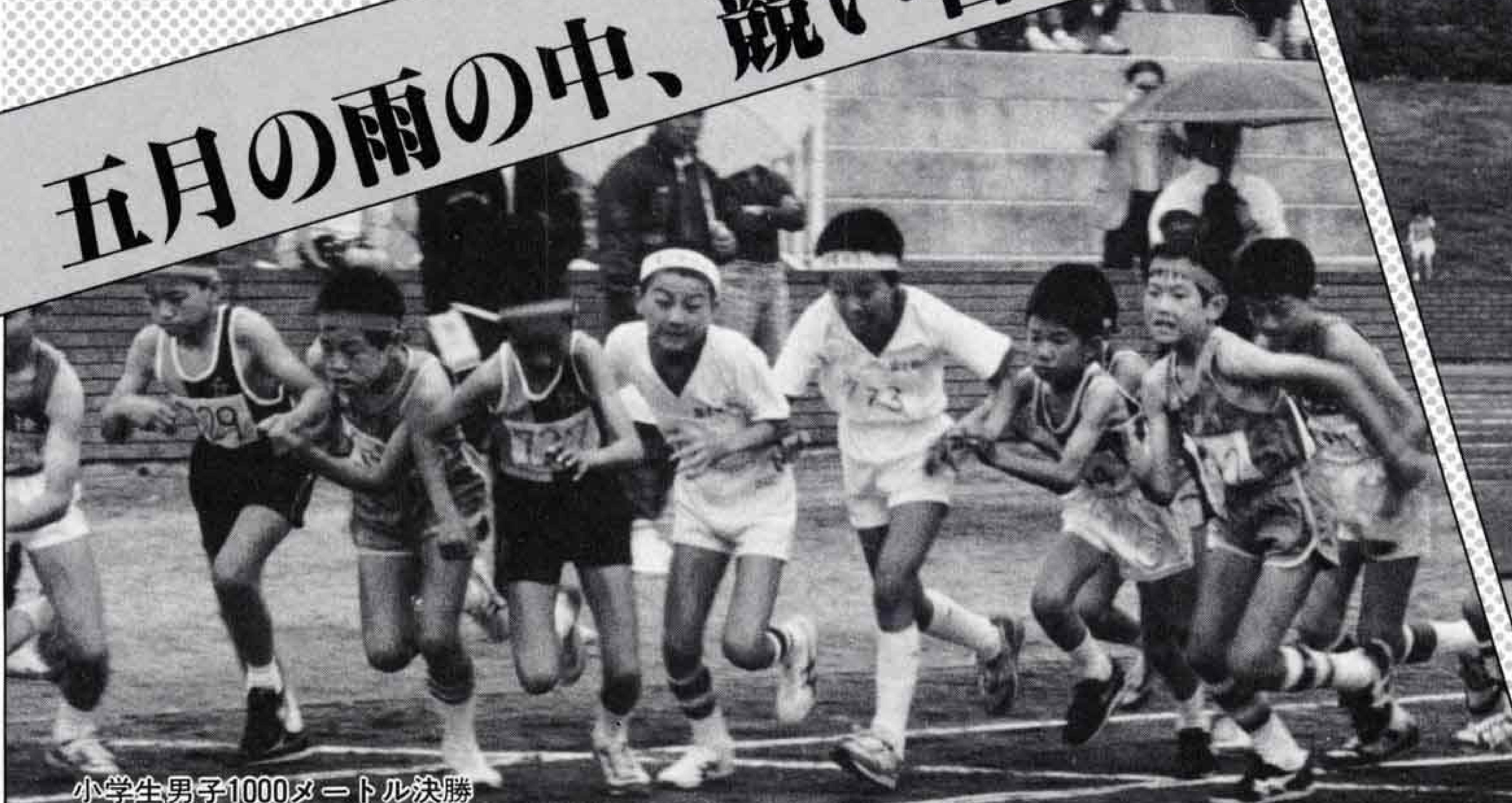
小学生男子1000メートル決勝