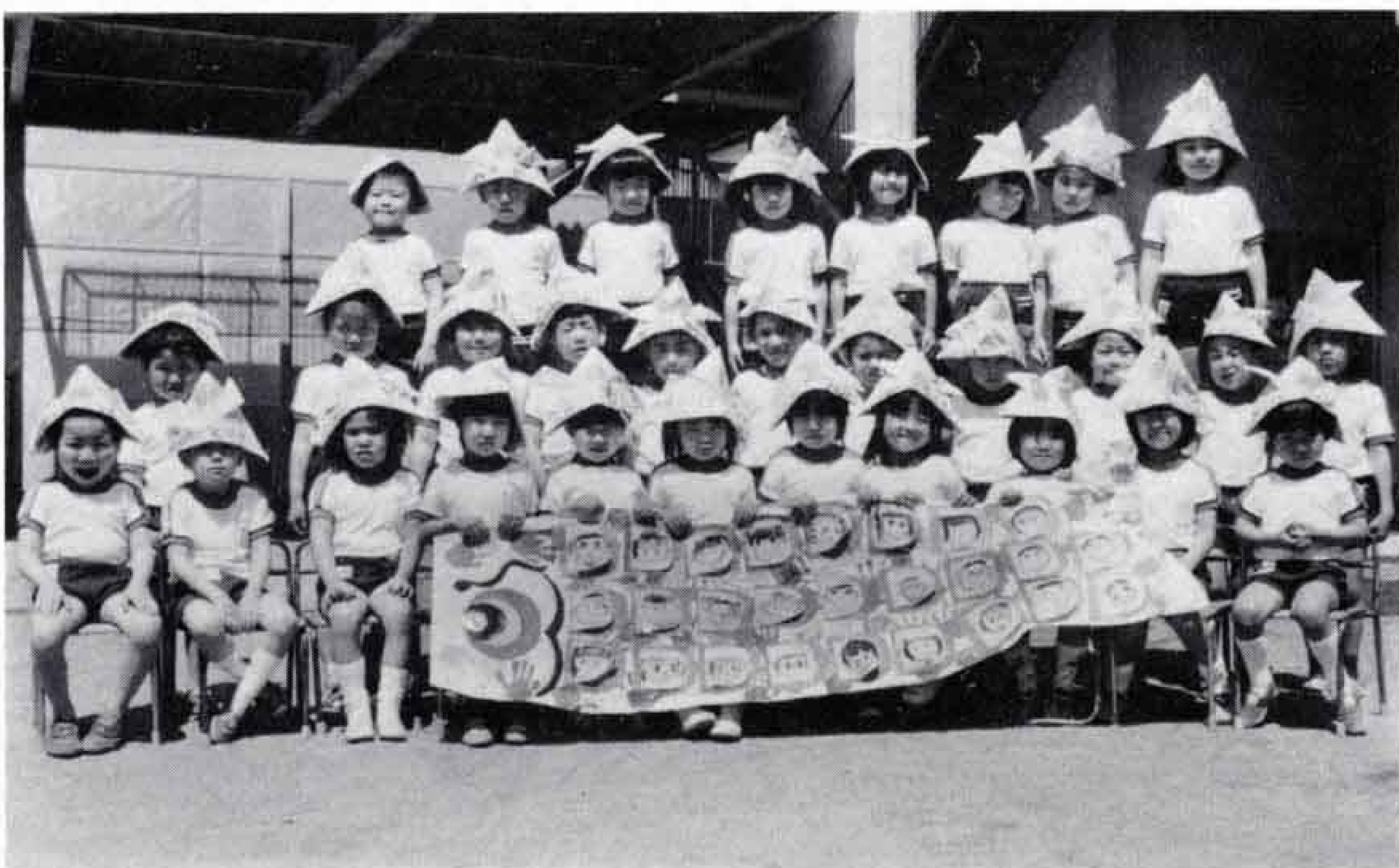
こいの体に手形を押すとき、絵の具で手や顔を汚しちゃった。ぼくたちの顔をかいたうろこをつけてでき上がり。新聞紙でかぶともつかったよ。