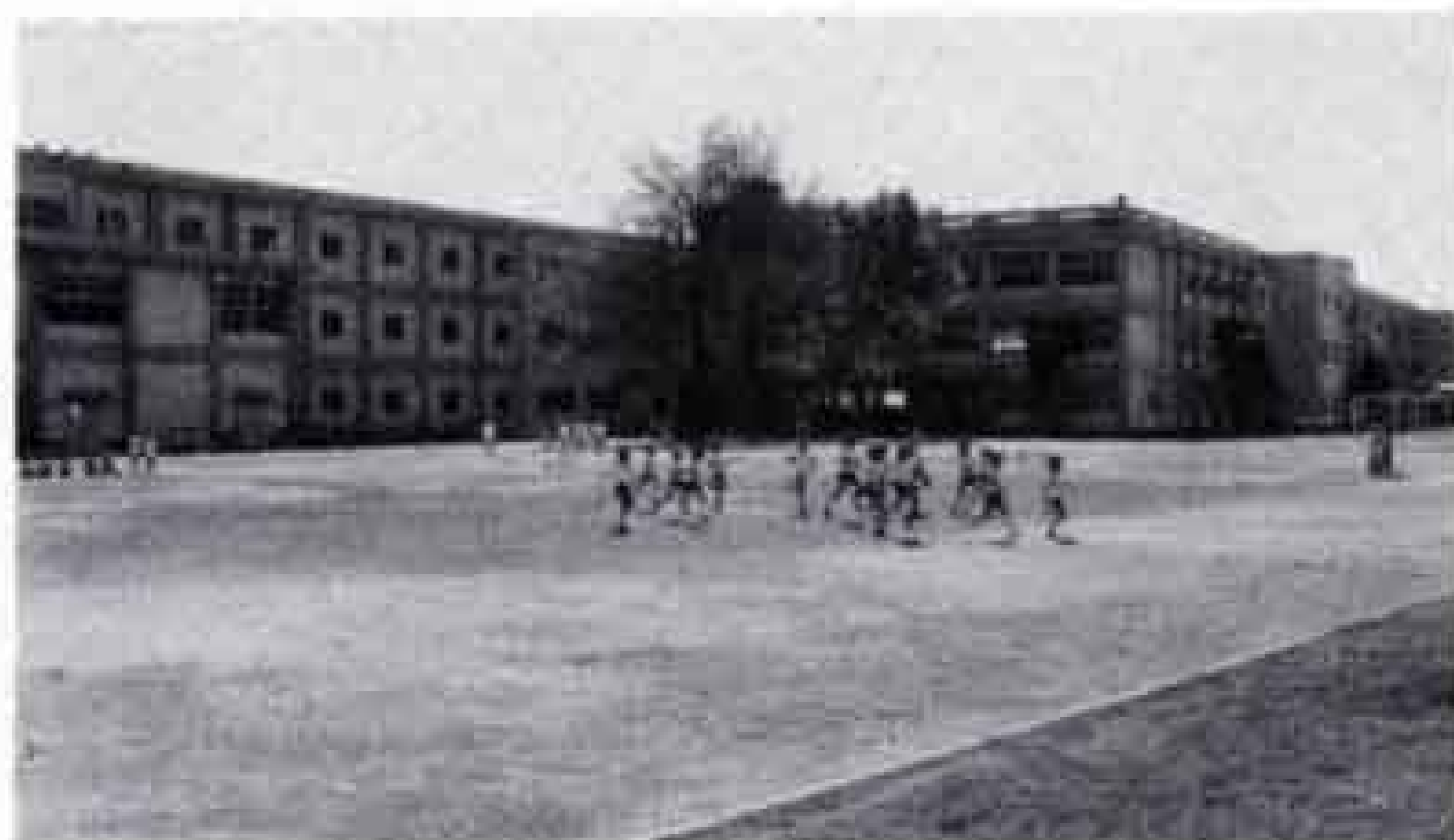
今 890人の児童が学んでいます