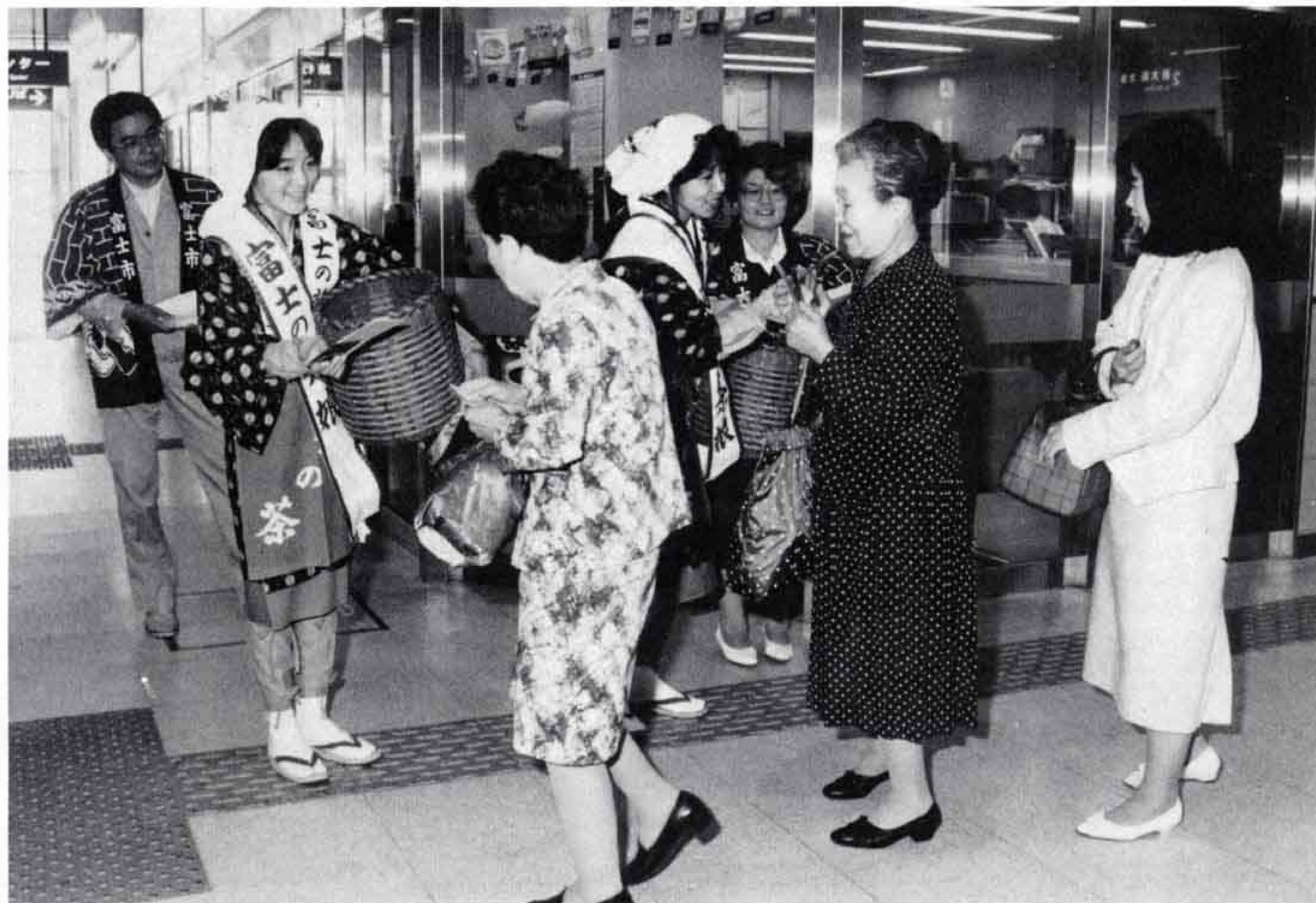
△茶娘の笑顔添えて新茶の無料配布(新富士駅)

八十八夜の五月一日、富士のやぶ北茶推進大会が富士市農協会館ホールで開かれました。大会は、富士のやぶ北茶のピーアールとよりの一層の高品質化を期して開かれたもので、茶娘の紹介や記念講演などが行われました。大会終了後、姉さんかぶりの茶娘が新富士駅と吉原中央駅に繰り出して、新茶を無料配布しました。道行く人は、思わぬプレゼントに大喜びでした。