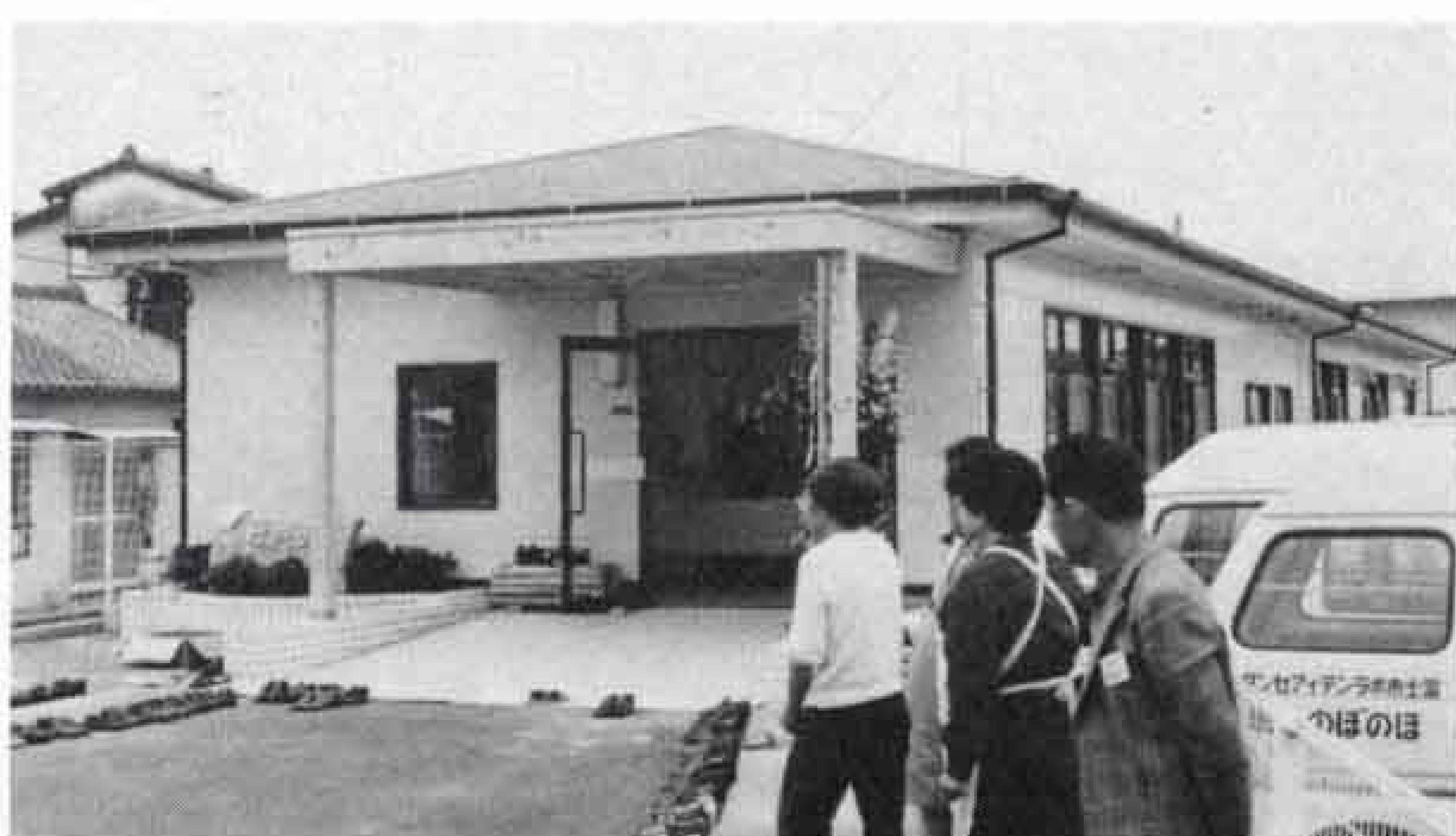
▷うすいクリーム色の建物