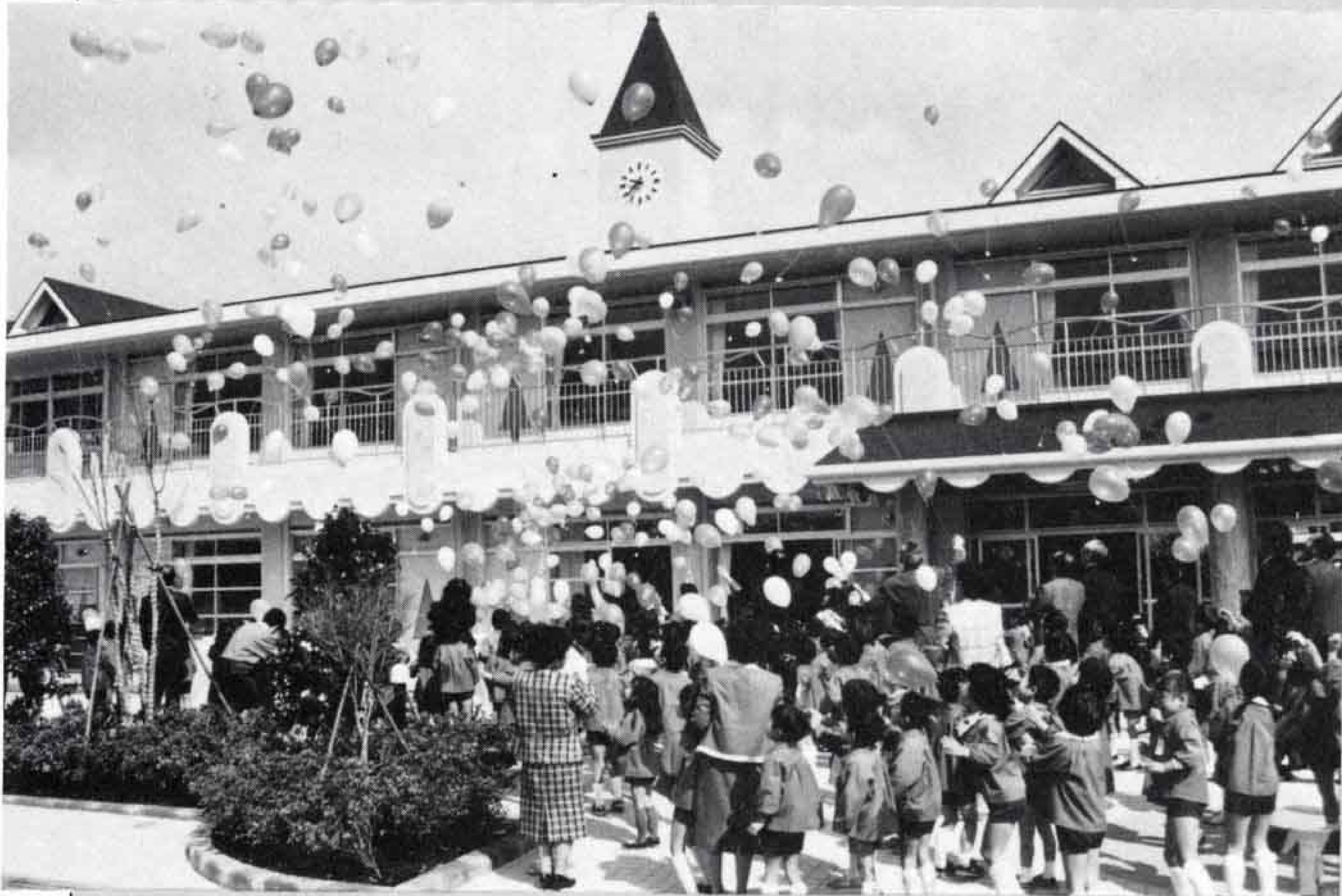
△落成を祝って行われた風船上げ