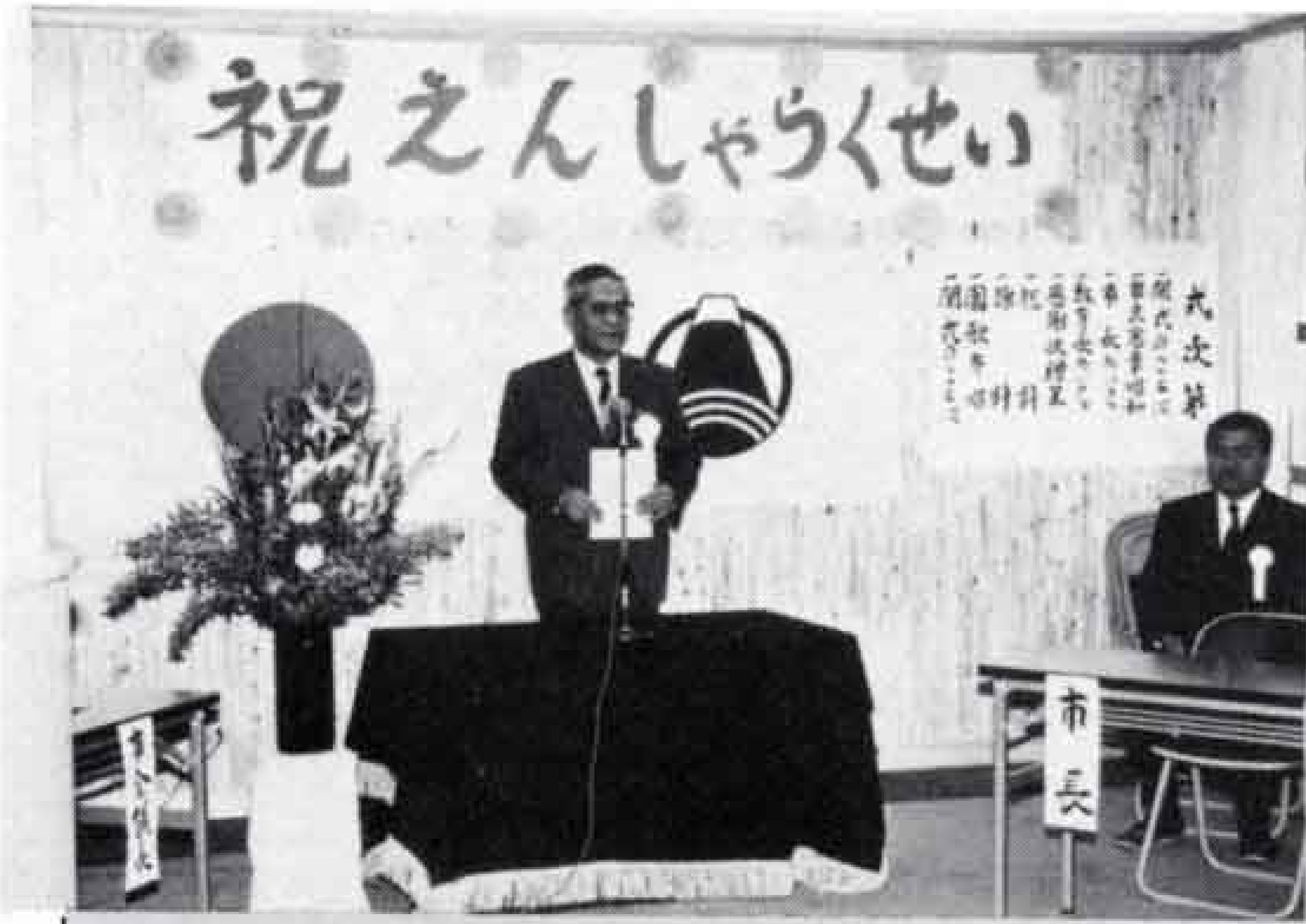
△木の香りのする部屋で落成式(3月27日)

昭和幼稚園（比奈）の新園舎が完成しました。 レンガ色のとんがり帽子に時計台のついた外観は、さながらおとぎ話の家のように。室内は自然光をうまく取り入れて明るく、内装には温かみのある木がふんだんに使われています。一階と二階にオープンスペースを設けるなど、ゆとりのある設計がされています。